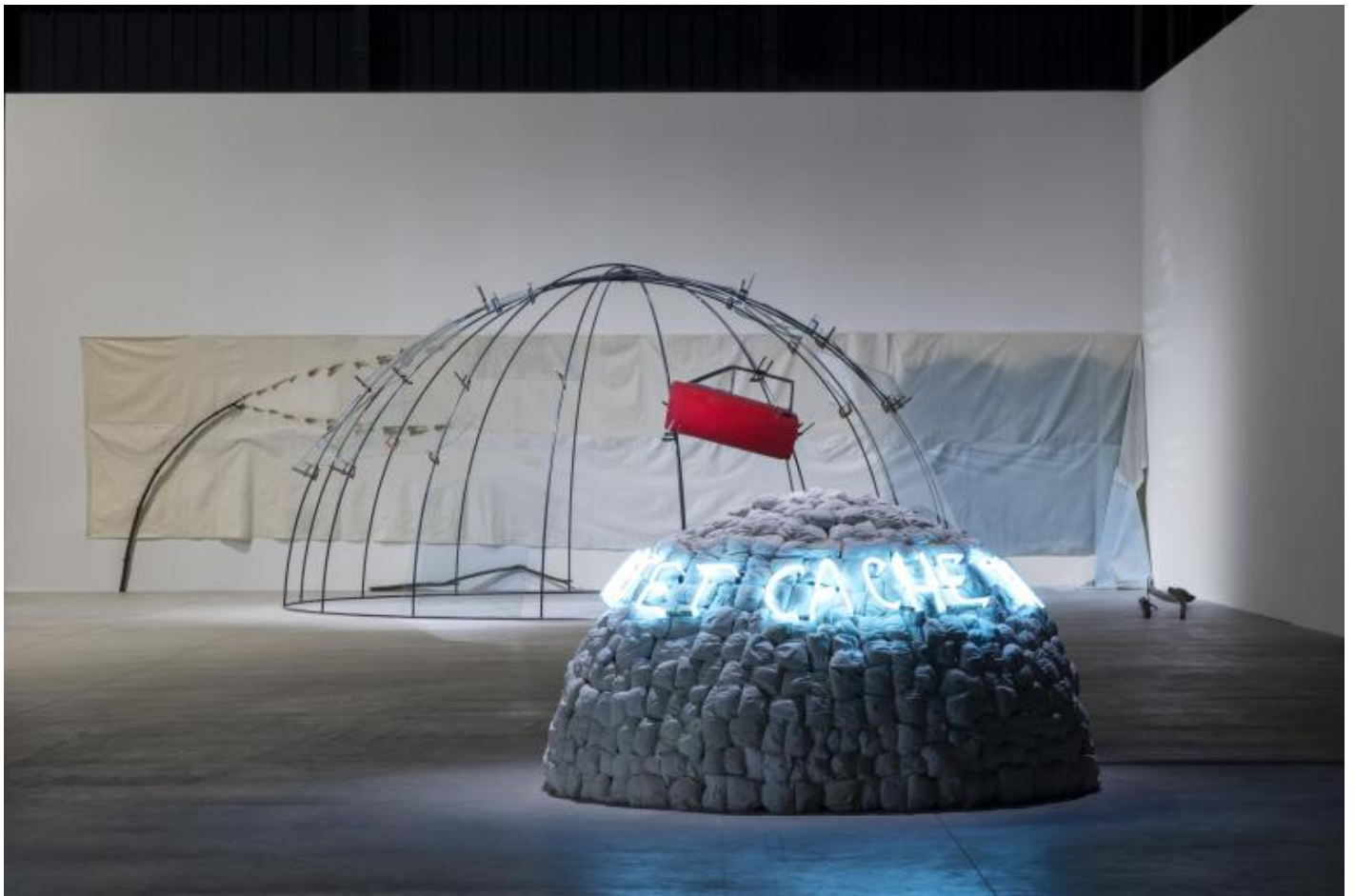
Mario Merz, "Igloos", veduta della mostra, Pirelli HangarBicocca, Milano, 2018. Courtesy Pirelli HangarBicocca, Milano Foto: Renato Ghiazza © Mario Merz, by SIAE 2018.

L'igloo apre una strada nuova, in cui finalmente concretizzare un'arte fatta di relazione con lo spazio, dove la provvisorietà diviene utopia tradotta in materia. Le forme spiraleggianti, che trovano corrispondenza nella morfologia naturale, abitano l'immaginario di Merz e lo guidano dalla carta all'installazione, traghettando la sua ricerca verso un territorio di opportunità inesplorate. La spirale, che contiene in sé la progressione numerica di Fibonacci (oggetto di indagine che verrà introdotta nelle opere a partire dal 1970), si traduce nella circolarità dell'igloo, una forma abitativa che vive di una felice coincidenza degli opposti: l'igloo stesso è una situazione in sospeso, in quanto come oggetto è in sospeso, i materiali stessi sono in sospeso. (G. Celant, Intervista , Genova, 10 marzo 1971, in Mario Merz , Mazzotta, Milano, 1983). Igloo come luogo che ripara ma si apre all'esterno, riparo stabile ma anche abitazione mobile, forma leggera ma architettonicamente perfetta e autoportante, monumento effimero. La scritta al neon, realizzata riproducendo la grafia dell'artista, invita lo spettatore a girare attorno all'asse dell'igloo, un esercizio di attenzione che richiama pratiche meditative e suggestioni orientali, un immaginario che dagli anni '60 aveva investito la cultura e la controcultura europee.