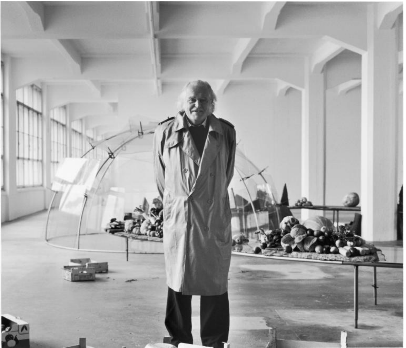
Mario Merz a Schaffhausen (CH)

La faccia di Mario Merz è una faccia tragica, antica. Guardando le sue foto, si possono facilmente rintracciare in quei lineamenti rocciosi l'energia che corre nelle sue opere, una forza originaria che ha a che fare con l'acqua, il fulmine, la zolla di terra che si spacca. È il viso di uno scienziato che ha scelto l'arte come forma di interpretazione del mondo, pur mantenendo un approccio fenomenologico all'esistente. Figlio di un ingegnere e di una insegnante di musica, Merz è un artista votato al fare, se vogliamo di ascendenza leonardesca, che costruisce una piattaforma linguistica attraverso la quale far incontrare lo spazio antropologico e lo spazio architettonico.