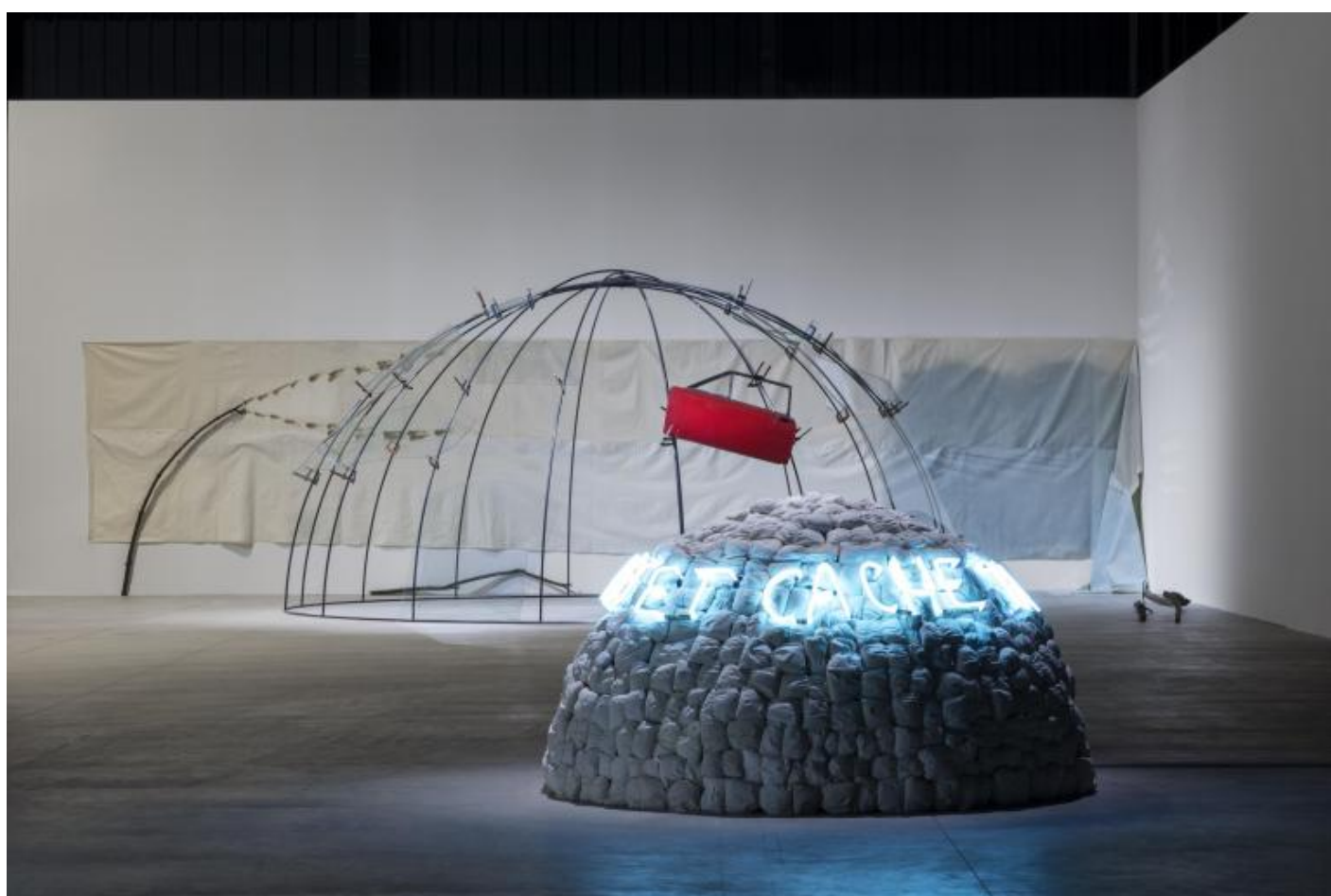
Mario Merz, "Igloos", veduta della mostra, Pirelli HangarBicocca, Milano, 2018. Courtesy Pirelli HangarBicocca, Milano Foto: Renato Ghiazza © Mario Merz, by SIAE 2018.

L'igloo apre una strada nuova, in cui finalmente concretizzare un'arte fatta di relazione con lo spazio, dove la provvisorietà diviene utopia tradotta in materia. Le forme spiraleggianti, che trovano corrispondenza nella morfologia naturale, abitano l'immaginario di Merz e lo guidano dalla carta all'installazione, traghettando la sua ricerca verso un territorio di opportunità inesplorate. La spirale, che contiene in sé la progressione numerica di Fibonacci (oggetto di indagine che verrà introdotta nelle opere a partire dal 1970), si traduce nella circolarità dell'igloo, una forma abitativa che vive di una felice coincidenza degli opposti: "L'igloo stesso è una situazione in sospeso, in quanto come oggetto è in sospeso, i materiali stessi sono in sospeso" (G. Celant, Intervista , Genova, 10 marzo 1971, in Mario Merz , Mazzotta, Milano, 1983). Igloo come luogo che ripara ma si apre all'esterno, riparo stabile ma anche abitazione mobile, forma "leggera" ma architettonicamente perfetta e autoportante, monumento effimero. La scritta al neon, realizzata riproducendo la grafia dell'artista, invita lo spettatore a girare attorno all'asse dell'igloo, un esercizio di attenzione che richiama pratiche meditative e suggestioni orientali, un immaginario che dagli anni '60 aveva investito la cultura e la controcultura europee.