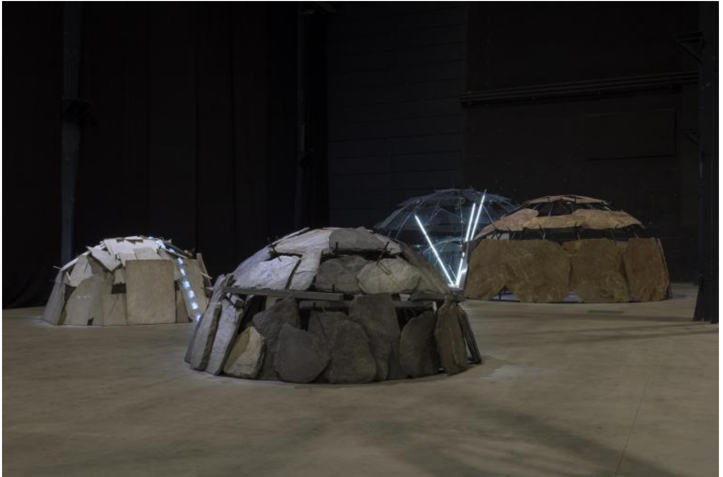
Mario Merz, “Igloos”, veduta della mostra, Pirelli HangarBicocca, Milano, 2018. © Mario Merz, by SIAE 2018

Nel suo tentativo di tracciare una “cartografia nomade”, Merz si imbatte nella forma ancestrale dell’igloo, in cui individuerà il paradigma dell’abitare, la “casa archetipica”, secondo la sua stessa definizione, un forma primaria di assoluto interesse, un modulo su cui continuerà a investigare nel corso dei decenni; in pittura, porterà avanti una figurazione caratterizzata da un simbolismo selvaggio, dove animali, piante, oggetti, figure si susseguiranno in una vertigine metamorfica. Un flusso continuo la sua produzione, animata da una pulsione che nel lavoro installativo trova una regola e che nella pittura sfocia invece in un dramma rappresentativo che la rende esasperata e, in alcuni passaggi, titanica.