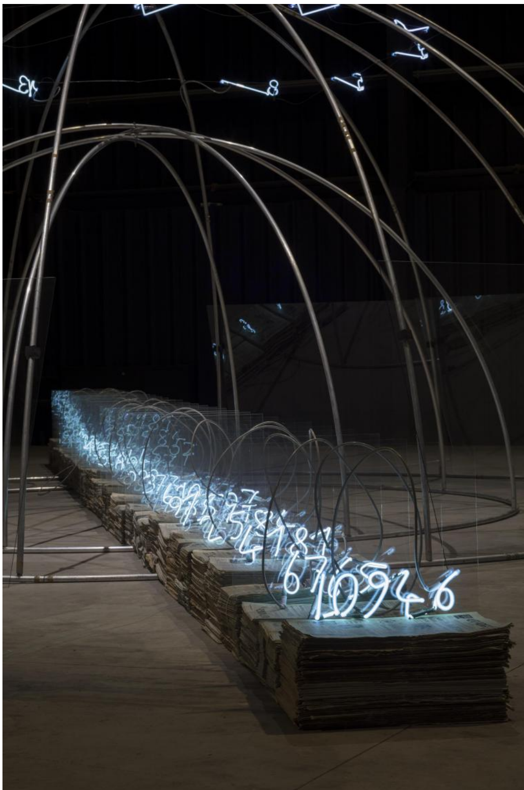
Mario Merz Senza titolo, 1985 Veduta dell'installazione, Fondazione Merz, Torino, 2009 © Mario Merz, by SIAE 2018

Sul rapporto tra Merz e l'architettura è stato scritto molto, ed è evidente, osservando la distesa degli igloo che punteggiano le navate altissime, quasi ecclesiali dell'Hangar, come il punto del suo operare non sia mai una riflessione sul linguaggio in sé, quanto piuttosto ciò che sta dentro un'architettura, un tentativo di porre di nuovo attenzione al contenuto rispetto al contenitore, come nel caso dell'installazione della serie di Fibonacci presso l'interno elicoidale del Guggenheim Museum di New York in occasione della mostra del 1971.