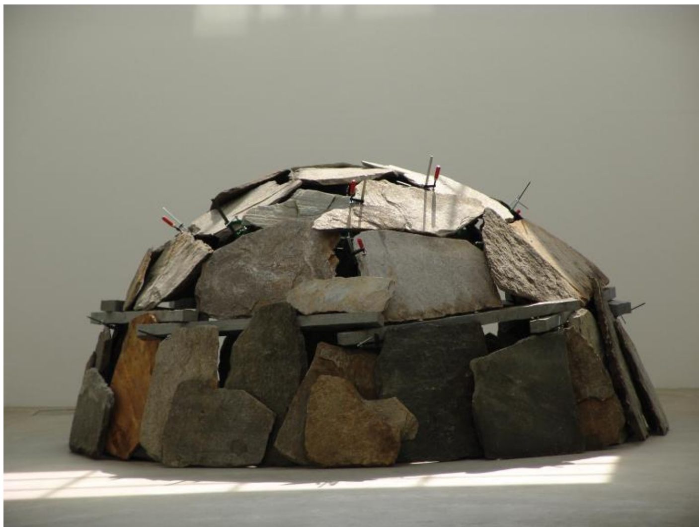
Mario Merz Senza titolo , 1991 Veduta dell'installazione , Fondazione Merz, Torino, 2005 © Mario Merz, by SIAE 2018.