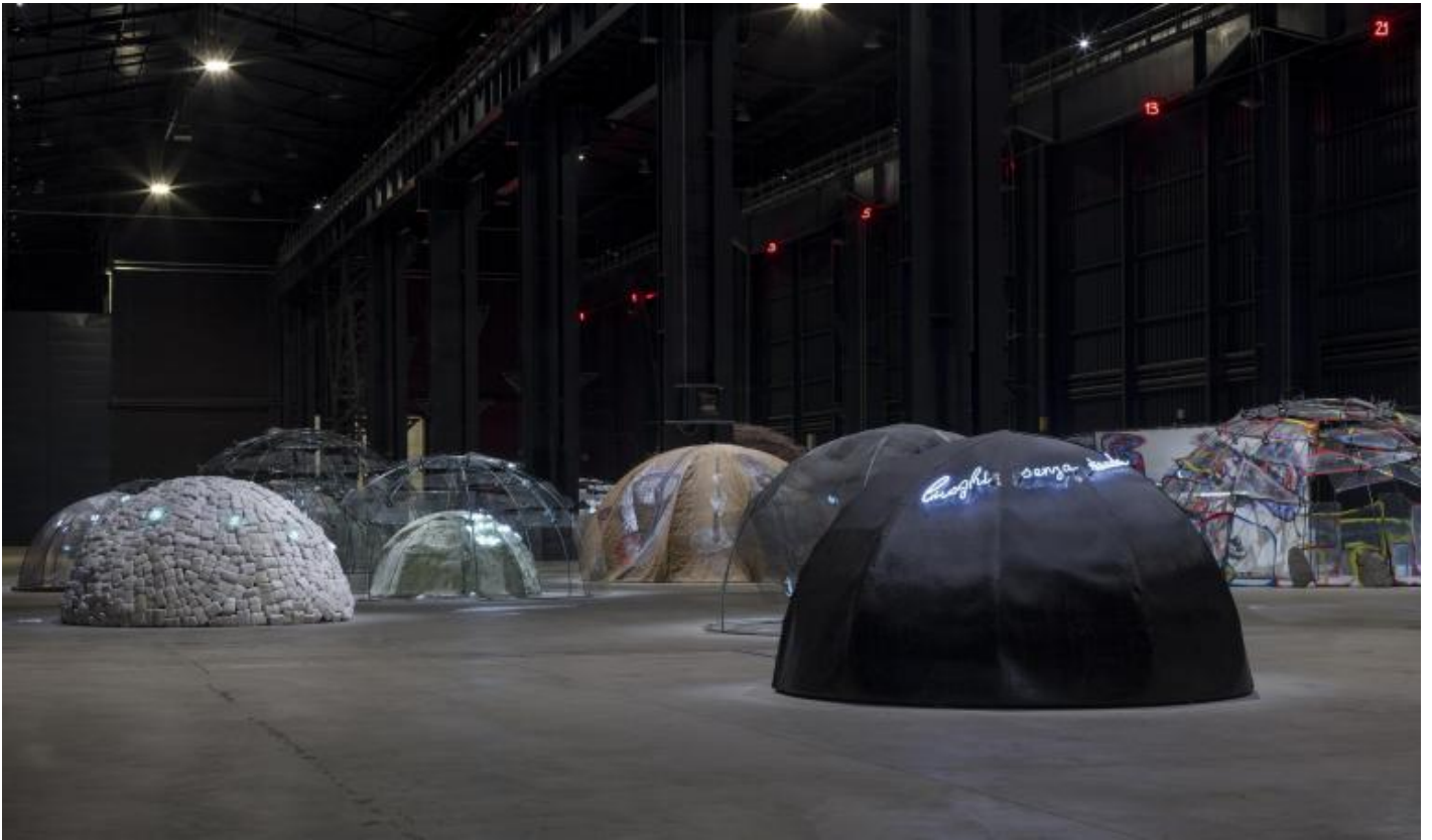
Mario Merz, â?Igloosâ?, veduta della mostra, Pirelli HangarBicocca, Milano, 2018. Courtesy Pirelli HangarBicocca, Milano Foto: Renato Ghiazza Â© Mario Merz, by SIAE 2018.

Il percorso espositivo si apre con Igloo di Giap , rifacimento del 1970 di un'â?opera concepita nel 1968. Si tratta di una variante del primo igloo realizzato dall'â?artista, che riecheggia nel nome quel Giap, icona dei movimenti studenteschi rivoluzionari, che proprio nel marzo del 1968 ingaggiavano gli scontri di Valle Giulia. La struttura metallica Ã" ricoperta direttamente con argilla, sopra la quale campeggia la scritta al neon che riporta la celebre frase del generale vietnamita VÃµ NguyÃn GiÃp: â?Se il nemico si concentra perde terreno se si disperde perde forza Giapâ?.