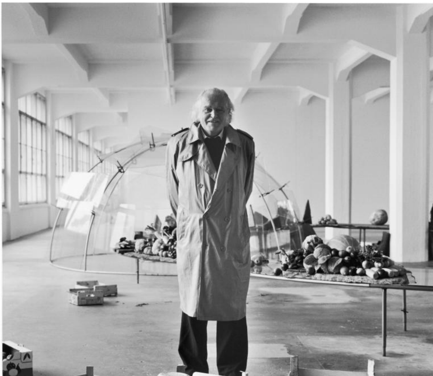
Mario Merz a Schaffhausen (CH)

La faccia di Mario Merz è una faccia tragica, antica. Guardando le sue foto, si possono facilmente rintracciare in quei lineamenti rocciosi l'energia che corre nelle sue opere, una forza originaria che ha a che fare con l'acqua, il fulmine, la zolla di terra che si spacca. È il viso di uno scienziato che ha scelto l'arte come forma di interpretazione del mondo, pur mantenendo un approccio fenomenologico all'esistente. Figlio di un ingegnere e di una insegnante di musica, Merz è un artista votato al fare, se vogliamo di ascendenza leonardesca, che costruisce una piattaforma linguistica attraverso la quale far incontrare lo spazio antropologico e lo spazio architettonico.