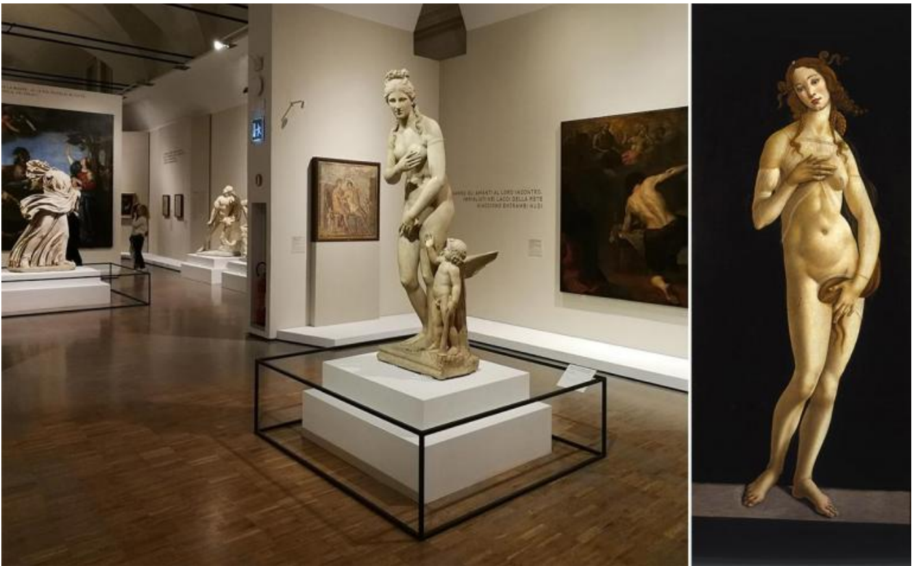
Veduta della quarta sala con Statua di Afrodite pudica, Il secolo d.C. Firenze, Gallerie degli Uffizi accostata alla Venere pudica di Alessandro Filipepi detto Sandro Botticelli, 1485-1490 circa, Torino, Musei Reali - Galleria Sabauda.