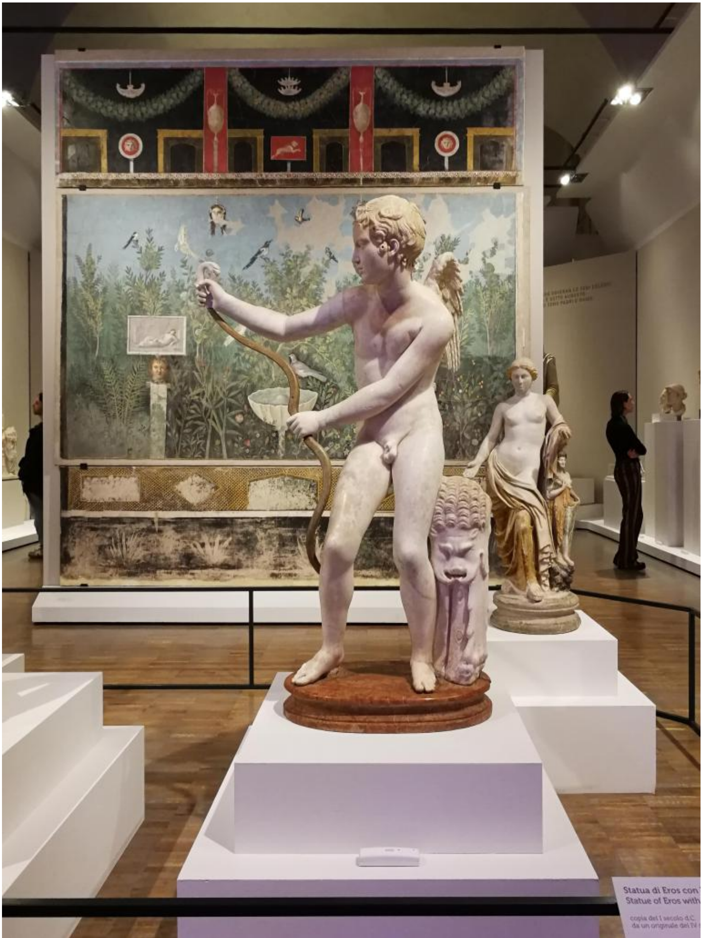
Veduta della seconda sala con Statua di Eros con lâ??arco (copia del I secolo d.C. da un originale del IV secolo a.C., Venezia, Museo Archeologico Nazionale) in primo piano e in secondo piano Affresco con pittura