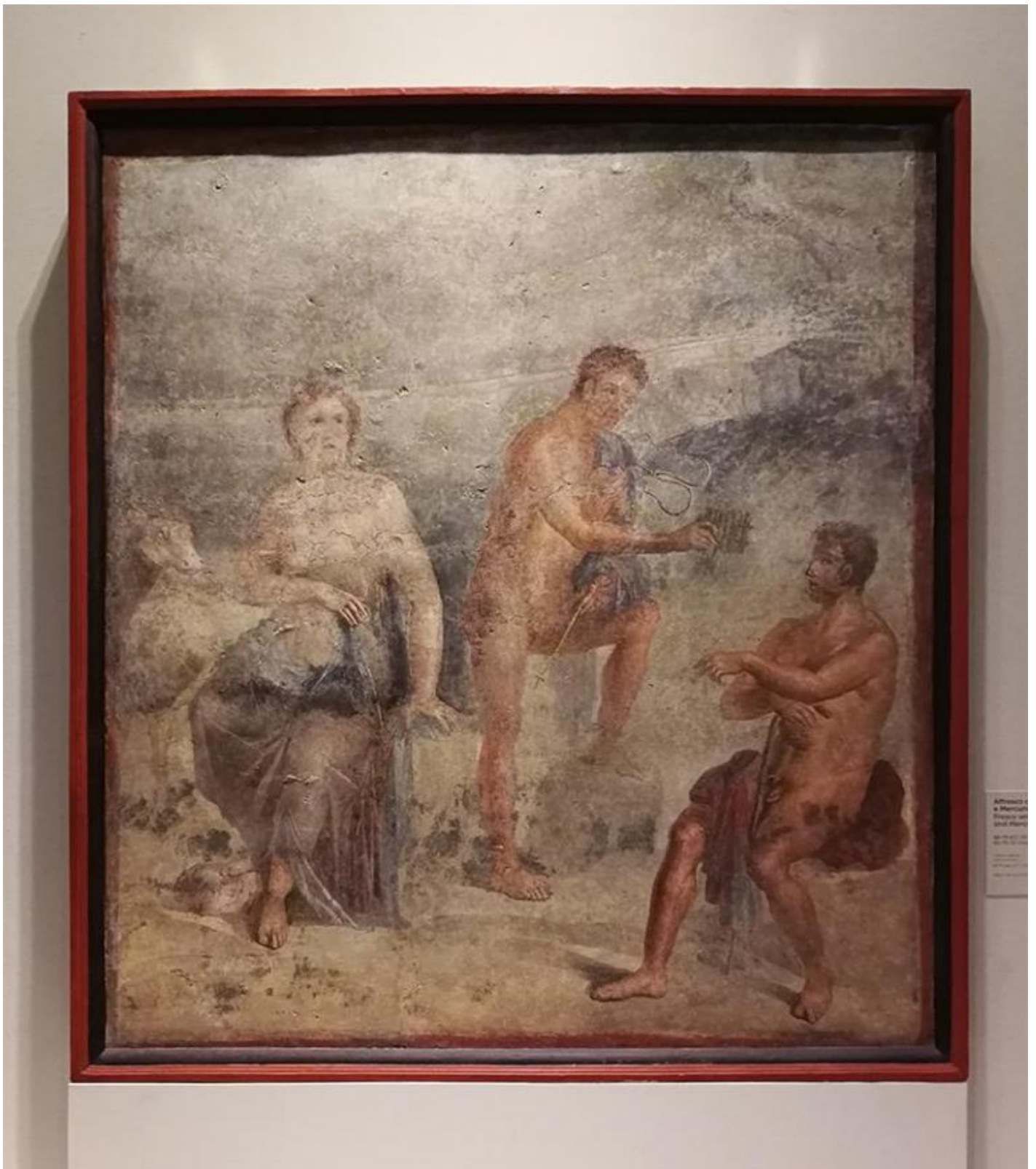
Affresco con Io, Argo e Mercurio, 69-79 d.C. Napoli, Museo Archeologico Nazionale.

Lâ??Affresco con Io, Argo e Mercurio esposto nella quinta sala, ad esempio, mette in scena il momento in cui Mercurio porge ad Argo una syrinx , che nel racconto di Ovidio diviene lâ??espediente con il quale il dio addormenta Argo ( Metamorfosi I, 668-688).