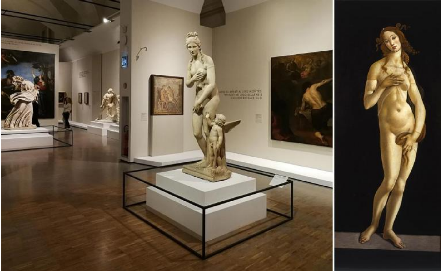
Veduta della quarta sala con Statua di Afrodite pudica, II secolo d.C. Firenze, Gallerie degli Uffizi accostata alla Venere pudica di Alessandro Filipepi detto Sandro Botticelli, 1485-1490 circa, Torino, Musei Reali della Galleria Sabauda.