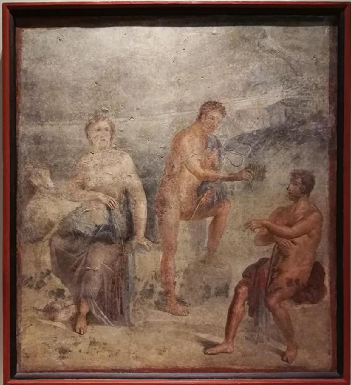
Affresco con Io, Argo e Mercurio, 69-79 d.C. Napoli, Museo Archeologico Nazionale.

L'Affresco con Io, Argo e Mercurio esposto nella quinta sala, ad esempio, mette in scena il momento in cui Mercurio porge ad Argo una syrinx , che nel racconto di Ovidio diviene l'espedito con il quale il dio addormenta Argo ( Metamorfosi I, 668-688).