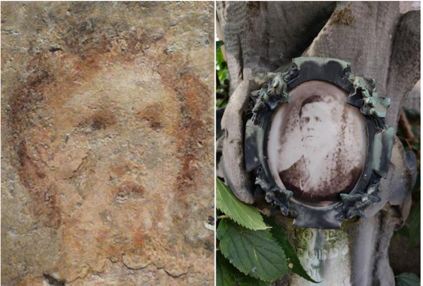
Affresco con Io, Argo e Mercurio (particolate della testa di Io), 69-79 d.C. Napoli, Museo Archeologico Nazionale – Ritratto in fotoceramica applicato a una lapide del cimitero di Orta San Giulio.

Il ritratto mi emoziona con la stessa intensità con la quale mi ha emozionato Eros con arco . Torno nella sala dove la scultura è esposta per ammirare ancora una volta lo scorrere della luce sulla superficie del marmo e il suo lampeggiare sui cristalli a fior di pelle! polvere di marmo e di stelle, galassie, pulviscolo, sali fotografici che svaniscono come impronta evanescente di Io, ombre stampate sui muri da esplosioni atomiche, pixel che si disgregano e si ricompongono su display e monitor. Tutto muta, nulla muore. Lo spirito [il termine latino spiritus usato da Ovidio traduce il termine greco πνέσμα] è errabondo! (Ovidio, Metamorfosi XV, 165-170).