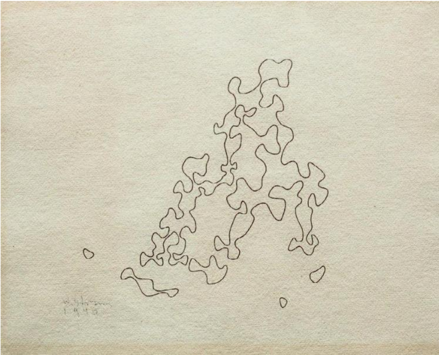
Władysław Strzemiński, Un profugo , dalla serie Deportazioni , 1940

Strzemiński e il gruppo a.r. avevano un atteggiamento "enciclopedico" verso l'avanguardia modernista o volevano documentare solo l'arte astratta e costruttivista?