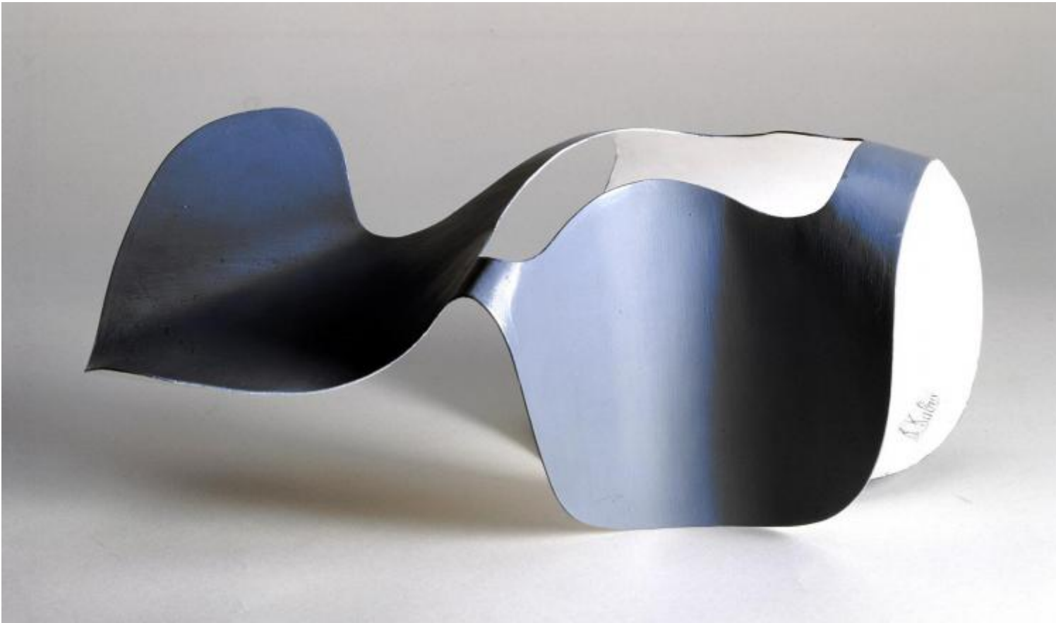
Katarzyna Kobro, Composizione spaziale 9, 1933

Dal punto di vista dell'attuale direttore del Muzeum Sztuki, qual è ora la condizione di un'istituzione erede di una vicenda così particolare e illustre? I musei d'arte contemporanea sono diventati meri "supermercati della cultura", come Baudrillard etichettò il Centre Pompidou quando fu inaugurato nel 1977?