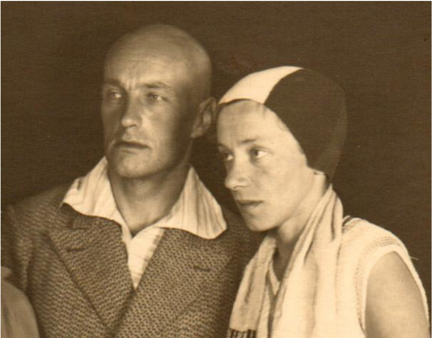
Władysław Strzemiński e Katarzyna Kobro

Le costruzioni geometriche tridimensionali di Kobro, in particolare le Composizioni spaziali in metallo a smalto bianco o policromo degli anni Venti esposte nelle due prime sale della mostra, danno espressione concreta all'aspirazione a fare della scultura una "condensazione" dello spazio, una dimostrazione delle sue proprietà intrinseche, dove la materia utilizzata per delimitare e allo stesso tempo modellare il vuoto in complessi andamenti ritmici derivati anche dalla serie di Fibonacci, una successione numerica che lega insieme forme geometriche, proporzioni (la sezione aurea), strutture biologiche.