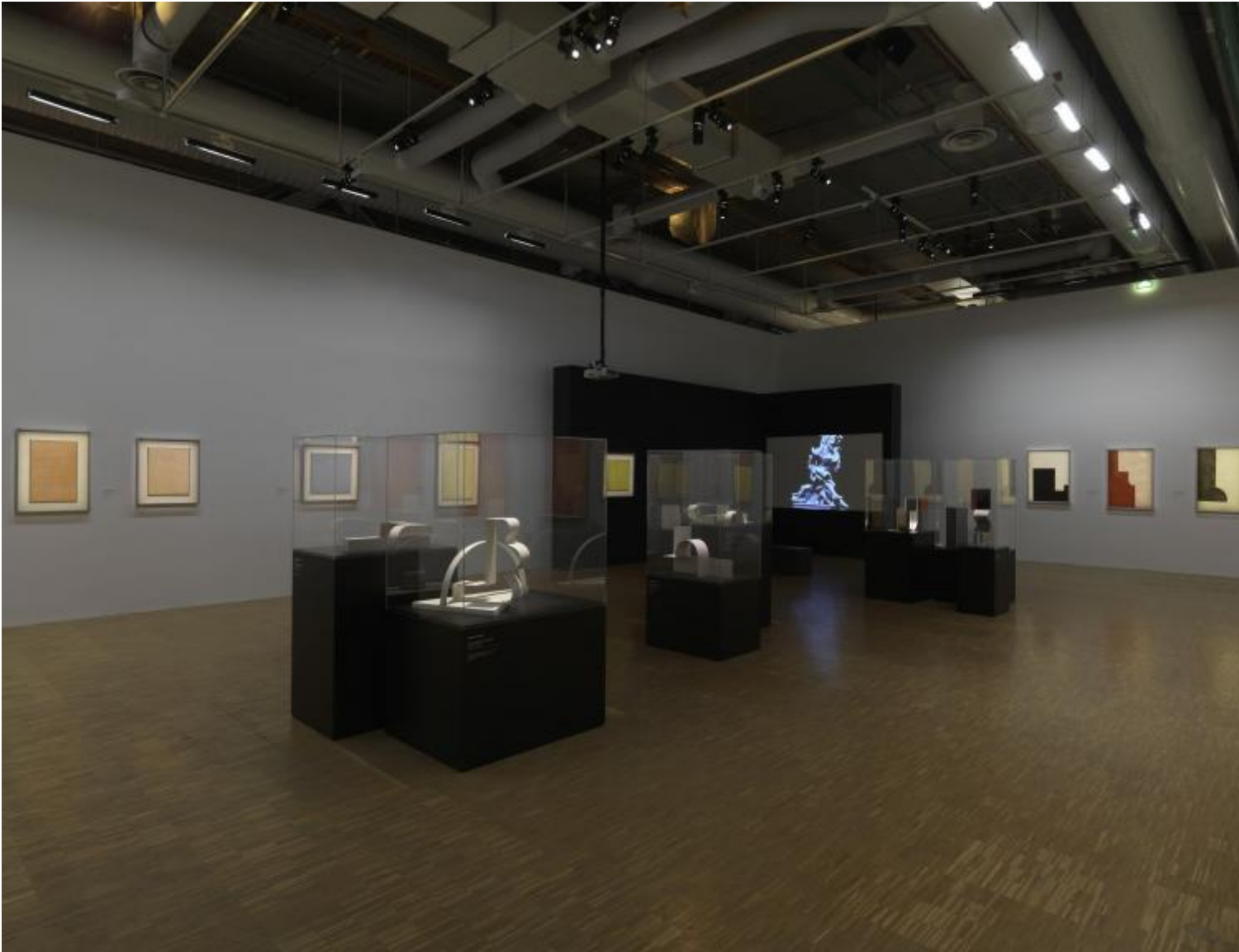
Vista della mostra al Centre Pompidou

sempre connesso a condizioni storiche determinate. L'utopia reale lasciata in eredità dai due artisti polacchi ed è un discorso che può risuonare anche nella nostra epoca disincantata equivale così a un invito a superare il limite di ciò che è immaginabile, a forzare la sempre apparente compattezza della realtà.