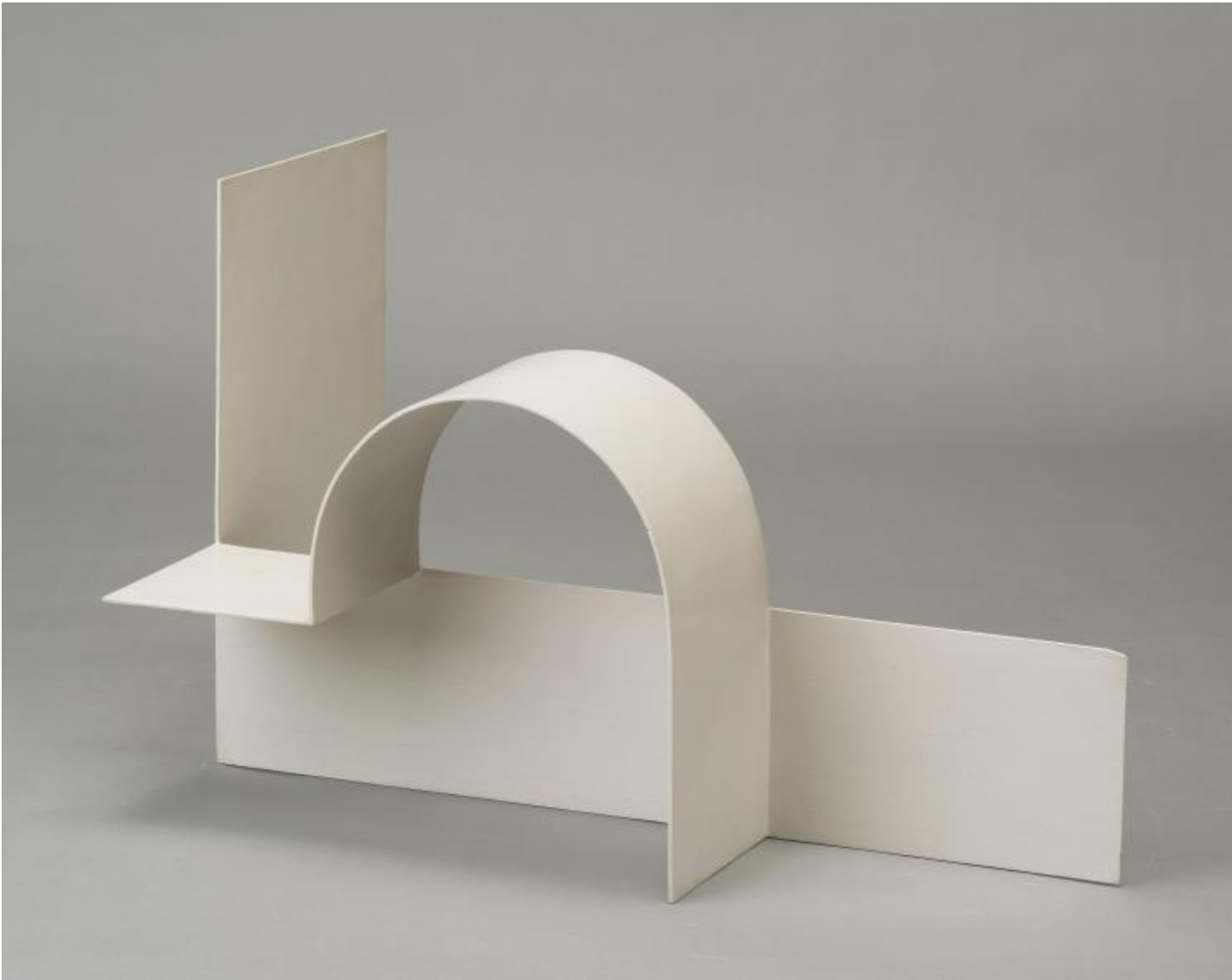
Katarzyna Kobro, Composizione spaziale, 1928

Un discorso a parte meritano invece gli straordinari disegni realizzati da Strzemiński durante e appena dopo la guerra, meditazioni strazianti sul destino umano che testimoniano, come nota Jean-François Chevrier nel suo saggio in catalogo, il suo abbandono dell'unità a favore di una figurazione organica di radice surrealista. In questi lavori l'ideale di una perfetta adeguazione tra materia, percezione e pensiero appare ormai un'aspirazione lontana, travolta ormai dal pathos e dalla terribilità della storia. L'influenza delle forme organiche di Prampolini e di Arp, già visibile nelle composizioni "marine" create verso la metà degli anni Trenta, diventa il punto di partenza per immagini intensissime, allucinatorie, come accade nelle serie Deportazioni (1940) e Volti (1942), disegni a matita in cui le fattezze umane appaiono sgretolarsi di fronte alla pressione di eventi tragici e inimmaginabili. L'unità organica cede di schianto, i corpi si disfano e al loro posto appaiono sagome indefinibili, grumi di materia biologica che galleggiano nel vuoto.