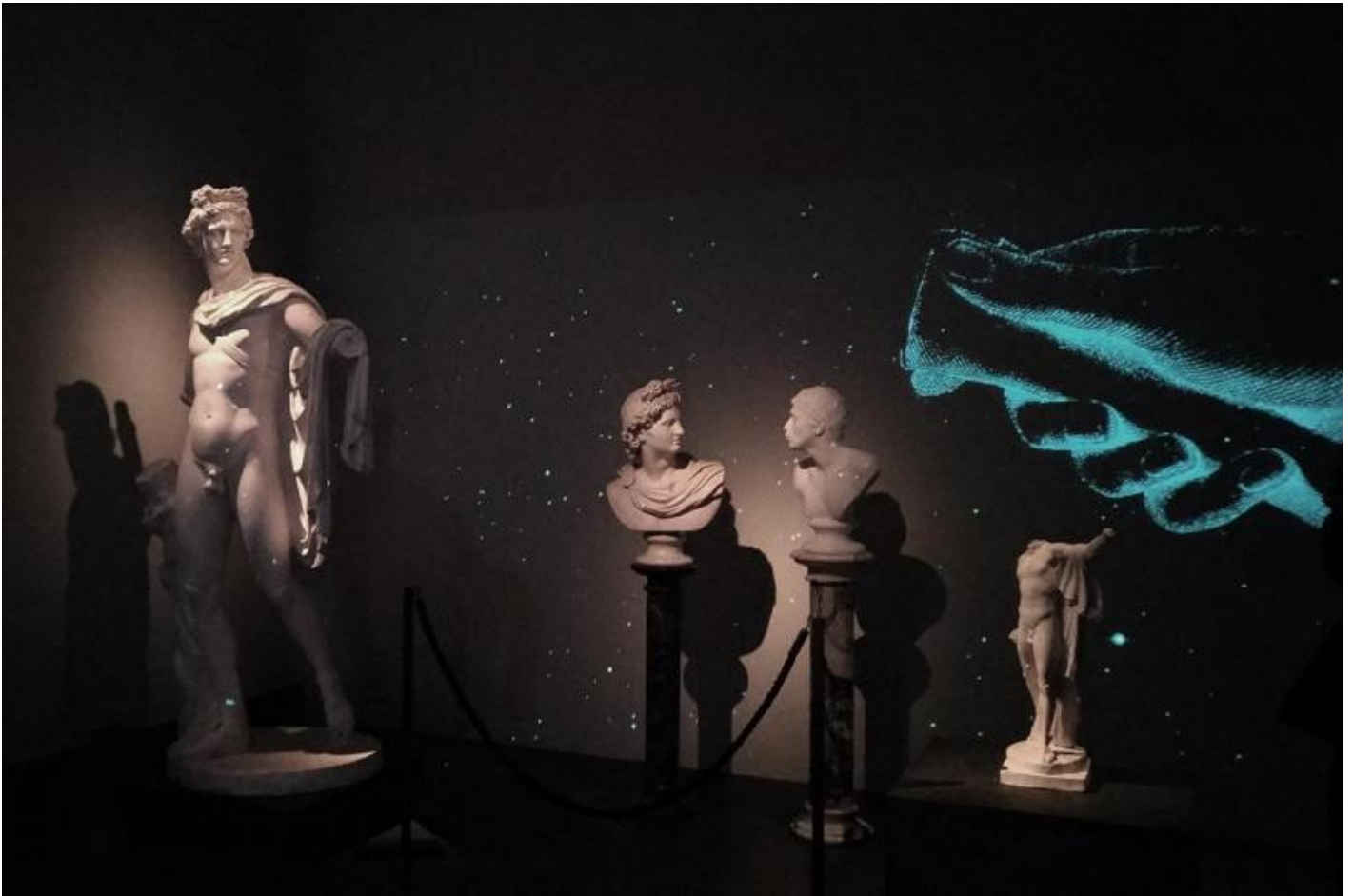
Veduta della sezione Ritorno all'antico con grazia e ironia a Palazzo Massimo. Da sinistra: Apollo del Belvedere, prima metà II secolo d.C. da un originale del IV secolo a.C. Roma, Musei Vaticani; Francesco Vezzoli, Self-portrait as Apollo del Belvedere's lover, 2011. Milano, Fondazione Prada; Antonio Canova, Perseo trionfante, 1798. Possagno, Museo Canova.