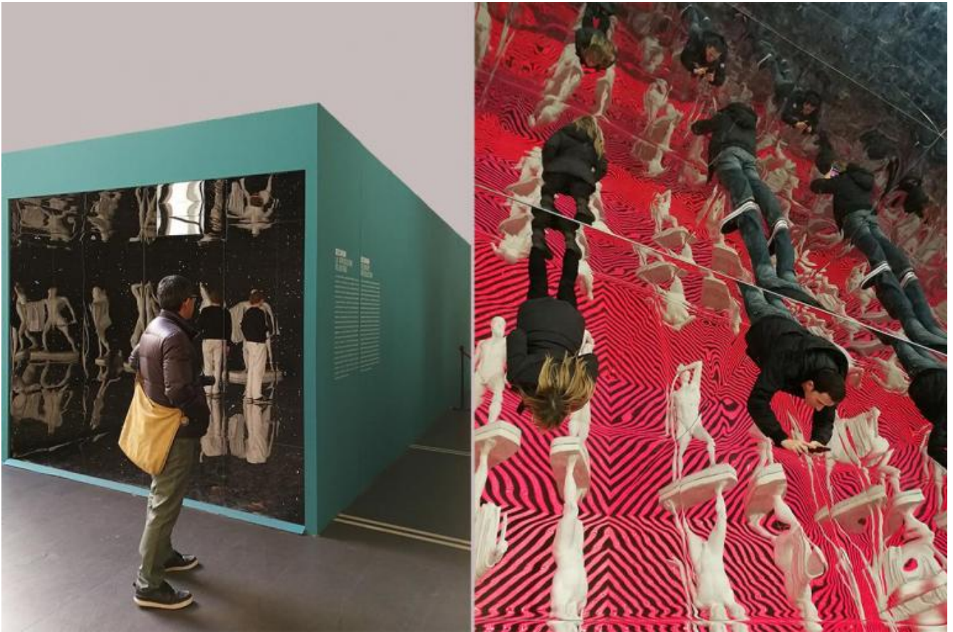
Sezione Decorum: la riproduzione volontaria. Vista dall'esterno e dall'interno.

Per questa ragione la coraggiosa se non spericolata mostra scuote gli addetti ai lavori e incuriosisce molto i non addetti. La sezione Decorum: la riproduzione volontaria , più spregiudicatamente pop di altre, è composta da un grande parallelepipedo cavo internamente ricoperto da superfici specchianti, che moltiplicano una copia del Gruppo dei Tirannicidi Armodio e Aristogitone creando un effetto psichedelico anni Sessanta: una sorta di luna pop-park che mette in scena il tema proposto dalla mostra con grande successo di pubblico. Sia le sale allestite a Palazzo Massimo che quelle allestite alla Crypta Balbi sono piuttosto fantasmagoriche.