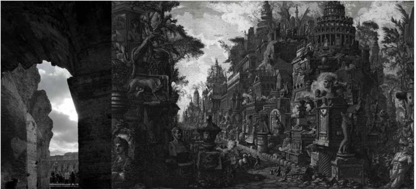
Anfiteatro Flavio. / Giovan Battista Piranesi, Veduta ideale del bivio tra la via Appia e Ardeatina tratta da Le Antichità Romane, 1756.

rispetto al presente in una sconnessione. Essere contemporanei significa aderire al proprio tempo attraverso una sfasatura, come quella fra il nostro viso e quello di Silla.