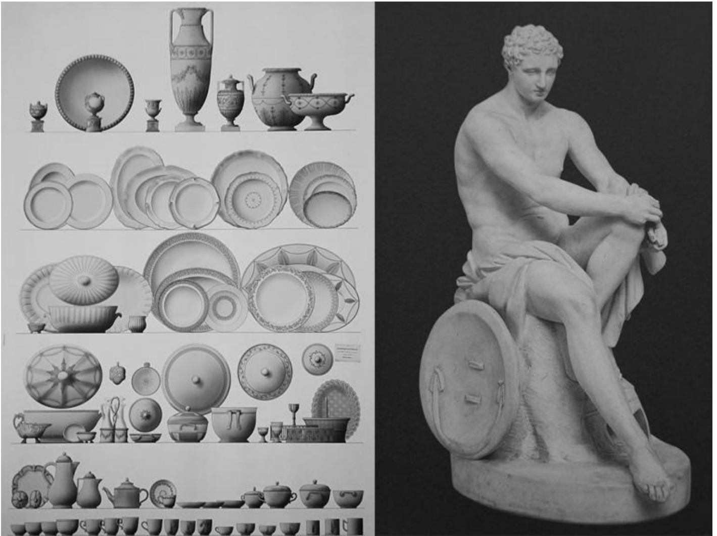
Catalogo della manifattura Volpato. / Officina Volpato, Ares Ludovisi. Bisquit cm 26 x 11 x 17. Roma musei Capitolini.

Sull'innesto di un tempo nell'altro, sull' inattualità del classico nel Settecento e nell'Ottocento – in corso la mostra Il Classico si fa Pop. Di scavi, copie e altri pasticci (Roma, Museo Nazionale romano di Palazzo Massimo e Crypta Balbi, fino al 7 aprile 2019). La mostra nasce dal ritrovamento nel 2010 dell'atelier romano di Giovanni Trevisan detto Volpato che a Roma intraprese un'attività di scavo, restauro e commercio dei marmi antichi, dal 1785 affiancata da una vasta produzione in bisquit di copie richieste come souvenir e di altre suppellettili prodotte dalla sua manifattura di ceramica ubicata in via Urbana 152.