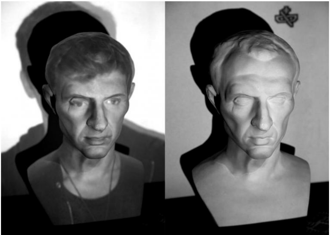
Proiezione di un volto su una copia in gesso del Ritratto di Silla, I secolo a.C.

L'immagine mostra due visi con tratti somatici diversi, ma anche due visi che appartengono a due epoche diverse. La coincidenza imperfetta richiama sia il tema dell'identità sia quello del rapporto che il nostro tempo ha con altri tempi.