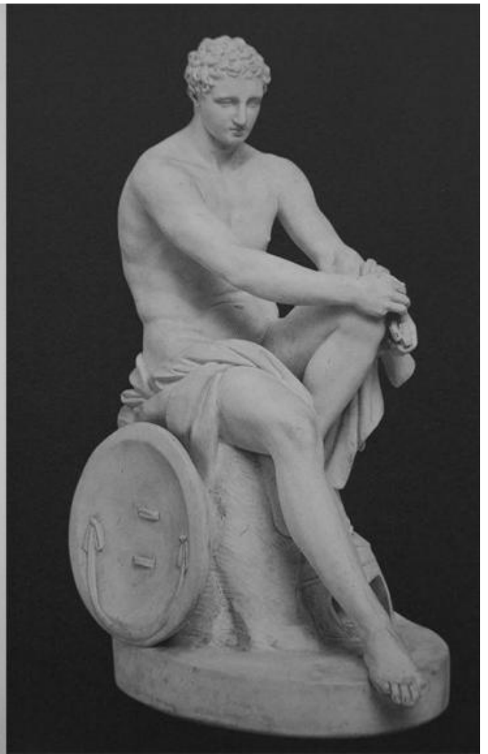
Catalogo della manifattura Volpato. / Officina Volpato, Ares Ludovisi. Bisquit cm 26 x 11 x 17. Roma musei Capitolini.

Sull'innesto di un tempo nell'altro, sull' inattualità del classico nel Settecento e nell'Ottocento è in corso la mostra Il Classico si fa Pop. Di scavi, copie e altri pasticci (Roma, Museo Nazionale romano di Palazzo Massimo e Crypta Balbi, fino al 7 aprile 2019). La mostra nasce dal ritrovamento nel 2010 dell'atelier romano di Giovanni Trevisan detto Volpato che a Roma intraprese un'attività di scavo, restauro e commercio dei marmi antichi, dal 1785 affiancata da una vasta produzione in bisquit di copie richieste come souvenir e di altre suppellettili prodotte dalla sua manifattura di ceramica ubicata in via Urbana 152.