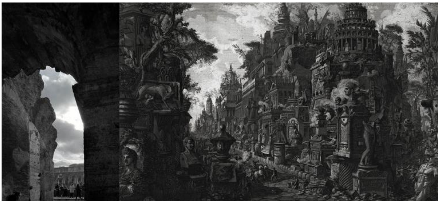
Anfiteatro Flavio. / Giovan Battista Piranesi, Veduta ideale del bivio tra la via Appia e Ardeatina tratta da Le Antichità Romane, 1756.

Mi aggiro per il corridoio curvo al piano superiore (Secondo Ordine) dell'anfiteatro Flavio, dove è allestita la mostra, soffermandomi ogni tanto a guardare attraverso le arcate dirute un cielo fortemente chiaroscurato. L'immagine è suggestiva. Richiama alla mente le incisioni di Giovan Battista Piranesi e il suo progetto di costruire una nuova Roma sulla base delle parlanti ruine . L'idea di un tempo che non scorre in modo uniforme dal passato verso il futuro ma in modo discontinuo è diventata una questione centrale anche per la critica dell'arte. La lezione inaugurale di Agamben si conclude infatti con un richiamo alle riflessioni di Walter Benjamin sulle immagini del passato che giungono alla leggibilità solo in un determinato momento della loro storia. Il fluire della storia non è continuo, evolutivo e lineare ma discontinuo e intermittente. Questa mancanza di conseguenza, questa assenza di successione che Benjamin riferisce alla storia pone una serie d'interrogativi alla critica dell'arte. "La storia dell'arte non può essere che anacronistica" sostiene infatti Georges Didi-Huberman in Storia dell'arte e anacronismo delle immagini (Bollati Boringhieri, Torino 2007). Il contemporaneo è l'inattuale, spiega Marco Belpoliti in un articolo di qualche anno fa sull'arte contemporanea , aggiungendo che "l'artista contemporaneo divide e interpola il proprio tempo, lo mette in relazione con altri tempi, scava nel passato per giungere nel futuro".