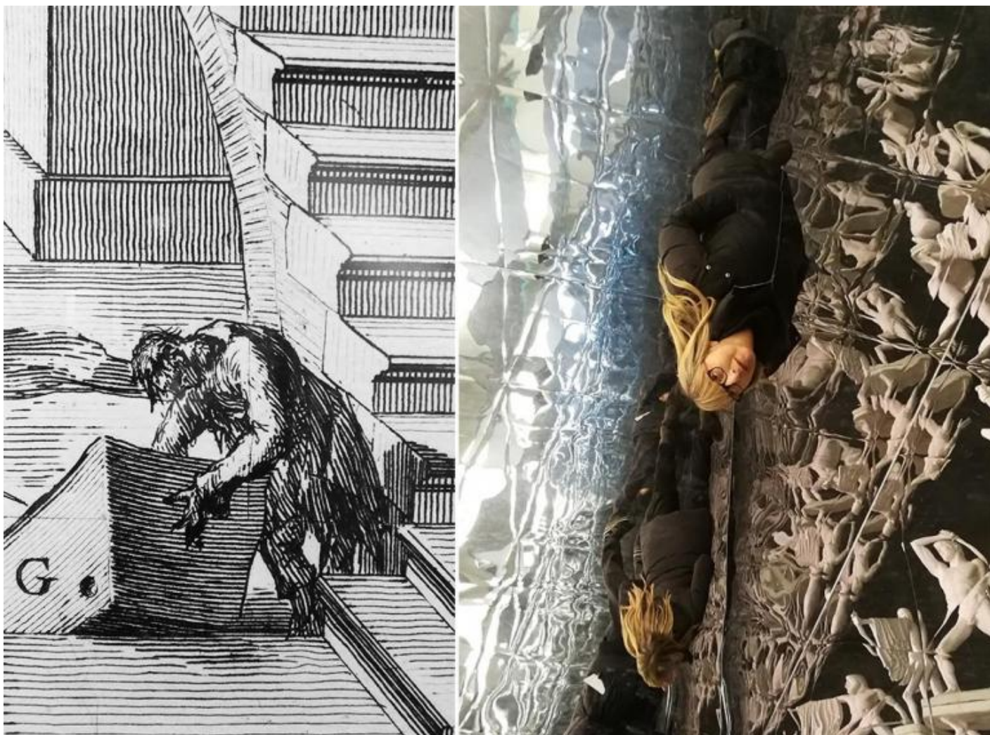
Giovan Battista Piranesi, Particolare di veduta. / Sezione Decorum: la riproduzione volontaria.