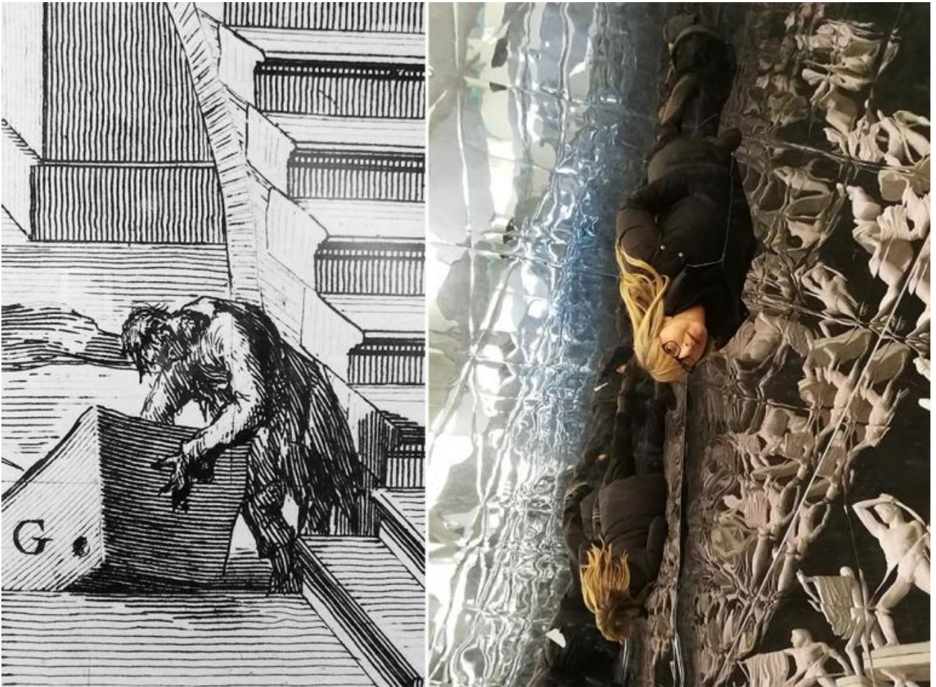
Giovan Battista Piranesi, Particolare di veduta. / Sezione Decorum: la riproduzione volontaria.

ma senza chinarci sulle rovine con un'idea, come suggerisce la figura, incisa da Piranesi, che tasta un elemento architettonico caduto a terra per misurarlo. Ci aggiriamo invece spaesati e confusi tra le macerie lasciate sul campo da codici e linguaggi in crash tra loro e tra loro e la realtà, non solo assunta in senso postmoderno come segno e quindi come mezzo di significazione (questo sembra suggerire l'immersione in Decorum: la riproduzione volontaria ), ma anche come punto d'impatto e fine corsa.