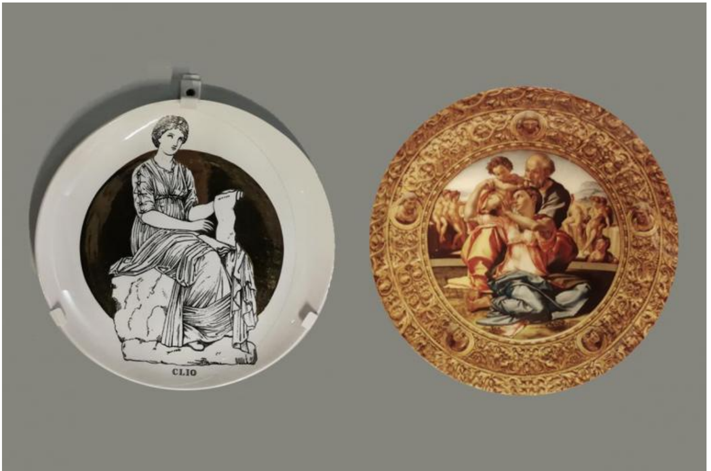
Fornasetti, piatto della serie Le Muse, anni cinquanta-sessanta del secolo scorso. Milano, Archivio Fornasetti. / Piatto in vendita al book shop degli Uffizi, con riproduzione del Tondo Doni di Michelangelo Buonarroti. Esempi di trasferimento dell'immagine dal campo delle arti figurative a quello del decoro e della produzione di souvenir.