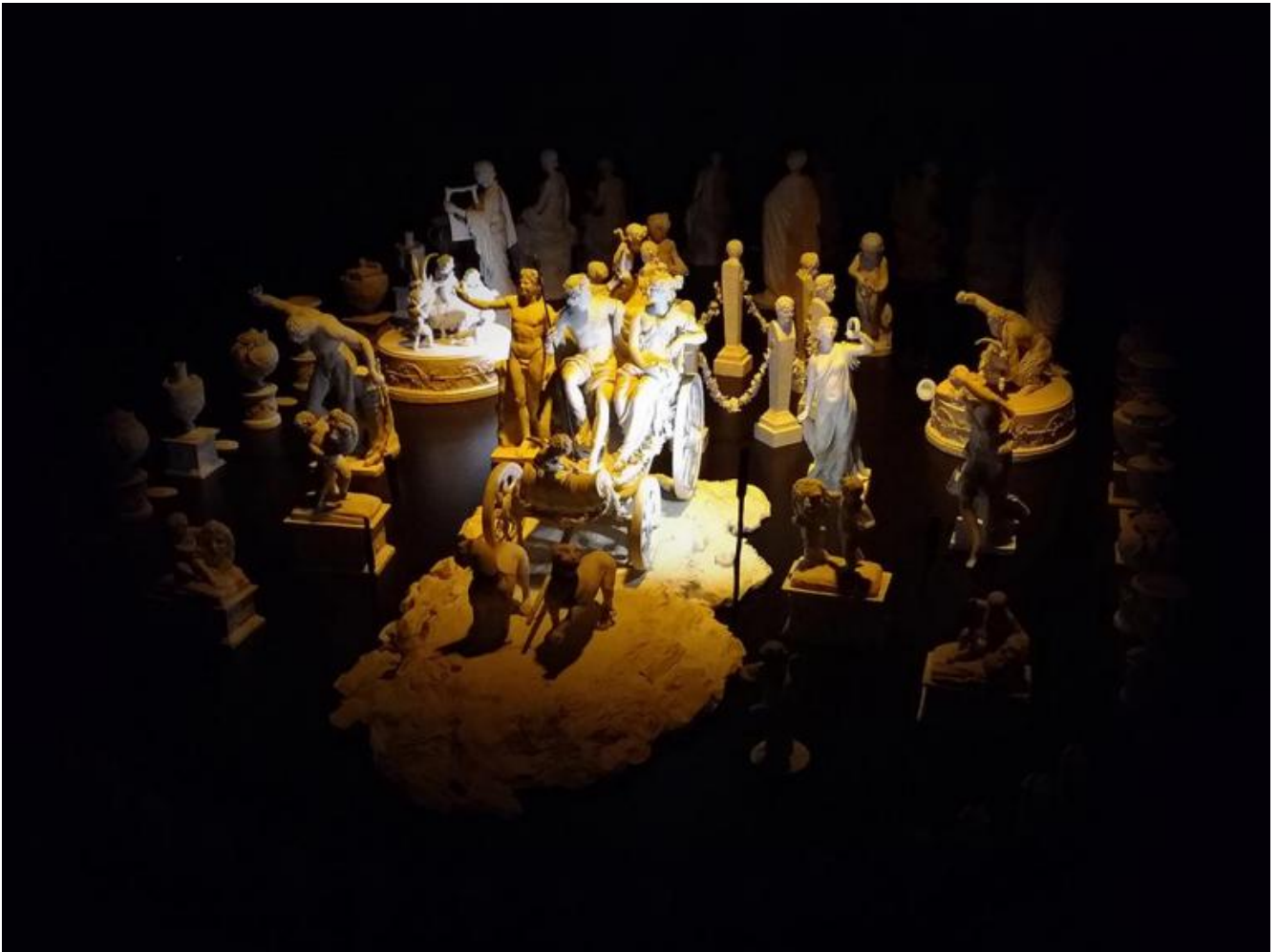
Giovanni Volpato, Dessert di Bacco e Arianna, centrotavola composto da 115 pezzi, presentato come installazione multimediale. Bassano del Grappa, Musei Biblioteca Archivio.

La serialità della Pop Art è assunta da Mirella Serlorenzi, archeologa e ideatrice della mostra, come originale chiave di lettura della produzione artistica di Volpato, che rese popolare l'arte classica con una vasta e variegata traduzione delle opere in dimensioni, materiali e supporti diversi. Statuette ma anche tazze, piatti, portauova, calamai, dessert, candelabri... oggetti vari sui quali figure e motivi decorativi tratti dall'iconografia del mondo classico migrarono spostandosi da uno all'altro con trasferimenti di supporto e salti di scala. Sia la fiorentina Doccia-Ginori che la Real Fabbrica napoletana avevano avviato ancor prima di Volpato la riproduzione seriale in scala ridotta della scultura classica inaugurando l'epoca dei souvenir in porcellana, ma la manifattura romana portò la produzione a un livello qualitativo superiore. Capolavori dell'arte classica rimpiccioliti e tradotti in porcellana non verniciata per restituire la diafana luminosità e il supposto candore dei marmi classici, che invece erano in origine colorati,