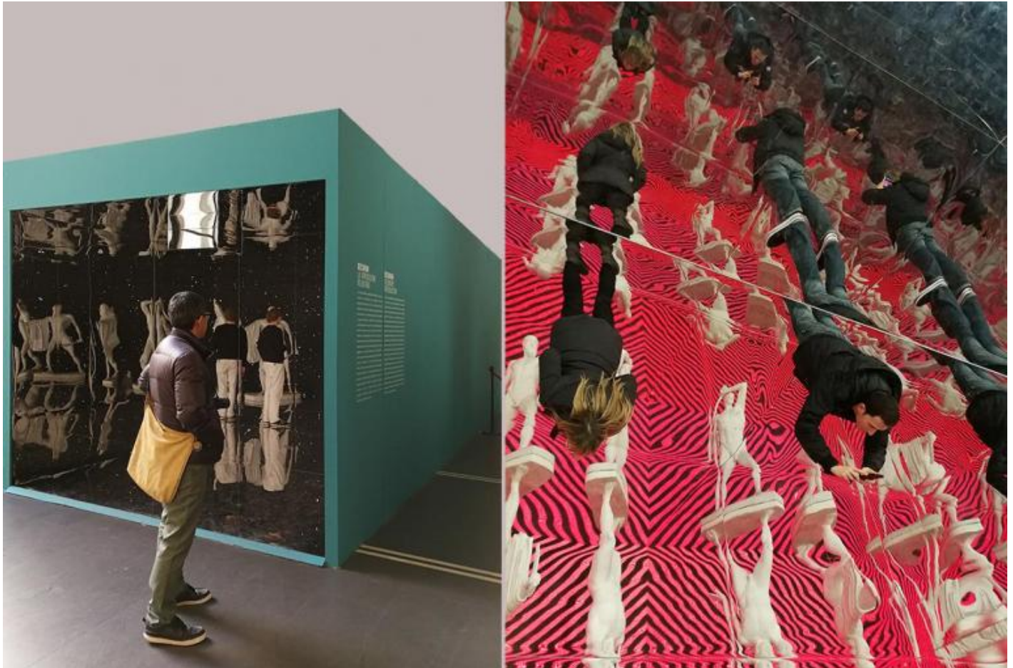
Sezione Decorum: la riproduzione volontaria. Vista dall'esterno e dall'interno.

Per questa ragione la coraggiosa se non spericolata mostra scuote gli addetti ai lavori e incuriosisce molto i non addetti. La sezione Decorum: la riproduzione volontaria , più spregiudicatamente pop di altre, è composta da un grande parallelepipedo cavo internamente ricoperto da superfici specchianti, che moltiplicano una copia del Gruppo dei Tirannicidi Armodio e Aristogitone creando un effetto psichedelico anni Sessanta: una sorta di luna pop-park che mette in scena il tema proposto dalla mostra con grande successo di pubblico. Sia le sale allestite a Palazzo Massimo che quelle allestite alla Crypta Balbi sono piuttosto fantasmagoriche.