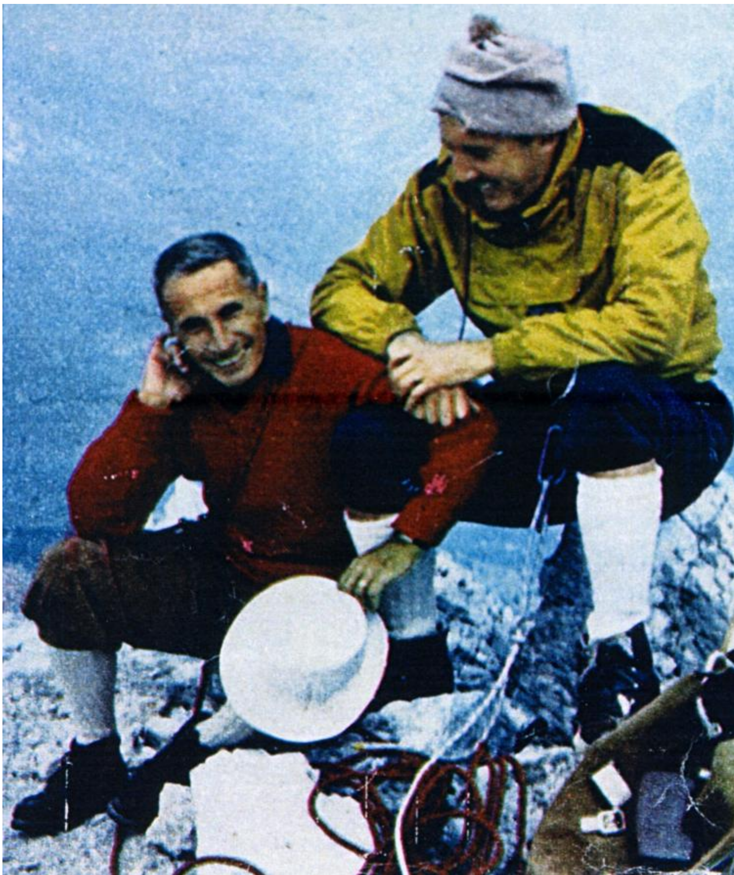
Dino Buzzati e Rolly Marchi in cima alla Croda da Lago, settembre 1966.