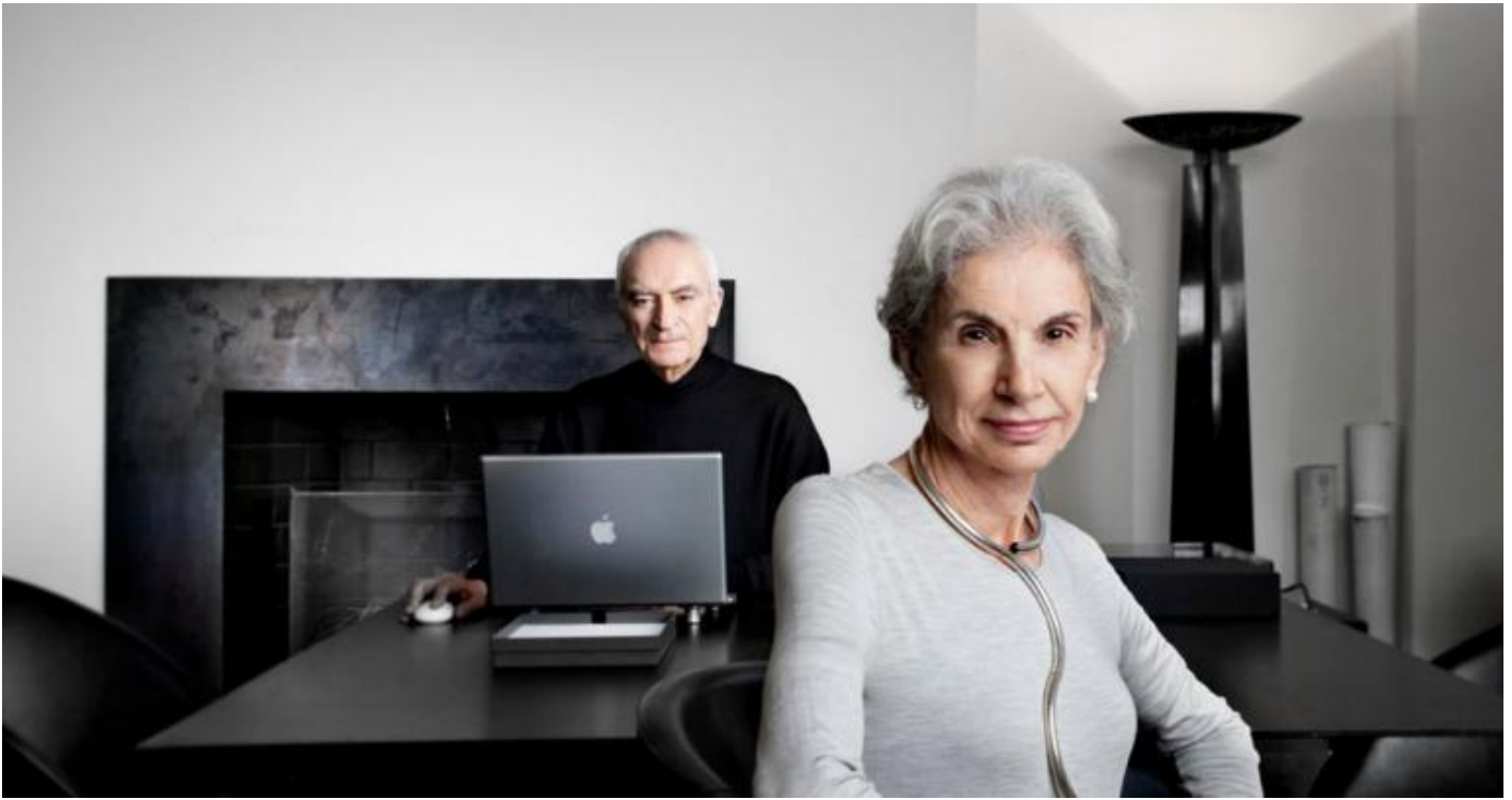
Lella e Massimo Vignelli in una delle loro ultime foto insieme.