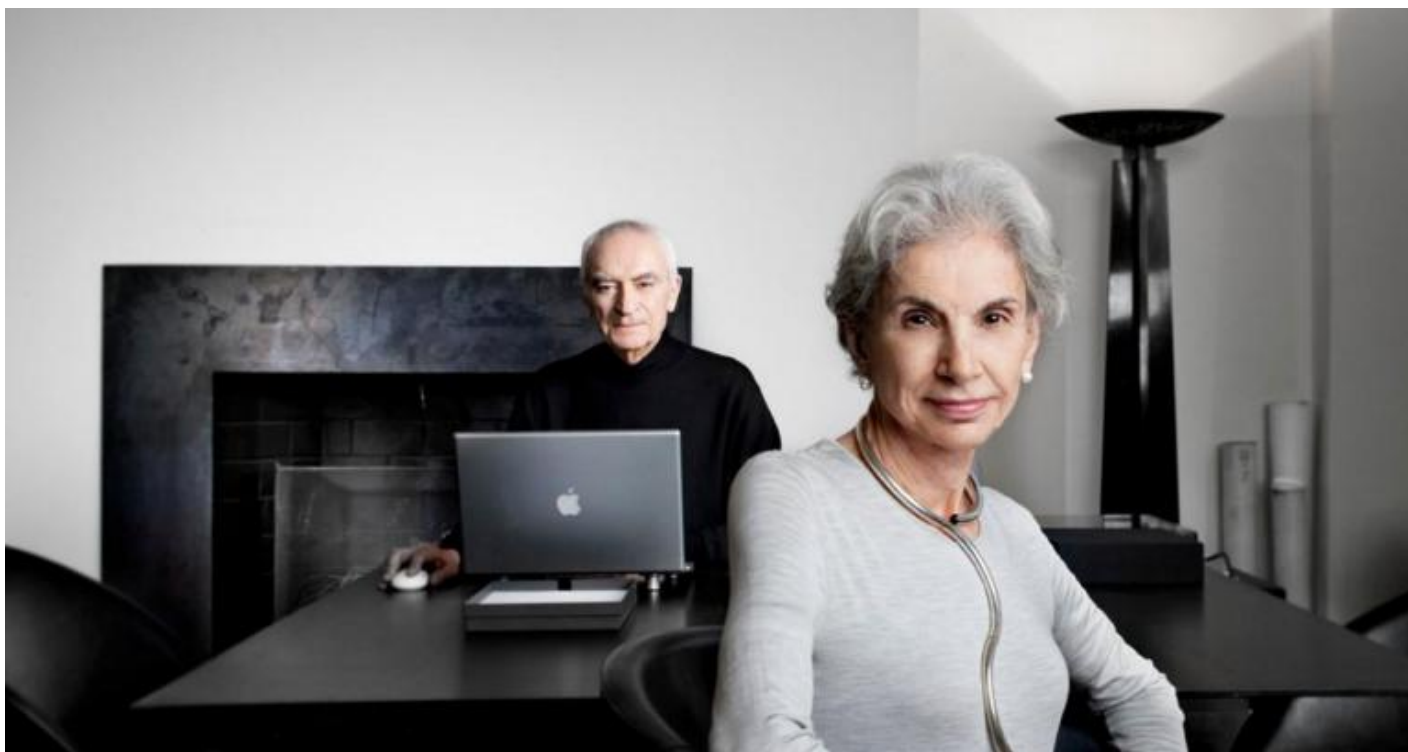
Lella e Massimo Vignelli in una delle loro ultime foto insieme.