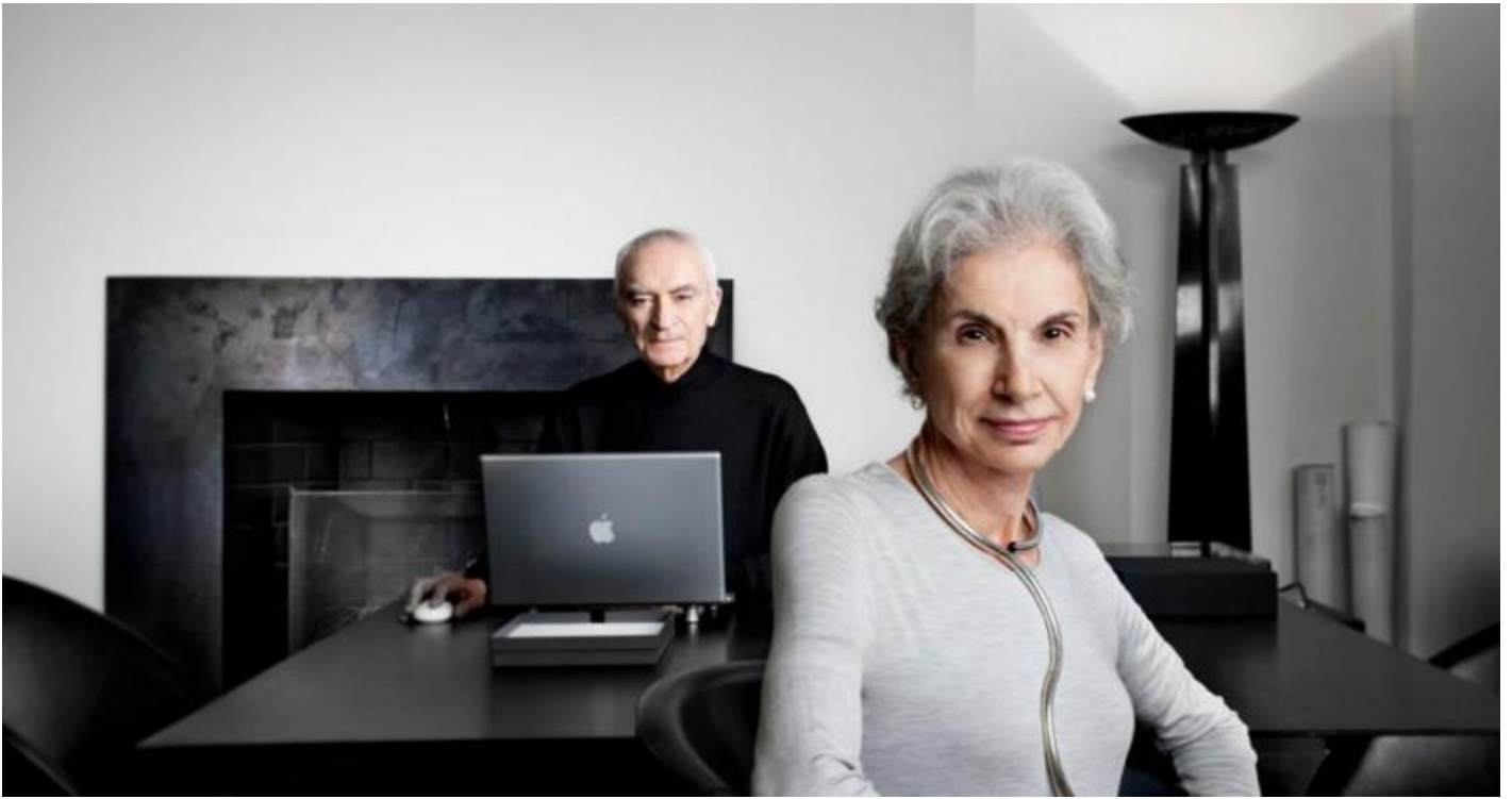
Lella e Massimo Vignelli in una delle loro ultime foto insieme.