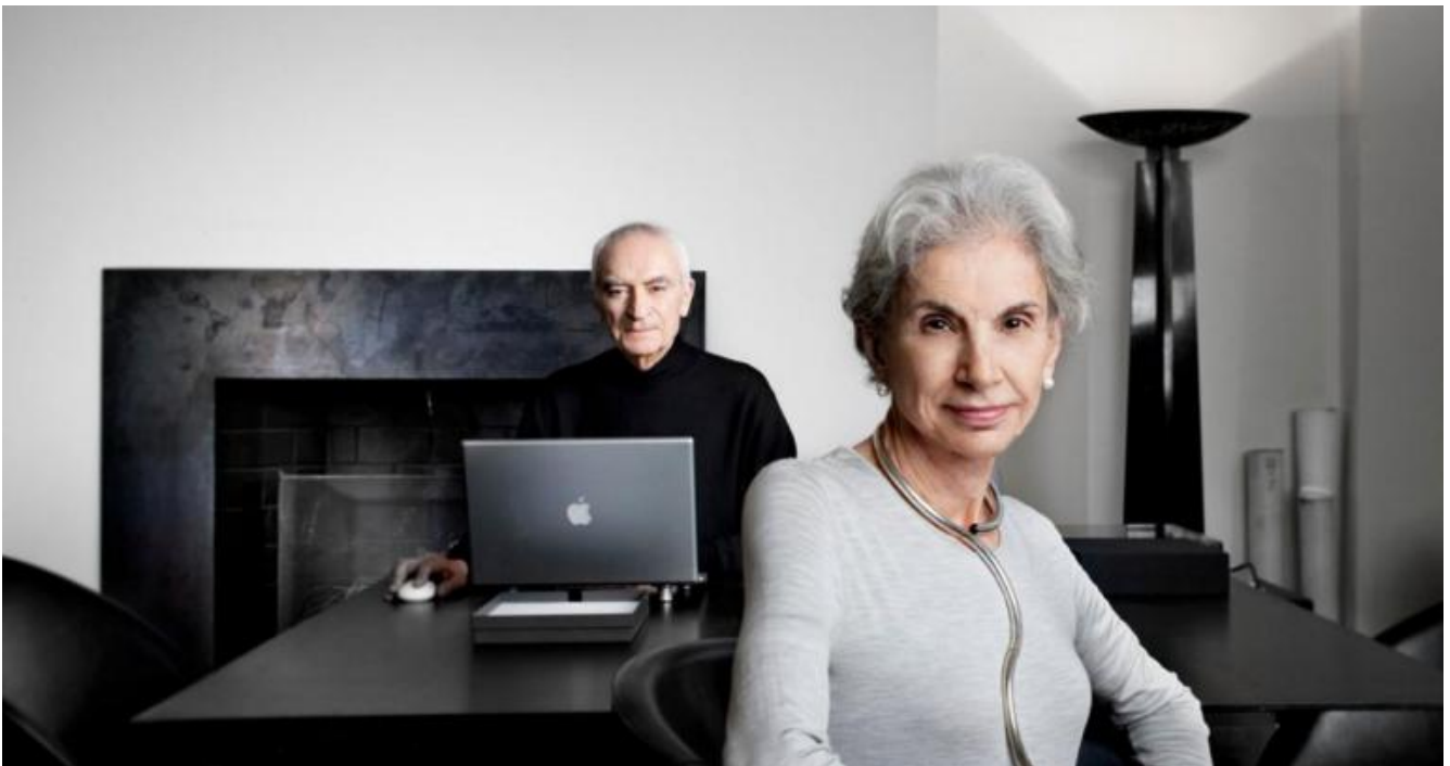
Lella e Massimo Vignelli in una delle loro ultime foto insieme.

I Vignelli non se lo sono certo fatto ripetere due volte e, com'era nel loro stile, hanno trasformato un cumulo di pietre in un autentico gioiello, ovviamente minimale, nel totale rispetto della natura. Credo abbiano trascorso in quella casa le loro vacanze per quasi un ventennio ed è lì che nel 2011 è nato anche il logo della città di Salerno: un cerchio azzurro e blu con al centro una S giallo-arancione, le cui linee sinuose, nel loro calibratissimo rigonfiarsi, evocano la silhouette del dorso di un delfino nell'atto di immergersi in mare e al contempo anche quella del sole che si leva dalle sue acque oppure che in esse cala.