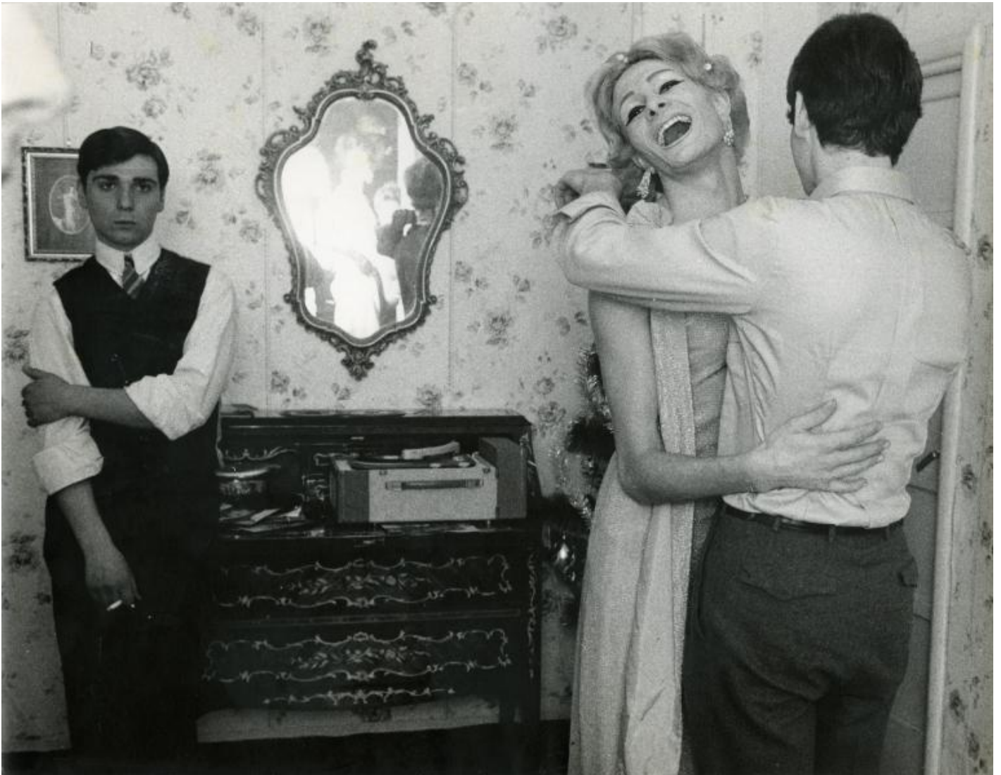
Lisetta Carmi, I Travestiti, 1965, fotografia, stampa originale a gelatina d'argento / photograph, original gelatin silver print, 18 x 24 cm, Â© Lisetta Carmi, Courtesy Galleria Martini & Ronchetti.

Le bambine fotografate da Letizia Battaglia, nei quartieri degradati di Palermo, simboleggiano la bellezza che si oppone all'emarginazione. Nomadismo qui Ã fragilitÃ, candore, innocenza. Dopo aver visto le piÃ¹ efferate stragi di mafia, e avere al suo attivo un archivio che gronda sangue, le bambine rappresentano la speranza nel futuro. Una donna che ha visto tanta morte si commuove dinnanzi alla possibilitÃ che le ragazzine rappresentano: ho capito che in queste bambine cerco qualcosa che si Ã spezzato in me a quell'etÃ, tremavo di fronte a queste bambine, racconta nell'intervista che si puÃ² vedere accanto alle immagini in mostra. Qui il nomadismo Ã il tremore dello sguardo. Ã incertezza. Ma anche speranza in un futuro diverso e migliore da costruire, desiderio di sconfinare. Lo sguardo nomade deve immergersi in ciÃ² che Ã instabile, errare, perdersi, vagare, e poi andare avanti. Le immagini sono i vettori, le frecce che suggeriscono connessioni temporanee. La mappa di chi guarda Ã un vuoto dove i percorsi connettono diverse esperienze. Il soggetto nomade incarna lo spazio del possibile, un istante in cui vi Ã assenza di limiti. Le bambine di Letizia Battaglia sono dentro questo spazio mentale. La loro essenza Ã una promessa di mobilitÃ e cambiamento.