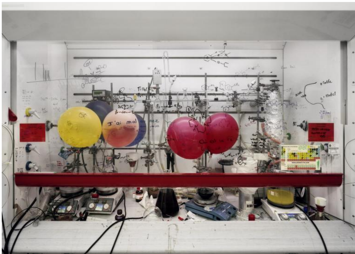
Thomas Struth Cappa chimica, Università di Edimburgo / Chemistry Fume Cabinet, The University of Edinburgh, 2010 C-print, 120,5 x 166,0 cm © Thomas Struth.