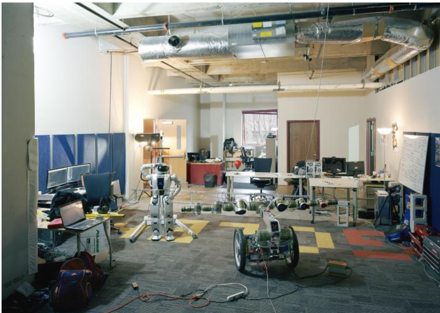
Thomas Struth Golems Playground, Georgia Tech, Atlanta, 2013 C-print, 235,1 x 328,0 cm © Thomas Struth.

Il nostro occhio non prende possesso delle cose. Ciò che vediamo è caotico ma non disordinato, perché tutto sta nel posto preciso in cui deve stare. Eppure lo stile documentario dell'immagine, in perfetta sintonia con la chiarezza che evoca la presunta razionalità della scienza, non trasmette alcuna conoscenza. L'idea per cui il visibile deve essere leggibile e deve veicolare una verità che include un dovere estetico e un imperativo etico viene messa in discussione, proprio attraverso una chiarezza e una visione che escludono il senso di ciò che vediamo. Vedere non significa capire. Si può solo presumere, nel senso di supporre o, meglio, stare in bilico tra il ritenere ciò che è dinnanzi a noi e il desiderio di spingersi oltre l'immagine. Il limite di queste fotografie è anche il limite della nostra capacità di comprendere. Se il senso di "fotografia" è "scrittura della luce", "words of light" annotava William Henry Fox Talbot su una delle copie del Pencil of Nature , cosa sta scrivendo Thomas Struth? Cosa diventano gli spazi del Mast che le espone: un deposito, una galleria d'arte, un santuario, un osservatorio? Cosa c'è in queste fotografie?