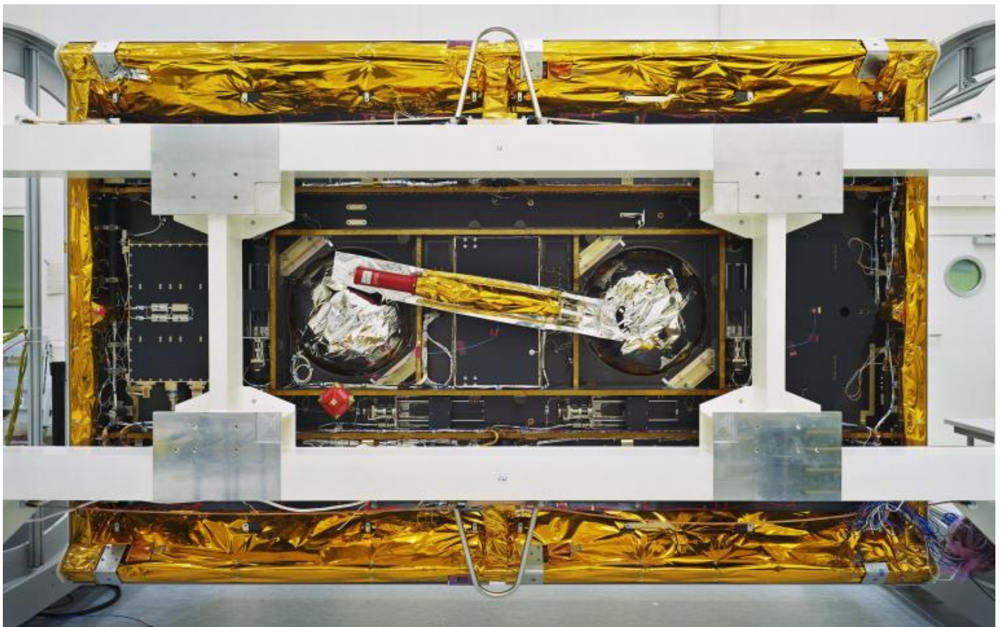
Thomas Struth GRACE-Follow-On, veduta dal basso / GRACE-Follow-On Bottom View, IABG, Ottobrunn, 2017 Inkjet print, 139,7 x 219,4 cm © Thomas Struth.

Cos'è più complesso: l'uomo e la sua a-sincronia o la macchina simbolo di organizzazione ed efficienza, dove tutto è perfettamente sincronizzato? E se pensiamo alle immagini di Struth, il confronto è riassumibile in un altro quesito: cos'è più misterioso, il mare o il caos ordinato dei fili e dei meccanismi? Così facendo, lo sguardo interroga se stesso e la sua presunta egemonia. E tocca anche il noema della fotografia, l'idea che non abbandona mai nessuno spettatore: il presunto potere di testimonianza di un'immagine, ciò che è assolutamente innegabile: l'"è stato" ( ça a été ) di Roland Barthes. Qui è tutto dinnanzi a noi eppure non c'è nulla che si possa davvero dire che esista.