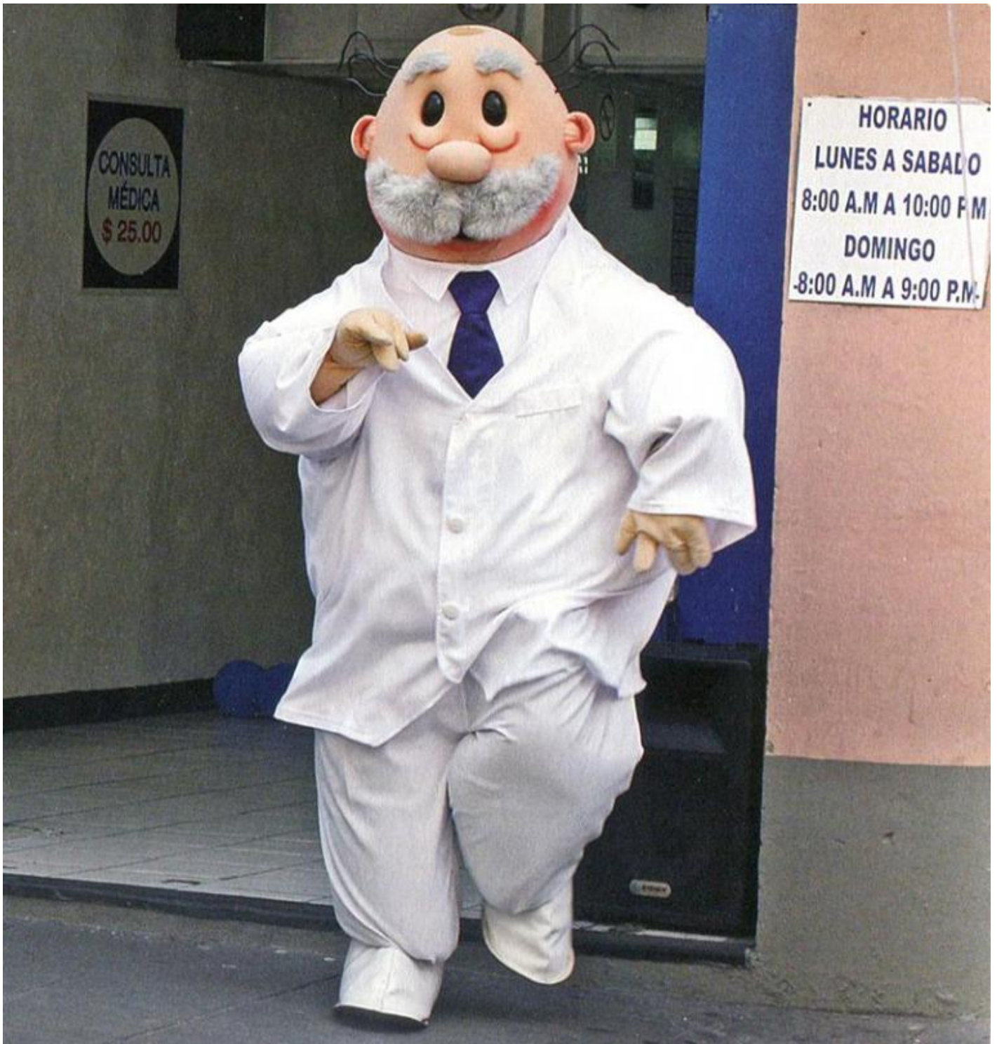
Mascotte della Farmacia del Ahorro.

E qui vorrei sbilanciarmi a toccare in rapida successione un terzo, e poi un quarto filo del mio ragionamento? altri due salti temporali per atterrare esattamente nello stesso punto, in questa Cantina , a neanche un metro da questo gigante sconosciuto che sento dâ??iniziare a comprendere intimamente. Prima di tutto un pranzo in compagnia dei miei suoceri presso una famosa taquerÃa di pesce della cittÃ . Pieno weekend. Il ristorante Ã" affollato. Non ricordo nulla di ciÃ² che ho mangiato. Ancora meno di che cosa abbiamo parlato. Tuttavia una cosa me la ricordo e bene: che insieme al cibo, quel fine settimana, il ristorante regalava campioni gratuiti di Omeprazol . Unâ??idea astuta quella di pianificare, insieme al cibo, unâ??adeguata digestione dello stesso. Un cerchio perfetto.