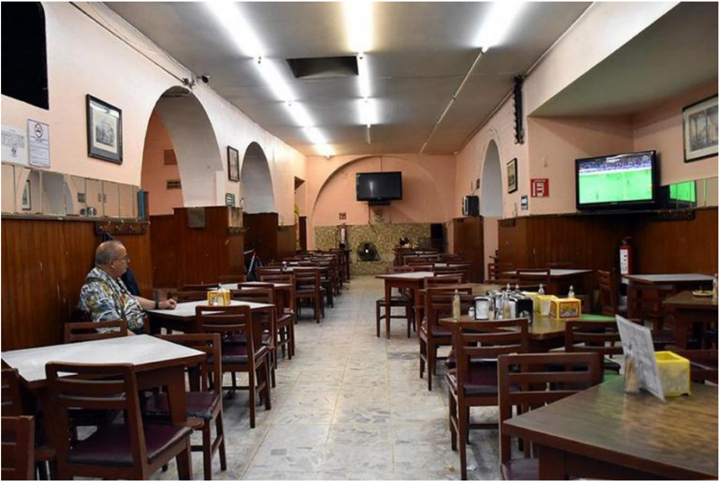
Cantina La Montejo, Città del Messico.