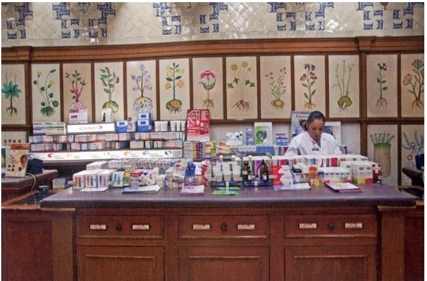
Farmacia ParÃs, CittÃ del Messico.

Ã? a questo punto che ho bisogno di muovere un secondo di quei fili di cui parlavo precedentemente e aggiungere un ulteriore episodio che, seppur indipendente, risulta concettualmente coerente con quello che sta succedendo al mio artista greco in visita alla cittÃ . Per farlo devo tornare indietro di qualche anno. Rivisitare le mie febbricitanti passeggiate, pallido e sudato, per il quartiere di Mixcoac in compagnia di un