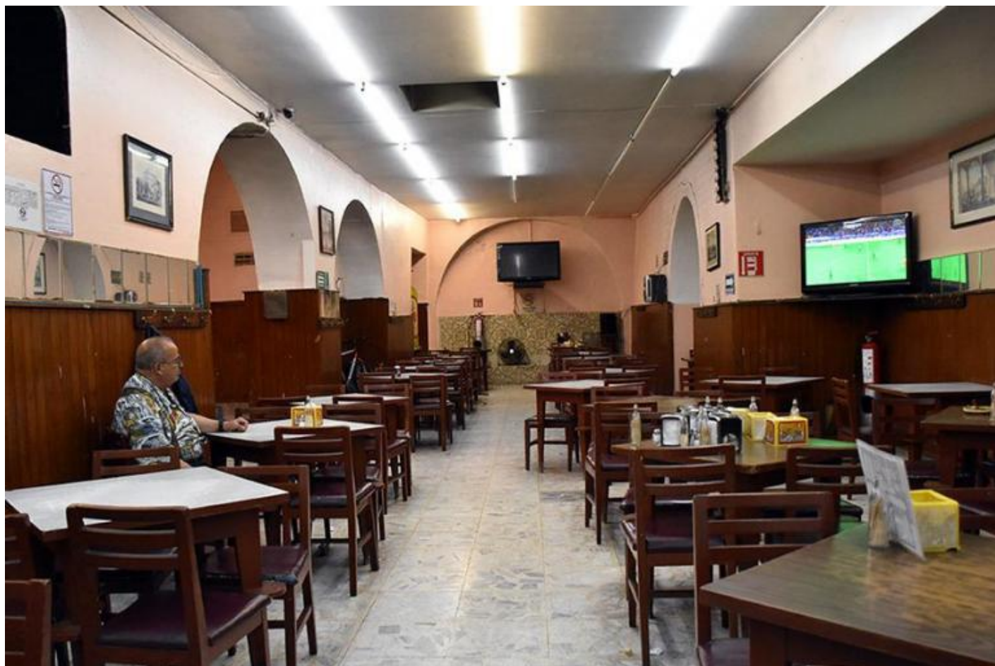
Cantina La Montejo, Città del Messico.