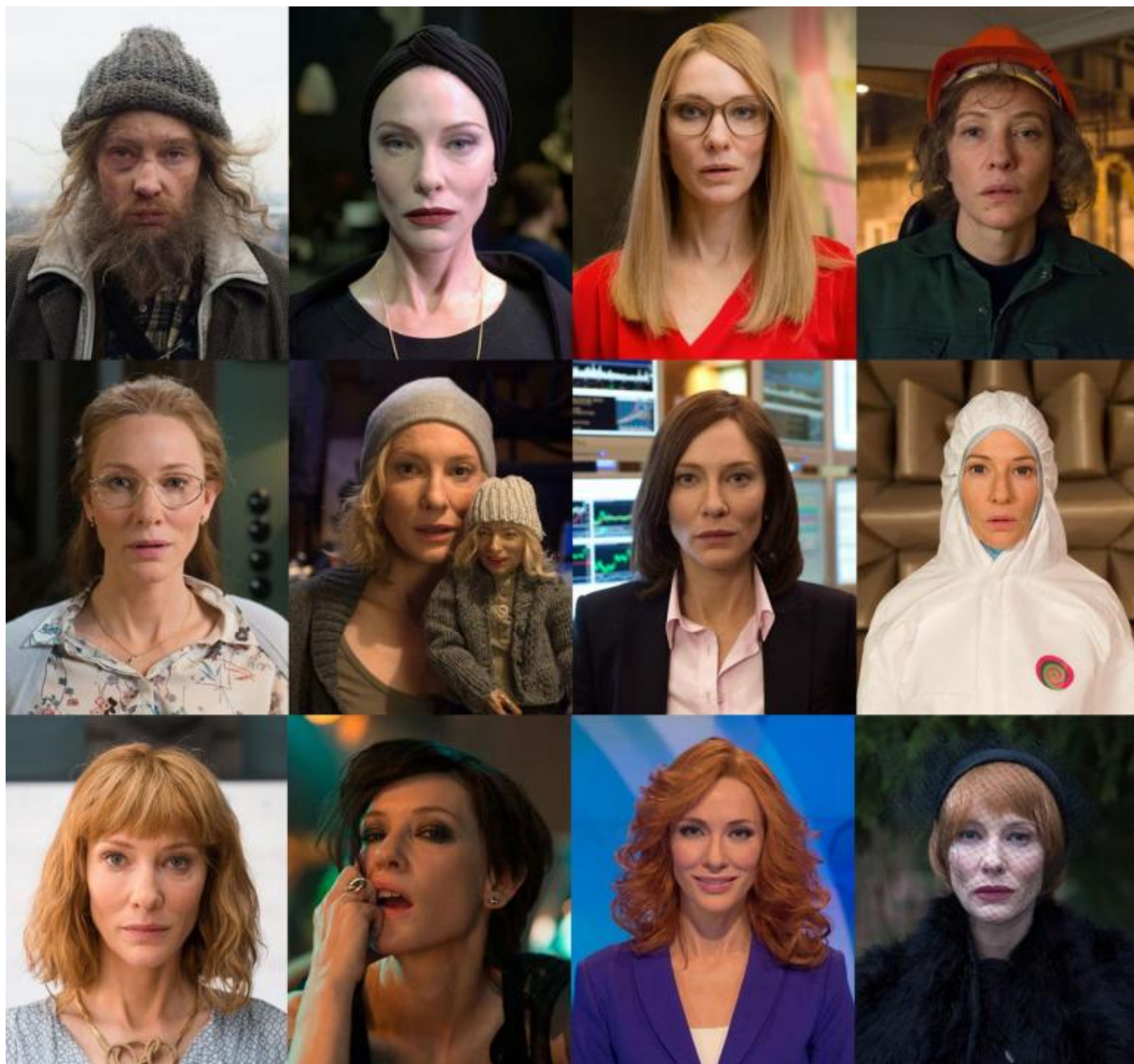
Julian Rosefeldt, Manifesto, 2015 © Julian Rosefeldt and VG Bild-Kunst, Bonn 2018.

Perché le installazioni, naturalmente, si calano in uno spazio che ne determina la distribuzione, le dimensioni, la sincronizzazione del suono, anzi, “ l’architettura della musica ”, perché deve essere considerato e armonizzato ciò che avviene su ciascun schermo. Come magistralmente esegue in Manifesto (2015), videoinstallazione multischermo attualmente allestita nel Palazzo delle Esposizioni di Roma, fino al 22 aprile 2019. Inoltre, fino al 24 marzo, nella Fondazione Memmo, sempre nella capitale (dove attualmente Julian Rosefeldt è borsista presso l’Accademia Tedesca di Villa Massimo), un altro suo lavoro è esposto nella collettiva Conversation piece / part V – non v’è più bellezza, se non nella lotta (Marinella Senatore, Rebecca Digne, Invernomuto, Julian Rosefeldt).