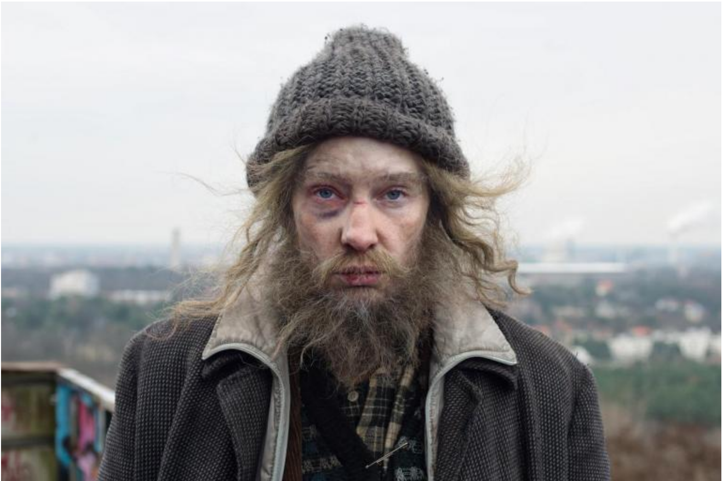
Julian Rosefeldt, Manifesto, 2015 © Julian Rosefeldt and VG Bild-Kunst, Bonn 2018.

nelle sale italiane. Trasposizione che, occorre dirlo, non rende affatto giustizia alla complessità dell'impresa, pressoché titanica, di Julian Rosefeldt. Rispondendo, infatti, a quelli che i ritmi della narrazione filmica impongono, il montaggio ha quasi svilito la ricercatezza e la raffinata articolazione dell'installazione, sbiadendo del tutto l'acme dell'intero lavoro fissato verso l'ottavo minuto della proiezione. Trasferimento che ha creato un "prodotto" che, in qualche misura, ha messo in crisi anche le categorie del cinema stesso, se degli articoli del settore lo hanno, difatti, definito "genere: drammatico, sperimentale". L'unico punto di forte contatto tra la versione cinematografica e la videoinstallazione, distinguibile con incontestabile forza in entrambi, è la potenza dell'incommensurabile Cate Blanchett. Nonostante l'artista tedesco sia ben conscio del rischio che la presenza della (giustamente) vincitrice, per ben due volte, del premio Oscar possa fagocitare i video, è entusiasta della partecipazione perché consente di raggiungere, senza altro, pubblici diversi e nuovi e porli in contatto con quest'universo, attraverso scritti di cui probabilmente non sono al corrente.