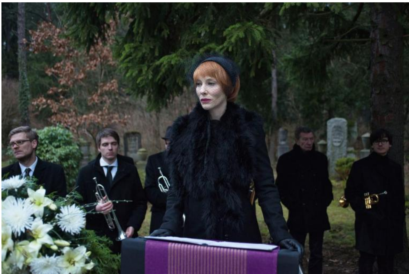
Julian Rosefeldt, Manifesto, 2015 © Julian Rosefeldt and VG Bild-Kunst, Bonn 2018.