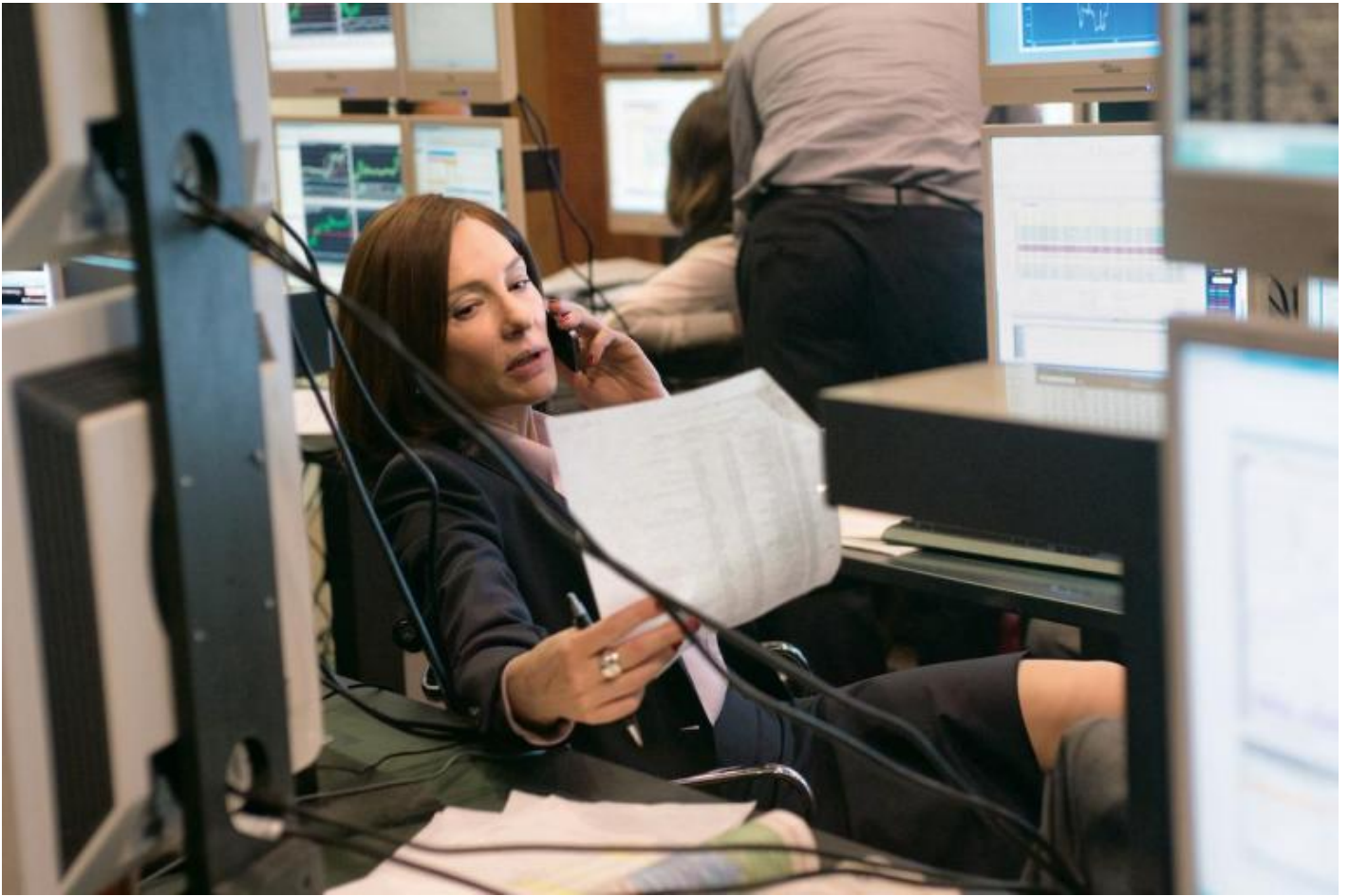
Julian Rosefeldt, Manifesto, 2015 © Julian Rosefeldt and VG Bild-Kunst, Bonn 2018.

Presentata per la prima volta all'ACMI - Australian Centre for the Moving Image di Melbourne nel 2015, la videoinstallazione Manifesto ha radicalmente annullato l'architettura del piano nobile del Palazzo delle Esposizioni, cancellando la percezione della rotonda centrale, lasciando le quattro colonne centrali, non visibili per l'intera altezza. La bellezza e la poesia di questo lavoro sono riposte nell'abilità dell'attrice, che riesce a interpretare tredici distinti personaggi, con altrettante inflessioni linguistiche dissimili, calati nello stesso numero di differenti realtà, ricche di dettagli e puntuali frammenti; ma sono riposte anche, e soprattutto, nella ricchezza delle immagini e nell'accurata ricerca dei testi compiuta dall'artista, mediante i quali ha ripercorso, e ricostruito, i movimenti artistici che hanno attraversato il XX secolo, con incursioni anche sul Cinema e sull'Architettura. Egli ha, collazionato cinquanta scritti, i più grandi e importanti proclami teorici, politici, e rivoluzionari di artisti, compositori, architetti, cineasti, del secolo scorso.