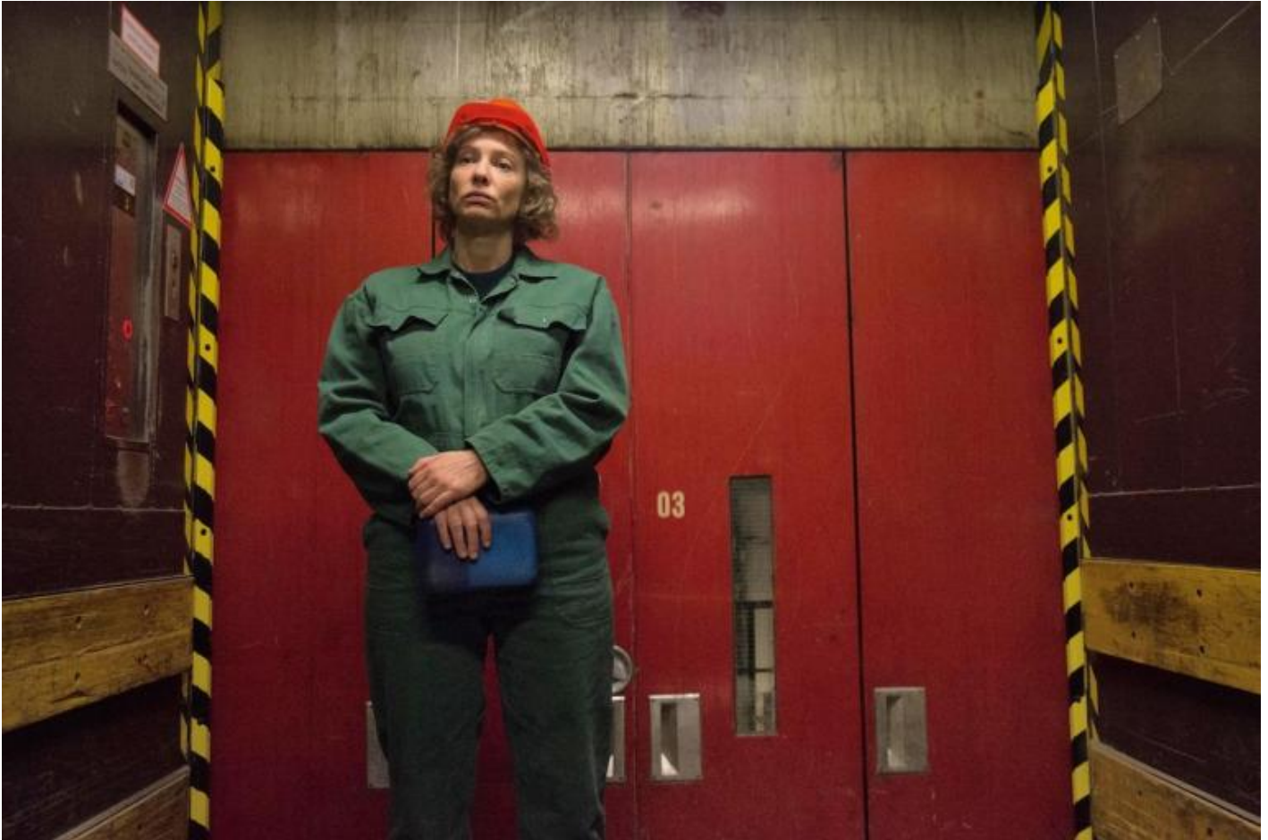
Julian Rosefeldt, Manifesto , 2015 © Julian Rosefeldt and VG Bild-Kunst, Bonn 2018.

Marx e Friedrich Engels, del 1848: "il Prologo , l'inizio, la miccia, di tutto quello che in seguito è accaduto nel Novecento. Non essendo stato tracciato un percorso rigido, lo spettatore può liberamente costruirsi la sua sequenza, decidendo, di volta in volta, davanti a quale personaggio sedersi e quale situazione ammirare. Ad affascinare, sono le ambientazioni, le architetture, elevate a co-protagoniste, e i personaggi scelti per ogni contesto, cui si accompagnano riprese dall'alto, frontali o di spalle.