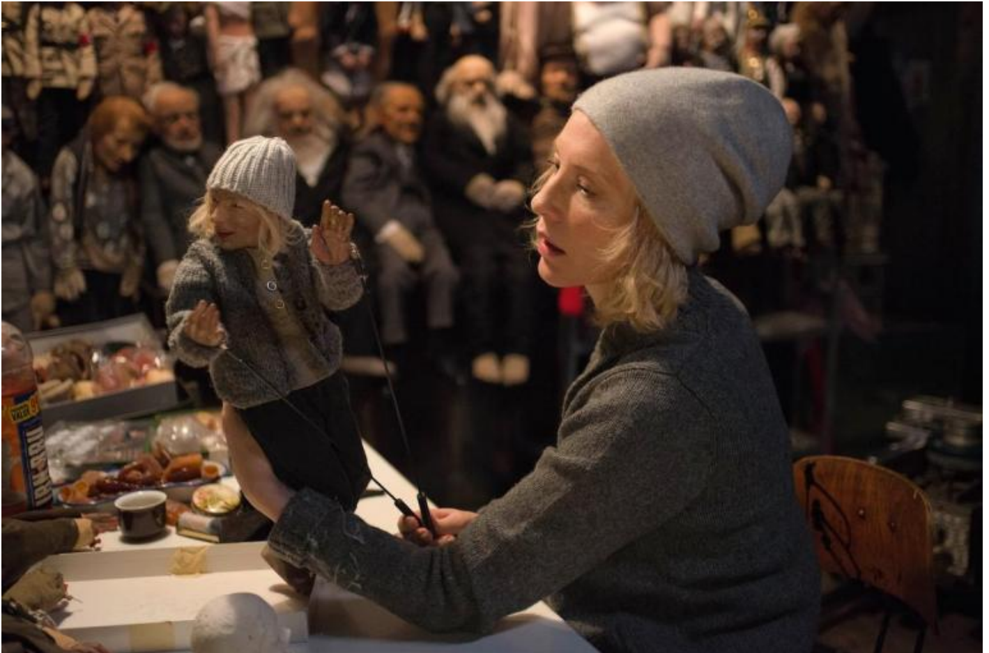
Julian Rosefeldt, Manifesto, 2015 © Julian Rosefeldt and VG Bild-Kunst, Bonn 2018.

Parte della Trilogy of Failure (2004/2005), The Soundmaker è un'installazione a tre canali che illustra altrettante diverse ambientazioni, con inquadrature aeree e frontali, dove sono descritti alcuni rituali quotidiani personali e il loro reiterarsi, nonostante i risultati negativi raggiunti. L'azione principale, svolta nello schermo centrale attraverso gesti minimi e piccoli oggetti, è completata dai due schermi laterali che mostrano la procedura della creazione del suono. Svelando i meccanismi del cinema, l'artista invita a riflettere sui meccanismi della vita stessa.