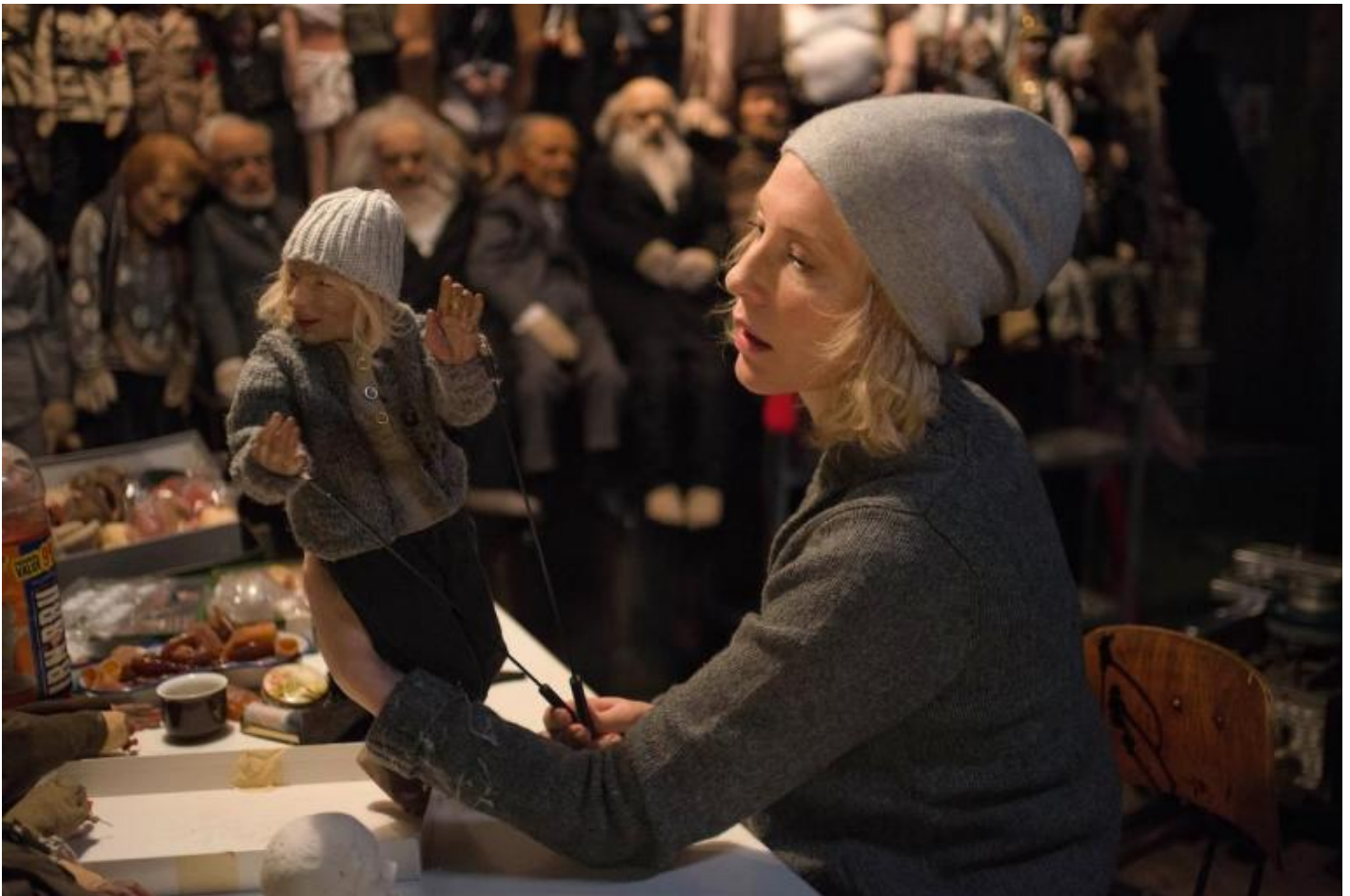
Julian Rosefeldt, Manifesto, 2015 Â© Julian Rosefeldt and VG Bild-Kunst, Bonn 2018.

Parte della Trilogy of Failure (2004/2005), The Soundmaker Ã unâ??installazione a tre canali che illustra altrettante diverse ambientazioni, con inquadrature aeree e frontali, dove sono descritti alcuni rituali quotidiani personali e il loro reiterarsi, nonostante i risultati negativi raggiunti. Lâ??azione principale, svolta nello schermo centrale attraverso gesti minimi e piccoli oggetti, Ã completata dai due schermi laterali che mostrano la procedura della creazione del suono. Svelando i meccanismi del cinema, lâ??artista invita a riflettere sui meccanismi della vita stessa.