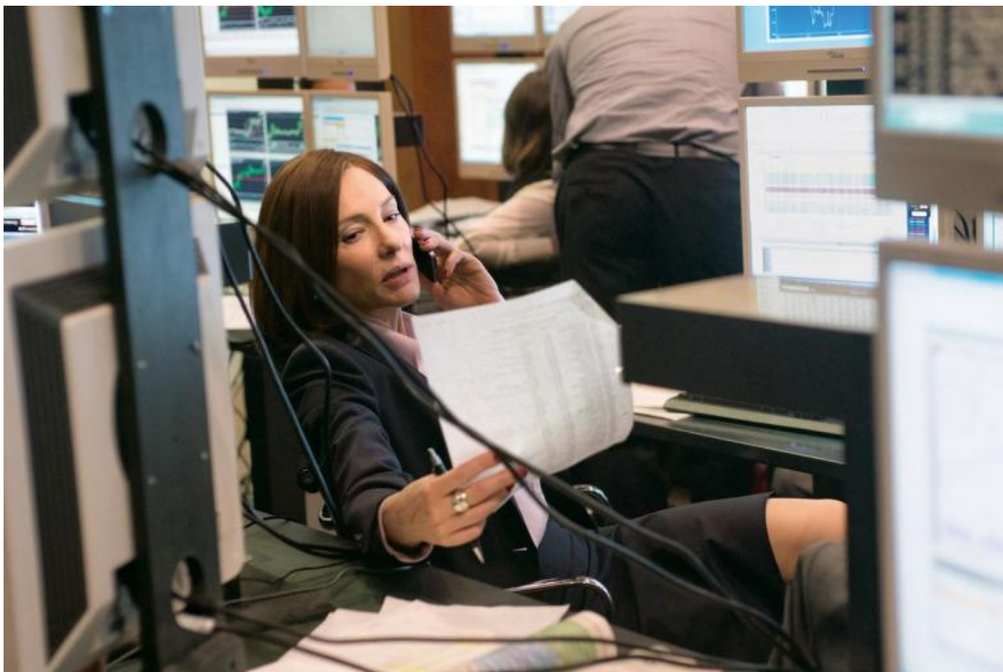
Julian Rosefeldt, Manifesto, 2015 © Julian Rosefeldt and VG Bild-Kunst, Bonn 2018.

Presentata per la prima volta all'ACMI – Australian Centre for the Moving Image di Melbourne nel 2015, la videoinstallazione Manifesto ha radicalmente annullato l'architettura del piano nobile del Palazzo delle Esposizioni, cancellando la percezione della rotonda centrale, lasciando le quattro colonne centrali, non visibili però per l'intera altezza. La bellezza e la poesia di questo lavoro sono riposte nell'abilità dell'attrice, che riesce a interpretare tredici distinti personaggi, con altrettante inflessioni linguistiche dissimili, calati nello stesso numero di differenti realtà, ricche di dettagli e puntuali frammenti; ma sono riposte anche, e soprattutto, nella ricchezza delle immagini e nell'accurata ricerca dei testi compiuta dall'artista, mediante i quali ha ripercorso, e ricostruito, i movimenti artistici che hanno attraversato il XX secolo, con incursioni anche sul Cinema e sull'Architettura. Egli ha, così, collazionato cinquanta scritti, i più grandi e importanti proclami teorici, politici, e rivoluzionari di artisti, compositori, architetti, cineasti, del secolo scorso.