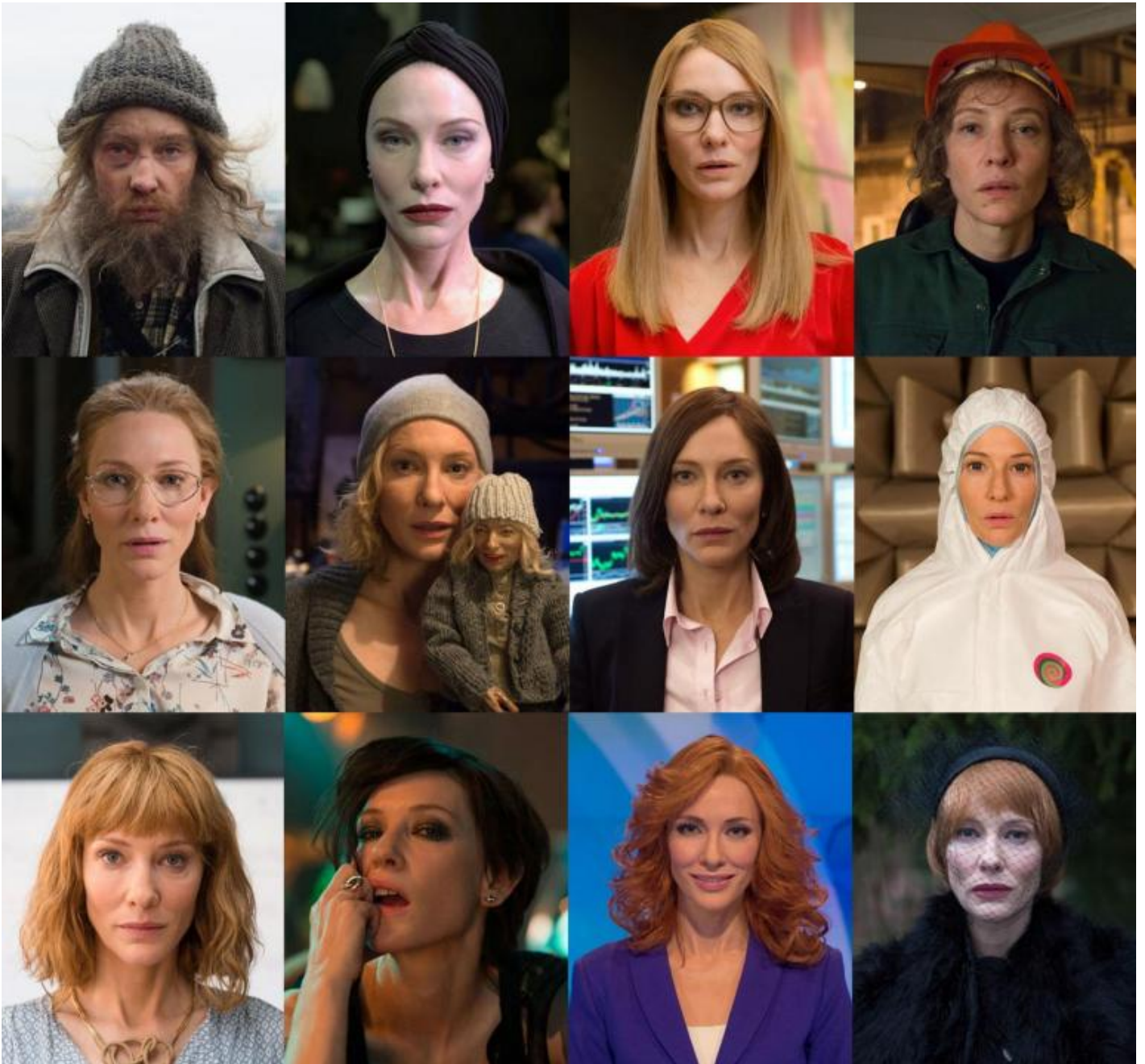
Julian Rosefeldt, Manifesto, 2015 © Julian Rosefeldt and VG Bild-Kunst, Bonn 2018.

Perché le installazioni, naturalmente, si calano in uno spazio che ne determina la distribuzione, le dimensioni, la sincronizzazione del suono, anzi, l'architettura della musica , perché deve essere considerato e armonizzato ciò che avviene su ciascun schermo. Come magistralmente esegue in Manifesto (2015), videoinstallazione multischermo attualmente allestita nel Palazzo delle Esposizioni di Roma, fino al 22 aprile 2019. Inoltre, fino al 24 marzo, nella Fondazione Memmo, sempre nella capitale (dove attualmente Julian Rosefeldt è borsista presso l'Accademia Tedesca di Villa Massimo), un altro suo lavoro è esposto nella collettiva Conversation piece / part V non è bellezza, se non nella lotta (Marinella Senatore, Rebecca Digne, Invernò, Julian Rosefeldt).