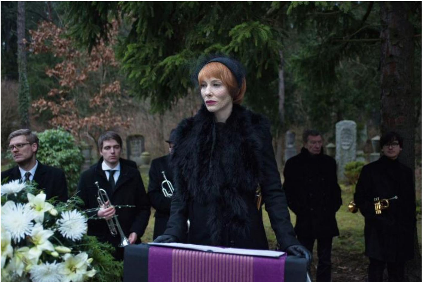
Julian Rosefeldt, Manifesto, 2015 © Julian Rosefeldt and VG Bild-Kunst, Bonn 2018.