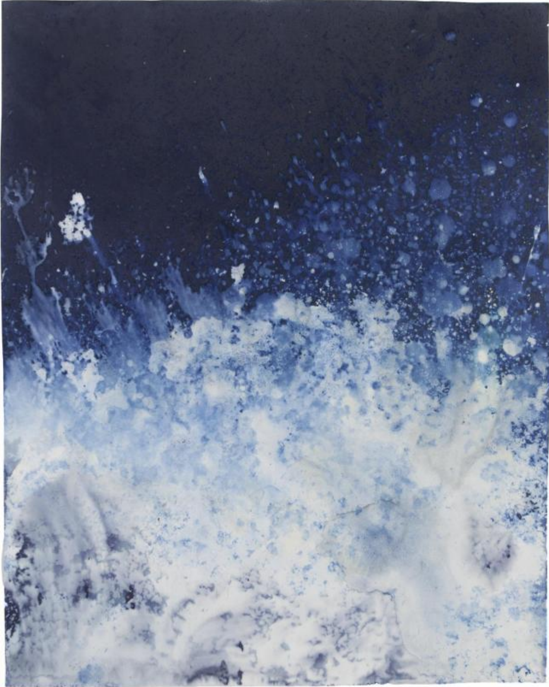
Ecotone #161 (Yossi Milo Gallery Sidewalk, New York, NY 03.13.17, Snow, Salt from Parking Lot Employee, Draped Against Window); 24x19".