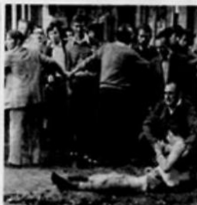
BRESCIA - Una dei feriti viene soccorso da un volontario.

Brescia, 29. - Una strage che ha ucciso sei persone e ferito 65, tra cui un operaio cremonese, è avvenuta venerdì sera in piazza della Loggia di Brescia. L'esplosione è stata causata da un ordigno a tempo, potentissimo, che è esploso durante un comizio antifascista. Il comizio era presieduto da un sindacalista, che stava parlando quando è avvenuta la deflagrazione. Due dei feriti sono gravissimi. Tra i ricoverati anche un operaio cremonese che lavora alla O.M. (Officina Meccanica). Le testimonianze sono drammatiche e paurose. Una lettera di minacce di «Ordine Nero» è stata trovata sul luogo dell'esplosione.