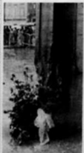
BRESCIA - La polizia italiana della manifestazione.

Brescia, 29. - Le indagini sono in corso. Tre sono breveschi, due di altra località della Lombardia. Accertamenti su una «500». Pochi minuti prima dell'esplosione un agente ha udito questa frase: «La facciano adesso?». L'ordigno era forse stato composto con due chili di nitro.