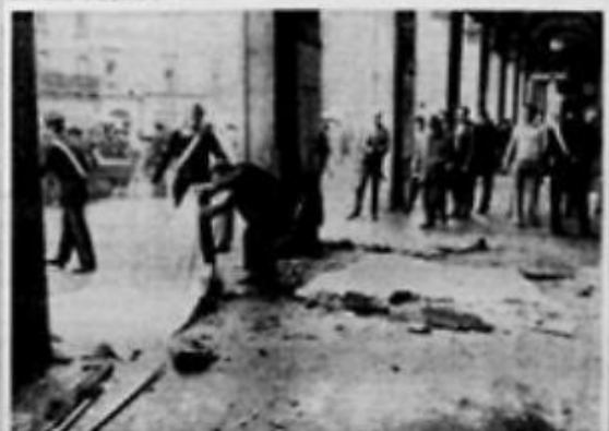
Il corteo di alcune delle attività degli agenti di un'attività di base.

BRIGATA NOME ARRESTATO A BRESCIA PUGILATO INCONTRO ARRESTATO UNO DEI CARI