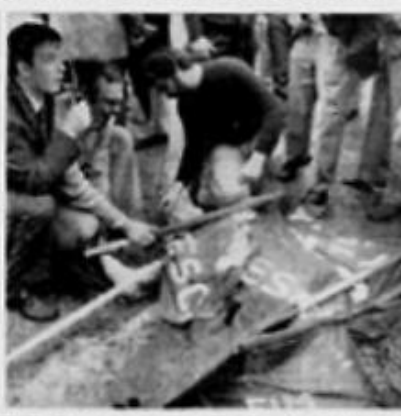
BRESCIA - Spostamenti di massa nel corso di una delle attività più antiche della manifestazione, che porta prima l'ordine del giorno.

Brescia, 29. - I feriti sono 65, di cui due sono in via di cura. Gli altri sono ricoverati negli ospedali. Tra i feriti ci sono sei morti. Un operaio cremonese, che lavora alla O.M., è tra i ricoverati. Le testimonianze sono drammatiche e paurose. Una lettera di minacce di «Ordine Nero» è stata trovata sul luogo dell'esplosione.