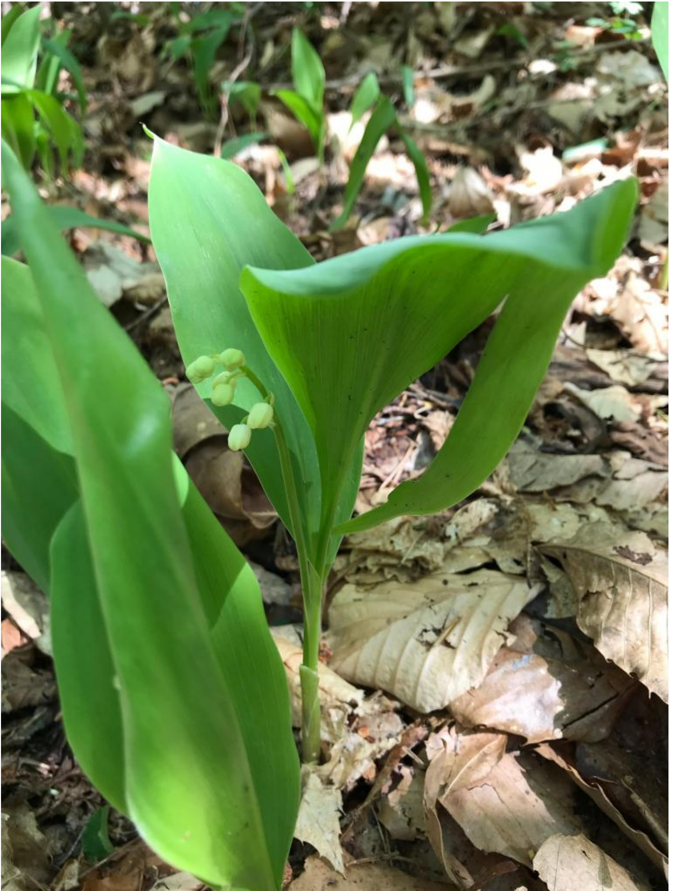
Mughetto fiore piccolo