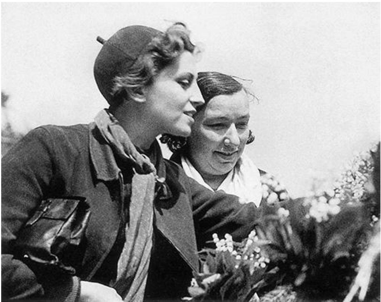
Gerda Taro compra dei mughetti, 1 maggio 1937

I mughetti – appena colti in mazzolini o distillati in flaconi – fanno tanto (come le violette) vecchia zia in veletta e sollecitano il nervo scoperto del patetico sentimentale. Ben venga dunque l'usanza francese di farne il fiore del primo maggio e, se non proprio di lotta, di promessa felicità. Potremmo anche noi sfilare oggi in corteo sfoggiando un «brin de muguet» e canticchiando questa strofa del Discours des fleurs di George Brassens: