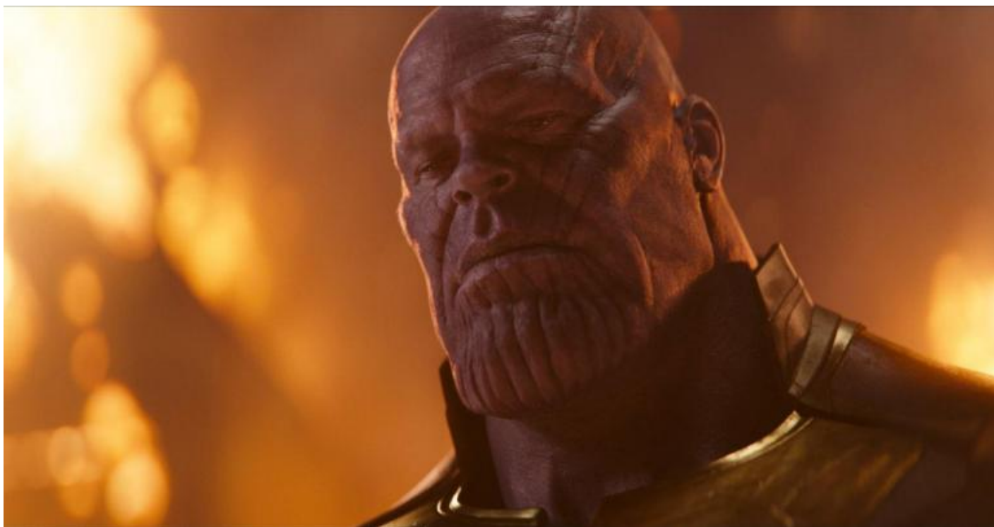
Thanos (Josh Brolin).

Il tema del film è il cambiamento che, inevitabilmente, porta alla morte. Non a caso l'arcinemico è Thanos, il cui nome deriva da Thánatos , la personificazione della Morte nella mitologia greca, un personaggio inventato dal fumettista americano Jim Starlin durante una lezione di psicologia nel '72. Thanos uccide i personaggi in due modi: o affrontandoli in campo aperto o, in modo più sottile, costringendoli a farsi carico delle loro responsabilità. Non è mosso da obiettivi personali, ma è la personificazione della sordità del mondo ai nostri desideri giovanili. Come ha detto Neil deGrasse Tyson «L'universo non ha alcun obbligo di avere un senso per noi».