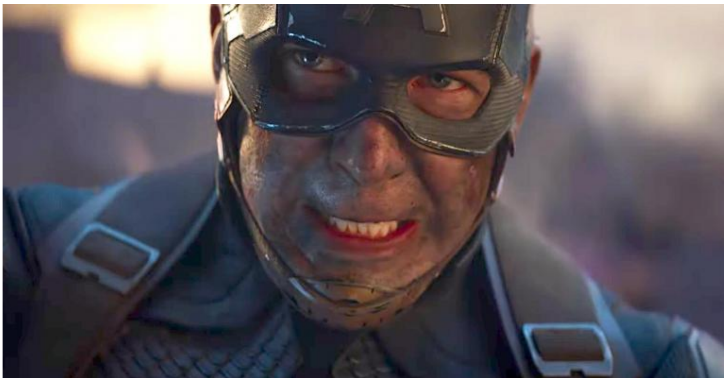
Capitan America/Steve Rogers (Chris Evans).

La cosa interessante è che in questo crepuscolo degli dei dell'adolescenza, le donne sembrano uscirne immuni (a parte Black Widow, che essendo l'eroina femminile più datata viene prontamente sacrificata). A differenza dei maschi, le nuove eroine sembrano in grado di coniugare forza e responsabilità, maturità e vitalità, equilibrio e determinazione (da Carol Danvers alias Captain Marvel a Frigga, da Valkyrie alle Dora Milaje di Wakanda). Pepper Potts (Gwyneth Paltrow) completa la sua parabola da segretaria a CEO delle Stark Industries. Il mondo femminile è il vero vincitore della battaglia finale dal quale gli uomini escono, quando non ammaccati fisicamente, malconci emotivamente. I maschi non crescono, al massimo invecchiano, ingrassano, e muoiono; al contrario le donne fioriscono, maturano e realizzano se stesse.