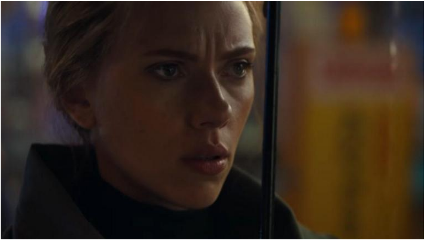
Black Widow/Natasha Romanoff (Scarlett Johansson).

La fine simbolicamente pi 1 significativa di tutte per 2 \tilde{\Lambda} quella di Capitan America (Chris Evans) che rinuncia al suo ruolo di combattente. Un supereroe muore non solo quando il suo alter-ego, in questo caso Steve Rogers, viene meno, ma soprattutto quando la sua immagine ideale viene tradita. Anche le maschere hanno un 1 anima, spesso pi 1 viva della persona che li incarna momentaneamente.