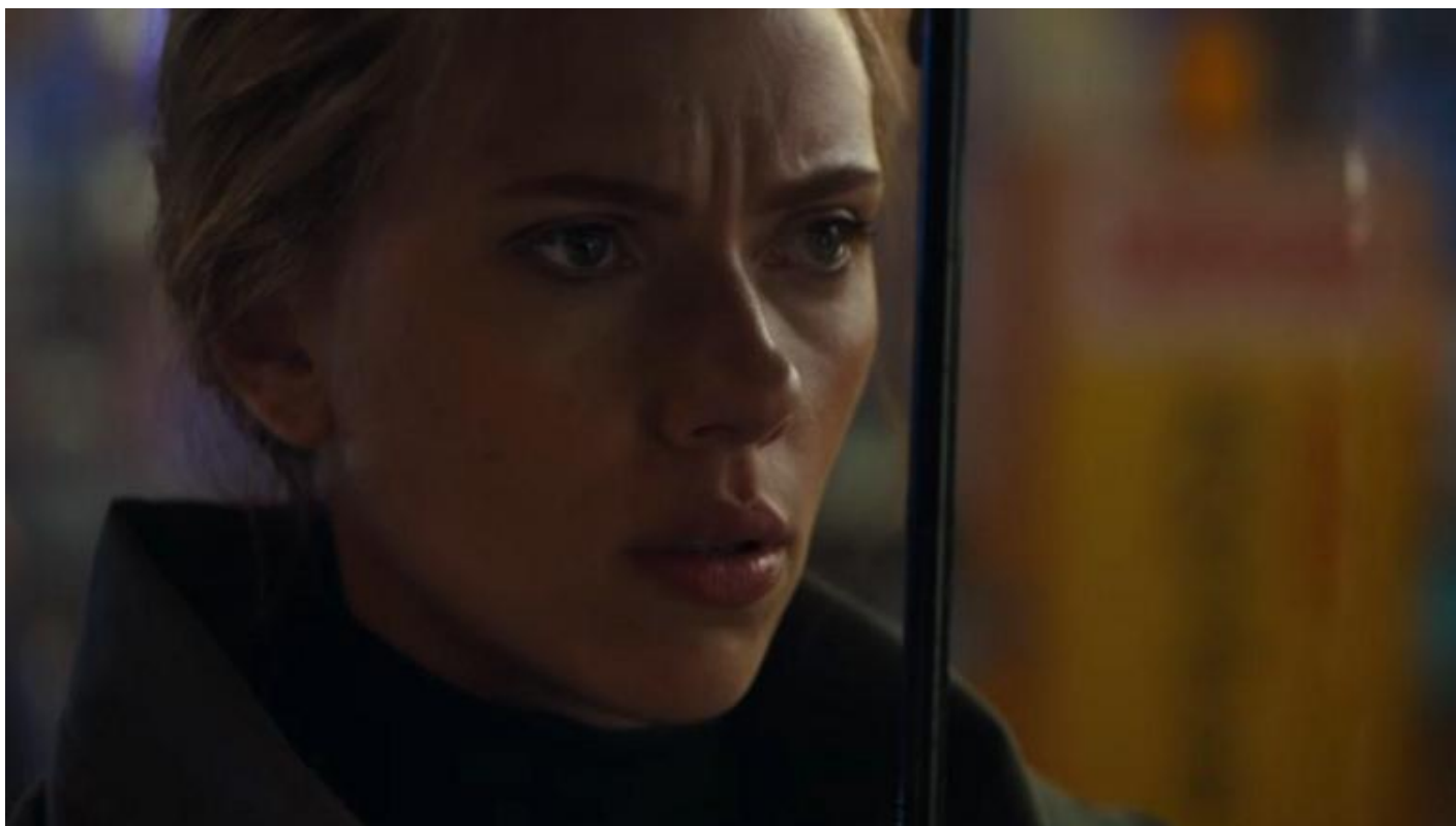
Black Widow/Natasha Romanoff (Scarlett Johansson).

La fine simbolicamente più significativa di tutte però è quella di Capitan America (Chris Evans) che rinuncia al suo ruolo di combattente. Un supereroe muore non solo quando il suo alter-ego, in questo caso Steve Rogers, viene meno, ma soprattutto quando la sua immagine ideale viene tradita. Anche le maschere hanno un'anima, spesso più viva della persona che li incarna momentaneamente.