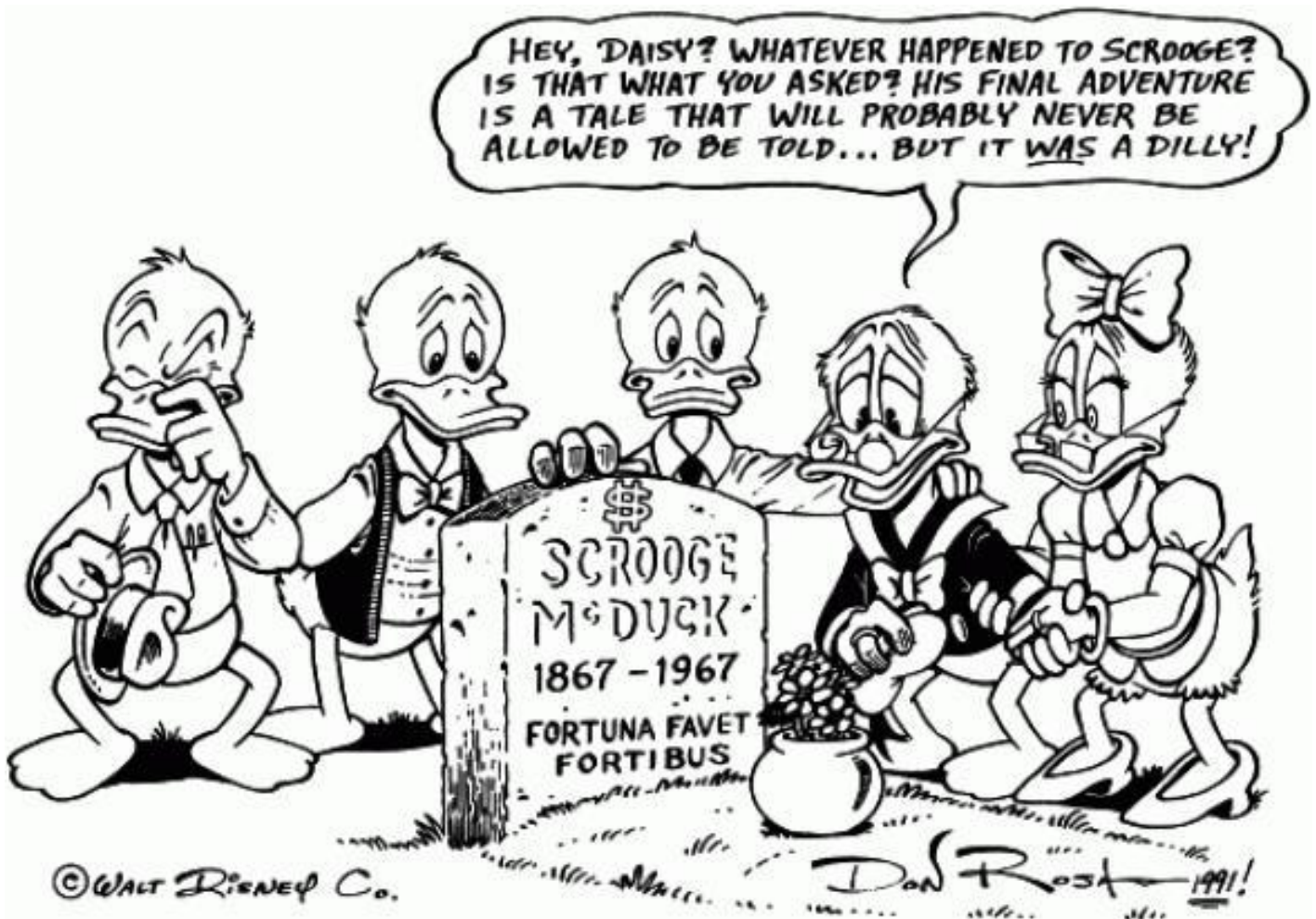
Don Rosa, "Hey, Daisy, Whatever Happened to Scrooge?" (1991).

Avengers: Endgame mette in scena il passaggio dall'aggressività gratuita, ma vitale dell'adolescenza alla consapevolezza responsabile, ma in discesa della maturità. Nell'intreccio tra schermo e realtà, lo spettatore adolescente che nel 2008 si era riconosciuto nel playboy di Ironman e nel mantra "Hulk Spacca!" deve oggi fare i conti con la vita. E sono conti salati. I sentimenti si traducono in responsabilità. Oltre al funerale di Tony Stark che si immola per la sua famiglia, vi è la morte del grande Achille della tradizione della Marvel: Capitan America. E muore, non perché il suo personaggio sia ucciso, ma perché si sottrae al suo destino, che è appunto, quello di non mollare mai.