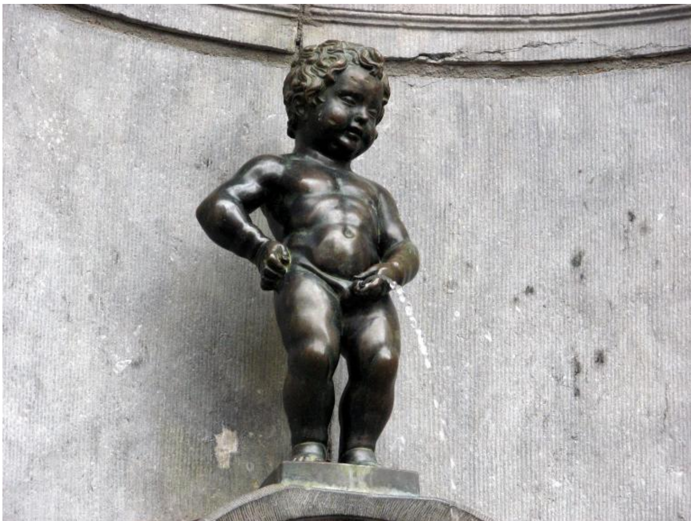
Jérôme Duquesnoy il Vecchio, “Manneken-Pis” (1619), Bruxelles.

Figure piscianti ha già ottenuto un certo successo in Francia (dove è pubblicato da Macula) e anche grazie alla traduzione americana per i tipi di David Zwirner. Scriverne ora, al momento della sua pubblicazione in italiano (UTET, 2019; traduzione di Rinaldo Censi), permette di notare come una buona parte dell’attenzione venga dal suo soggetto, considerato tabù per un saggio di storia dell’arte. In realtà Figure Piscianti dimostra paradossalmente il contrario, specialmente nei primi capitoli. Prendendo come punto di partenza la fontana del Manneken-Pis a Bruxelles (commissione del 1619 a Jérôme Duquesnoy il Vecchio), Lebensztejn imbastisce un’indagine minuziosa sulla circolazione e la trasmissione della figura del puer mingens . In questa prima fase, la ricognizione sul motivo e sulla sua manifestazione fisica (spesso come statua di una fontana) tende a rivelare e a commentare, confrontandole, le fonti letterarie. Nel dettaglio, particolare importanza è attribuita alla simbologia contenuta nell’ Hypnerotomachia Poliphili di Francesco Colonna (1499), e il sogno esoterico di Polifilo, del resto, così fitto di emblemi da decifrare, non può non essere il punto di partenza ideale per questa programmatica investigazione iconologica.