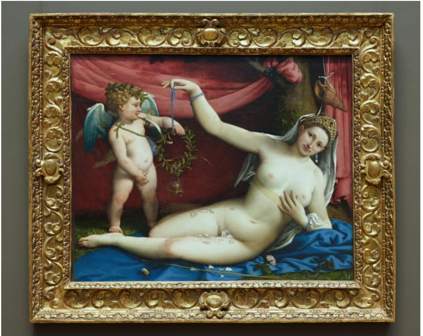
Lorenzo Lotto, “Venere e Cupido” (1525-30), New York, Metropolitan Museum.

Trescore un putto visto dal basso per fargli prendere di mira, col suo getto, l'acquasantiera. Tuttavia, nota Lebensztejn, il liquido non è dorato, bensì verde come il motivo vegetale che lo circonda – verde, soprattutto, «per analogia con il leone verde, la rugiada degli alchimisti» (p. 35). Gesto inappropriato? Forse, ma l'umorismo, il divertimento basso, non annulla il sotto testo alchemico: semplicemente, i due aspetti si mescolano assieme.