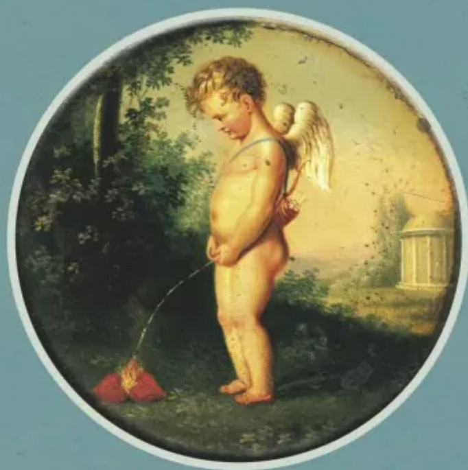
Figure piscianti 1280-2014