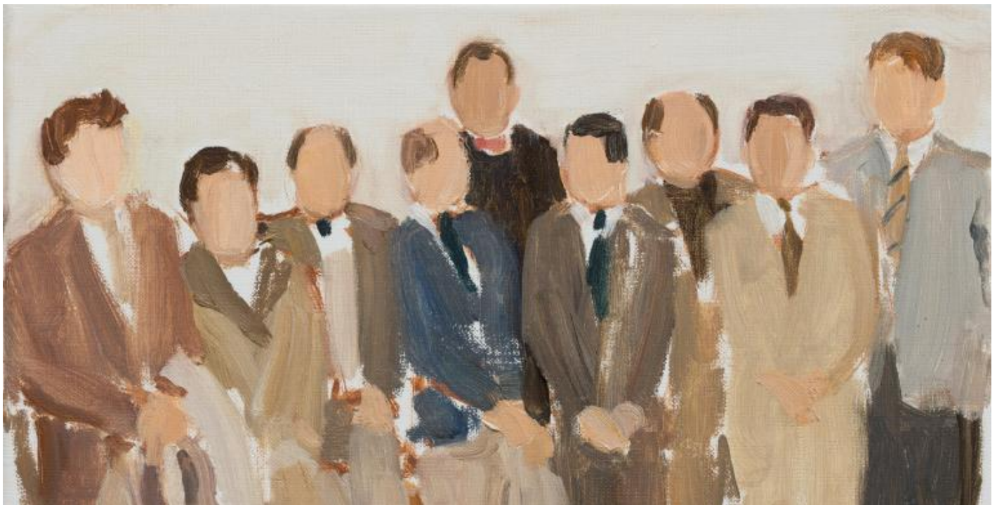
Opera di Gideon Rubin.

Così accade anche che i racconti ambientati intorno a un tavolo da gioco finiscano con l'avere come argomento di conversazione e come tessitura riflessiva proprio il gioco. Ma in contrasto con il gioco della roulette e delle carte, che ha un legame bizzarro e imprevedibile col destino, un altro gioco, quello del prestigiatore e del giocoliere, introduce una nuova dimensione: siamo nella storia che racconta Rastelli, “l'impareggiabile e indimenticabile giocoliere”, una storia che ha per protagonista un altro famoso giocoliere, invitato dal Sultano a Costantinopoli, e il suo mirabile rapporto con una palla, unico strumento dei suoi spettacoli. Il racconto di quell'esibizione porta il lettore nello spazio di una metafisica leggerezza, quasi d'intonazione zen .