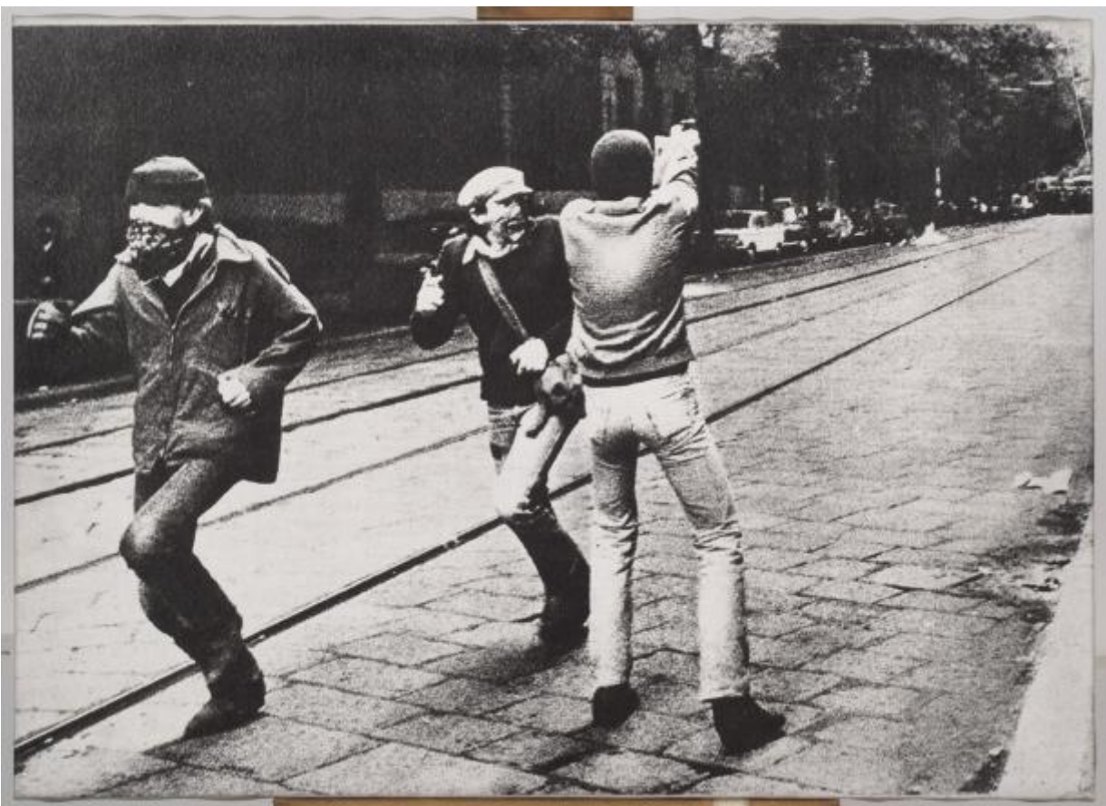
Mimmo Rotella, Scontro armato , 1980

Un diverso caso di prelievo e riuso dello scatto di via De Amicis si ritrova in Lui piange (1977), opera su tela emulsionata con interventi pittorici dell'artista toscano Gianni Bertini (1922-2010) che, a differenza di Rotella, modifica e riambienta la foto originaria attraverso un processo di montaggio, in cui immagini di natura e provenienza eterogenea vengono accostate, correlate, giustapposte, al fine di creare soluzioni visive inedite, altamente traumatizzanti. L'opera fa parte del ciclo Abbaco , titolo volutamente desueto scelto da Bertini per indicare il desiderio di ricominciare un discorso partendo dalla base, dall' abc , il cui fulcro centrale, seguendo le parole dell'artista, sia la rappresentazione del nucleo più elementare "l'uomo, la donna e il bambino in rapporto a una società dove l'orrore è quotidiano". La foto degli scontri milanesi, al pari delle altre immagini di catastrofi o guerre introdotte da Bertini in questa serie, viene ad assumere un valore assoluto di violenza, autodistruzione, morte.