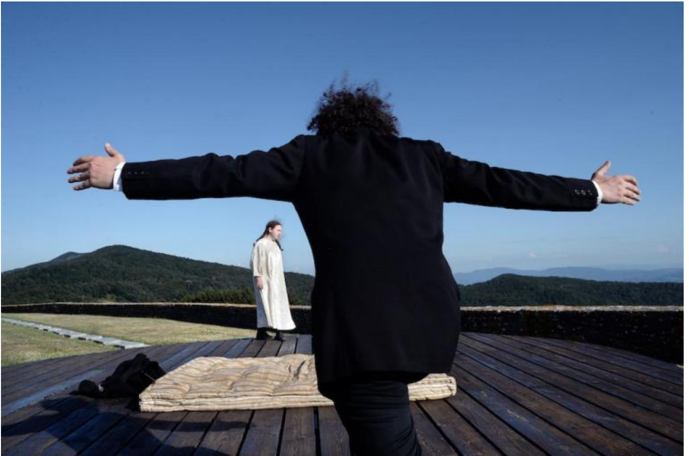
Pro e contra Dostoevskij, ph. Franco Guardascione.

Dostoevskij: il male, la volontà di potenza prima di Nietzsche, l'abisso di libertà dell'uomo che, abolito Dio, forza i limiti dell'arbitrio; e, di contro, l'ansia di senso, di assoluto, di legame, di religione, di fratellanza. L'abisso della tentazione della libertà e l'indagine sul bisogno di verità, di consistenza, di argini alle seduzioni, di silenzio, di ascolto interiore.