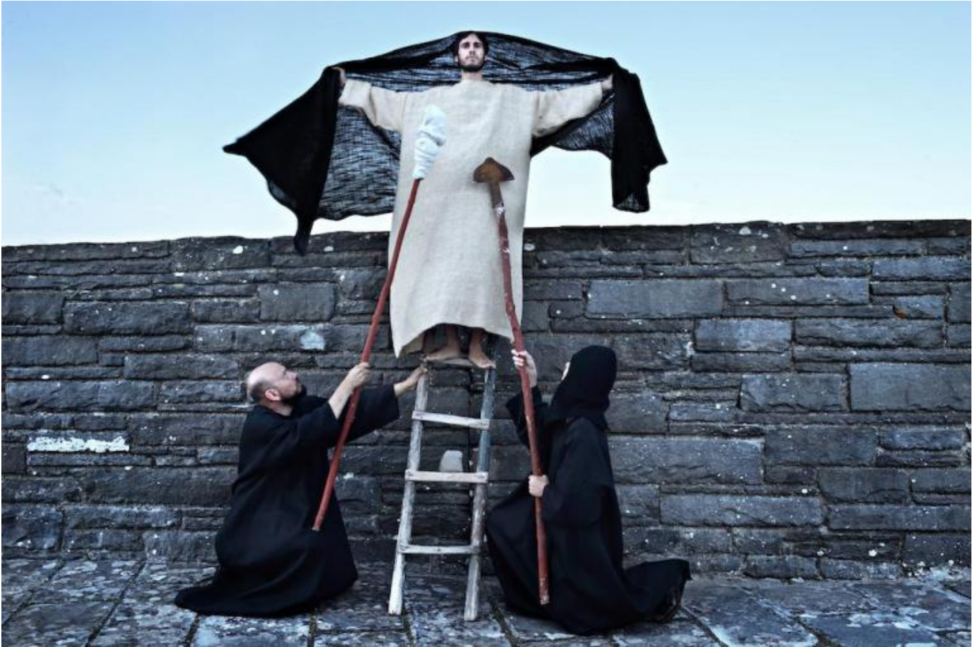
Pro e contra Dostoevskij, ph. Franco Guardascione.

Lo spettacolo si chiude con un'apertura, dopo i baci del tradimento, della rottura, del rifiuto del Cristo, un bacio all'Inquisitore e uno al protagonista, rivestito dello stesso rosso manto, continuando a dibattersi nella domanda su cosa avvenga se tutto è permesso. Il finale si dilata in una scena dolcissima, dall'altra parte della costruzione centrale del cimitero, verso il sole che tramonta tra i monti verso il lago Bilancino sullo sfondo, con il sogno in volo dell'uomo ridicolo e la scoperta, il desiderio, l'affermazione poetica che il male non può essere lo stato normale degli uomini.