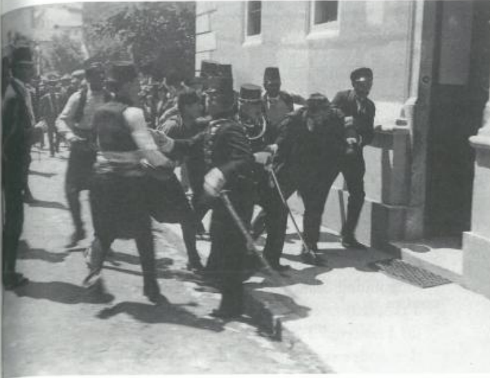
L'arresto di Gavrilo Princip