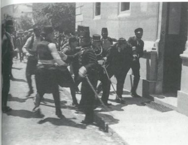
L'arresto di Gavrilo Princip