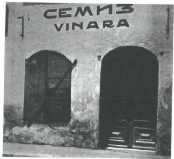
La vineria Semiz