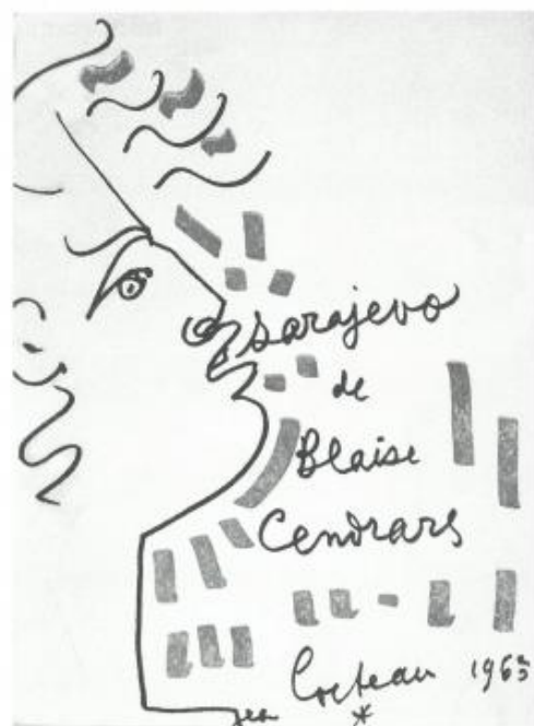
Jean Cocteau, copertina di Sarajevo, éd. Théâtre Universitaire de Manille, febbraio 1964