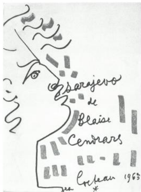
Jean Cocteau, copertina di Sarajevo, éd. Théâtre Universitaire de Marseille, febbraio 1964 (Collezione privata)