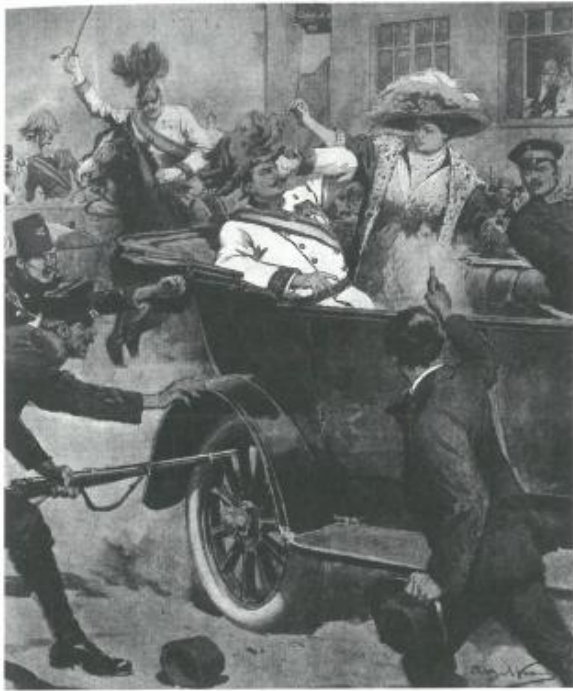
«Due colpi di pistola, il 28 giugno 1914, a Sarajevo: inizia tutto là»