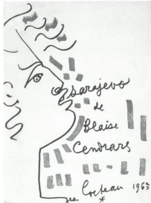
Jean Cocteau, copertina di Serajevo, éd. Théâtre Universitaire de Marseille, febbraio 1964