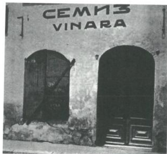
La vineria Semiz