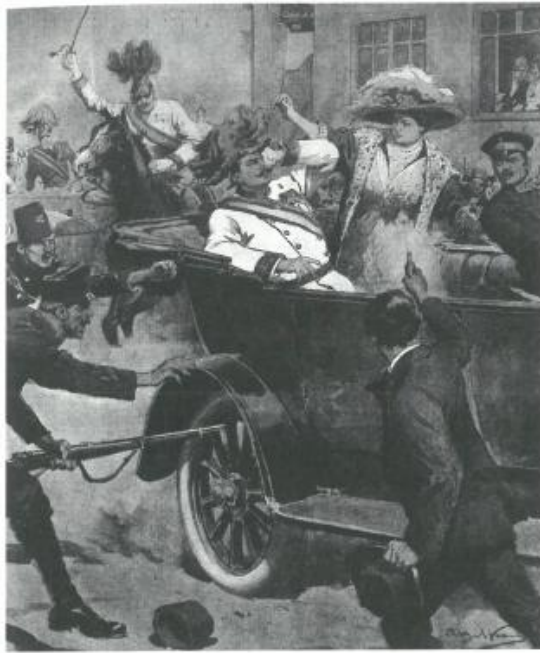
«Due colpi di pistola, il 28 giugno 1914, a Sarajevo: inizia tutto là»