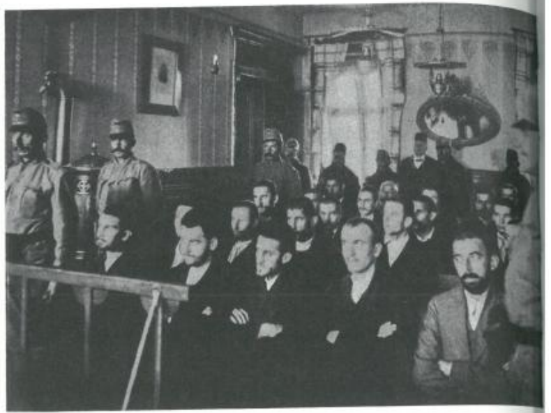
Il processo dei congiurati