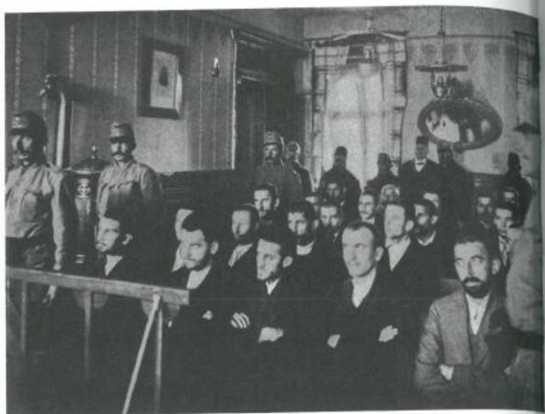
Il processo dei congiurati