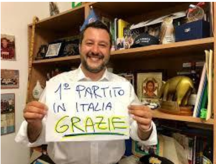
La libreria di Salvini a via Bellerio

Si trattava dell'ammirata biografia dedicatagli dal giornalista Rai Gennaro (Genny) Sangiuliano, già in quota post missina trasmutatasi in sovranista e come tale, pur con tutti i pregressi meriti, promosso direttore del Tg2. Anche la Rai, come il petrolio, è un interessante indicatore di tendenze che a volte la attraversano, altre la trascendono, altre ancora anticipano gli sviluppi del potere, e in questo senso è significativo che a presiedere l'azienda di viale Mazzini sia stato imposto, pure con qualche difficoltà, un giornalista come Marcello Foa, le cui opinioni sono state spesso ospitate da "Russia Today", emittente certo non ostile al regime.