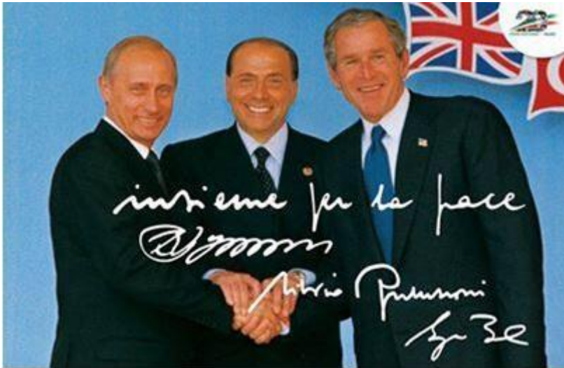
Souvenir berlusconiano dopo il vertice di Pratica di Mare

Allo stesso modo, nonostante l'enfatico e affannoso pavoneggiamento in cui Berlusconi si esibiva a ogni piè sospinto, credo possa essere rivisto anche il giudizio con il quale lui per lui fu liquidato come pura fuffa il personale intervento del Cavaliere per scongiurare nel 2008 l'invasione russa della Georgia: "Putin - non perdeva occasione di proclamare Berlusconi, anche durante le cene eleganti - mi aveva rivelato le sue intenzioni di attaccare Tbilisi: voleva letteralmente appendere per il collo Saakhasvili. Se ciò fosse accaduto, sarebbe stata la guerra tra Russia ed Occidente ed è merito mio se le cose sono andate diversamente". Ecco, stai a vedere che fu veramente così!