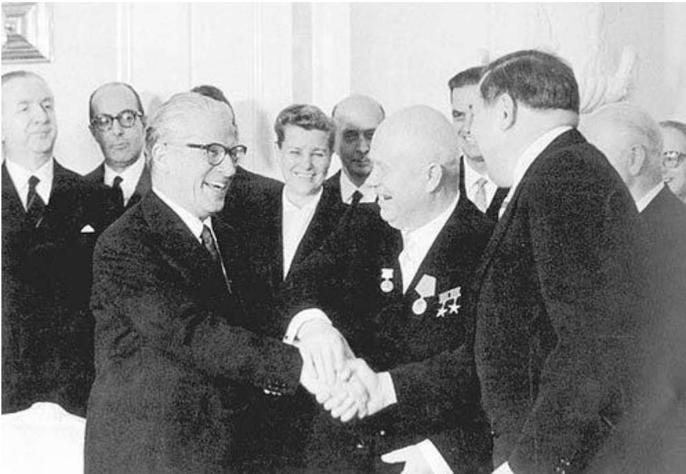
Il controverso viaggio di Gronchi a Mosca. Stretta di mano con Krusciov.