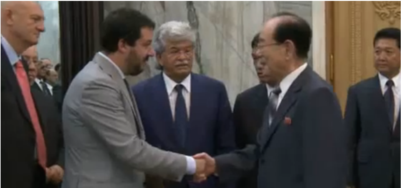
Salvini nella Corea del Nord con il senatore Razzi

Anche grazie a questo consenso gli è consentito di affermare con la massima tranquillità e naturalezza ciò che sui giornali europei ha fatto un certo scalpore, e cioè che la democrazia liberale è obsoleta, invecchiata, superata. A metterla piatta piatta, come forse non si dovrebbe, il risultato è che pochi in Russia, in pratica solo coloro che hanno a cuore i diritti umani e la correttezza delle istituzioni, si aspettano che Putin sia indulgente, mite, trasparente, democratico. La maggioranza, per il momento, oltre il 76 per cento, lo vuole come egli è: freddo e sicuro di sé, severo fino alla spietatezza, riflessivo ma sbrigativo, e maschio.