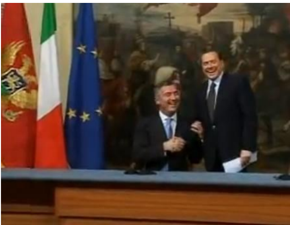
Berlusconi e il presidente montenegrino Djunkanic