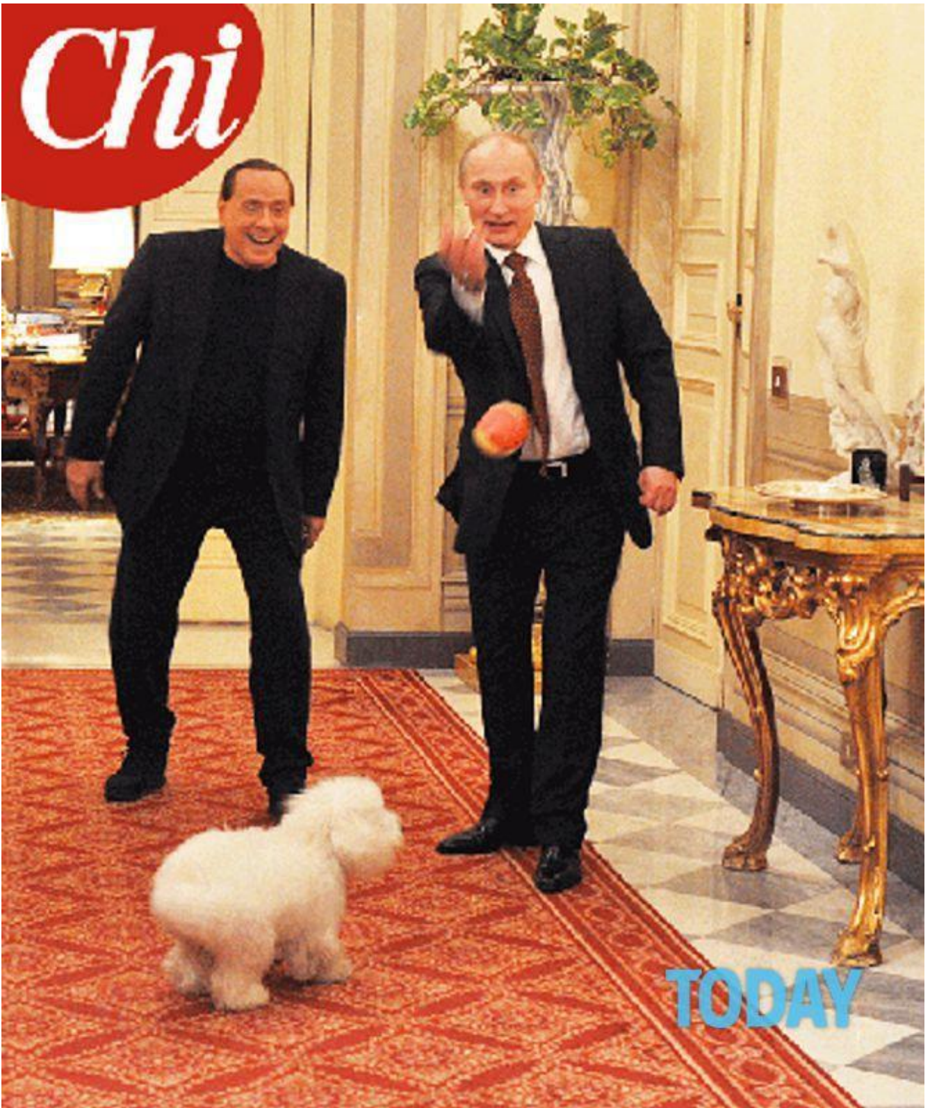
Sulla copertina di Chi Putin tira la palletta a Dudù