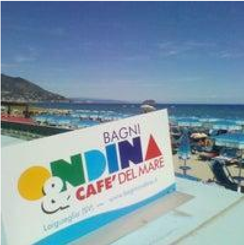
I bagni Ondina di Laigueglia

E già questo basterebbe ad accogliere il tutto con scetticismo. Ma la già intricata ed enigmatica vicenda del petrolio e del gas moscovita, con eventuale, preteso steccone pro-sovrانيا si è riprodotta generando in una settimanella la più scontata proliferazione di comprimari, complici, mestatori, procuratori d'affari, soci in accomandita, testimoni spontanei e tirati in ballo senza ragione, fino al titolare di un'agenzia di modelle russe e una bella ragazza, non modella ma impegnata nel putinismo militante, di cui si è letto che aveva aiutato i leghisti italiani e perciò era stata ricompensata con un panettone.