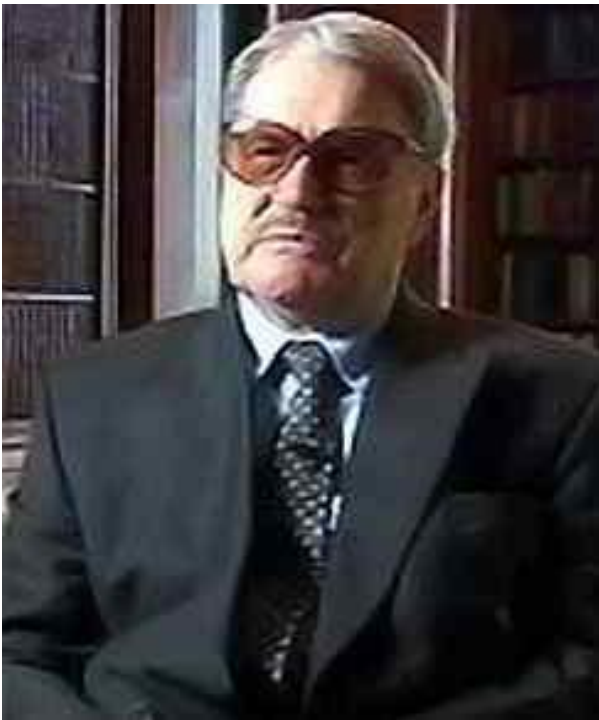
Vasilij Mitrokhin, archivista kgb

Tra parentesi quadra. In una di quelle schede, compilata nell'estate del 1978 dalla Residentura di Roma, mi ritrovai vent'anni dopo impigliato per i capelli, anzi per i riccioloni che a quel tempo portavo fluenti. Giovane giornalista, avevo scritto in quei giorni per "Panorama" un articolo nel quale davo conto dei sospetti di alcuni democristiani nei confronti degli Usa a proposito dell'assassinio di Moro. Gli spioni russi accreditarono quel mio acerbo scritto come uno dei succosi e nutrienti frutti dell'"operazione Shporà ", o Sperone, prendendosene ovviamente il merito e facendomi passare come un allocco. In realtà a quel pezzo avevo lavorato sodo e del tutto a digiuno da fonti sovietiche, non essendoci del resto alcun bisogno di qualsivoglia sperone per giustificare la diffidenza - e i sensi di colpa - di parecchi dc, a partire dall'entourage moroteo, rispetto a qualche scherzetto giocatogli oltreoceano.