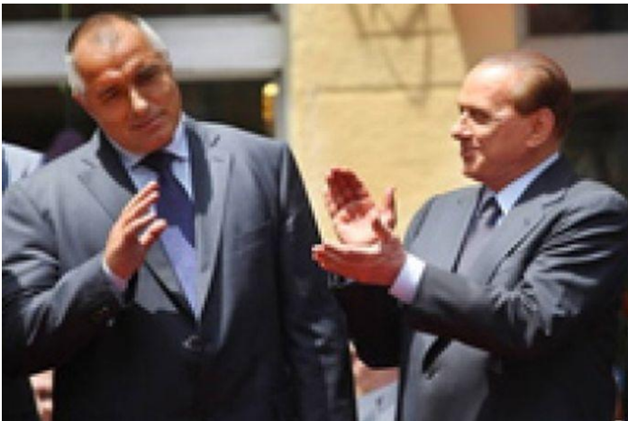
Berlusconi e il leader bulgaro Borisov

Ancora più evidente era il gusto di stupirsi l'un l'altro seguendo i moduli un trasporto al tempo stesso grandioso e infantile. Per cui Putin fece guidare a