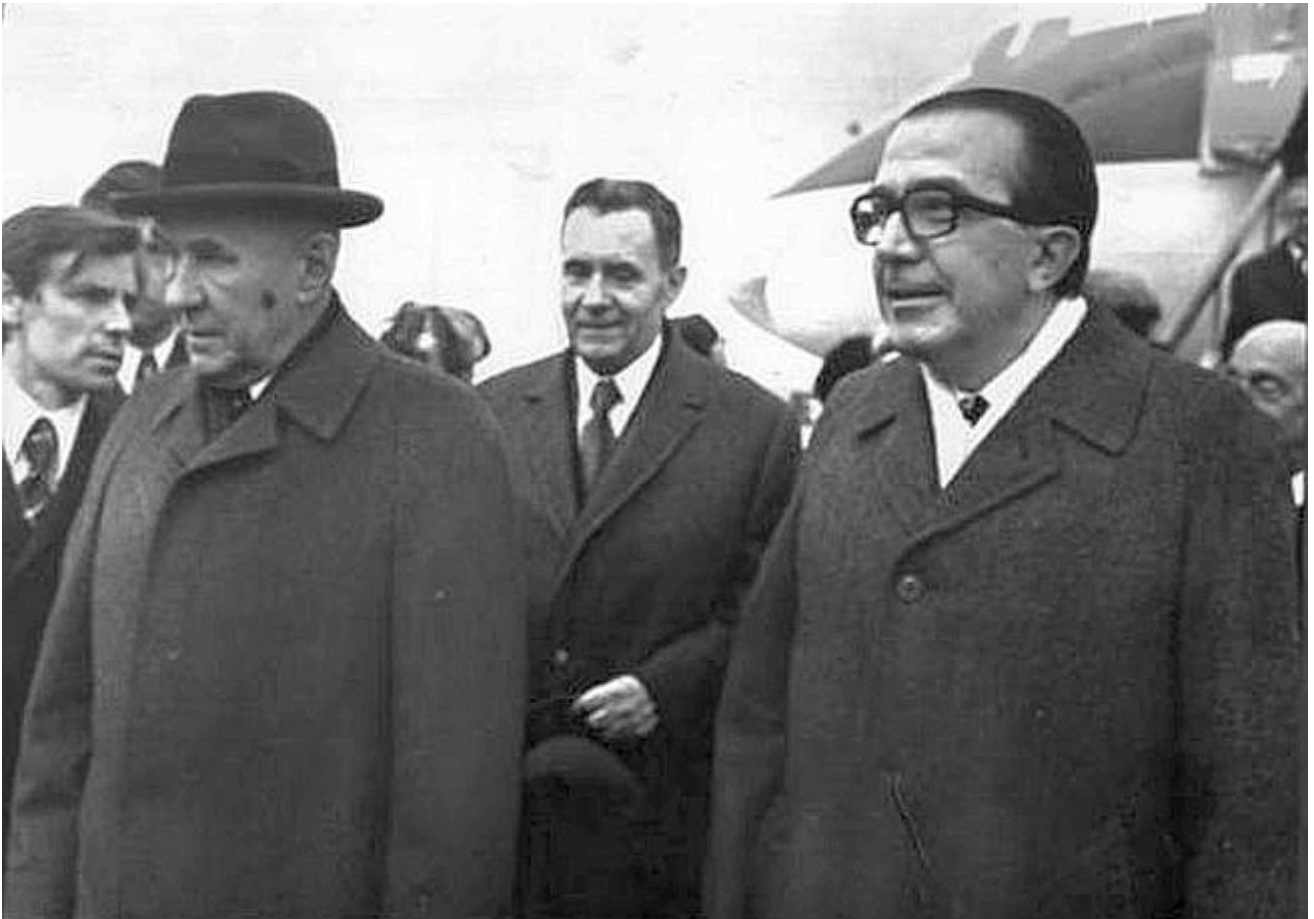
Gromiko e Andreotti

In questo senso l'analisi sarà pure stata rozza, ma Moro non lo era affatto, e tra gli ultimissimi suoi scritti - fu trovato in una delle borse che aveva con sé a via Fani - c'è un articolo per il Giorno che non fu mai pubblicato "per ragioni di opportunità" nel quale affrontava da par suo i temi e i tempi della guerra fredda, pure traendone alcune indicazioni di metodo per attenuarne gli effetti.