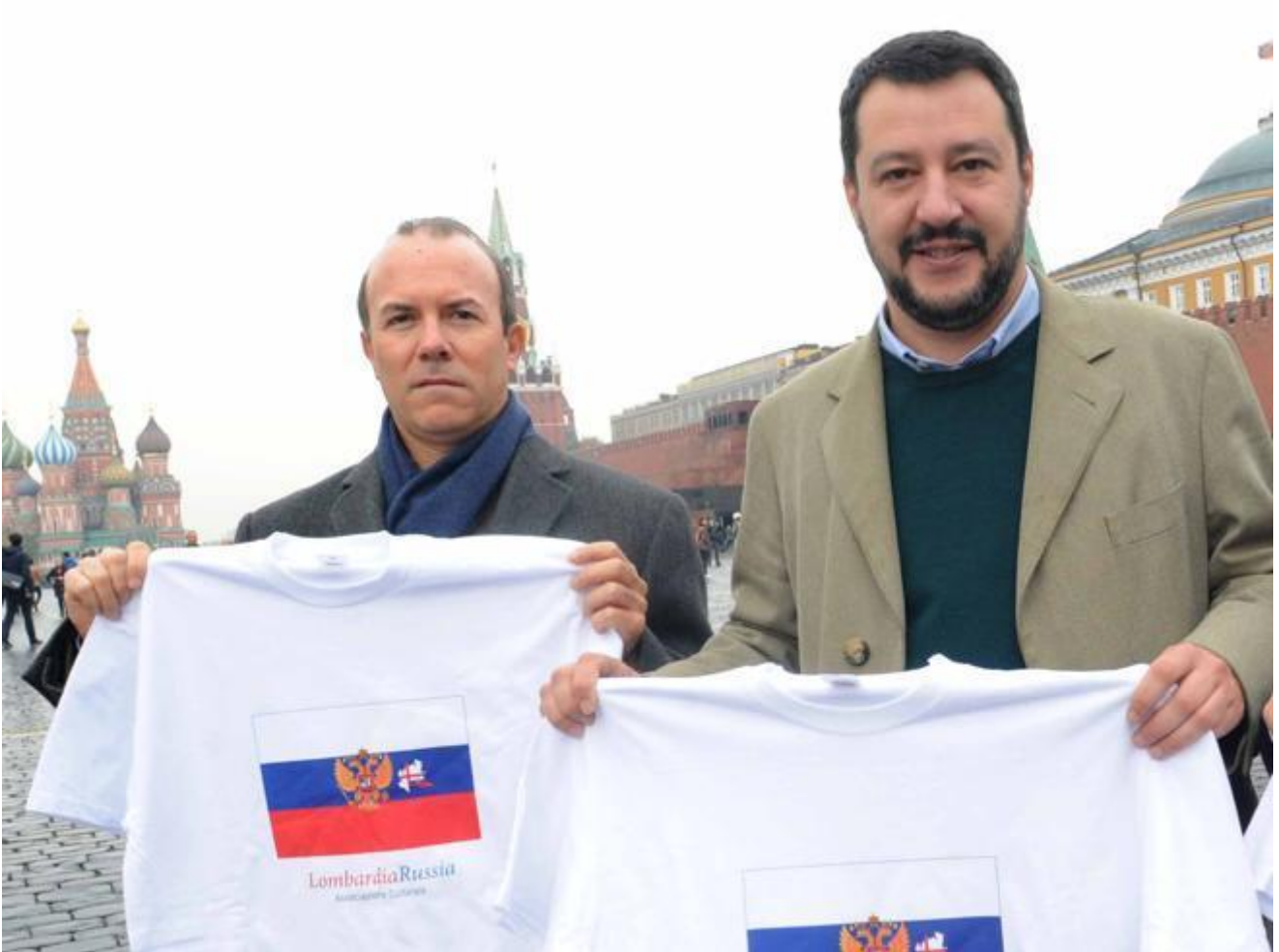
Salvini e Savoini sulla piazza rossa con esibizione di magliette patriottiche

D'altra parte il maestro di tutti loro, Umberto Bossi, ha sempre mantenuto con la verità un rapporto tutto suo; e anche senza contare l'acqua santa del Po sversata nella laguna di Venezia con bimba vestita di rosa e volo di colombi, a parte l'insurrezione armata della Bergamasca ("rimbombava nelle valli il grido...") e la proclamazione di un Parlamento e poi di un governo della Padania, in un'apposita manifestazione celebrò il trasloco della seconda rete Rai a Milano, cosa mai decisa né mai realmente effettuata; e visto che c'era, l'anno appresso, anche l'installazione di un fantomatico ministero del Nord nella villa reale di Monza, pure mostrando in pubblico le banconote per arredare gli uffici. Si aggiunga che questi ultimi non disponevano di servizi igienici e che il portiere dello stabile smarrì quanto prima le chiavi, cosicché rimasero serrati per sempre – quanto alle banconote, converrà ricordare che giusto in quel periodo era in azione l'amministratore Belsito, con i diamanti in Tanzania, la laurea albanese del Trota e la preziosa cartellina intitolata "The family" da cui anni dopo si ebbe la sorpresina che pure la celebre canotta del Senatùr era stata acquistata a spese del