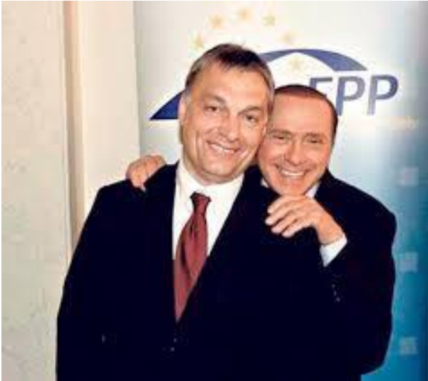
Berlusconi e il presidente ungherese Orbán

Del resto era naturale e al tempo stesso sorprendente come i due leader condividessero i medesimi interessi materiali e sentimentali, residenze da favola, devoti servi beneficiati, graziose signorine in gran copia, guadagni energetici incalcolabili, lo Stato vissuto da entrambi come "una specie di dopolavoro - secondo Michele Serra - nel quale miscelare allegramente gli affari pubblici e gli affari loro".