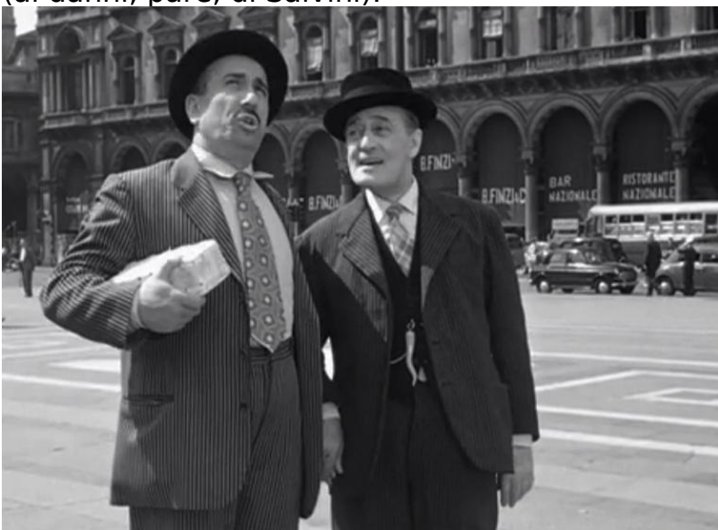
Totò e Peppino

Più che evidente è la palese inadeguatezza di Savoini e dei suoi comparì infilatisi a viva forza in una faccenda petrolifera e miliardaria assai più grande - come ammesso del resto dalla signora Savoini mamma del protagonista - di loro; oltre che pericolosa. Ma proprio il complemento spionistico - l'hotel moscovita, la registrazione e le immagini dei colloqui, la diffusione del tutto su un sito americano - assicurano alla vicenda legaiola un tocco da Totò & Peppino, sia pure virato in chiave padan-sovrana. Non solo, ma l'incombente fantasma dei servizi segreti - siano essi americani, russi, cinesi, italiani o di chissà quale altra potenza - ha subito impresso un rimbalzello per cui la nebulosa affaristica è pure incespicata verso il mondo ancora più indecifrabile del traffico d'armi, in questo caso dei mercenari filo-russi e filo-ucraini che si combattono nel Donbass; sia come sia è emerso l'immane & improbabile attentato forse in preparazione (ai danni, pare, di Salvini).