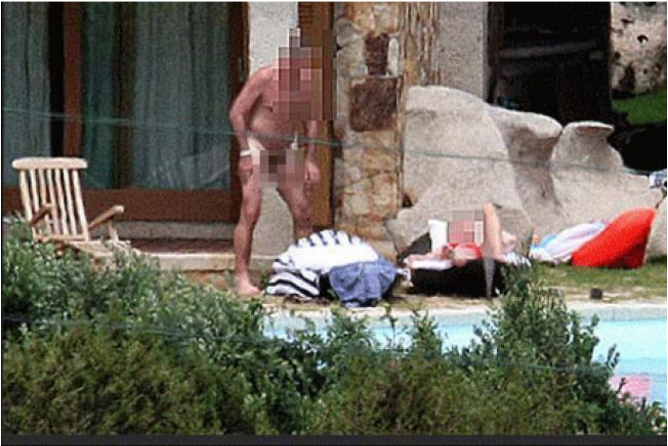
Il tuffo nudo del presidente ceco Topolánek a villa La Certosa

Piegato dalla bufera degli scandali sessuali – indimenticabile il tuffo nudo del ceco Topolánek a villa La Certosa – e poi nel suo lungo declino Berlusconi ebbe in ogni caso e sempre la certezza di trovare una sponda di comprensione e gratitudine da quella parte, oltre che da Putin in persona. Secondo il presidente russo quelle accuse nascevano “dalla gelosia e dall'invidia”. Attenzioni e cortesie che poi in patria Berlusconi stiracchiava da par suo: "Pensate che Putin mi ha persino proposto di candidarmi a premier da loro! Mi ha detto che i russi sarebbero felicissimi".