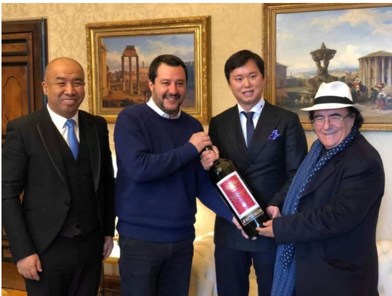
Al Bano con cappello panama e imprenditori cinesi reca il bottiglione del suo vino al Viminale

Con lo svolgersi dell'estate, non molto tempo prima di mettere fine alla coalizione di governo, Salvini ha smesso di definire "ridicola" l'inchiesta designandola "un film di spionaggio di serie B". Ora, la commedia in Italia non teme rivali, o meglio li assorbe e li integra estendendo l'ala su qualsiasi ambito dello spettacolo, non escluso il genere della canzone e del cinema cosiddetto "musicarello".