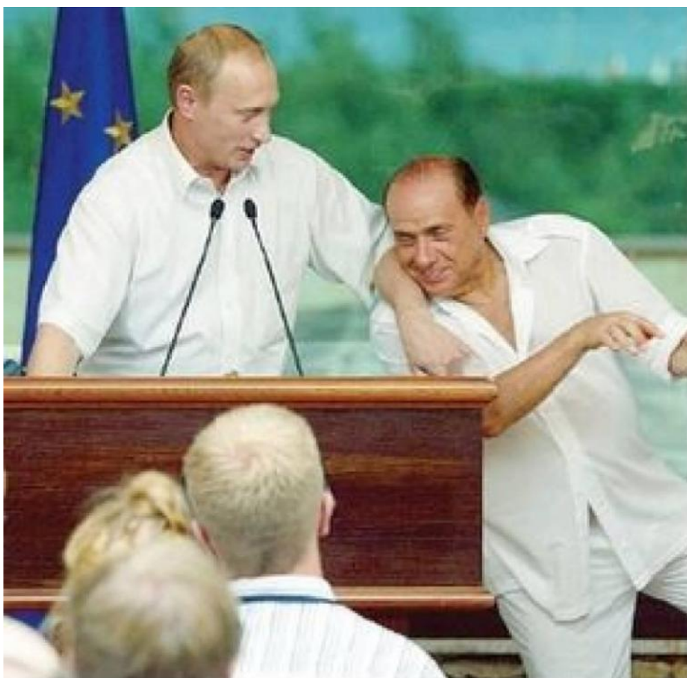
Berlusconi fa le fusa a Putin

Non era probabilmente la prima volta che manifestava a una platea del genere questo suo giudizio insieme così personale e pubblico. Come molti esponenti della sua generazione, anche in politica estera spesso Salvini apre bocca e gli dà fiato; per cui dopo una visita compiuta insieme al senatore Razzi a Pyongyang fu prodigo di riconoscimenti addirittura verso il feroce e sanguinoso regime nord-coreano: "Ho visto un senso di comunità splendido. Tantissimi bambini che giocano in strada e non con la playstation, un grande rispetto per gli anziani, cose che ormai in Italia non ci sono più».