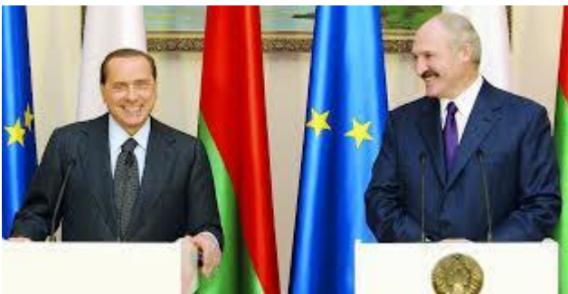
Berlusconi e il presidente bielorusso Lukashenko