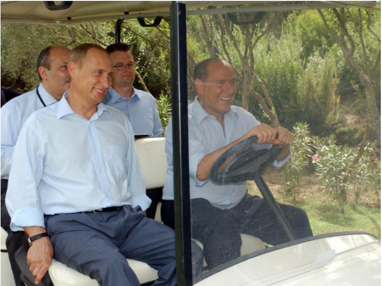
Berlusconi, Putin: visita turistica nel parco

Ma l'evento più rimarchevole - e del quale si è avuto notizia diversi anni dopo - fu che durante uno spettacolo pirotecnico qualcosa andò storto e alcuni razzi puntarono direttamente sulla terrazza degli invitati. Non è difficile immaginare lo spettacolo pazzesco quando tutti, a partire dalle agguerrite guardie del corpo di Putin, pensarono che si trattasse del più temerario e clamoroso attentato mai compiuto nella storia umana. Putin comunque ebbe i pantaloni bruciacchiati, come del resto il Gran Cerimoniere Toni Renis, mentre il vestito della signora Bocelli rischiò la disintegrazione e Silvione afflitto non sapeva come scusarsi. Il presidente della Federazione la prese sportivamente, l'incidente "non ci rovinò la festa" ha poi ricordato ad Alan Friedman, cui si deve l'amenò e anche istruttivo resoconto.