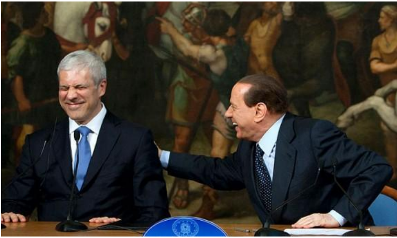
Berlusconi e il leader serbo Tadic