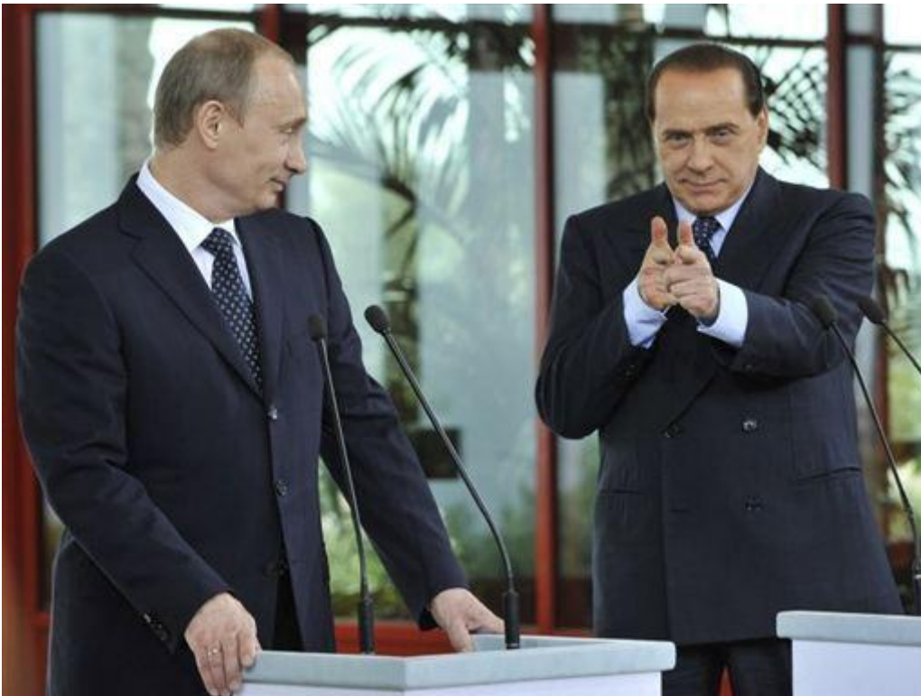
Berlusconi, Putin: l'inopportuno gesto della mitraglietta

È singolare, e al tempo stesso si spiega anche con i processi di rimozione della memoria pubblica quanto rapidamente sia evaporata quella delle res gestae di Silvio Berlusconi, che invece va ricordato proprio per aver pensato, detto e compiuto per la prima volta un'infinità di cose, a loro volta destinate a replicarsi. Ciò detto, appena eletto nel 2008 presidente del Consiglio, come atto inaugurale di governo nel primissimo week end utile prese baracca e Bagaglino e si trasferì a villa La Certosa per un week-end di spettacoli e spettacolini avendo come ospite di molto riguardo proprio il presidente Putin.