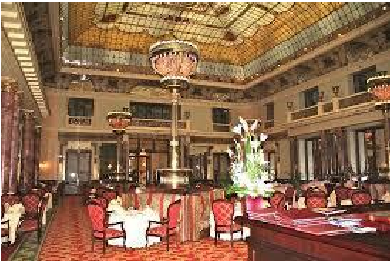
Il salone dell'Hotel Metropol

Ma siccome la storia è fatta di minuti e leggendari particolari, non di rado tutt'altro che nobili, si tramanda che ad avvalorare i sospetti craxiani fu una lunga e snervante riunione tenutasi su altri argomenti "a studio", come diceva Andreotti intendendo il suo particolare e intimo Centro Studi Lazio; riunione nella quale lui, o forse era Rino Formica, comunque si accorse con raccapriccio che Signorile non aveva neanche bisogno di chiedere dov'era il bagno (quello stesso in cui ogni mattina il Divo veniva farsi radere dall'ex barbiere della Camera, intrattenendosi nel frattempo con l'interlocutore di turno che veniva fatto accomodare "sul trono", come Andreotti designava il bidet).