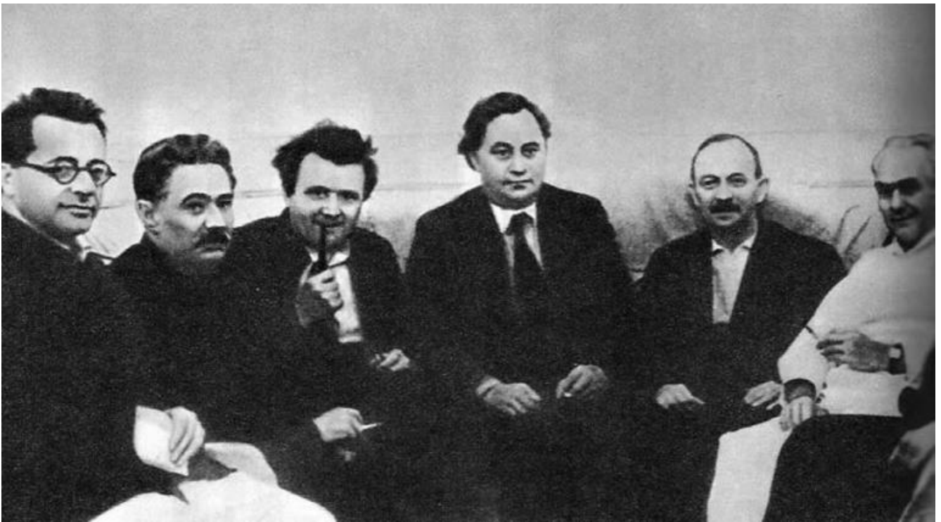
Togliatti primo a sinistra all'Hotel Lux