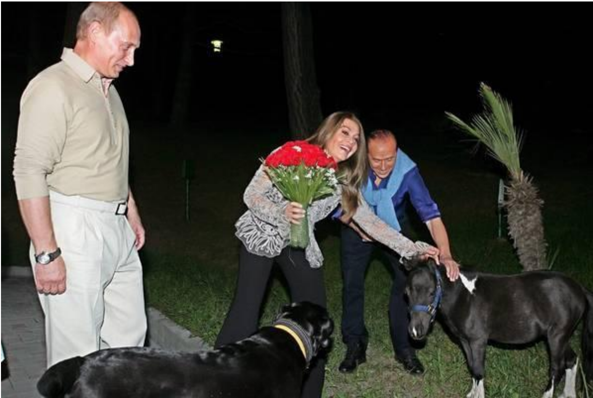
Putin, Berlusconi, Veronica e una coppia di cavallini nani