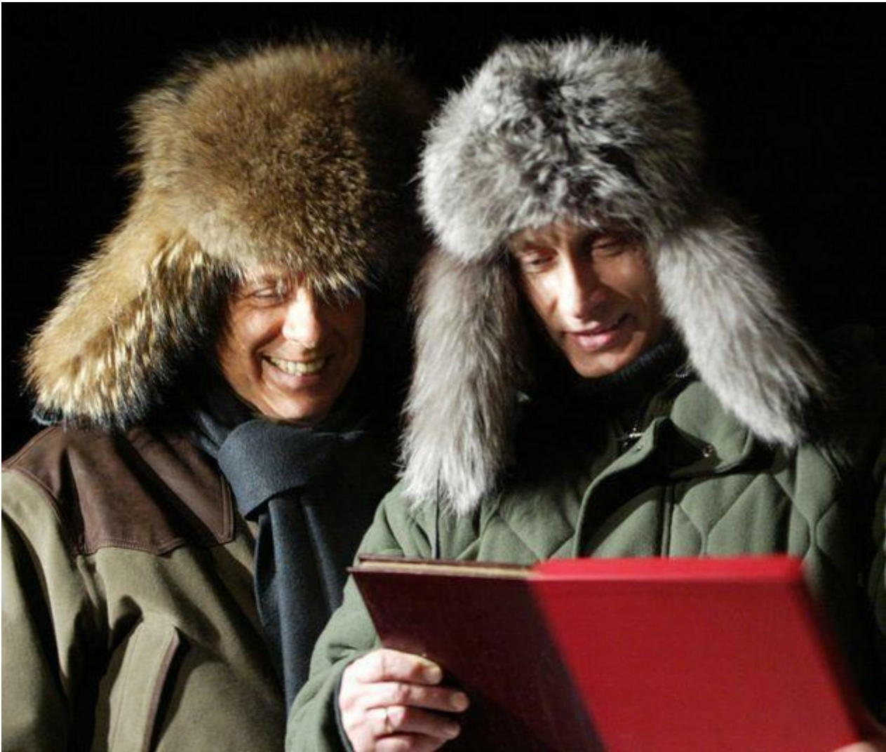
Putin, Berlusconi: a meno 30 gradi centigradi

Appena possibile, Putin ricambiò l'ospitalità nella sua fiabesca dacia, ovviamente senza razzi. Da grande amico degli animali una volta ebbe il piacere di presentare a Berlusconi un meraviglioso cavallino nano della grandezza di un cocker spaniel che gli si mise a scorrazzare fra le gambe; in un'altra visita gli offrì una sontuosa colazione all'aperto a meno 30 gradi regalando al mondo una formidabile fotografia di loro due ridenti e imbacuccati come eschimesi. Tornati in città, all'insegna del tifo machista, Putin accompagnò il Cavaliere ad assistere ad incontri di lotta libera e hockey su ghiaccio. La sera Berlusconi fu segnalato in un locale notturno di Mosca attorniato da belle ragazze. All'entrata l'orchestrina l'aveva salutato al suono di "Tu vuo fa' l'americano" - e in fondo un po' era anche così, ma il mondo correva e ogni confine andava perdendosi in un grande disordine.