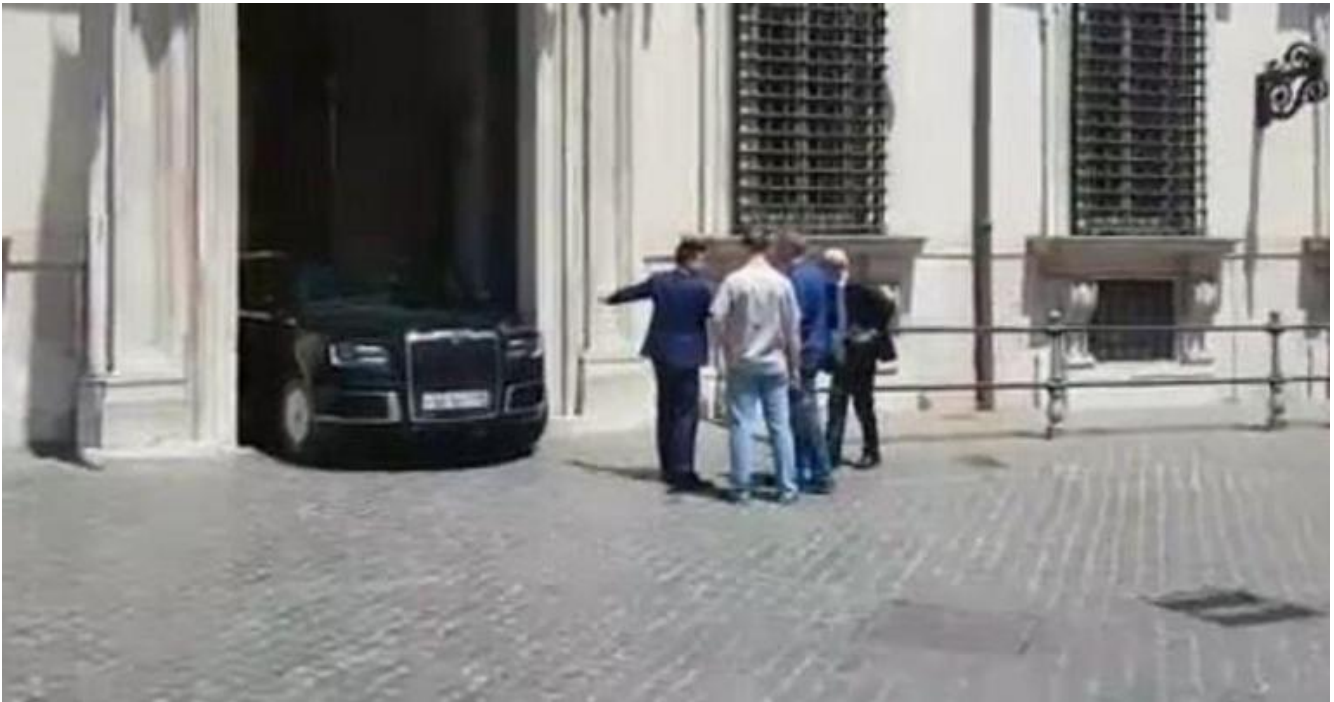
Prove di entrata a Palazzo Chigi della limousine di Putin

Pochi giorni dopo i quotidiani proponevano in foto le grottesche prove effettuate davanti a Palazzo Chigi per far entrare nel portone di piazza Colonna la gigantesca limousine di Putin: una Aurus Senat nera, lunga quasi sette metri e larga due, 8 cilindri, 4.400 di cilindrata, a bordo della quale, dopo il trionfo plebiscitario del 2012, il neo rieletto presidente della Federazione russa aveva attraversato una Mosca deserta e blindata per riprendere possesso del Grande Palazzo del Cremlino.