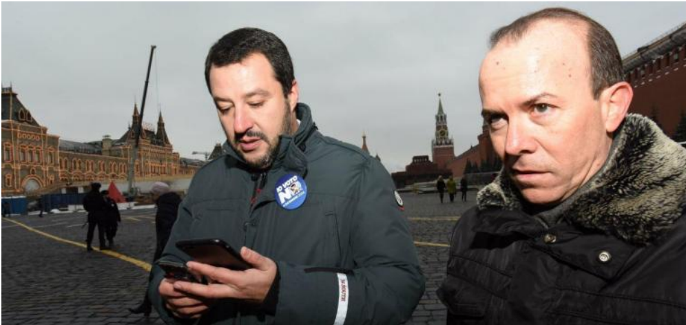
Salvini, Savoini e telefonini

Il punto delicato da dire è che gli scandali in Italia fanno sempre un po' ridere. Oddio, ogni volta che scoppiano sono brutti, d'accordo, e meglio sarebbe che non ci fossero. Ma con lo scorrere del tempo, anche velocemente, tipo due o tre giorni, sembra quasi che l'antico motto evangelico, oportet ut scandala eveniant , comporti un'appendice entro la quale, pure esaurito il valore istruttivo e pedagogico della vicenda, s'intravede a volte sullo sfondo, a volte controluce, a volte in primo piano, il nucleo incandescente dell'umorismo che in qualche modo riscatta le brutture del malaffare alle spalle di coloro che in genere e buffonescamente l'hanno procurato.