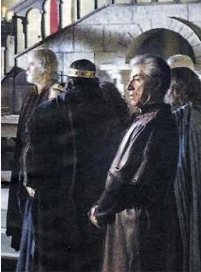
Bossi nobile lombardo nel Barbarossa