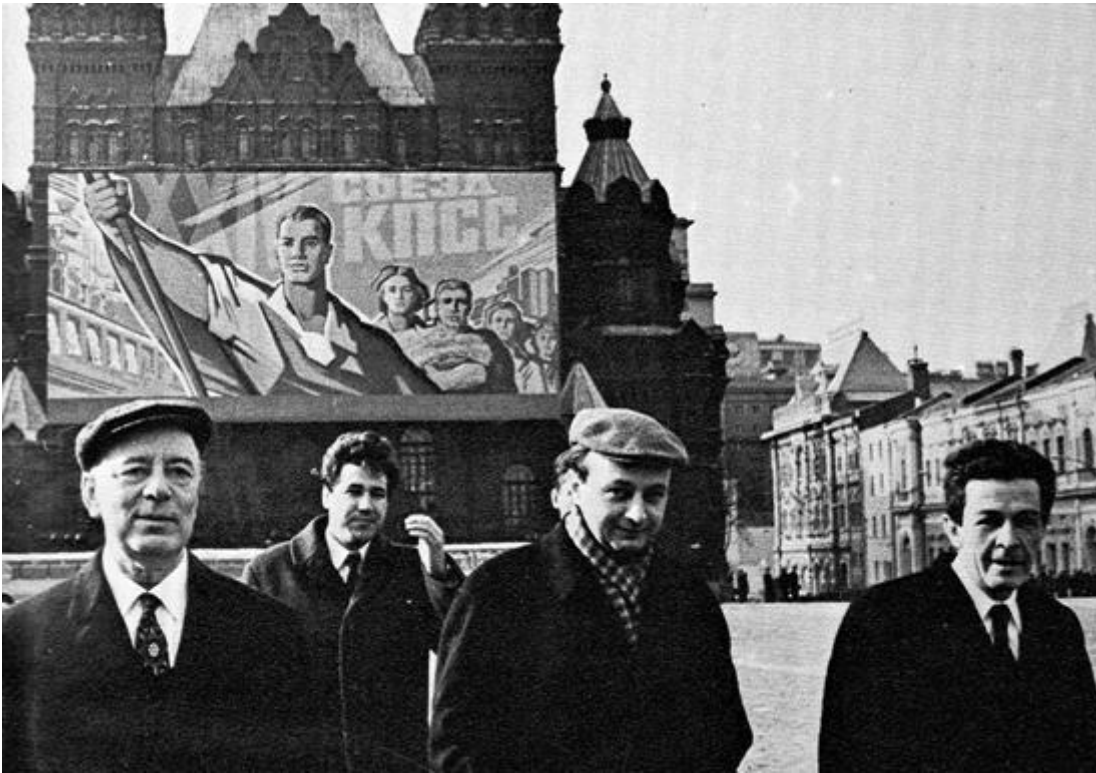
Berlinguer a Mosca con Pajetta e Cervetti