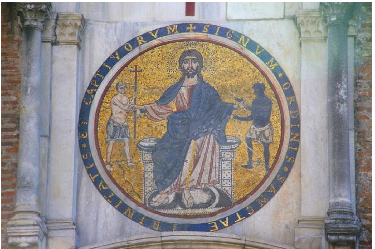
Chiesa di San Tommaso in Formis, Roma.

Questo Ã un punto fondamentale. Sul web si trova una mia conferenza su identitÃ /cultura/nazione fatta al Macro (Museo d'Arte Contemporanea di Roma): ho scelto apposta il tema oggi pi scabroso. In realt , infatti, l'Italia ha una posizione speciale, che ci mette in una condizione di vantaggio. Il documento pi antico d'Europa su carta si conserva a Palermo: Ã una lettera in arabo, scritta da una regina normanna. La nostra storia, da sempre, Ã una storia meticcias, fatta di incontri, di mescolanza. Pensa al (brutto, ma cos caro) stemma della repubblica italiana, con la ruota dentata, le foglie d'ulivo, e poi la stella, perch i greci chiamavano l'Italia la terra della stella. Ã importante ripensarci: il nostro stemma repubblicano ha un'idea di Italia come paese visto da fuori. Visto da chi venne ad abitarla: i greci d'Occidente, la Magna Grecia. L'unico articolo dei principi fondamentali della Costituzione, il 9, che usi la parola "nazione" Ã quello che parla di cultura di paesaggio e patrimonio artistico. Il concetto di nazione ha a che fare con il territorio, con la cultura: e dunque con l'apertura, per definizione. In tutte le nostre chiese troviamo storie che parlano di persone che vengono da tutto il mondo. Noi apparteniamo, non da oggi ma da sempre, a una storia multiculturale.