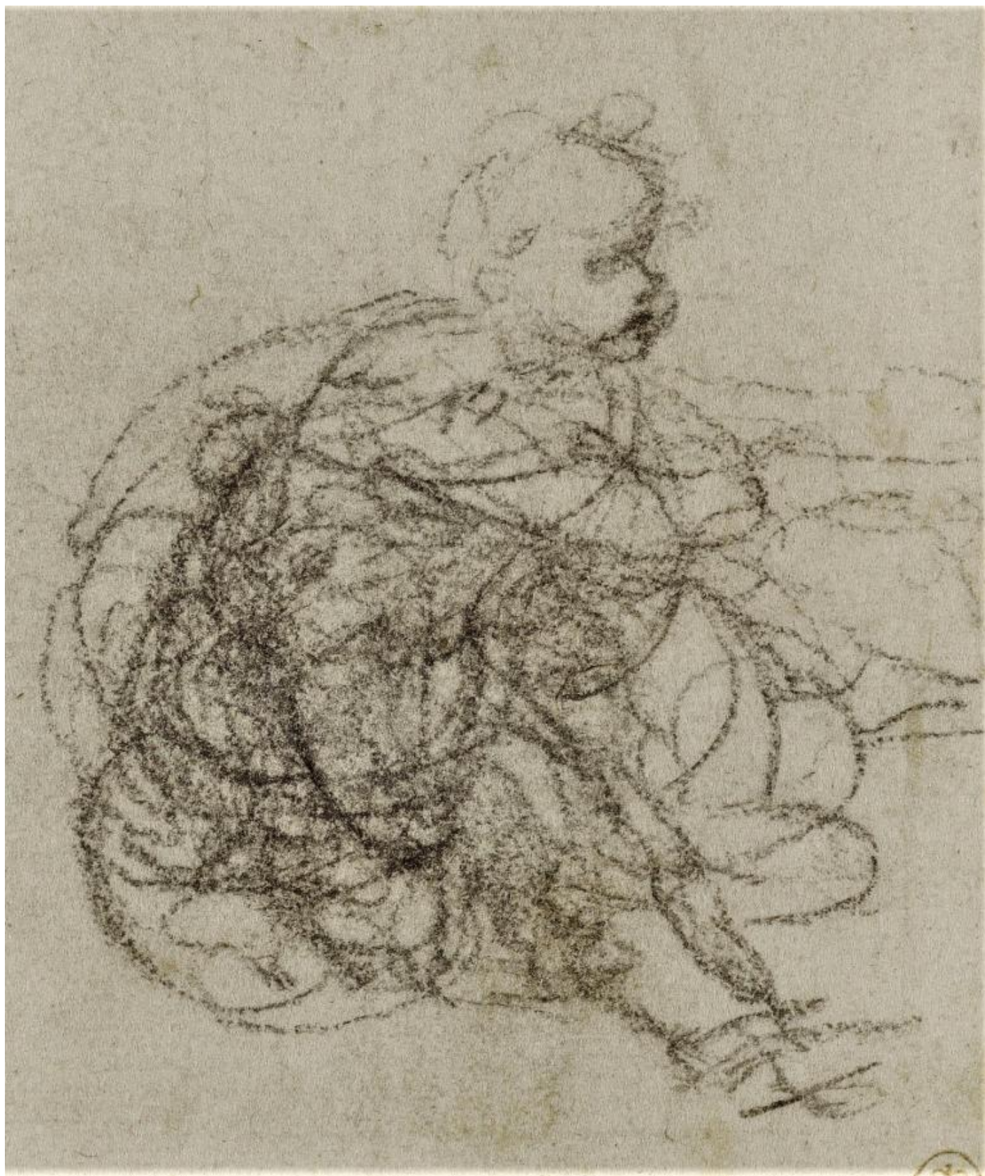
Leonardo Da Vinci, Studio per bambino con agnello, 1503.

Fu proprio la spontanea manifestazione del suo talento grafico a indicare al notaio ser Piero da Vinci che, diversamente dalle proprie aspettative, l'educazione del figlio doveva seguire una strada diversa da quella del