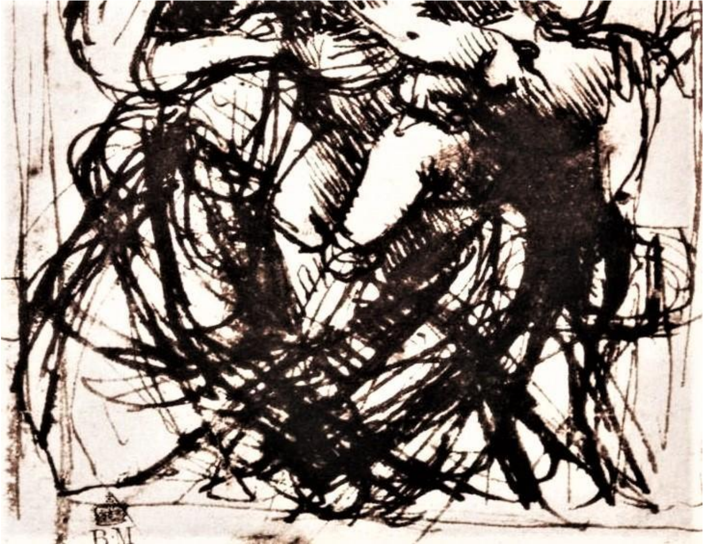
Leonardo Da Vinci, Schizzo per la madonna del gatto, 1478/81.

La necessità di verificare diverse soluzioni, di grandezza, di numero, di posizione e di forma di alcune parti o componenti di una composizione, sovrapponendole nello stesso disegno una sopra l'altra in trasparenza, oppure quella di rivedere, ritornare su di una decisione mutandone delle parti, che nella trattatistica vengono definiti "pentimenti", danno luogo ad un tipo di disegno in buona parte scarabocchiato e confuso, che invero, però, una inattesa forza espressiva, così spiccata da invogliare i pittori a non rimuovere o nascondere le correzioni, lasciando i propri disegni fluttuare tra queste sorprendenti indecisioni, come nel caso della serie dei disegni a penna in cui Leonardo raffigura diverse soluzioni relative alla posizione della testa della Madonna del gatto .