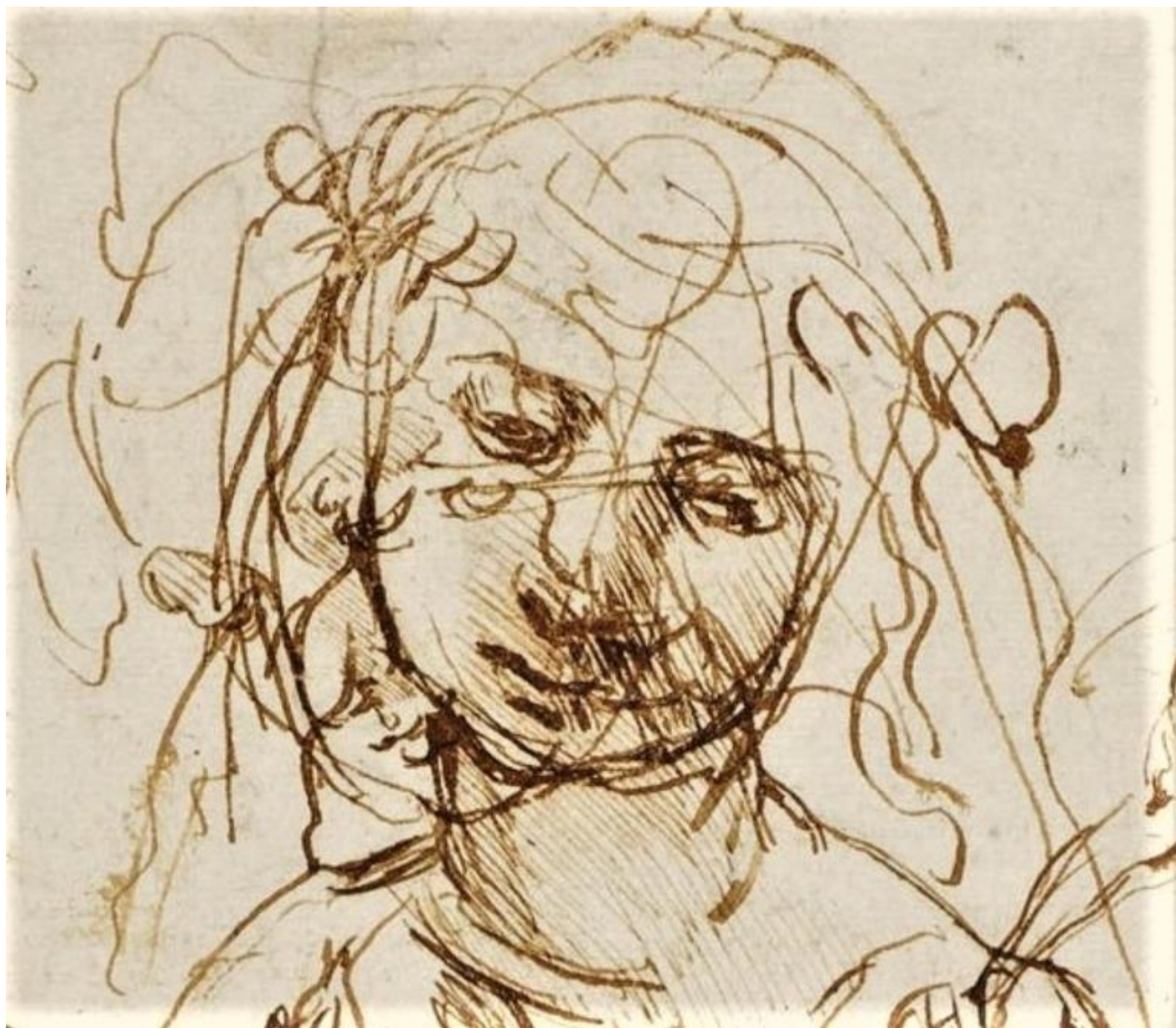
Leonardo Da Vinci, Madonna con bambino e Giovanni, 1778.