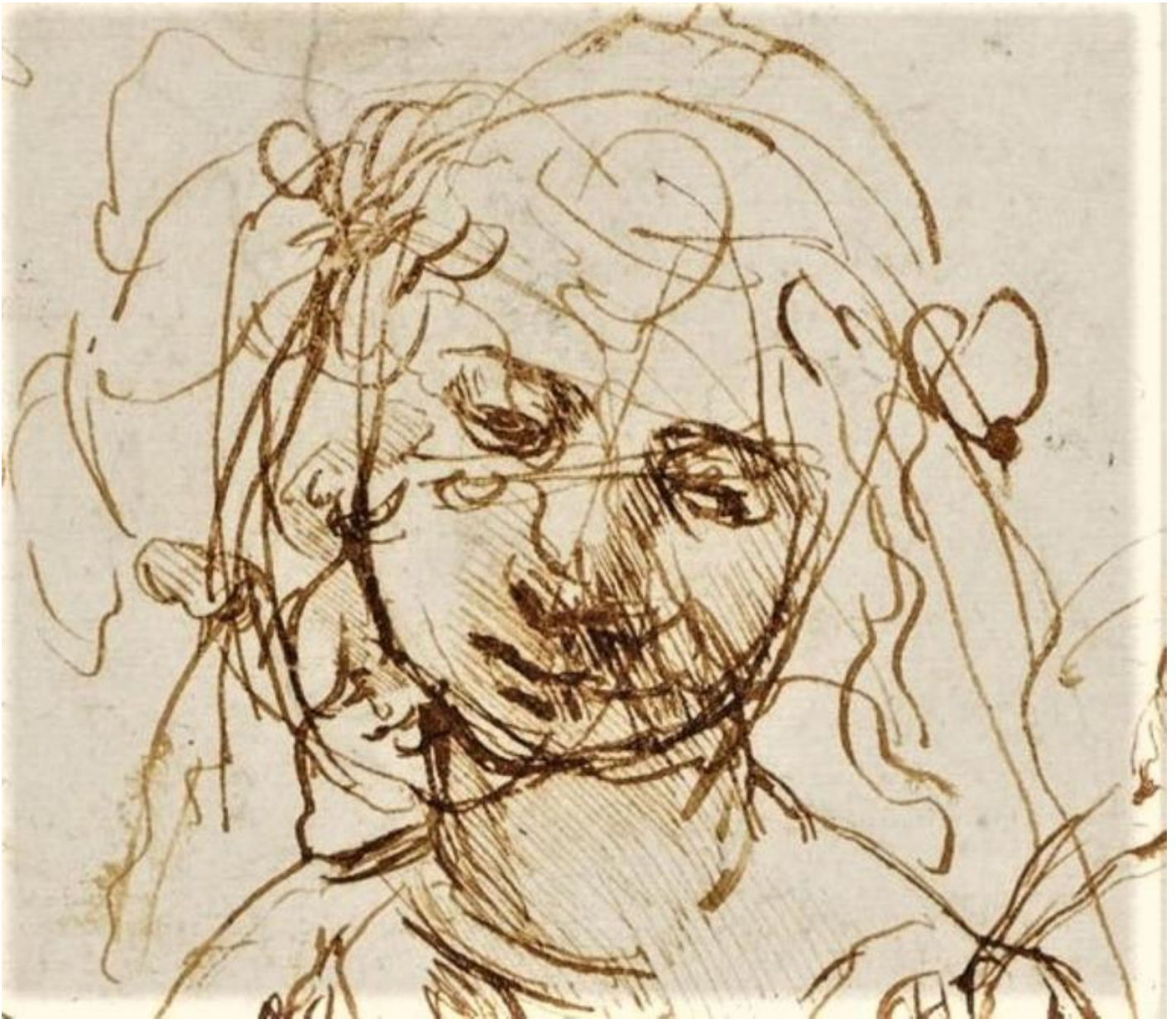
Leonardo Da Vinci, Madonna con bambino e Giovanni, 1778.