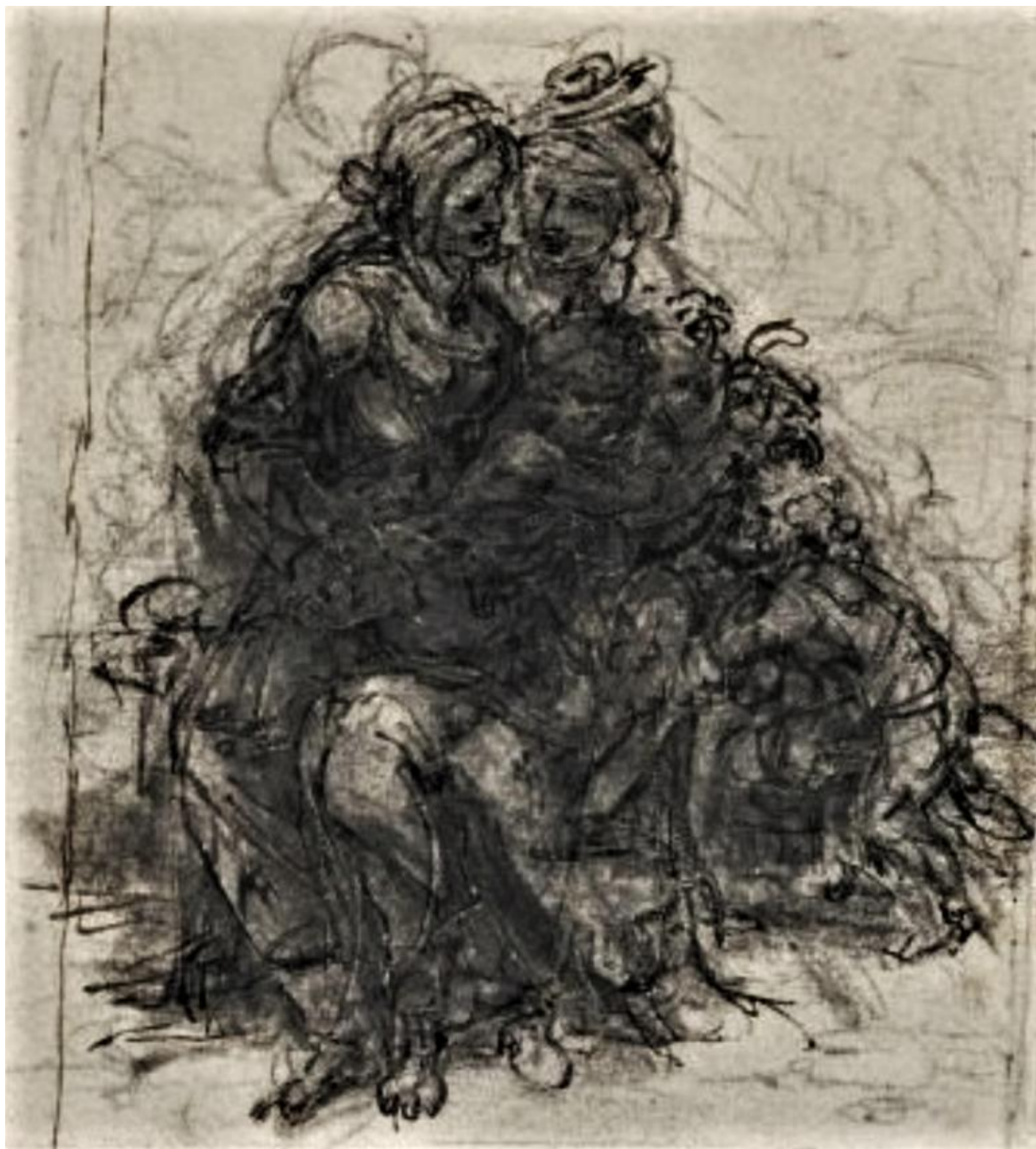
Leonardo Da Vinci, Studio per la vergine Sant'Anna e Gesù bambino.

Così come molti pittori tendono a fare e si ostinano a pretendere che “ogni minimo segno di carbone sia valido.” Leonardo ricorda al pittore che è molto più importante rendere visibili i moti dell’animo che agitano dall’interno quei corpi e che per poterli cogliere con prontezza di mano occorre comporre “grossamente le membra delle figure.” Senza questa attitudine grafica, definita da Leonardo “componimento inculto”, tanto il pittore quanto ogni altro tipo di disegnatore si priverebbero della possibilità di fissare anche la prima idea di una composizione, con la stessa istantaneità con cui si forma nella loro mente e si troverebbero a rinunciare anche al genere di disegno in assoluto più espressivo e più personale.