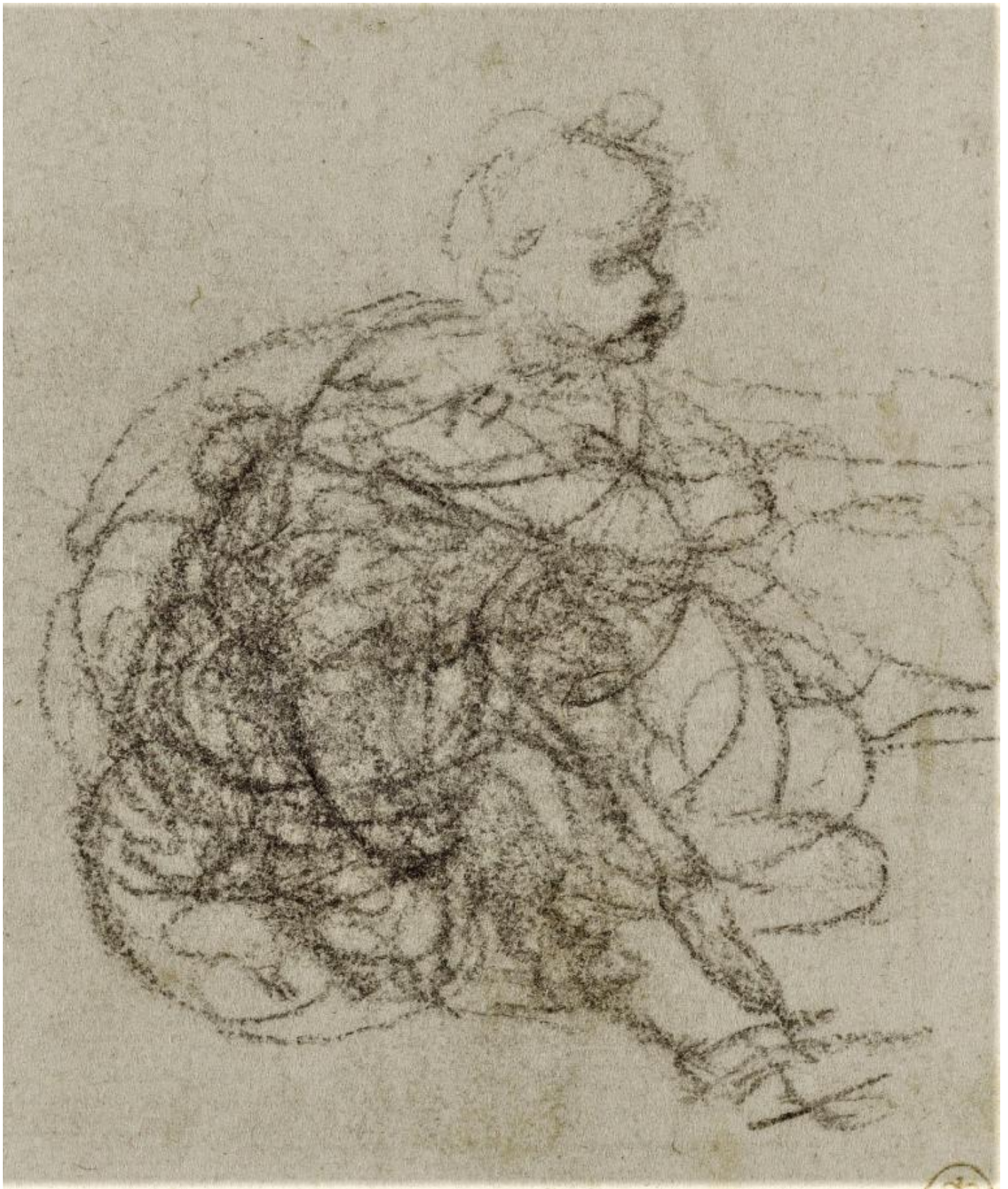
Leonardo Da Vinci, Studio per bambino con agnello, 1503.

Fu proprio la spontanea manifestazione del suo talento grafico a indicare al notaio ser Piero da Vinci che, diversamente dalle proprie aspettative, lâ??educazione del figlio doveva seguire una strada diversa da quella