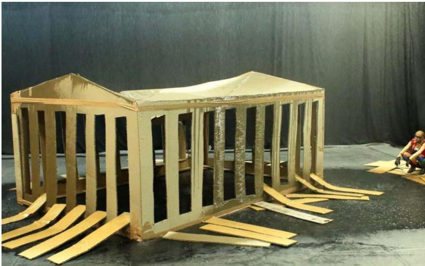
Phia Ménard, Maison-Mère

Alla fine, fra le macerie sature di un fumo che impedisce quasi del tutto la visione (non solo della scena), costretti ad affinare – tecnicamente – lo sguardo, ci rendiamo conto che lo spostamento profondo a cui Phia Ménard ci conduce con pazienza riguarda soprattutto la posizione e la prospettiva dello spettatore, nel teatro come nella vita: provando a smuoverci da una modalità di fruizione canonica in uso soprattutto nella ricerca, fondata sulla dimensione concettuale, analitica, interpretativa e intellettuale; a un coinvolgimento il meno mediato possibile, che mira a colpire su un piano soprattutto sensoriale o emotivo, non tanto o non solo per la suggestione degli “effetti speciali” ma per un lavoro sulla costruzione e manipolazione del tempo – su pause e durate, messe in posa e abbandono alla contingenza, caso e volontà –, che rende l'azione il campo in cui artista e pubblico momentaneamente convivono, partecipando insieme di un percorso interiore e scenico in continuo sviluppo.