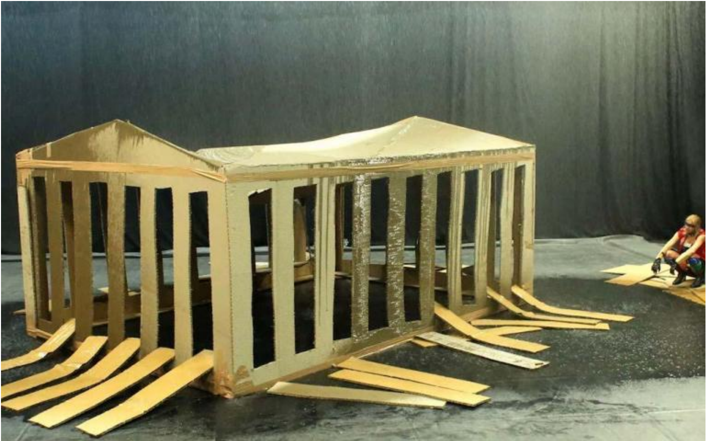
Phia Månard, Maison-Mère, ph. Jean-Luc-Beaujault.

Alla fine, fra le macerie sature di un fumo che impedisce quasi del tutto la visione (non solo della scena), costretti ad affinare il tecnicamente lo sguardo, ci rendiamo conto che lo spostamento profondo a cui Phia Månard ci conduce con pazienza riguarda soprattutto la posizione e la prospettiva dello spettatore, nel teatro come nella vita: provando a smuoverci da una modalità di fruizione canonica in uso soprattutto nella ricerca, fondata sulla dimensione concettuale, analitica, interpretativa e intellettuale; a un coinvolgimento il meno mediato possibile, che mira a colpire su un piano soprattutto sensoriale o emotivo, non tanto o non solo per la suggestione degli effetti speciali ma per un lavoro sulla costruzione e manipolazione del tempo su pause e durate, messe in posa e abbandono alla contingenza, caso e volontà, che rende l'azione il campo in cui artista e pubblico momentaneamente convivono, partecipando insieme di un percorso interiore e scenico in continuo sviluppo.