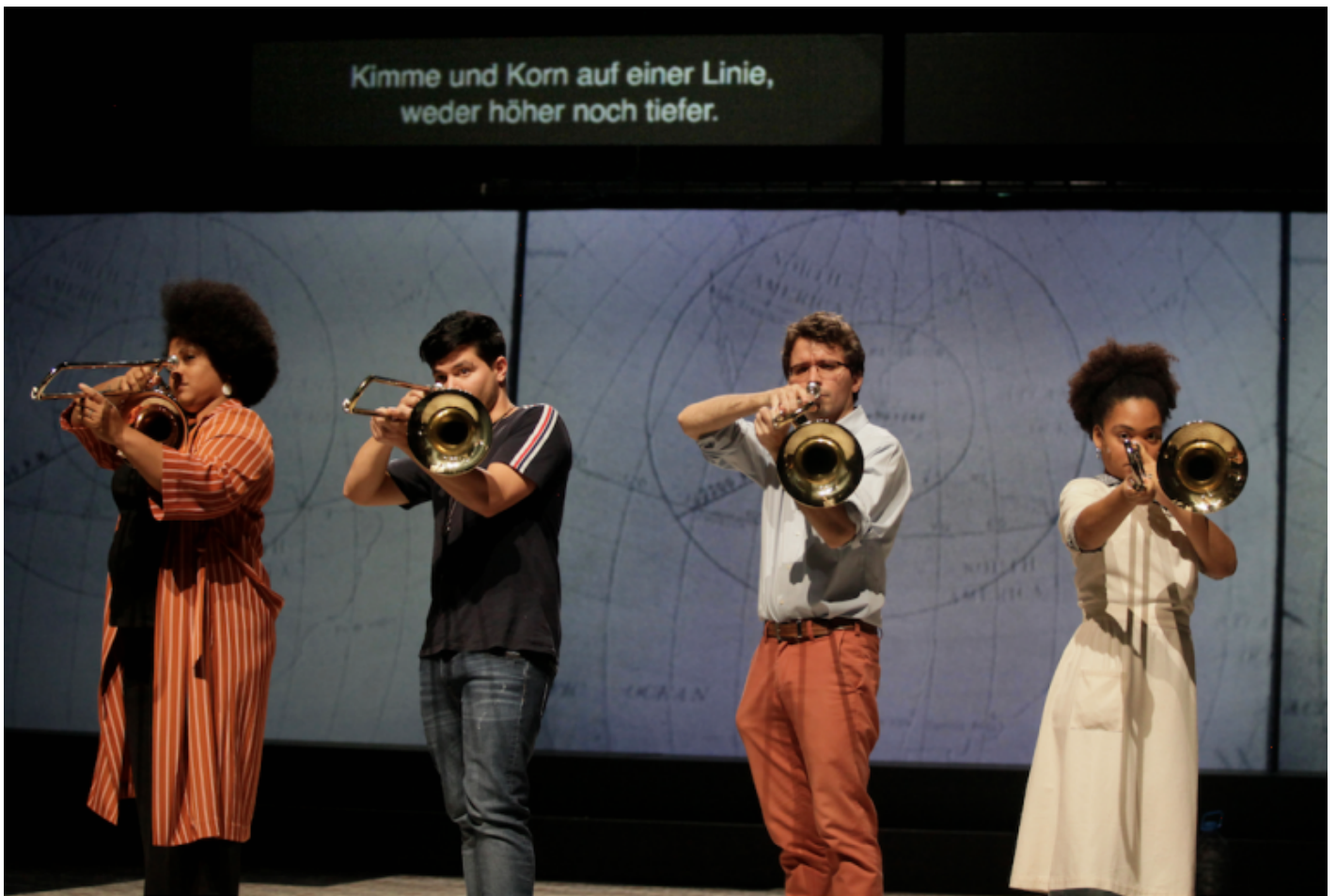
Rimini Protokoll, Granma.

L'atto del guardare non solo a teatro, ma anche di fronte alle immagini che compongono il nostro quotidiano flusso mediale diventa così il cuore di un'indagine che ne riafferma da un lato il pericolo, dall'altro il profondo valore politico.