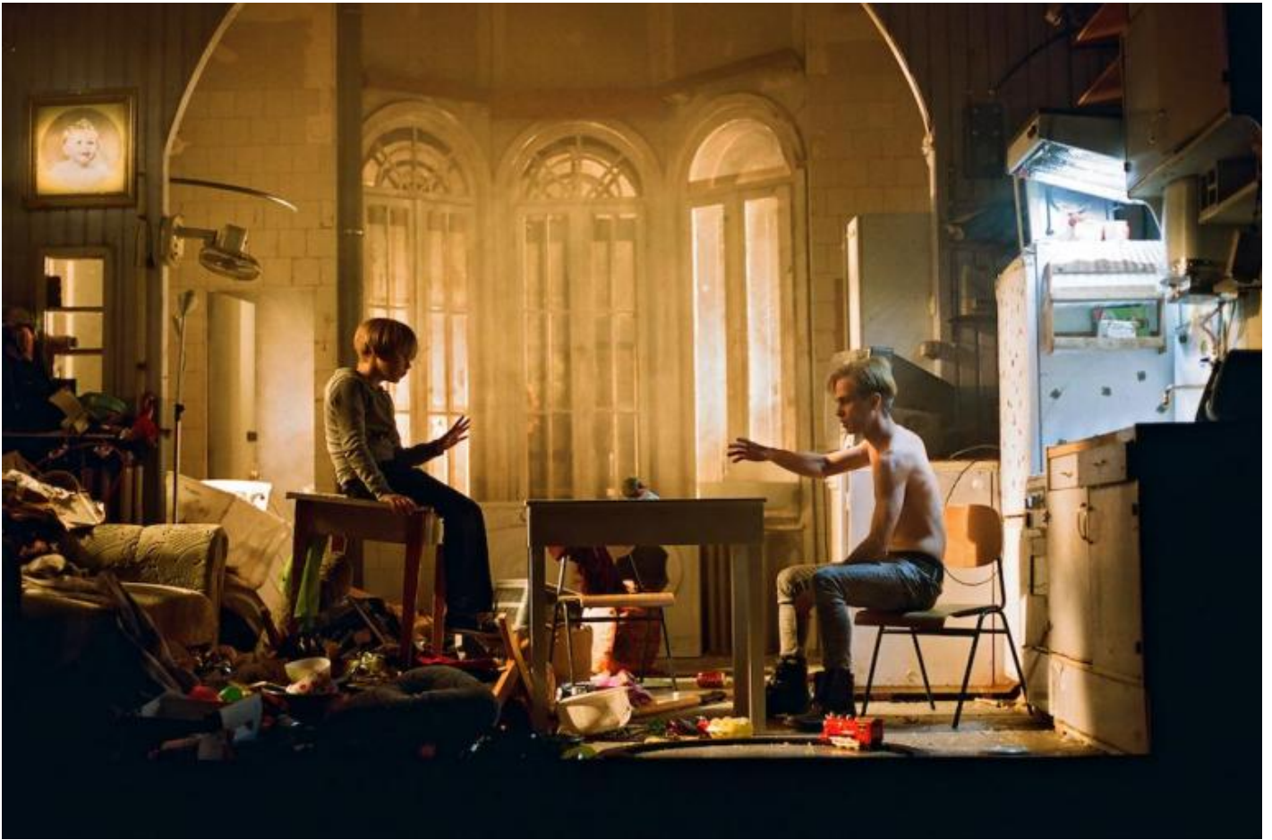
Kornél Mundruczó 3 , Imitation of Life, ph. Marcell Rákosy.

Il collegamento di questo spettacolo con un altro lavoro, di cui si è già discusso molto e che ha riscosso molto successo in tutta Europa (rimanendo in campo italofono, prima di essere presentato al Fit era stato ospitato al Vie Festival, come possiamo leggere in questo intervento a cura di Massimo Marino), è suggerito già dal titolo, Imitation of Life , un titolo affine con la ricerca di Nikitin e da lui stesso utilizzato in precedenza.