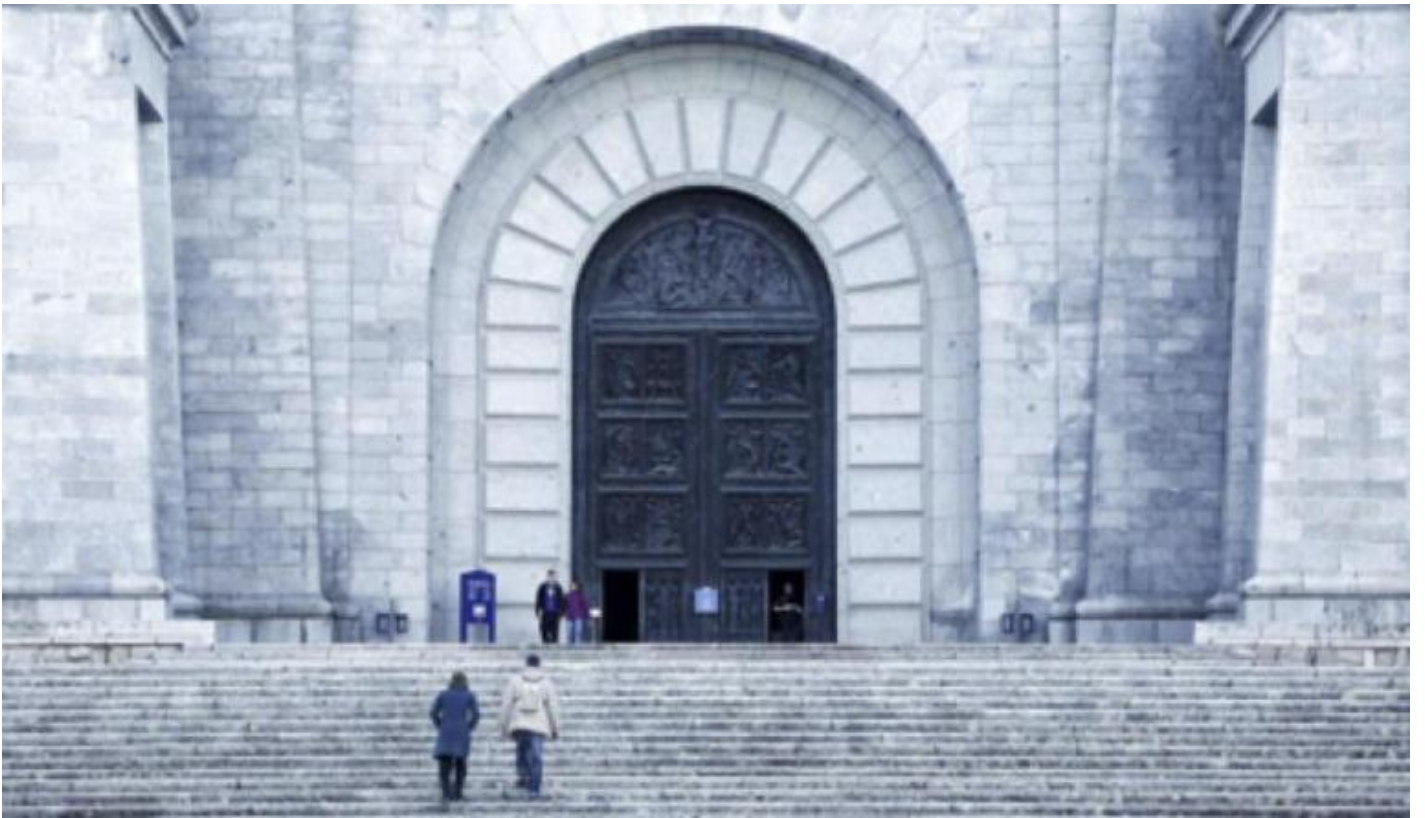
L'unico ingresso alla basilica.