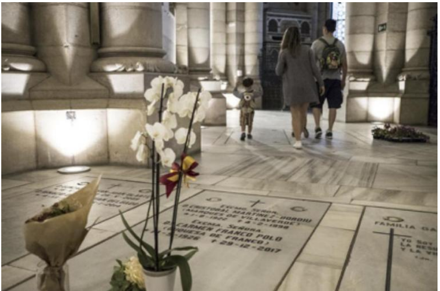
Tomba della figlia di Franco, vicino alla porta d'ingresso della cripta della cattedrale di Madrid.

La chiesa cattolica si è comportata inizialmente in modo ambiguo, non volendo immischiarsi, ma quando ha visto che l'abate della basilica, di passato falangista, sfidava illegalmente gli ordini del Tribunale Supremo rifiutandosi di aprire la porta agli inviati del governo, lo ha esautorato. In questa mancanza di determinazione, la chiesa aveva dichiarato di non voler ostacolare il desiderio della famiglia che voleva portare Franco alla cattedrale di Madrid, con la giustificazione che nella cripta è seppellita la figlia del dittatore.