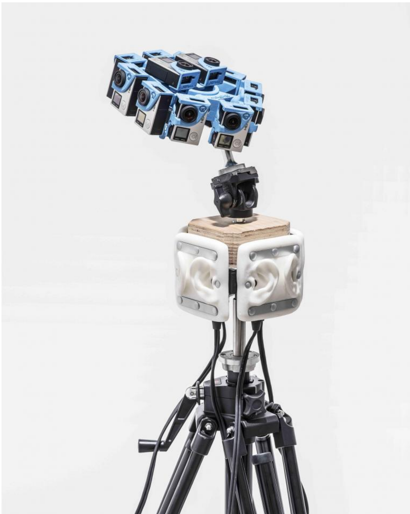
MATTHIEU GAFSOU – Palazzo Pepoli Campogrande 4.5.1