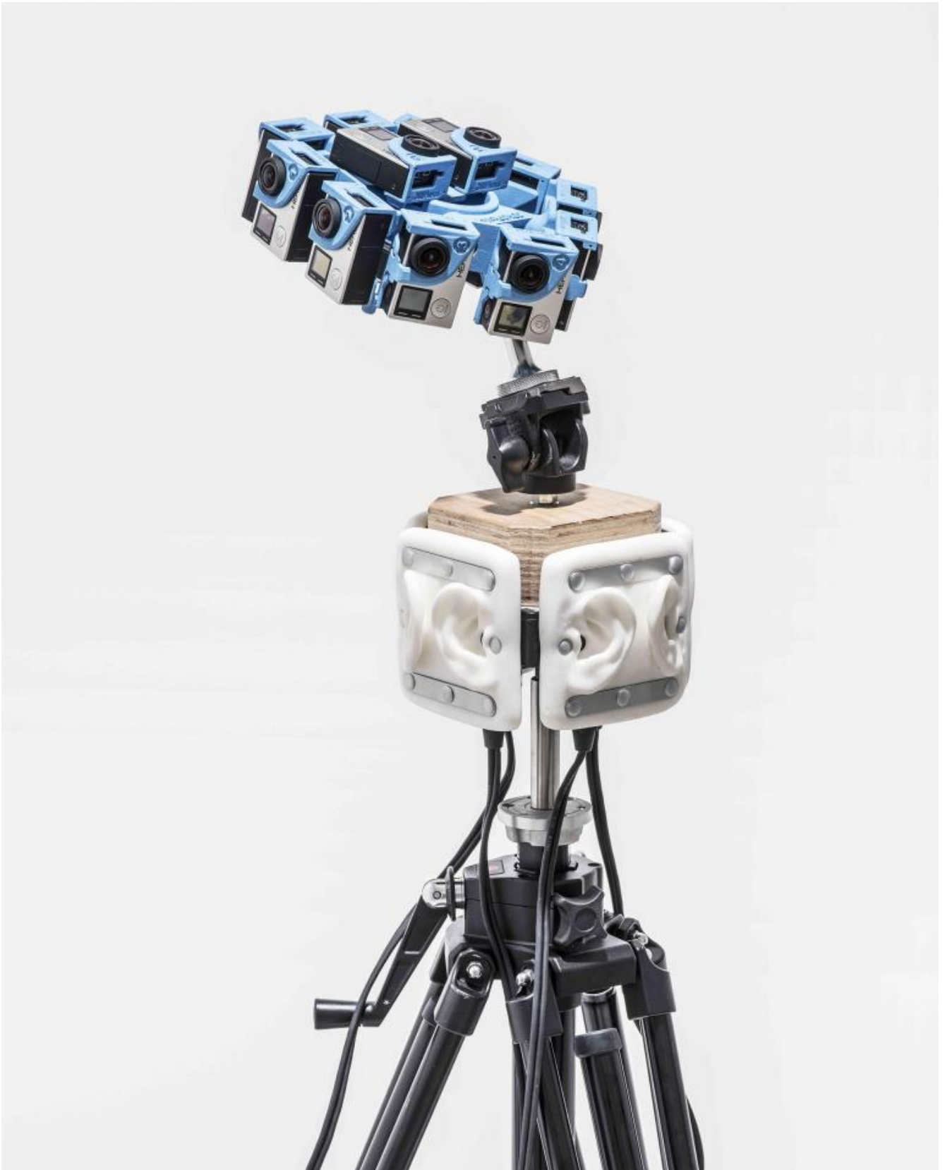
MATTHIEU GAFSOU - Palazzo Pepoli Campogrande 4.5.1