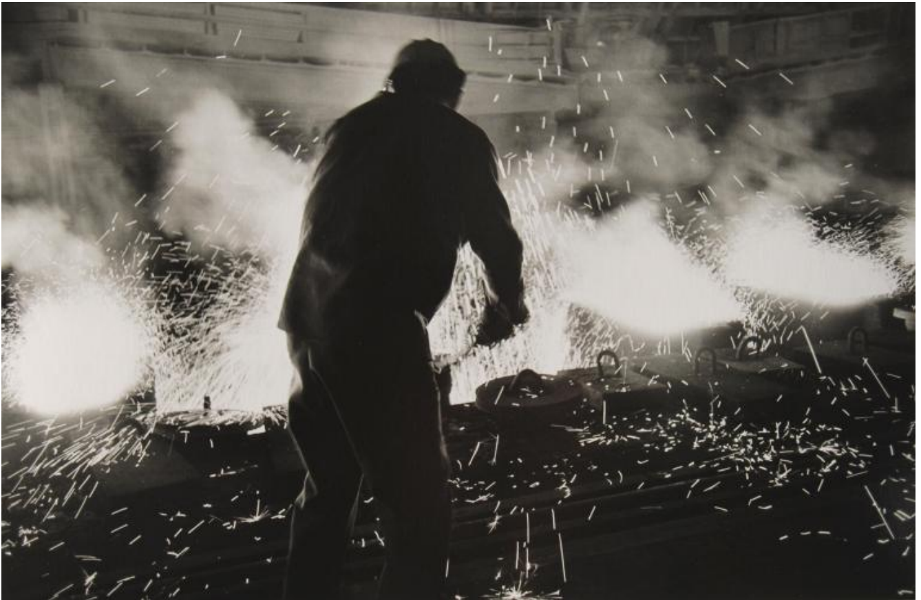
LISETTA CARMi - 2019.

Ben lo testimonia Lisetta Carmi, che nel restituire le immagini del porto di Genova e dello stabilimento dell'Italsider utilizza un linguaggio sperimentale, tra astrazione e documentazione. La mostra è accompagnata dal brano musicale di Luigi Nono che visita, con Lisetta Carmi, quegli stabilimenti nel 1964, ne registra i rumori e li pone alla base della sua composizione La fabbrica illuminata .