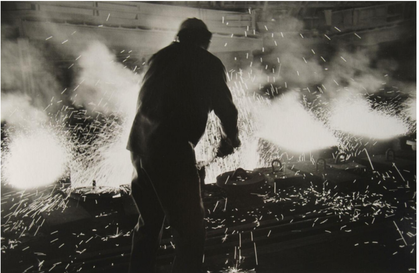
LISETTA CARMi - 2019.

Ben lo testimonia Lisetta Carmi, che nel restituire le immagini del porto di Genova e dello stabilimento dell'Italsider utilizza un linguaggio sperimentale, tra astrazione e documentazione. La mostra è accompagnata dal brano musicale di Luigi Nono che visita, con Lisetta Carmi, quegli stabilimenti nel 1964, ne registra i rumori e li pone alla base della sua composizione La fabbrica illuminata .