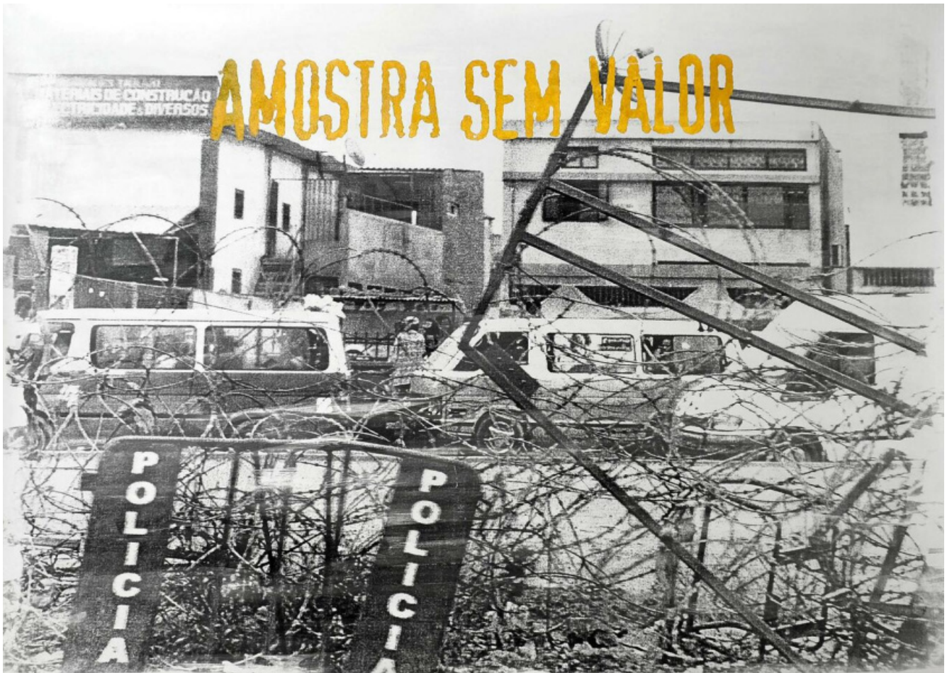
DÉLIO JASSE - Fondazione del Monte - Palazzo Paltroni Sem valor, 2019

Matthieu Gafsou, H+ , di formazione filosofo, lavora sul concetto di Transumanesimo , spesso abbreviato con la sigla H+ . È un movimento che si dà come obiettivo quello di migliorare le performance cognitive, psichiche e fisiche dell'uomo attraverso l'utilizzo della scienza e della tecnologia. Il progetto costituisce una vasta ricerca su questo fenomeno, svolta all'interno di istituzioni scientifiche, laboratori e comunità in diversi paesi. A partire dalla capillare diffusione degli smartphone , che costituiscono ormai l'estensione del corpo di miliardi di individui, il lavoro documenta dispositivi e innovazioni che vanno dai supporti medici ( pacemaker , protesi, arti cibernetici) agli innesti di microchip , dai cibi sintetici alle strategie anti-invecchiamento. Immagini che sono affidate a un vero sistema di allestimento che sovrasta l'opera e che pare diventare il vero tema della mostra stessa e dove le opere diventano funzionali all'allestimento stesso. Appare quindi una deroga dell'autore che sposta l'attenzione del proprio messaggio all'allestimento, a volte a scapito della chiarezza, nel tentativo forse di superare la figura stessa del fotografo o del linguaggio fotografico. Il progetto si