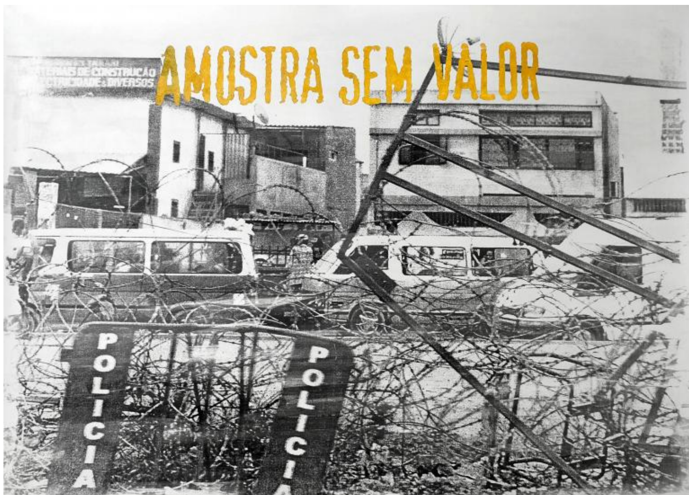
DÉLIO JASSE – Fondazione del Monte - Palazzo Paltroni Sem valor , 2019