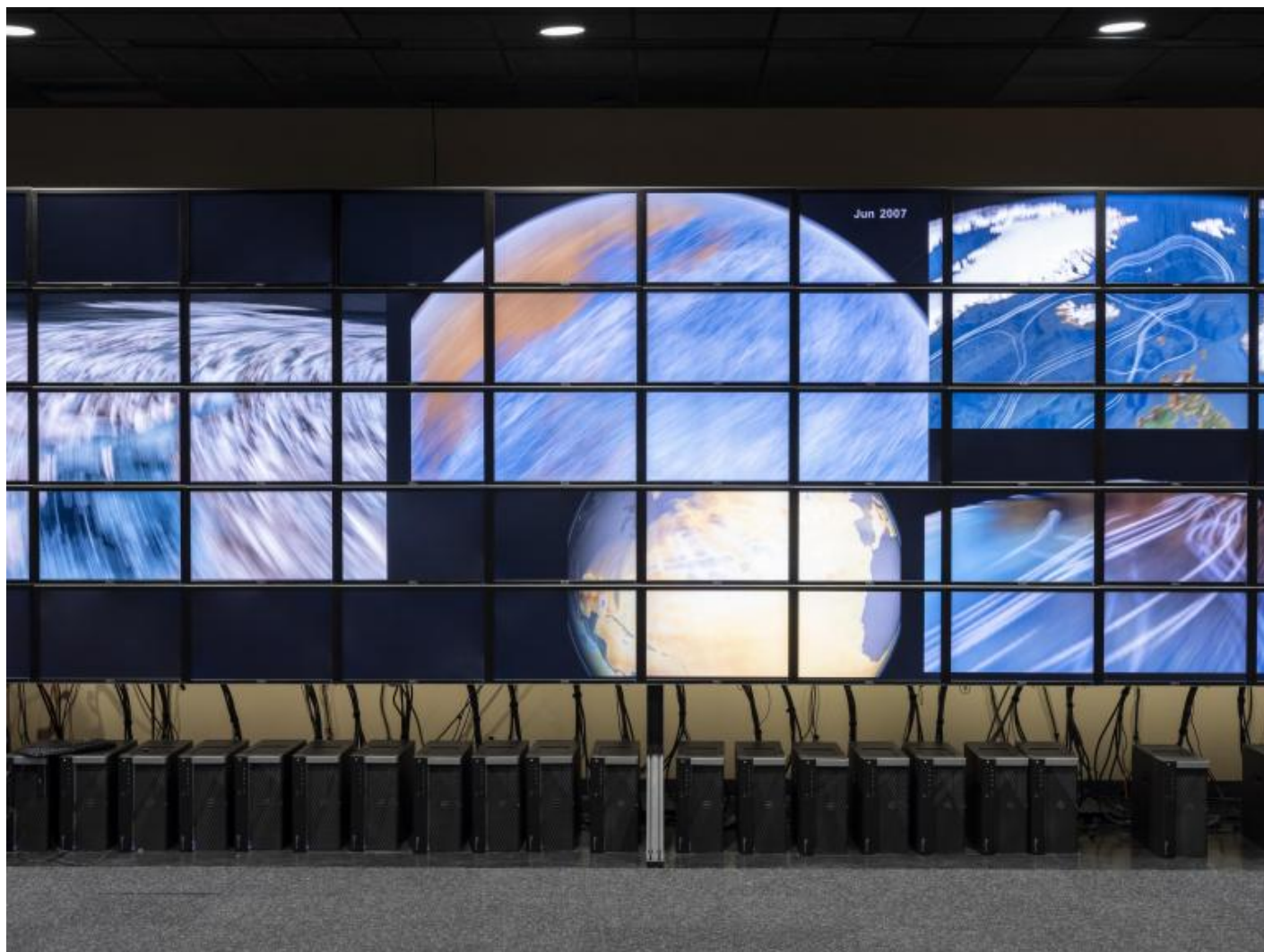
ARMIN LINKE – Biblioteca Universitaria di Bologna Università del Texas, Austin, sala di modellizzazione delle correnti oceaniche, Institute for Computational Engineering and Sciences (ICES) Computational Research in Ice and Oceans Group (CRIOS), Austin, Texas, USA, 2018 © Armin Linke 2018. Courtesy Galleria vistamare/ vistamarestudio, Pescara / Milan.