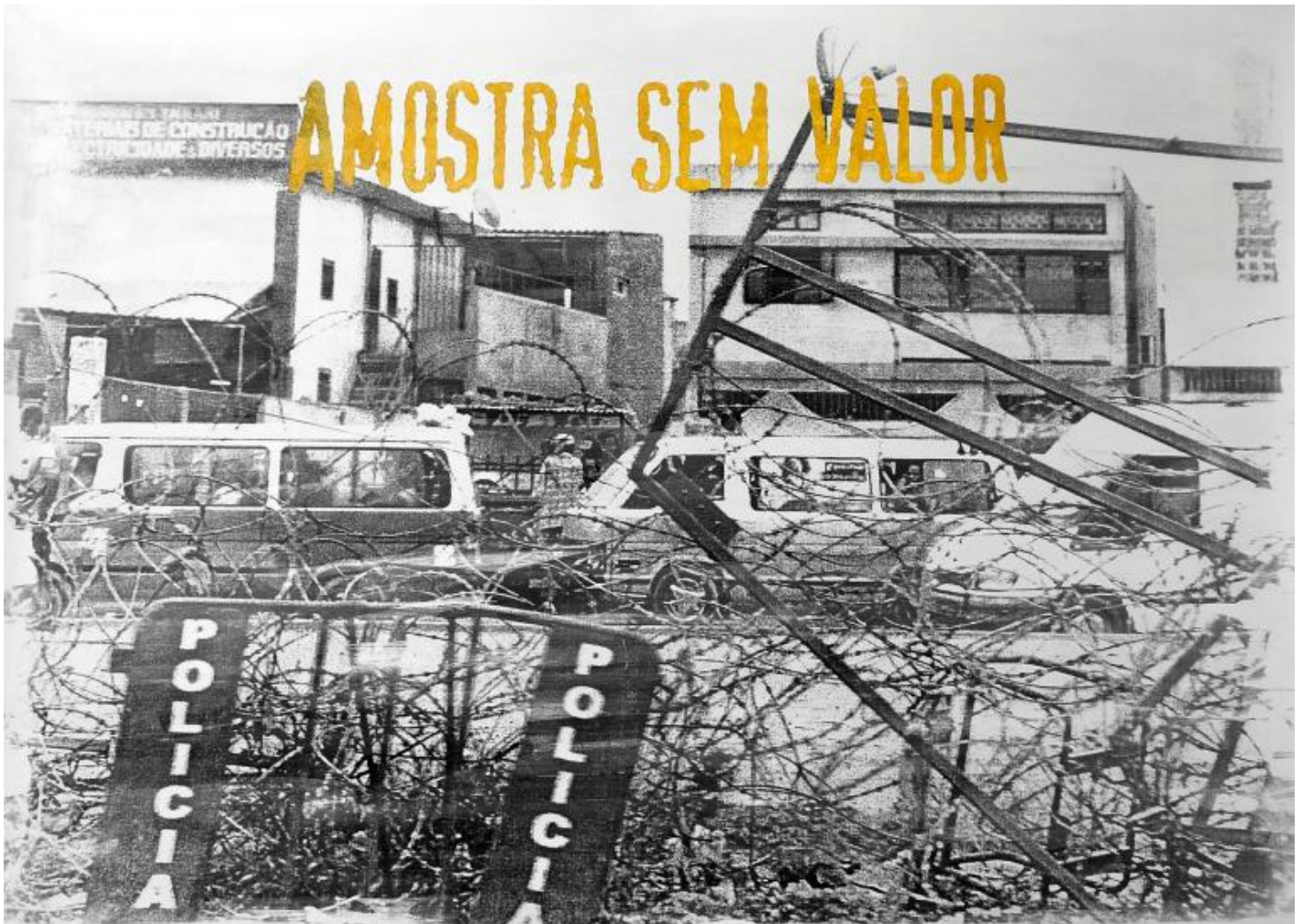
DÃ?LIO JASSE â?? Fondazione del Monte - Palazzo Paltroni Sem valor , 2019