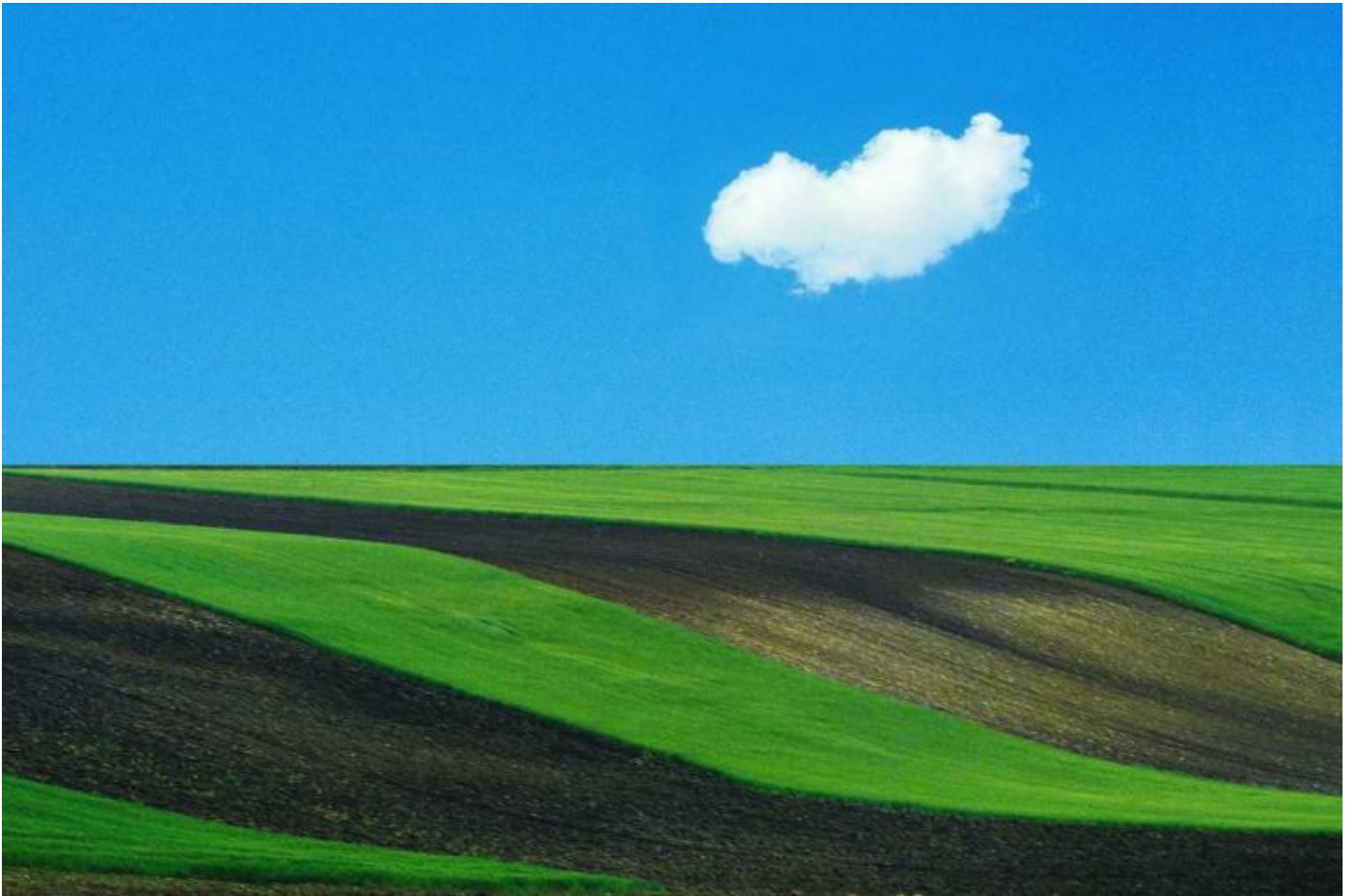
Opera di Franco Fontana.