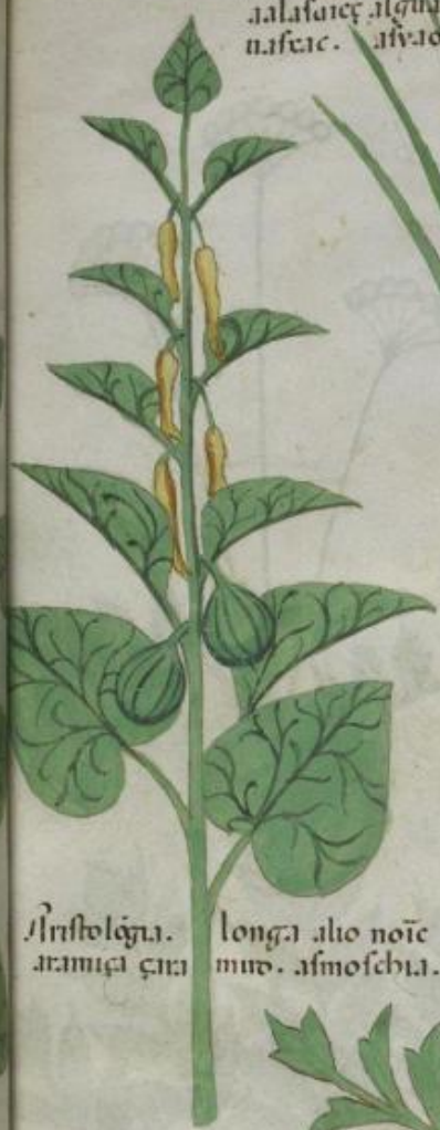
Aristolaga. longa alio noie aramici cari mud. asmoschia.

Artamita herba. e. q. di adariam q aduche. et buchoz. marich.