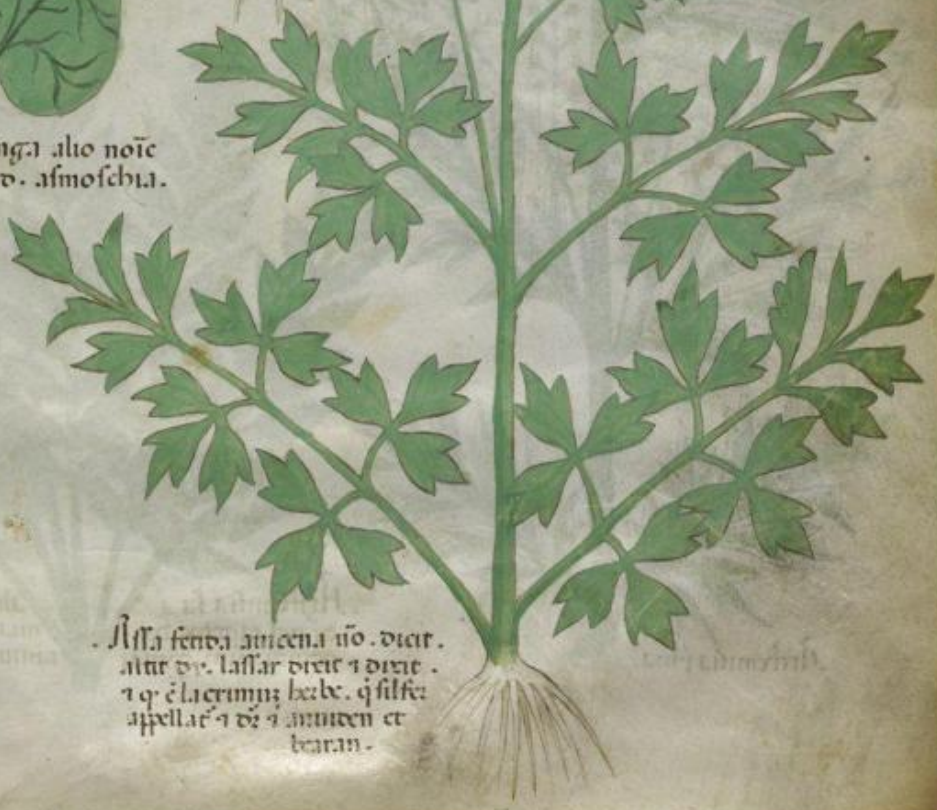
Alla fenda amena no. dicit. alit dy. lassar dicit q dicit. q q e lacrimuz herbe. q silfa appellat q dicit q amicen et bearan.