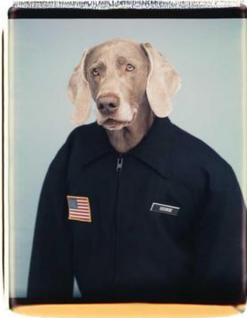
William Wegman, George, 1997.