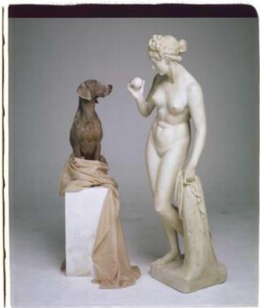
William Wegman, On base, 2007.

Sosto davanti a "Casual", foto del 2002 che è stata scelta come locandina della mostra. La testa del Weimaraner è leggermente inclinata verso la sua destra, lo sguardo esprime un'attenzione disinvolta, amichevole. Uno stare al mondo senza troppi pensieri. La stessa idea che arriva dalle braccia che corrono lungo il corpo per infilarsi in tasca. Sono braccia vuote, che simulano gli arti umani. Ma, pur non essendoci, si leggono come segnali di abbassamento della guardia, di resa soddisfatta al ritmo diverso di una giornata non lavorativa. Collana rossa e calzoncini dello stesso colore si abbinano alla maglia e suggeriscono sensazioni di pomeridiana stravaganza, eleganti soluzioni estemporanee di un gentiluomo di campagna.