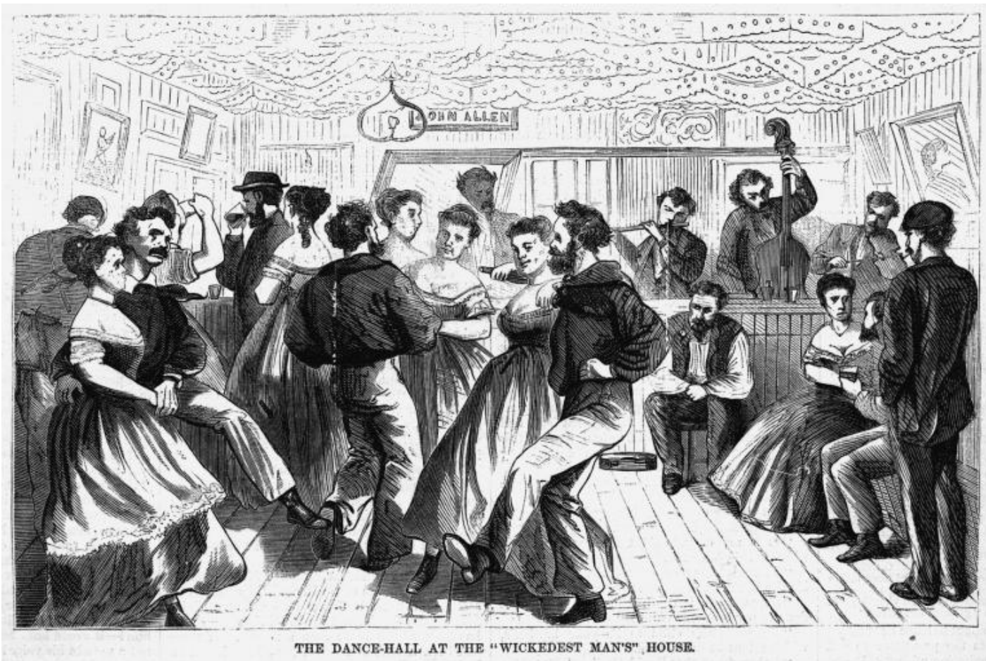
THE DANCE-HALL AT THE "WICKEDEST MAN'S" HOUSE.