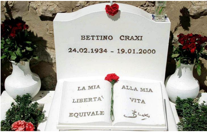
La tomba di Craxi a Hammamet.