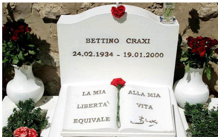
La tomba di Craxi a Hammamet.