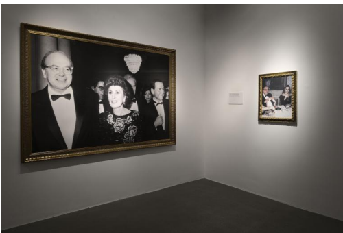
Francesco Vezzoli, “Party politics” (2019).

Ma nel frattempo non c'è stato leader forte dell'ultimo ventennio che non abbia pensato agli aspetti peggiori di quella lezione. Berlusconi l'ha detto due o tre volte: “Non farò la fine di Craxi”. Là dove questa fine era da intendersi come una specie di gorgo profondo e oscuro che risucchiava insaziabile il Super Colpevole da spedire nel deserto carico dei peccati di tutti in tal modo dando sfogo all'angoscia collettiva secondo il rito crudele del capro espiatorio.