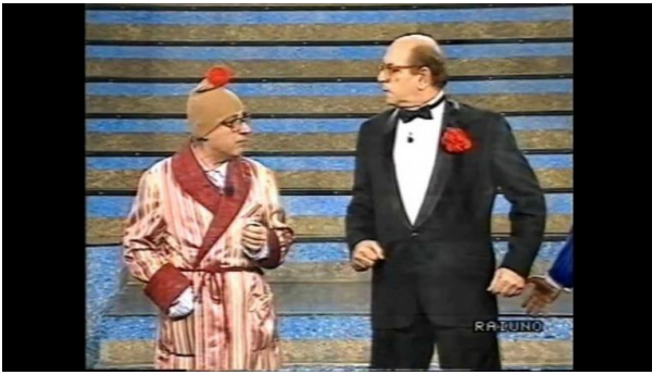
Pier Luigi Zerbinati.

Ã che l'Italia resta pur sempre la patria della commedia, anche se poi spesso e volentieri vede accadere drammi veri, tristi e perfino poetici come nessuno sceneggiatore riuscirebbe a renderli. CosÃ Bettino, dopo quella disavventura, volle conoscere Zerbinati: a loro modo divennero amici, si facevano lunghe telefonate in milanese, l'ultima venti giorni prima che Craxi se ne andasse â per rimanere in realtÃ sulla scena pubblica nelle forme disumane in cui si Ã detto.