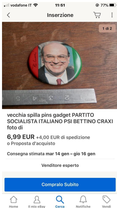
Vecchia spilla su ebay.

avversari di un tempo, divenuti ex comunisti, tentarono mezze riabilitazioni, o vorrei ma non posso, quasi sempre rifugiandosi nel comodo, ma ambiguo argomento che Craxi, a differenza di loro, aveva capito la “modernità” e proceduto sulla via di una ancora più equivoca “modernizzazione”.