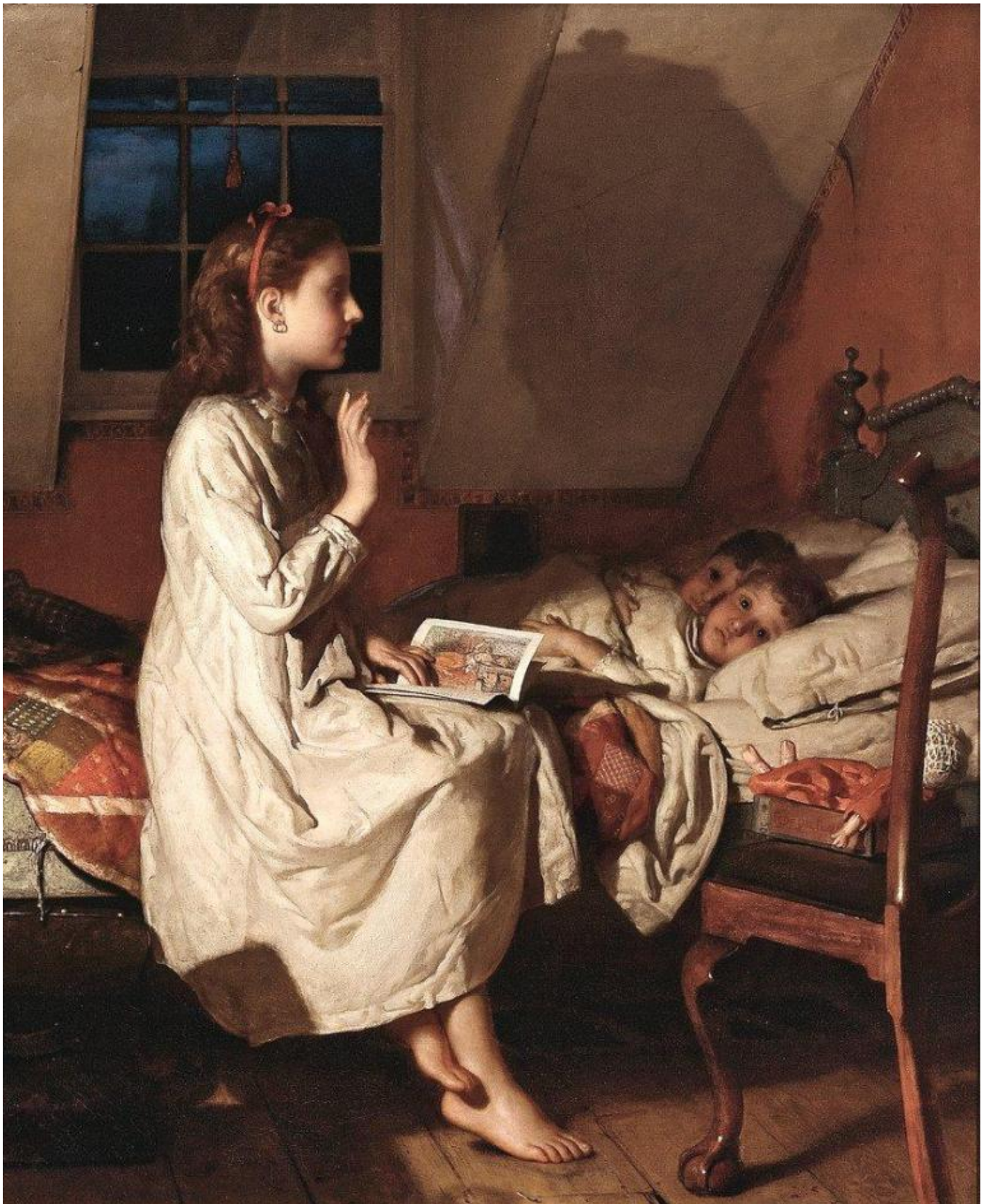
Dipinto di Seymour Joseph Guy (1824-1854).