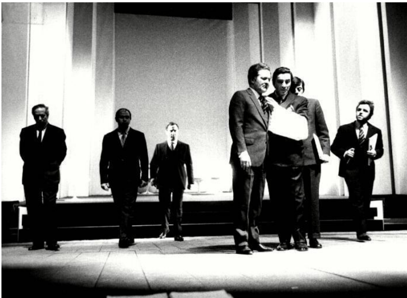
Il crack, ph. Luigi Ciminaghi, Archivio Piccolo Teatro Milano.