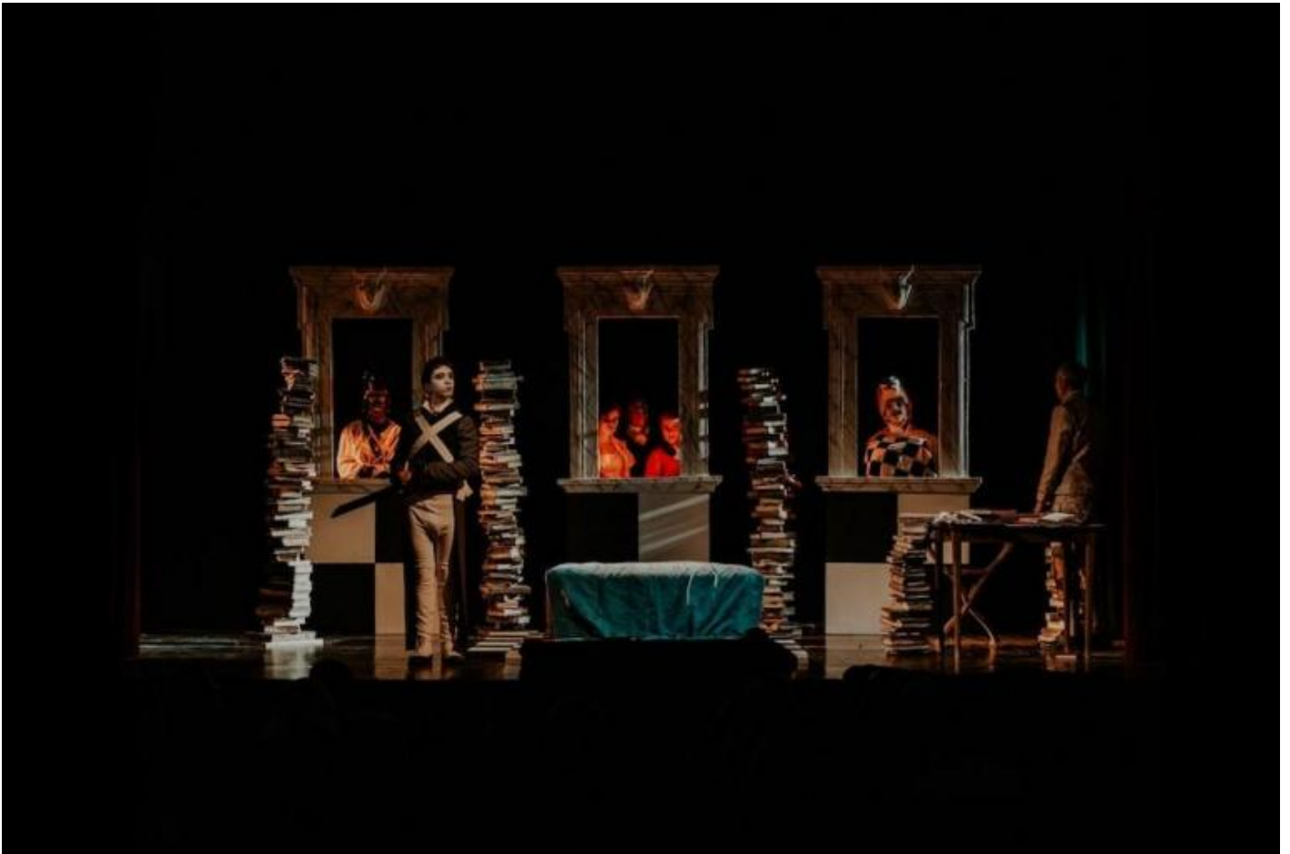
La macchia dell'inchiostro.

Ripubblico, in coda all'articolo, con pochissime modifiche editoriali, un'intervista a Roversi da me fatta per il Corriere di Bologna e pubblicata il 27 gennaio 2011, per la presentazione pubblica della ristampa di Caccia all'uomo.