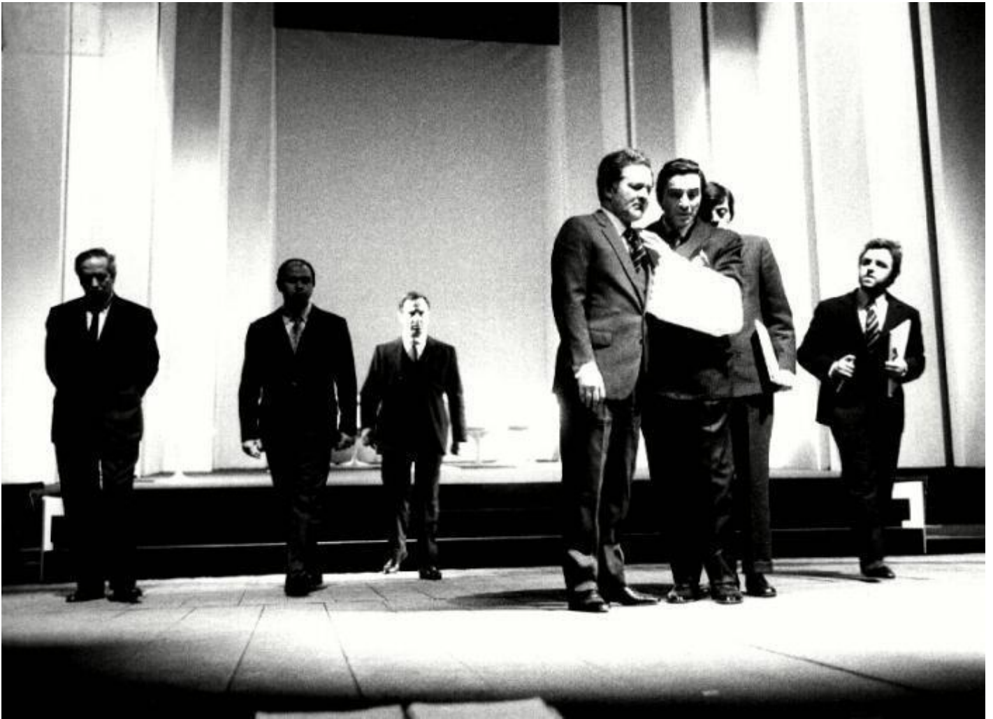
Il crack, ph. Luigi Ciminaghi, Archivio Piccolo Teatro Milano.