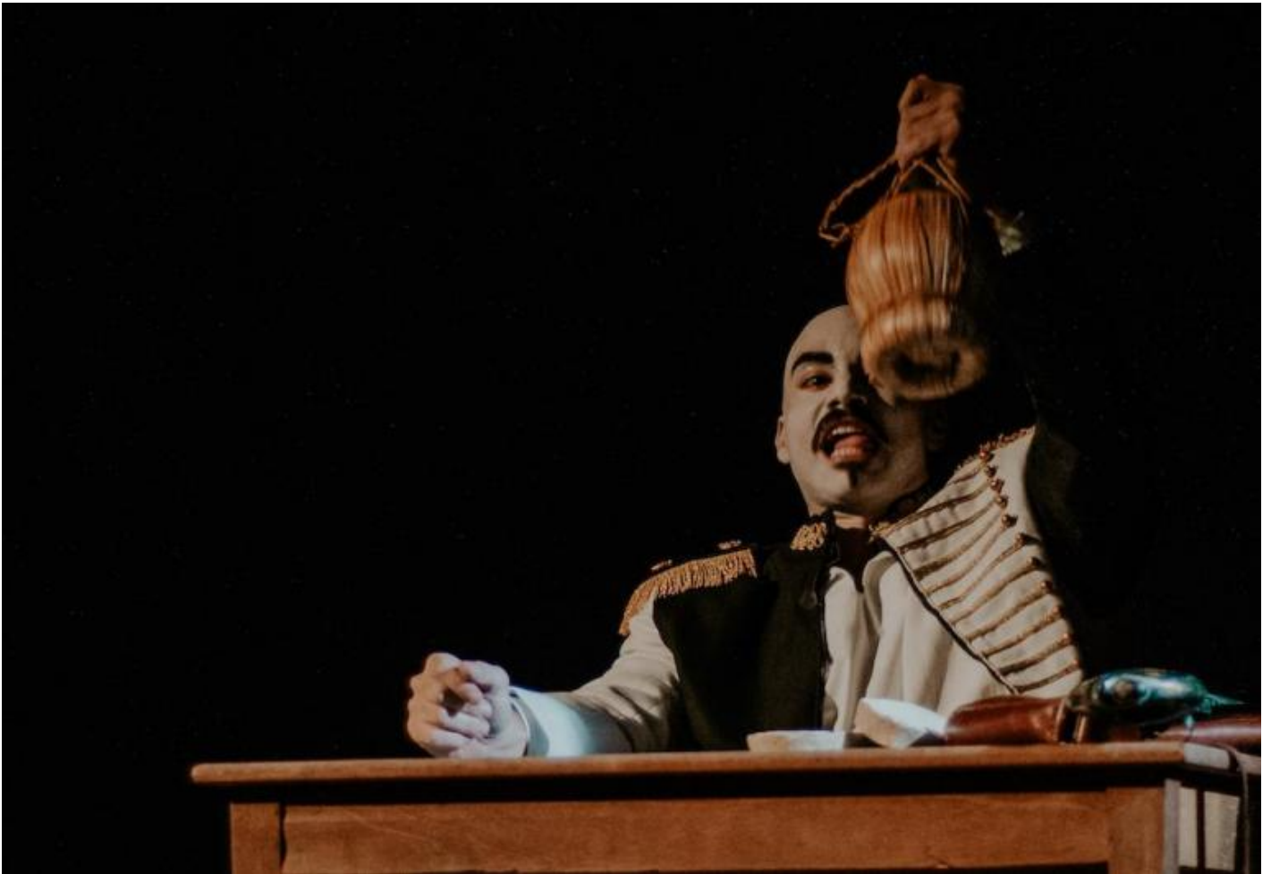
La macchia dâ??inchiostro, ph. Carolina Negroni.

Ma lo spettacolo ha il merito di rimettere in circolo un testo efficace piÃ¹ degli altri precedenti, sempre gravato, forse, da un eccesso di progettualitÃ e condensazione, come lascia intendere anche lâ??imponenza dellâ??apparato di note di Picchi. In quegli stessi anni Roversi iniziÃ² a lavorare a Enzo re , lâ??ultimo lavoro teatrale compiuto. Quel nuovo impegno, che sarebbe stato lungo, segnava un cambio di passo, di stile, di tempi, in attesa di lasciare le scene per territori forse a lui piÃ¹ consoni. Una citazione di Arnaldo Picchi, nel finale del commento alla Macchina da guerra piÃ¹ formidabile , bene segnalava il passaggio tra un fare in cui per il poeta il teatro Ã¨ quasi regesto e sonda dei tempi, delle loro effettualitÃ e delle loro possibilitÃ , e unâ??altra in cui mette in atto il tentativo di ascolto delle cose, spogliate, cercate nelle loro risonanze piÃ¹ profonde (p. 172):