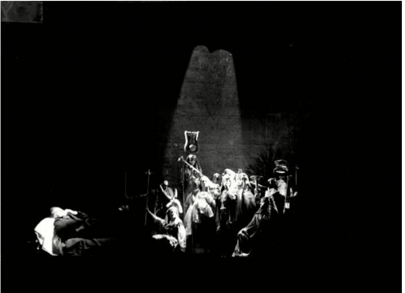
Il crack, parte terza, nella prigione, ph. Luigi Ciminaghi, Archivio Piccolo Teatro Milano.

Una risposta di Roversi alle critiche negative affidata all'Unità ci fornisce una chiave d'interpretazione del testo. Il poeta, accusando a sua volta i recensori di sordità e di "belletterismo", sostanzialmente di giudicare su un'idea superata di testo drammatico, non all'altezza di tempi nuovi, rivendica alla sua pièce il carattere di una critica metaforica, linguistica, applicata ai temi dell'azione e della violenza, del sistema verso sé stesso attraverso il sistema del sant'ufficio della banca, e contro gli oppositori. Rivendica al suo lavoro la funzione di smontare meccanismi occultati dal sistema (spesso celati proprio sotto le trame teatrali ben coneggiate). Ancora più chiaro un intervento sulla rivista "Rendiconti", 26-27, gennaio 1974, sotto il titolo Un circo e quattro gladiatori :