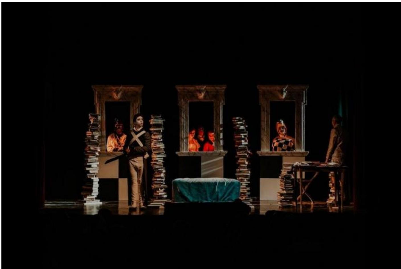
La macchia d'inchiostro.

Ripubblico, in coda all'articolo, con pochissime modifiche editoriali, un'intervista a Roversi da me fatta per il "Corriere di Bologna" e pubblicata il 27 gennaio 2011, per la presentazione pubblica della ristampa di Caccia all'uomo.