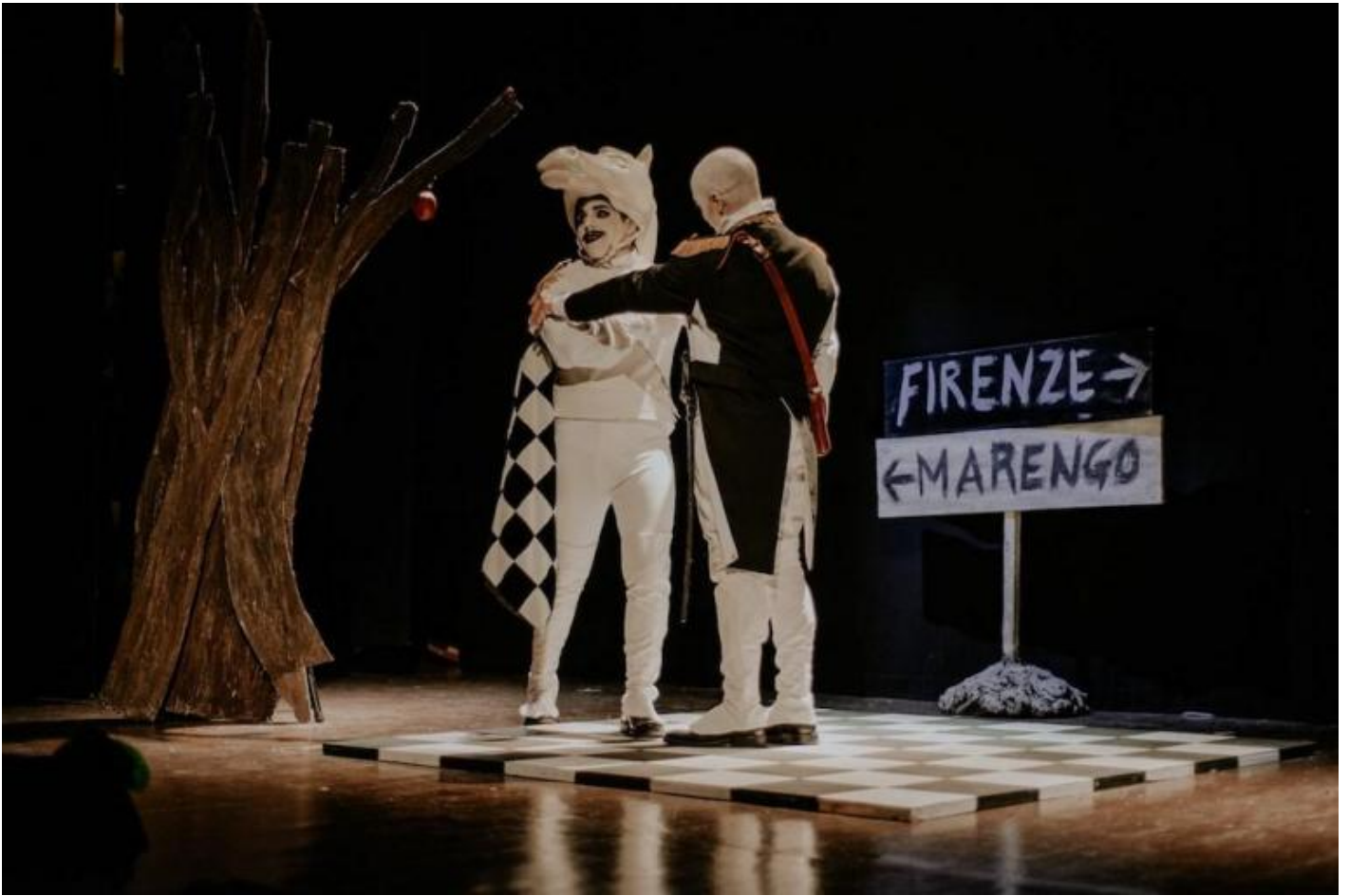
La macchia dâ??inchiostro