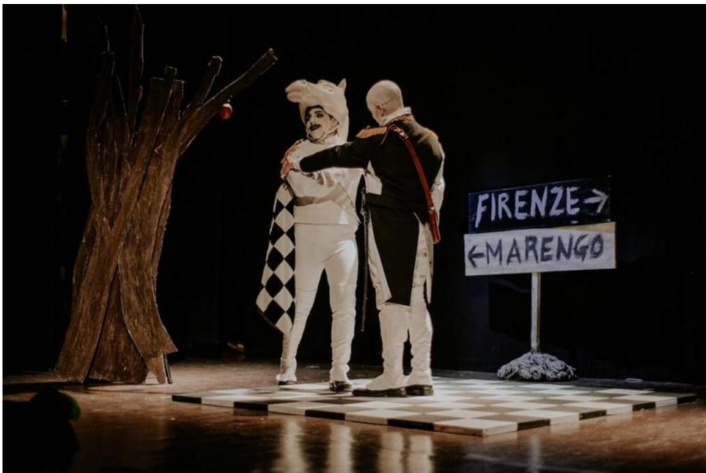
La macchia d'inchiostro