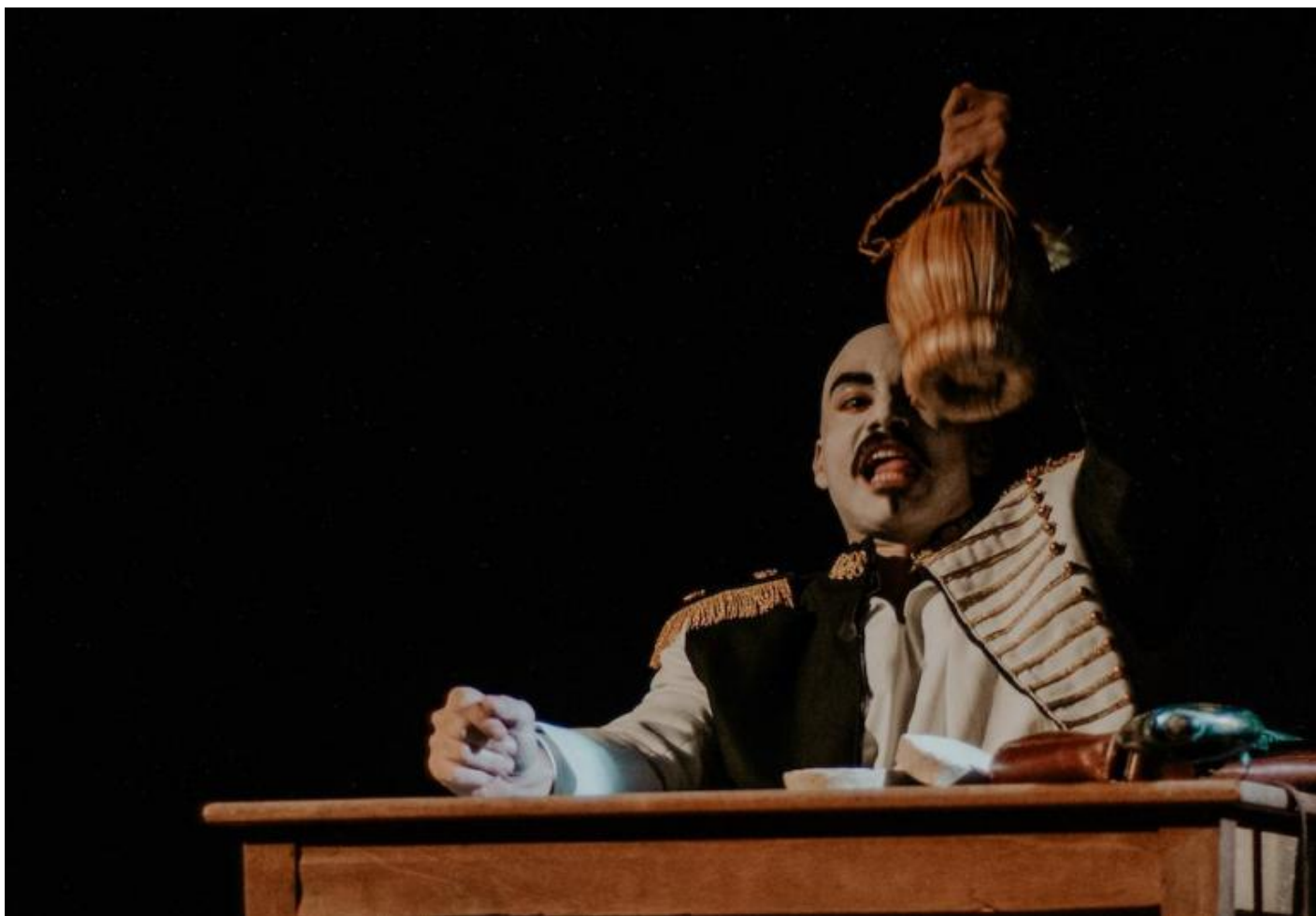
La macchia d'inchiostro.

Ma lo spettacolo ha il merito di rimettere in circolo un testo efficace più degli altri precedenti, sempre gravato, forse, da un eccesso di progettualità e condensazione, come lascia intendere anche l'imponenza dell'apparato di note di Picchi. In quegli stessi anni Roversi iniziò a lavorare a Enzo re , l'ultimo lavoro teatrale compiuto. Quel nuovo impegno, che sarebbe stato lungo, segnava un cambio di passo, di stile, di tempi, in attesa di lasciare le scene per territori forse a lui più consoni. Una citazione di Arnaldo Picchi, nel finale del commento alla Macchina da guerra più formidabile , bene segnalava il passaggio tra un fare in cui per il poeta il teatro è quasi regesto e sonda dei tempi, delle loro effettualità e delle loro possibilità, e un'altra in cui mette in atto il tentativo di ascolto delle cose, spogliate, cercate nelle loro risonanze più profonde (p. 172):