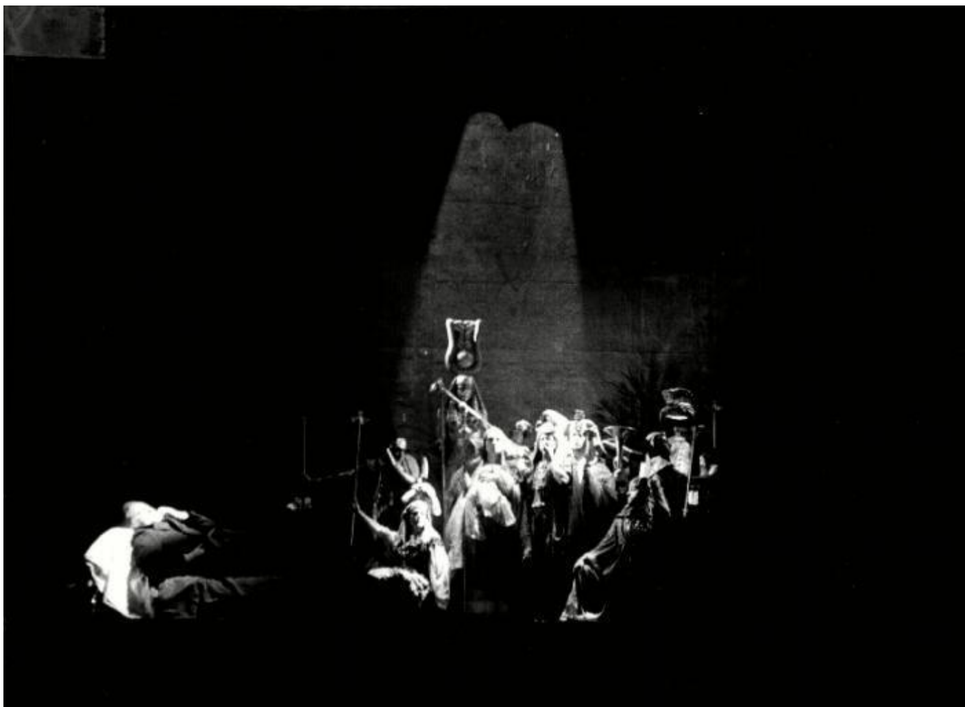
Il crack, parte terza, nella prigione, ph. Luigi Ciminaghi, Archivio Piccolo Teatro Milano.

Una risposta di Roversi alle critiche negative affidata all’“Unità” ci fornisce una chiave d’interpretazione del testo. Il poeta, accusando a sua volta i recensori di sordità e di “bellettrismo”, sostanzialmente di giudicare su un’idea superata di testo drammatico, non all’altezza di tempi nuovi, rivendica alla sua pièce il carattere di una critica metaforica, linguistica, applicata ai temi dell’azione e della violenza, del sistema verso sé stesso “attraverso il sistema del sant’ufficio della banca”, e contro gli oppositori. Rivendica al suo lavoro la funzione di smontare meccanismi occultati dal sistema (spesso celati proprio sotto le trame teatrali ben congegnate). Ancora più chiaro è un intervento sulla rivista “Rendiconti”, 26-27, gennaio 1974, sotto il titolo Un circo e quattro gladiatori :