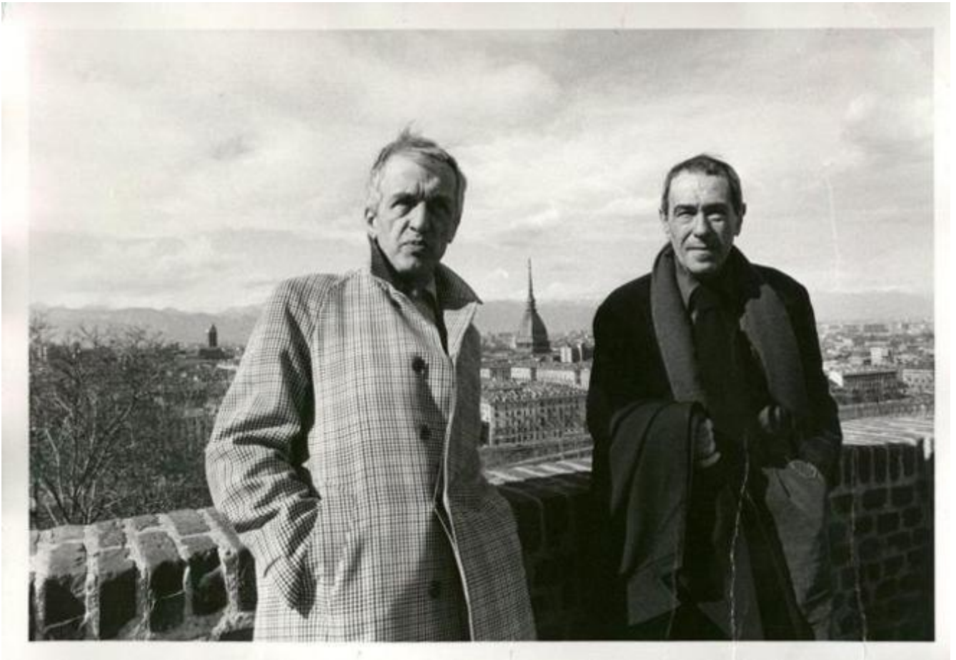
Fruttero e Lucentini a Torino.

‘Tipicità’ è la parola-chiave e insieme la cifra che caratterizza la poetica di F&L; un concetto simile ma non identico a quello di ‘banalità’, se non altro perché il tipico è più funzionale e implicabile nel sistema umoristico dei due autori. Invece la parola ‘banalità’ fu usata sia da Pietro Citati sia da Italo Calvino nelle recensioni a Il Palio delle contrade morte (1983) scritte rispettivamente per il «Corriere della Sera» e per «la Repubblica» (se ne possono leggere degli estratti nell’apparato del secondo tomo). In verità quel romanzo è uno dei meno banali e anzi più curiosi, imprevedibili, un po’ strampalati ma arguti di F&L, che sembrano divertirsi come matti, e ci tengono a mostrarlo: