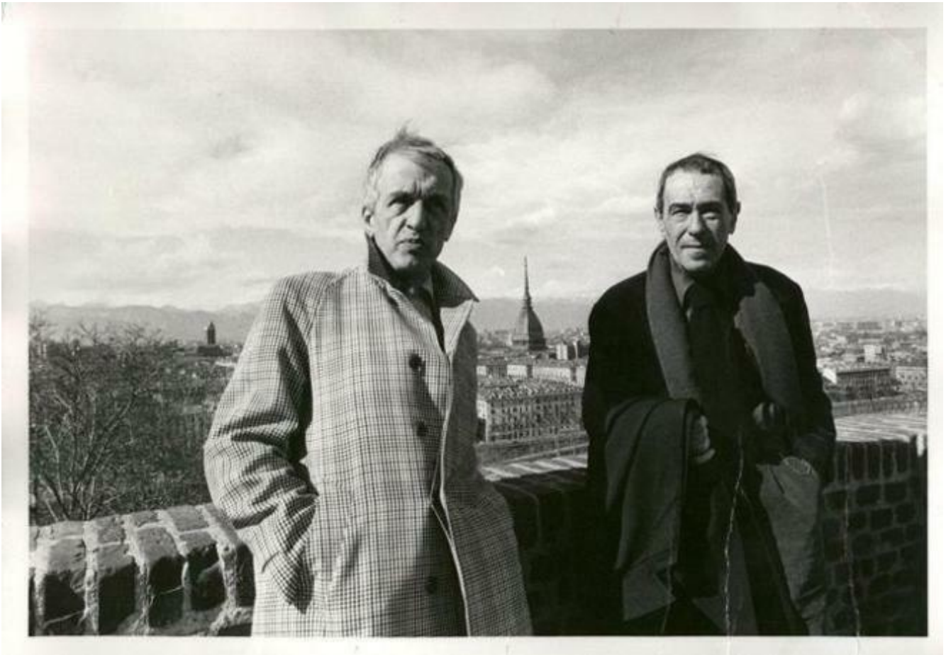
Fruttero e Lucentini a Torino.

‘Tipicità’ è la parola-chiave e insieme la cifra che caratterizza la poetica di F&L; un concetto simile ma non identico a quello di ‘banalità’, se non altro perché il tipico è più funzionale e implicabile nel sistema umoristico dei due autori. Invece la parola ‘banalità’ fu usata sia da Pietro Citati sia da Italo Calvino nelle recensioni a Il Palio delle contrade morte (1983) scritte rispettivamente per il «Corriere della Sera» e per «la Repubblica» (se ne possono leggere degli estratti nell’apparato del secondo tomo). In verità quel romanzo è uno dei meno banali e anzi più curiosi, imprevedibili, un po’ strampalati ma arguti di F&L, che sembrano divertirsi come matti, e ci tengono a mostrarlo: