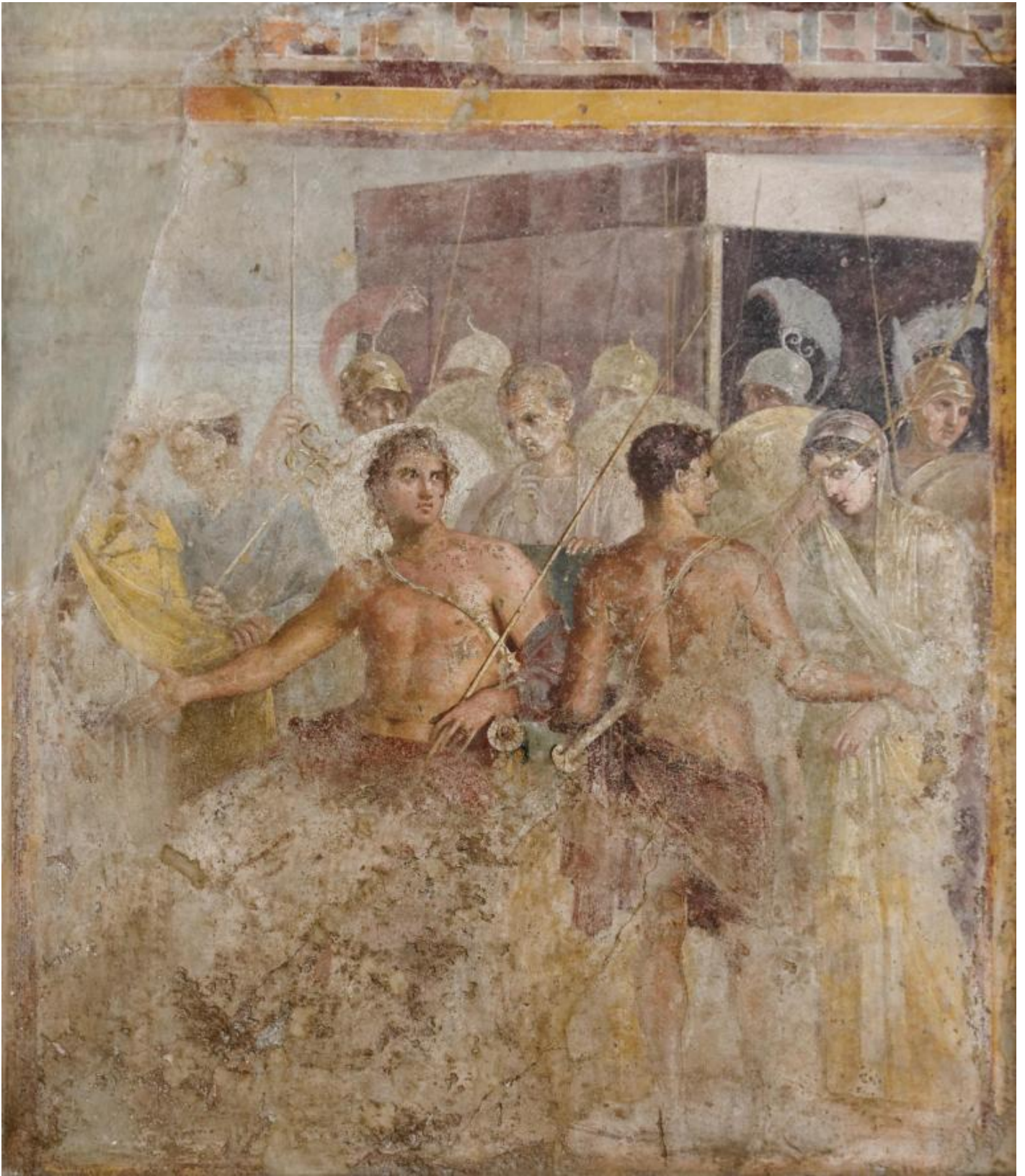
Achille rinuncia a Briseide.

L'arte del commentum consente possibilità interpretative più libere e di largo respiro, rispetto alle limitazioni che, non di rado, impone l'ortodossia delle metodologie della critica e della storia dell'arte. Dalla lettura dei testi che accompagnano le immagini si evince chiaramente il perché della necessità di questa scelta. Avvalendosi, quindi, di queste possibilità il filosofo punta a far emergere quel qualcosa delle immagini che non si dà immediatamente alla loro comprensione, forse anche perché non può