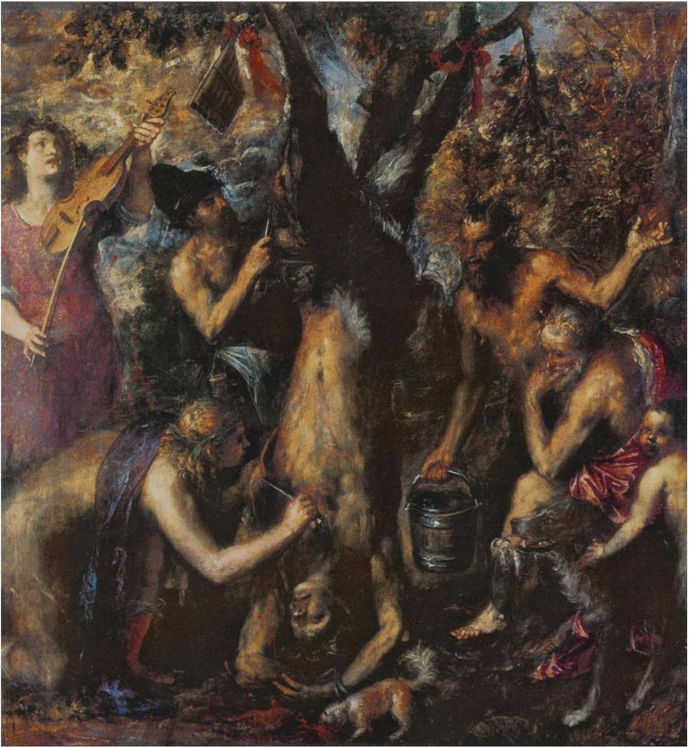
Tiziano, Lo scorticamento di Marsia.

Lo scorticamento di Marsia richiamato nell'invocazione dantesca viene assunto dal filosofo come una metafora dell'ispirazione: possiamo presumere con ragionevole verisimiglianza che Tiziano sia stato colpito da questo passo e ne abbia tratto l'idea di fare dello scorticamento del satiro allegoria dell'abissale difficoltà dell'ispirazione del pittore. Il quale sente in qualche modo che quel corpo scorticato è il suo, perché l'ispirazione che insegue da esso dolorosamente incarnata e situata tra l'inumano e l'umano e tra l'animale e il divino.