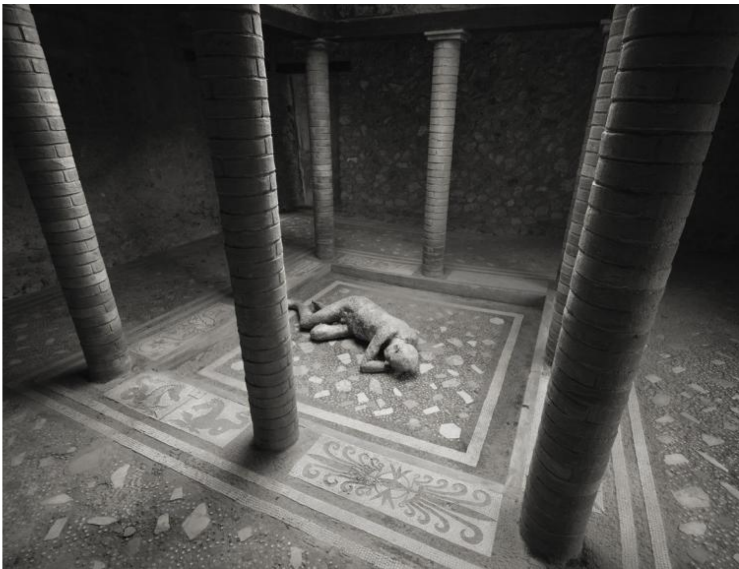
Kenro Izu Pompei, Casa del Menandro, 2016 Stampa inkjet 61x76 cm © Kenro Izu Courtesy Fondazione di Modena - Fondazione Modena Arti Visive.

La fotografia può avere il potere di evocare, “ non è una mera forma di arte – puntualizza l’autore – bensì un percorso di ricerca costante nella vita, per trovare il significato più recondito dell’esistenza stessa. Per questo considero ogni fotografia come la mia orma lasciata su un sentiero, talvolta sono orme nette e profonde, altre volte indefinite e superficiali. ”