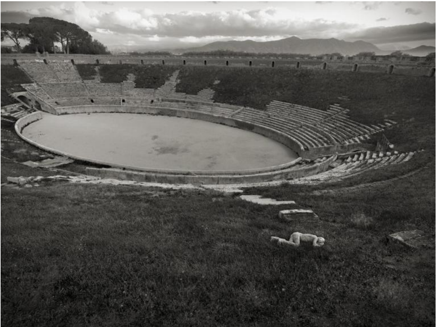
Kenro Izu Pompei, Anfiteatro, 2016 Stampa inkjet 61x76 cm © Kenro Izu Courtesy Fondazione di Modena - Fondazione Modena Arti Visive.

Sacred Places , di cui fanno parte, oltre alle fotografie delle Piramidi d'Egitto, anche quelle delle Piramidi dei Maya, di Stonehenge e di molti altri siti archeologici situati in svariate parti del mondo, dal Messico al sud est asiatico, diventa il progetto piú importante e tutt'ora in corso, della sua vita. L'intenzione dell'autore è quella di entrare nel luogo attraverso l'immagine e per far questo utilizza il banco ottico che riproduce accuratamente ogni particolare cosí come la stampa al palladio che restituisce la materia di ogni cosa.