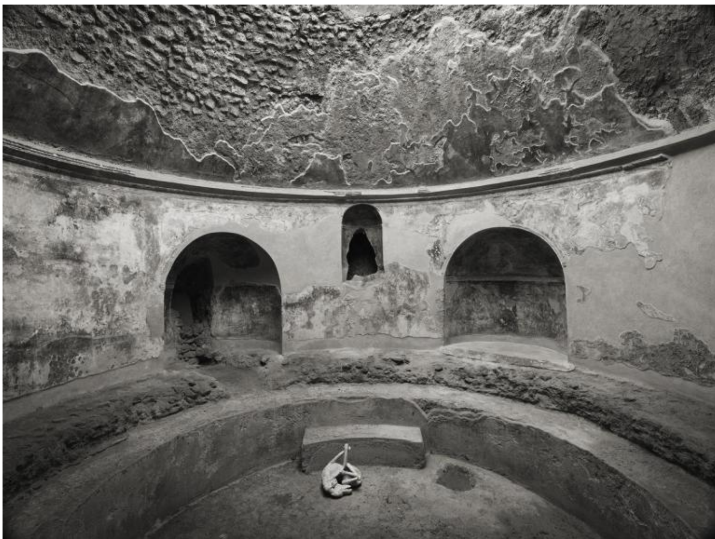
Kenro Izu Pompei, Terme Stabiane, 2016 Stampa al platino 42,5x55 cm © Kenro Izu Courtesy Fondazione di Modena - Fondazione Modena Arti Visive.

Molti autori, nel momento in cui scattano, sono spesso alla ricerca inconscia della bella fotografia. Una costruzione mentale che li induce a osservare il soggetto da un punto di vista principalmente estetico, (nel senso di estetizzante). L'intento di Kenro Izu è invece quello di catturare lo spirito del soggetto. Secondo la sensibilità dell'artista giapponese spirito equivale a vita . Per questo tanto i fiori o la frutta dei suoi still life quanto i paesaggi, le architetture e il corpo umano sono per lui tutti soggetti che racchiudono un alito di spiritualità riconducibile ad una sacralità arcaica.