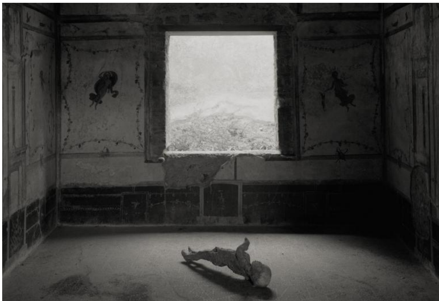
Kenro Izu Pompei, Casa degli Amorini Dorati, 2016 Stampa al platino 42,5x55 cm © Kenro Izu Courtesy Fondazione di Modena - Fondazione Modena Arti Visive.

In occasione dell'esposizione "Requiem for Pompei" in corso a Modena fino al 13 aprile 2020, la già ampia bibliografia di Kenro Izu si arricchisce di una nuova monografia dall'omonimo titolo, dedicata proprio a questo segmento di lavoro e pubblicata per i tipi di Skira.