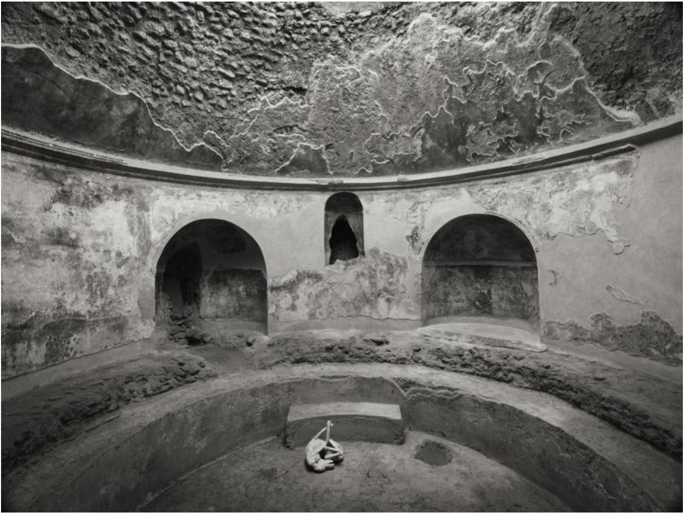
Kenro Izu Pompei, Terme Stabiane, 2016 Stampa al platino 42,5x55 cm © Kenro Izu Courtesy Fondazione di Modena - Fondazione Modena Arti Visive.

Al contempo la sua è una fotografia che rivela come la complessa bellezza della vita possa tramutarsi in decadimento e di come questo non smetta comunque di essere “bello”. Un approccio che emerge anche nell’atto del guardare affidato al fruitore, il quale soltanto attraverso una altrettanto lunga e paziente osservazione delle immagini può comprendere la totalità empatica che ha guidato la mano dell’autore, molto lontana dalla rapidità con cui tanta fotografia digitale contemporanea, fatta per essere consumata, si è affermata in tempi recenti.