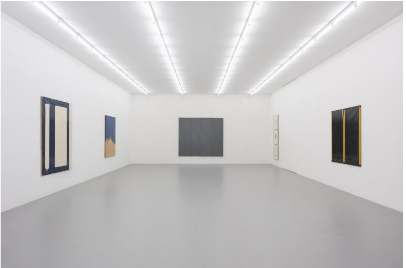
Mario Schifano, Qualcosâ??altro 22.01.2020 â?? 20.03.2020, Installation view GiÃ³ Marconi, Milan

I monocromi rappresentano il punto sorgivo di quella linea ascendente che porterÃ l'artista a brillare come una stella cometa, assunto nel cielo della sua mitologia, e poi lo condurrÃ lungo una traiettoria di caduta, giÃ¹ nel delirio da tossico e delle opere buttate via, le copie, i falsi e tutta lâ??incredibile vicenda esistenziale che per anni ha messo in ombra il valore di una produzione che non ha equivalenti ma solo epigoni.