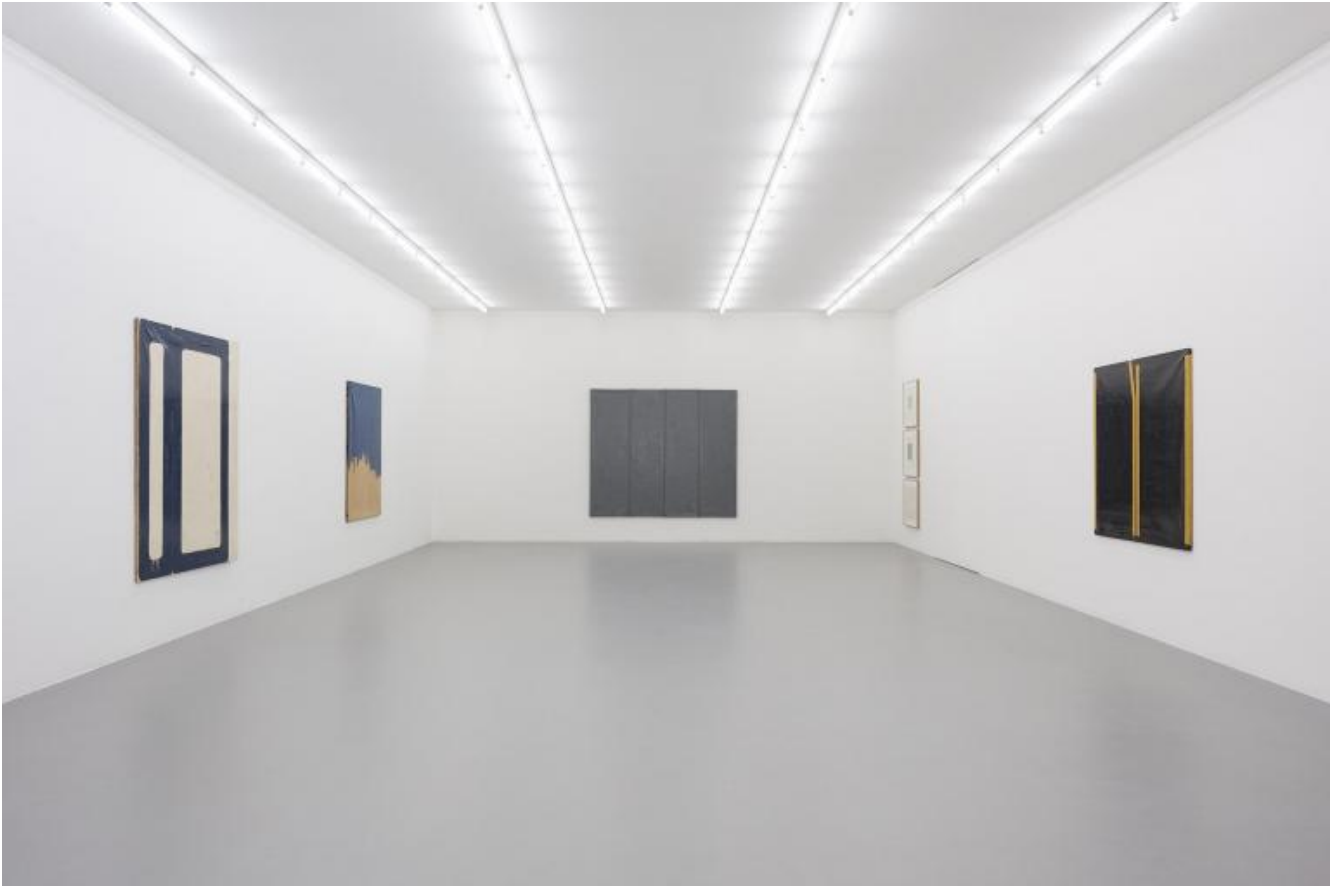
Mario Schifano, Qualcos'altro 22.01.2020 - 20.03.2020, Installation view Gió Marconi, Milan

che accompagna la mostra, a proposito di " un occhio meccanico che Schifano adotta senza remore".