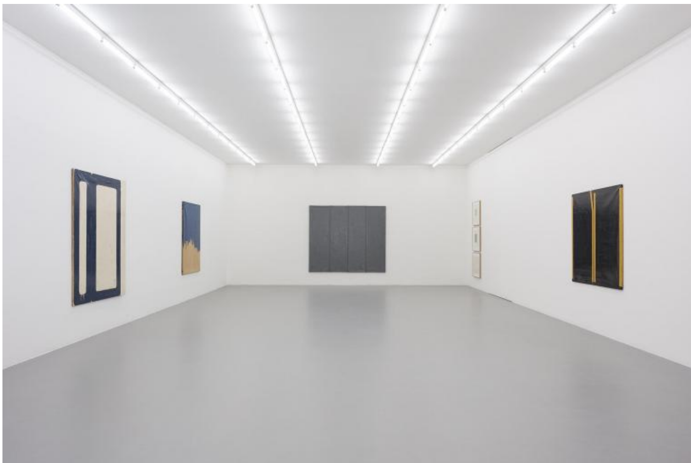
Mario Schifano, Qualcos'altro 22.01.2020 – 20.03.2020, Installation view Gió Marconi, Milan

I monocromi rappresentano il punto sorgivo di quella linea ascendente che porterà l'artista a brillare come una stella cometa, assunto nel cielo della sua mitologia, e poi lo condurrà lungo una traiettoria di caduta, giù nel delirio da tossico e delle opere buttate via, le copie, i falsi e tutta l'incredibile vicenda esistenziale che per anni ha messo in ombra il valore di una produzione che non ha equivalenti ma solo epigoni.