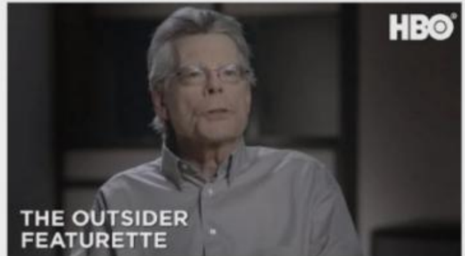
The Outsider (2020): Stephen King and The Outsider Featurette | HBO

Stephen King parla di THE OUTSIDER (2018) e della sua stretta collaborazione con la serie tv HBO (2020) https://www.imdb.com/title/tt8550800/