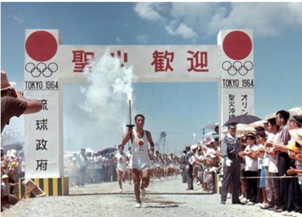
Fiamma Olimpica che attraversa Okinawa ancora occupata.

Nell'edizione del 1964 la staffetta olimpica partì addirittura da Okinawa, a quel tempo ancora occupata dagli americani, riempiendo quel territorio storicamente martoriato di una miriade di bandiere nazionali per poi arrivare infine davanti a Kyōto , il palazzo imperiale di Tokyo. L'ultimo tedororo che accese la fiamma olimpica allo stadio era Yoshinori Sakai, un giovane atleta nato il 6 agosto 1945 a Hiroshima. Una staffetta, anche quella, davvero densa di significati simbolici.