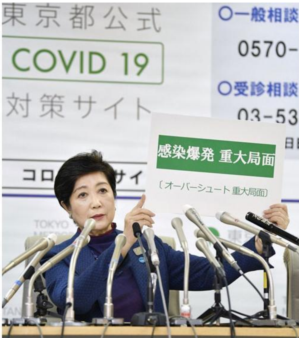
Yuriko Koike, governatrice di Tokyo, alla sua conferenza stampa straordinaria del 20 marzo.

Yuriko Koike, governatrice di Tokyo alla sua conferenza stampa straordinaria del 25 marzo.