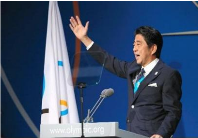
Primo Ministro Shinzo Abe all'Assemblea del CIO a Buenos Aires (2013)

Primo Ministro Shinzo Abe all'Assemblea del CIO a Buenos Aires (2013).