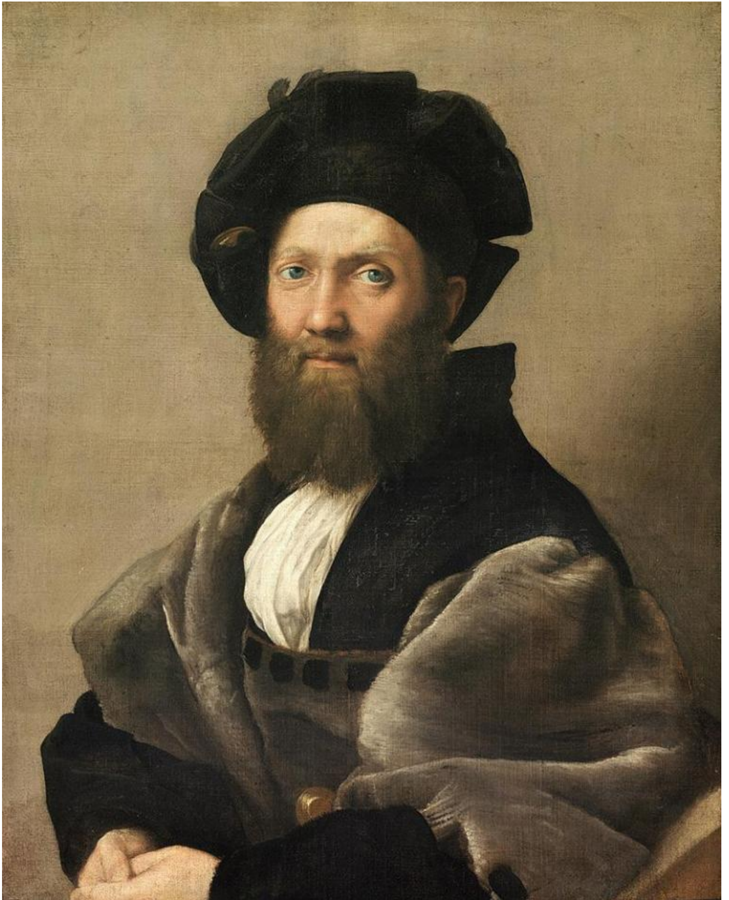
Raffaello, Ritratto di Baldassare Castiglione, 1513 circa, Parigi, Musée du Louvre.