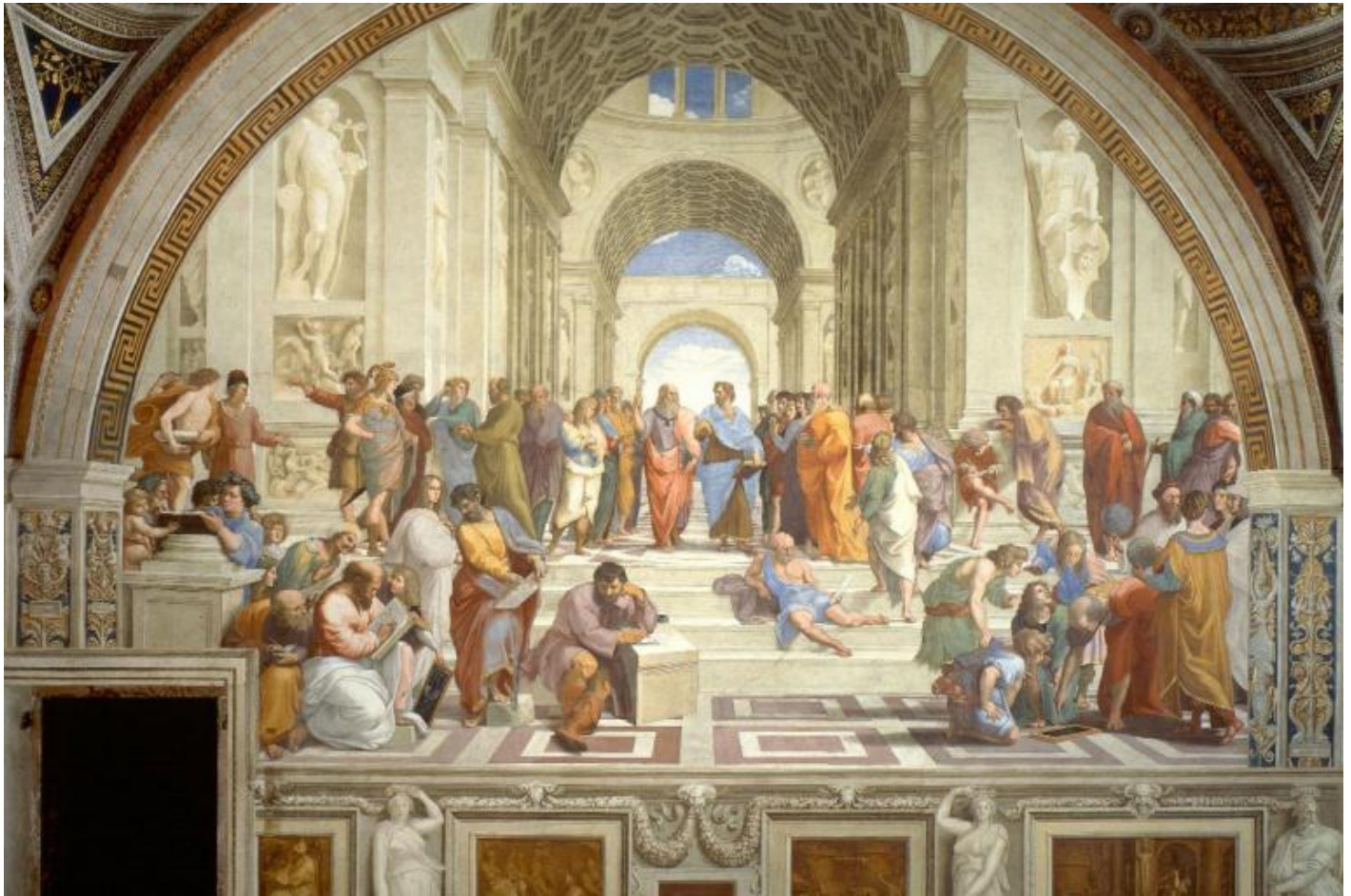
Raffaello, Scuola di Atene, 1509-1511, Stanza della Segnatura, Città del Vaticano, Musei Vaticani.