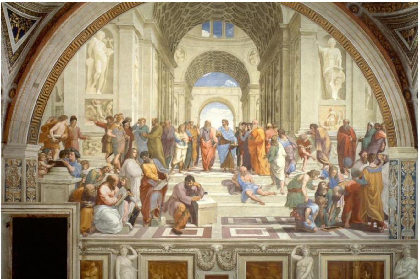
Raffaello, Scuola di Atene, 1509-1511, Stanza della Segnatura, Città del Vaticano, Musei Vaticani.