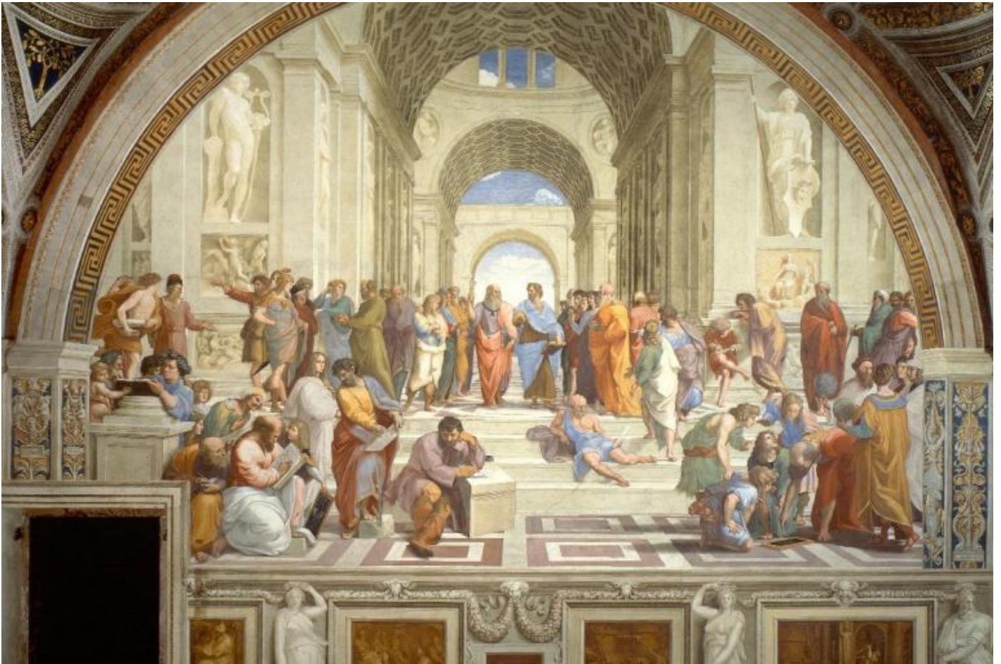
Raffaello, Scuola di Atene , 1509-1511, Stanza della Segnatura, Città del Vaticano, Musei Vaticani.