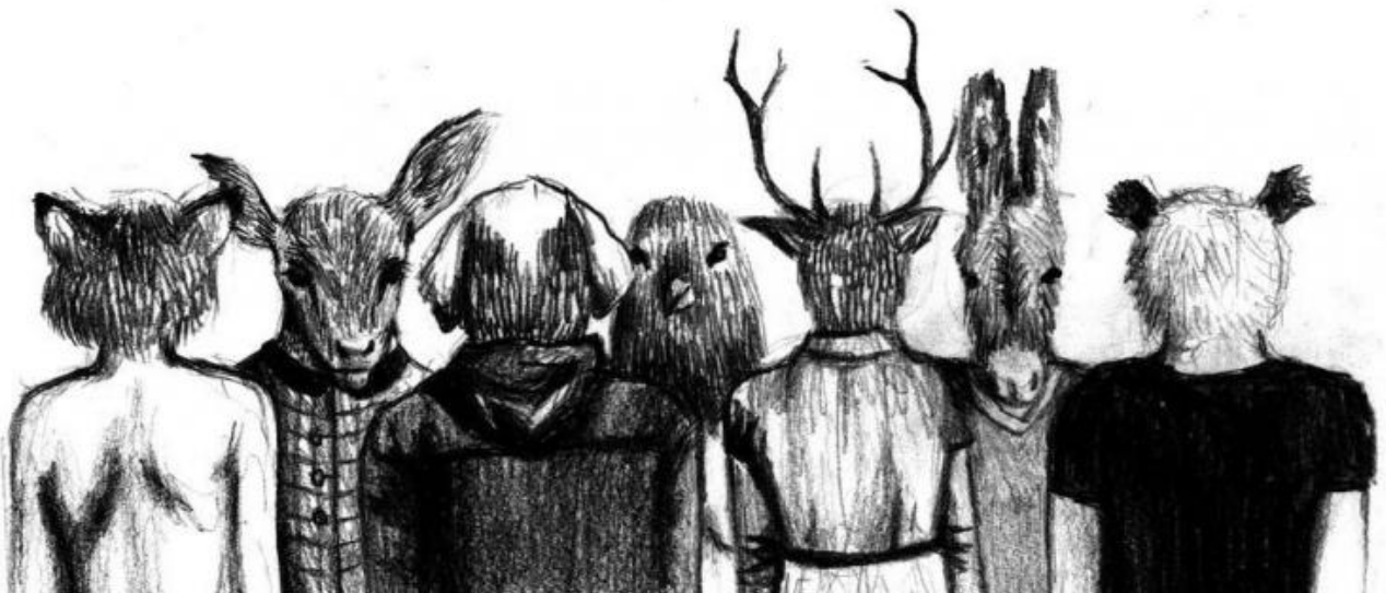
“Comunità”, di Rojna Bagheri.

« “El Comandante” ci saluta a medio alzato su Skype, dalla webcam piazzata ad arte sul boma del windsurf risoluzione strategica numero 6, tavola da 107 litri, vela da 6 metri, occhiali bianchi a specchio, “El Comandante” nel vento e fatevi fottere tutti quanti, voi e il movimento»