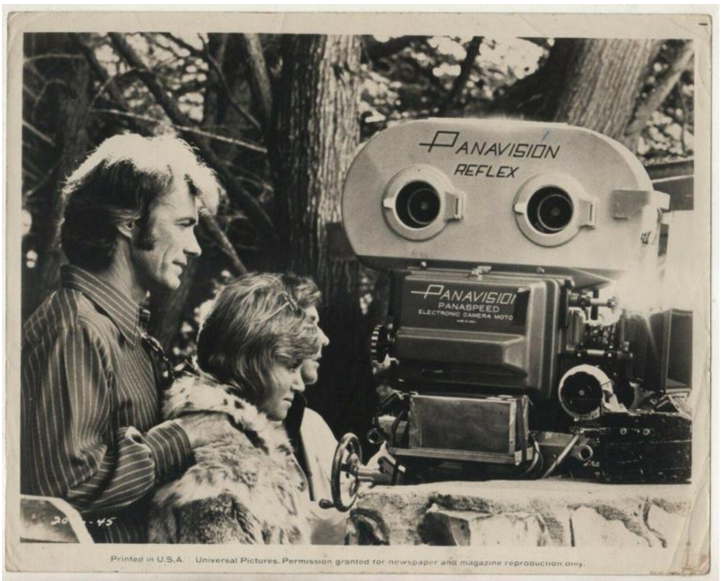
Eastwood regista esordiente sul set di "Brivido nella notte".