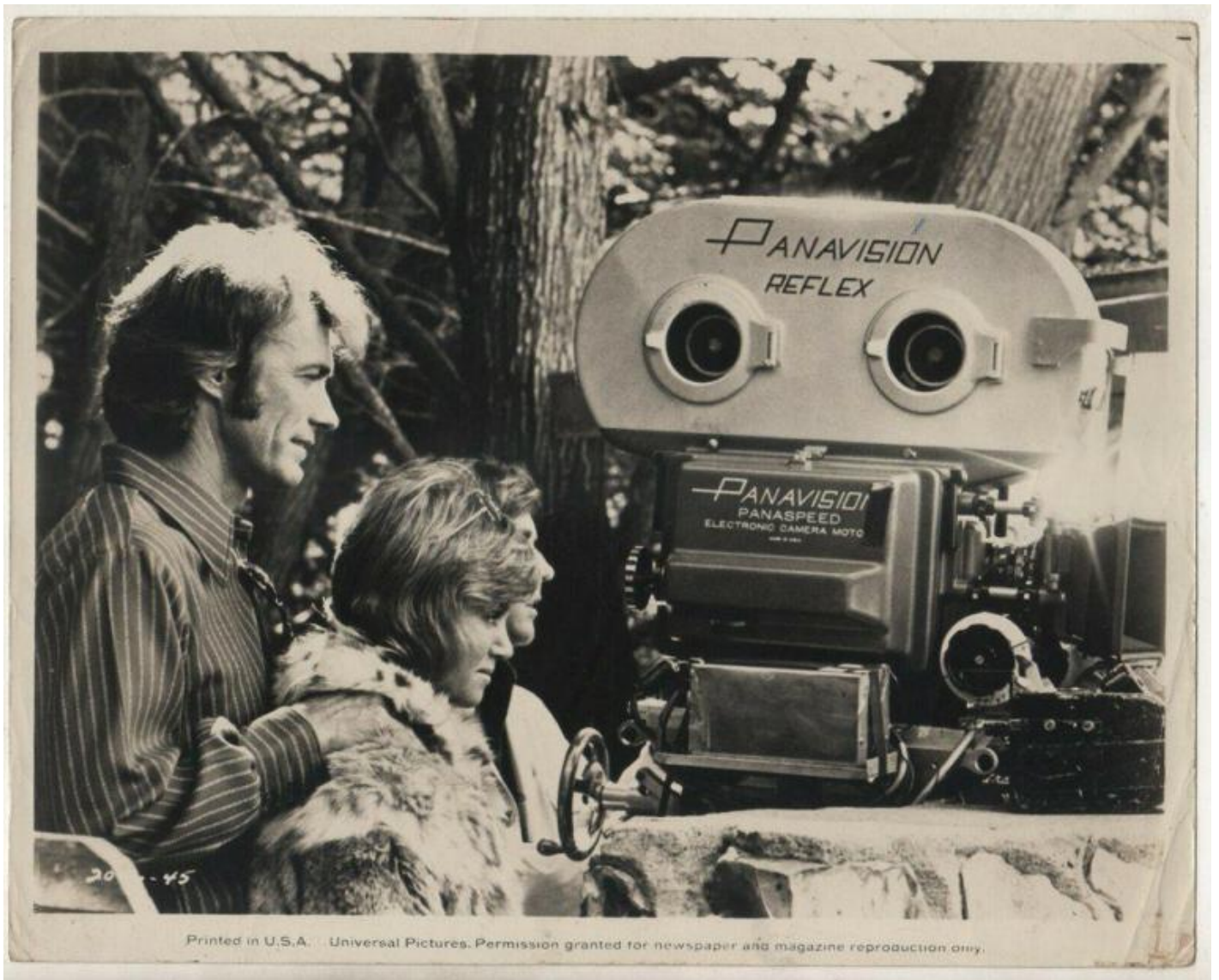
Eastwood regista esordiente sul set di "Brivido nella notte".