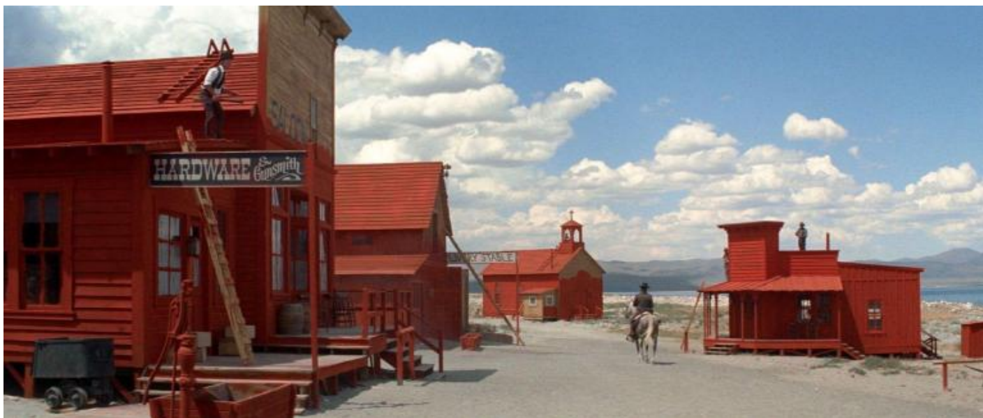
“Lo straniero senza nome”, 1973.

Vorrei aggiungere un’ultima cosa. Ancora oggi, che è considerato un grande autore di cinema, Eastwood rimane sottovalutato come attore. Nonostante abbia vinto cinque Oscar fra regie e produzioni (più un riconoscimento onorifico alla carriera), non è mai stato premiato come interprete. Si continua a ricordare la battuta di Sergio Leone (“Clint Eastwood ha due espressioni: col cappello e senza”) – e questo nonostante sia ben noto il grande affetto di Leone nei confronti di Eastwood. Vittorio De Sica, che di attori se ne intendeva, dopo averlo diretto in un episodio del film Le streghe (1966) aveva detto che la recitazione di Eastwood era essenziale come quella di Gary Cooper. Ad ogni modo credo che, con quel suo volto apparentemente monolitico, Eastwood rimanga l’unico interprete che possa essere affiancato al Randolph Scott dei film di Boetticher o, se vogliamo tornare addirittura alle origini, al William S. Hart dei film di Ince.