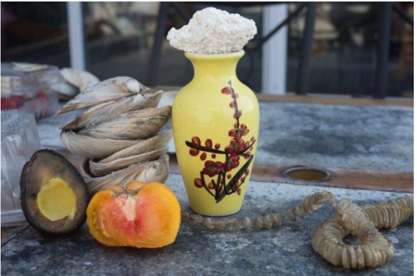
Wolfgang Tillmans, Still life, unlikely match, 2017.

Per quanto il ragionamento intellettuale sia sempre una risorsa, per rispondere seriamente a questa domanda bisognerebbe disporre di un osservatorio sufficientemente ampio e attendibile di cui io sinceramente non dispongo. Bisogna contestualizzare per non generalizzare. Di chi stiamo parlando? C'è chi nel lockdown si è ritrovato solo e allontanato giocoforza dai suoi affetti primari, e chi, esattamente al contrario, ha potuto sperimentare con i medesimi (pur con gli esiti più disparati) una lunga e sospesa intimità mai conosciuta prima. Certamente anch'io, come tutti, come è stato già ben espresso da coloro che mi hanno preceduto in queste risposte, ho avvertito il sospetto nell'incontro con altri nei rari spostamenti cittadini. Aggiungerei inoltre, paradossalmente, pure un certo rispetto, una minore aggressività e un benefico rallentamento, anche se certo dettati dalla paura che, come il tanto vituperato senso di colpa, ci ha rivelati più solidali e sensibili. La rete dei rapporti sociali è sicuramente per venuta meno, per quanto il coatto e accelerato corso di acculturazione informatica al quale siamo stati costretti ci abbia consentito di provare a mantenere vive le relazioni. Abbiamo praticato nuove modalità comunicative private e professionali che aprono scenari interessanti rispetto al futuro. Anche se, al netto dell'esperienza, con i nostri device abbiamo scoperto che si può fare tutto, ma che ci manca tutto.