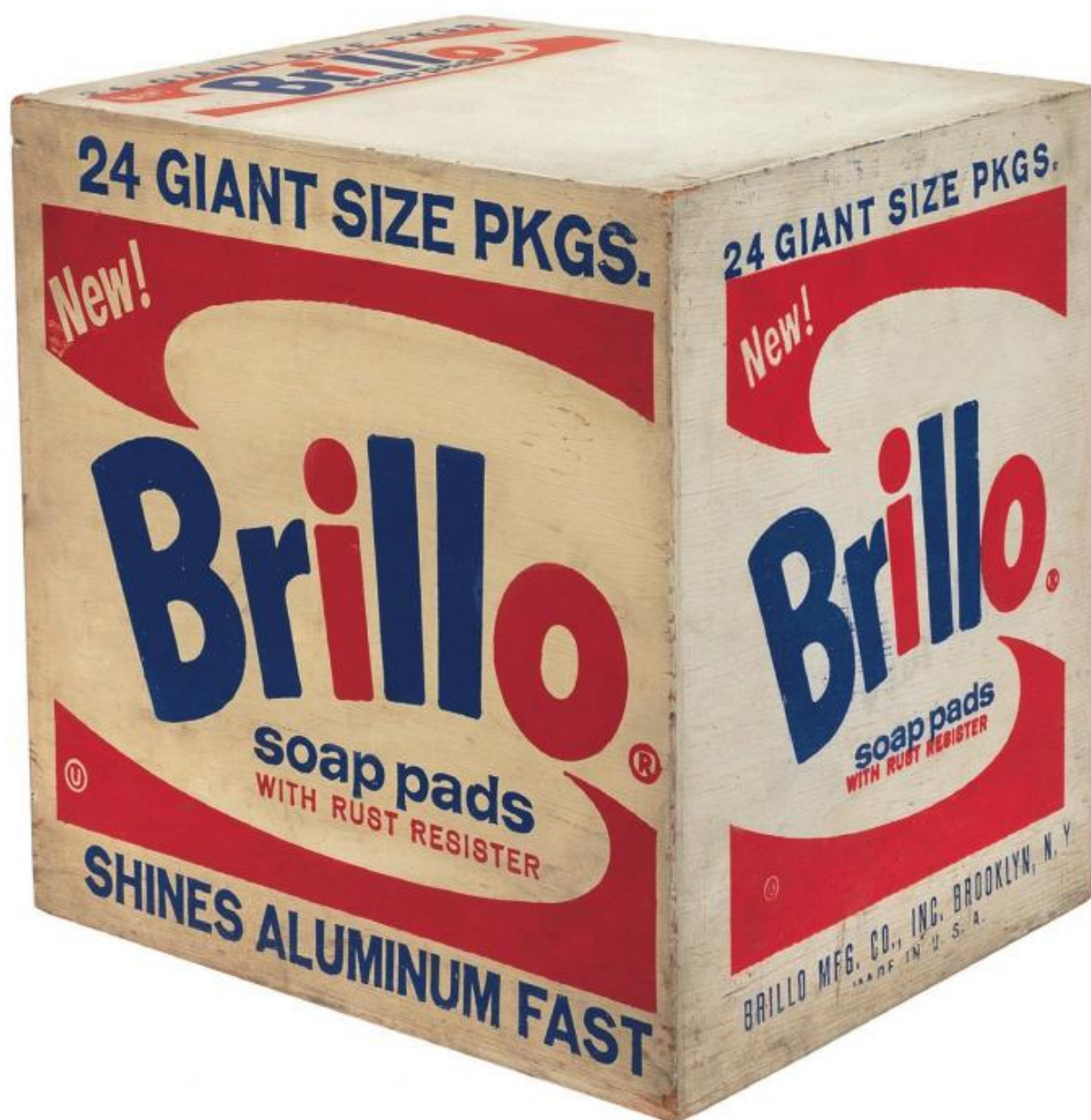
Andy Warhol, Brillo Box, 1964 acrilico su legno, 33 Å~ 40,7 Å~ 9,2 cm ? Andy Warhol Foundation, SIAE 2020 Collezione privata.