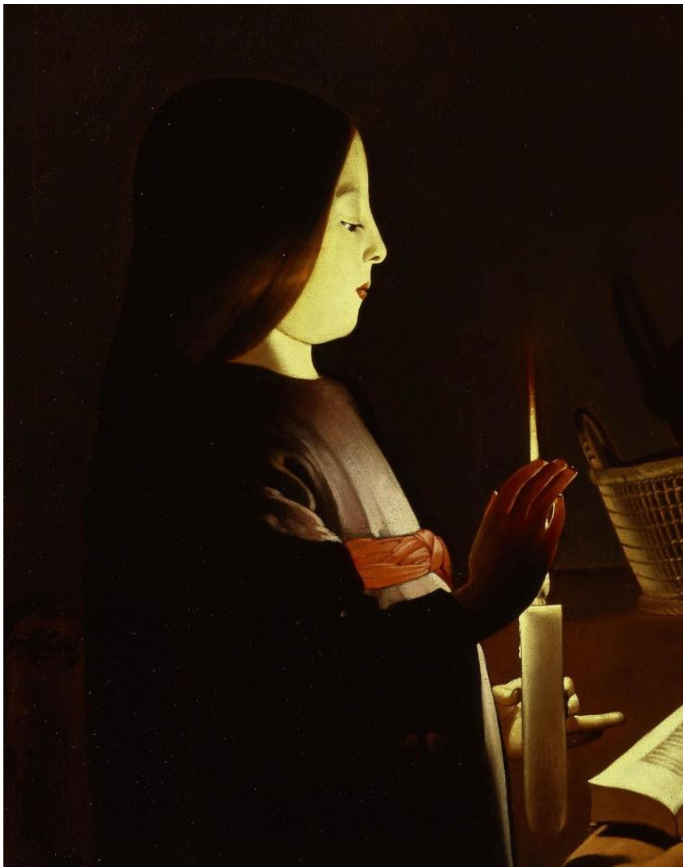
Georges De La Tour, L'education de la vierge, The Frick collection, dettaglio.