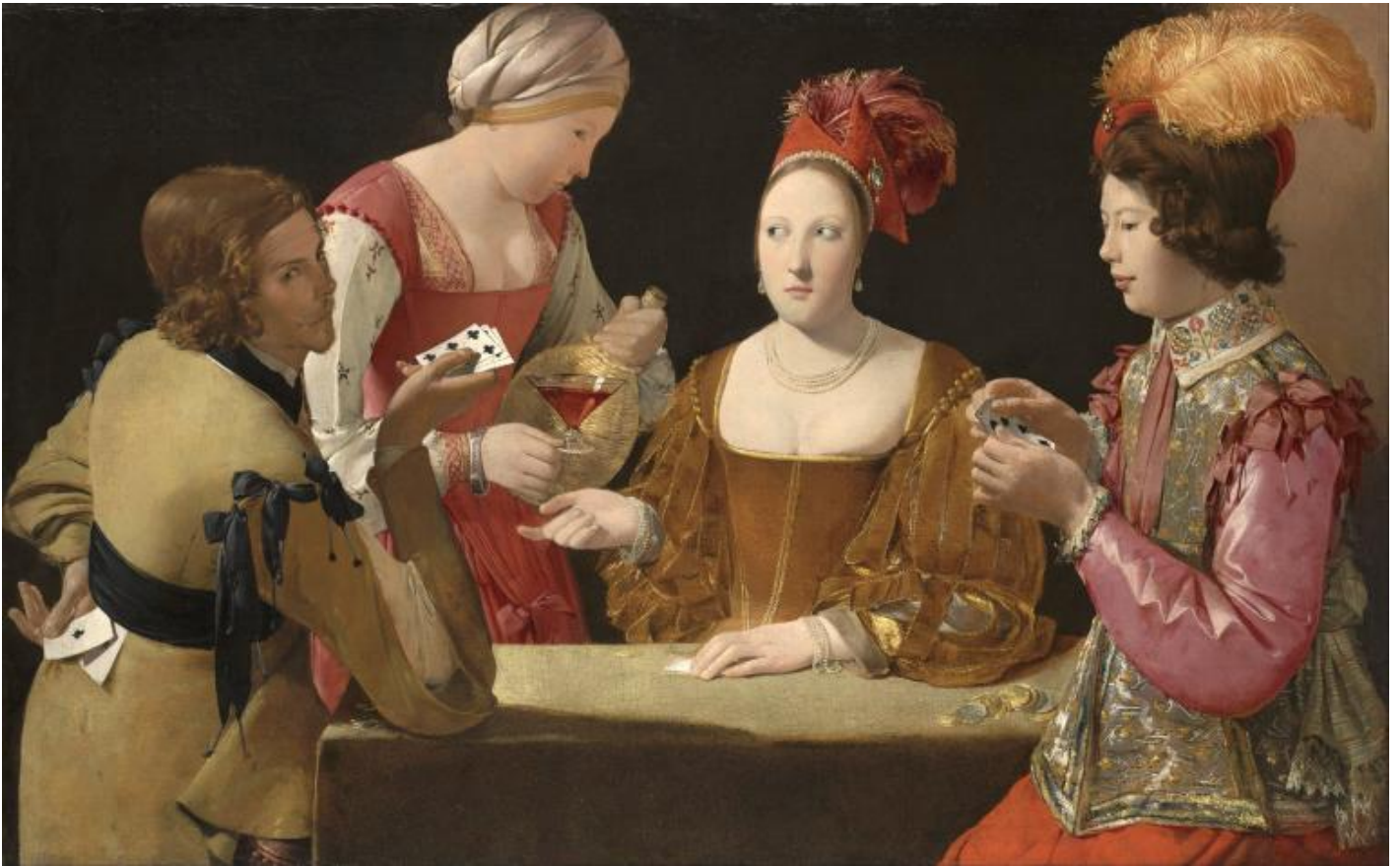
Georges De La Tour, The cheat with the ace of clubs.