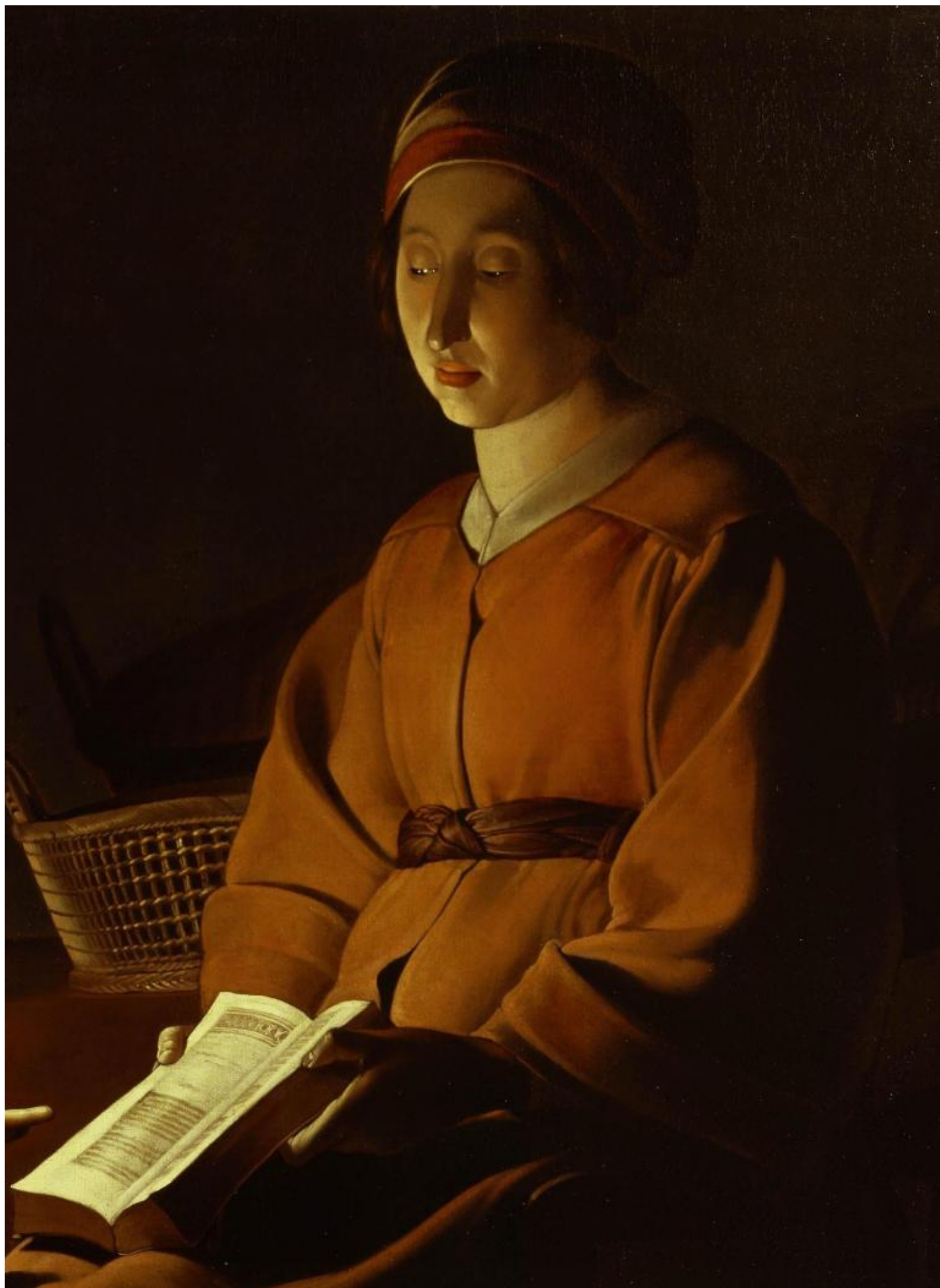
Georges De La Tour, L'education de la vierge, The Frick collection, dettaglio.