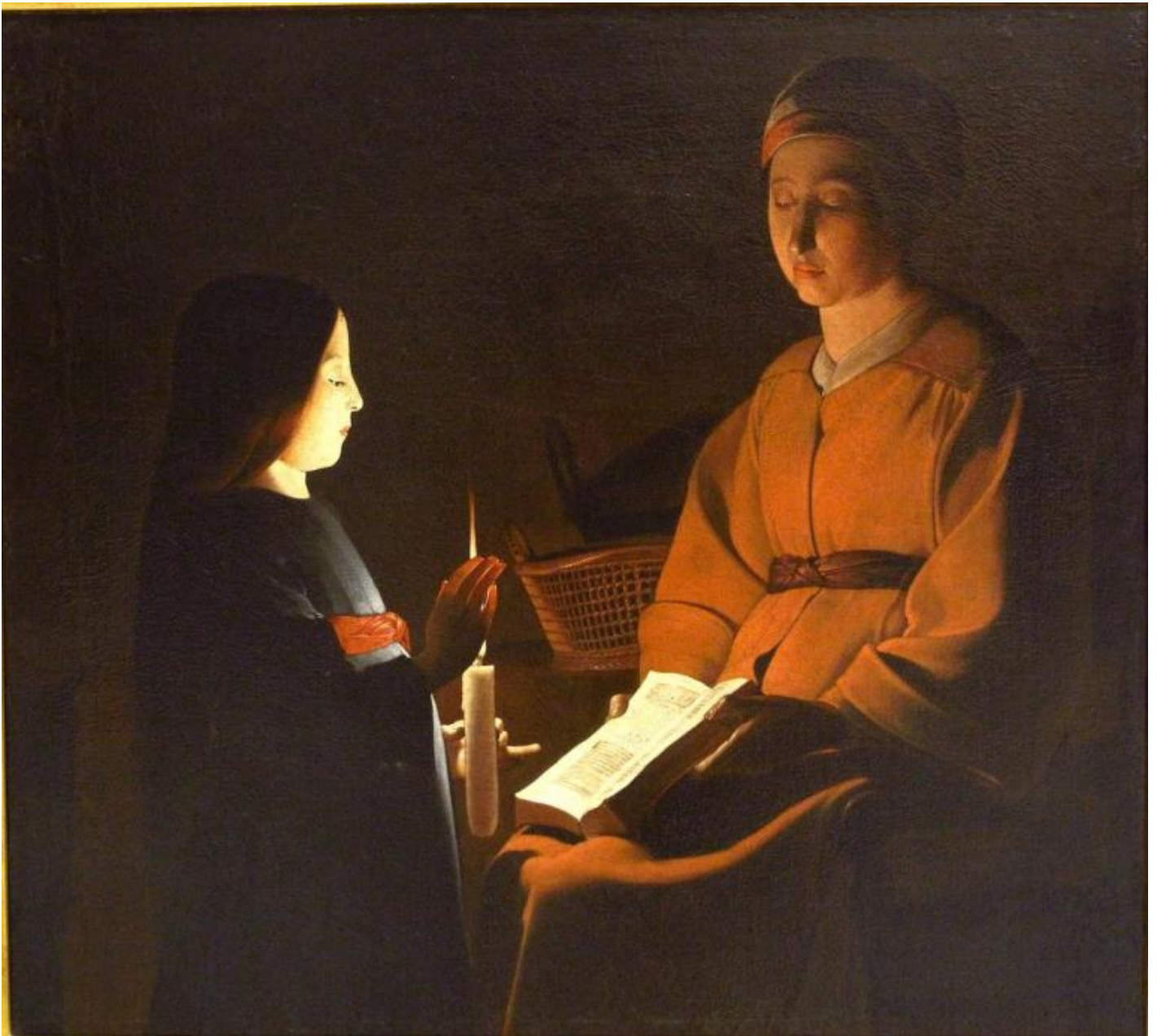
Georges De La Tour, L'education de la vierge, Mus e du Louvre.

Tra tutte quelle presenti in mostra per 2 , le opere che mi hanno suscitato le emozioni pi  intense sono stati un San Sebastiano curato da Irene , di cui ho gi  parlato qui , e una tela con una donna e una bambina che regge una candela: una scena semplice, spoglia, tutta concentrata sui due personaggi e i pochi oggetti, la candela, una cesta, un libro, i panni morbidi ma dalla linee semplici degli abiti, le due fasce che li ornano: una scena chiara e insieme di difficile interpretazione, al di l  di quella letterale, ma di successo, a giudicare dalle numerose versioni in nessuna delle quali   rintracciabile lâ  originale (il che nulla toglie all  alta qualit  di alcune, come quella del Louvre, e di gran parte di quella in mostra, proveniente dalla Frick Collection di New York, dove viene presentata, ovviamente, come del tutto autografa).