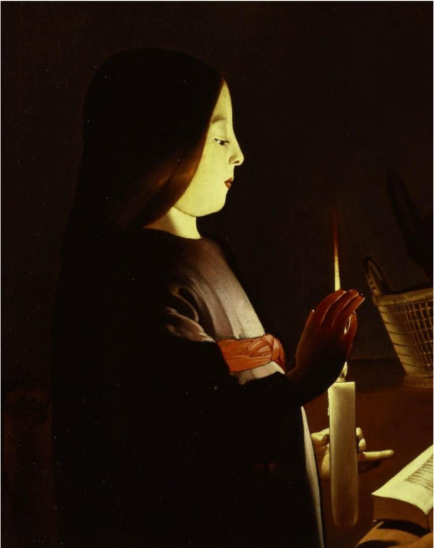
Georges De La Tour, L'education de la vierge, The Frick collection, dettaglio.