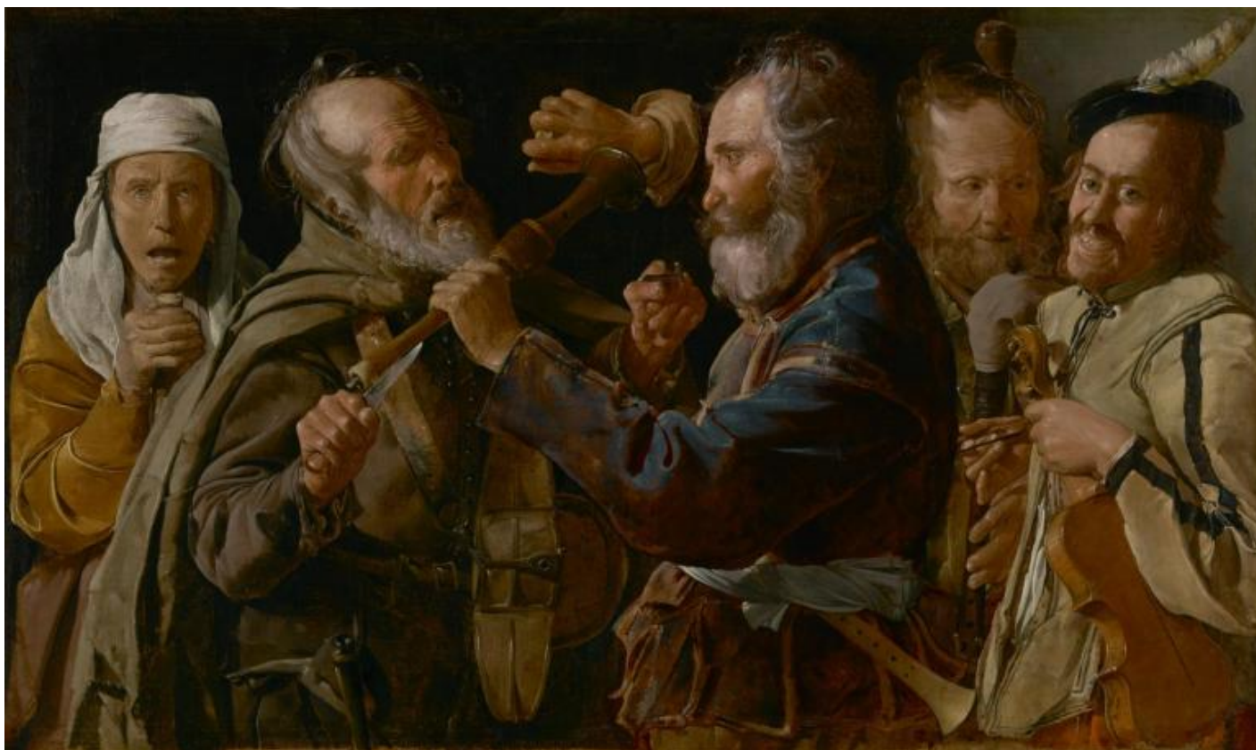
Georges De La Tour, La rissa tra musici mendicanti, 1625-1630, 857x141, Paul Getty museum, LA.