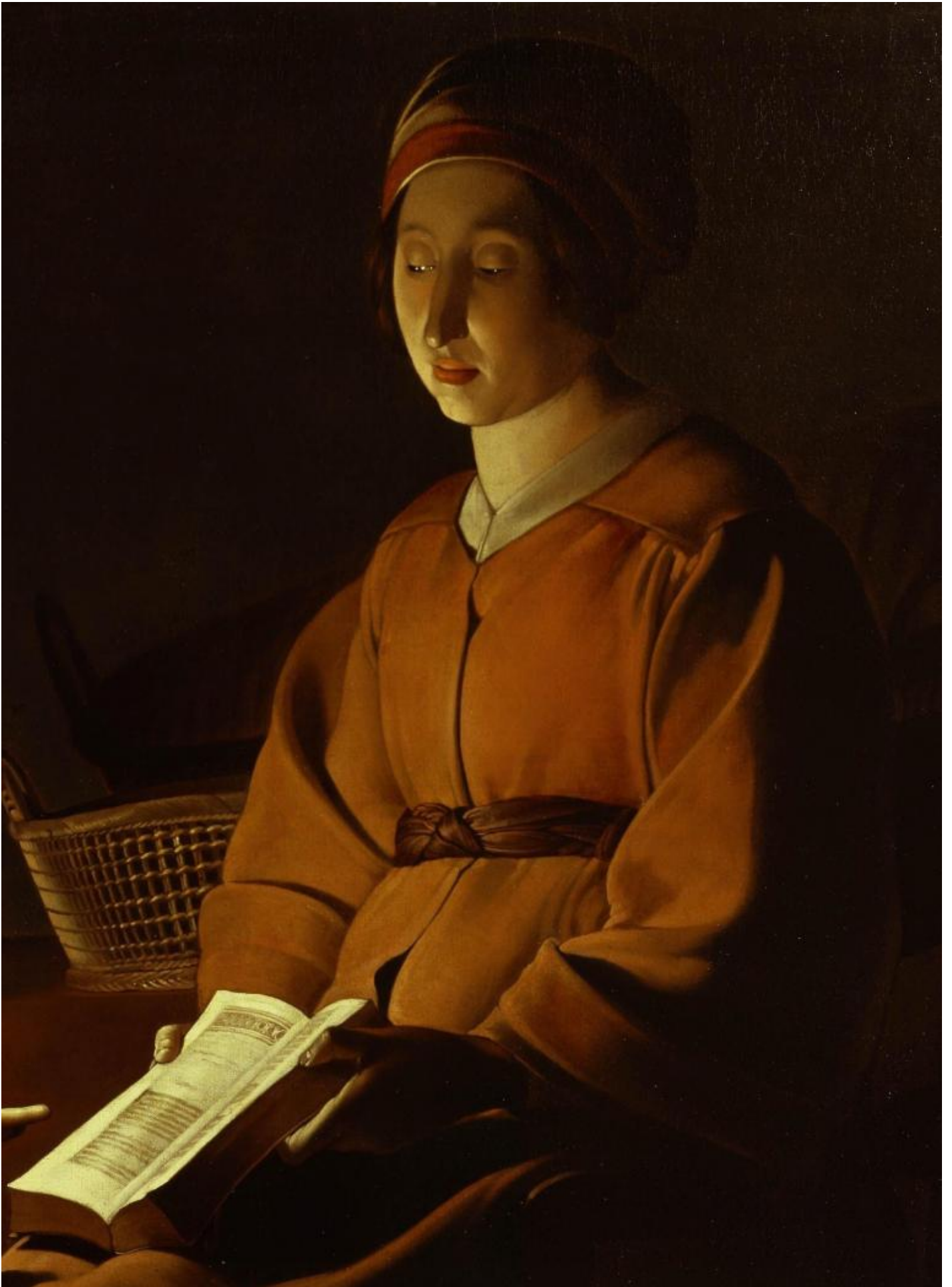
Georges De La Tour, L'education de la vierge, The Frick collection, dettaglio.