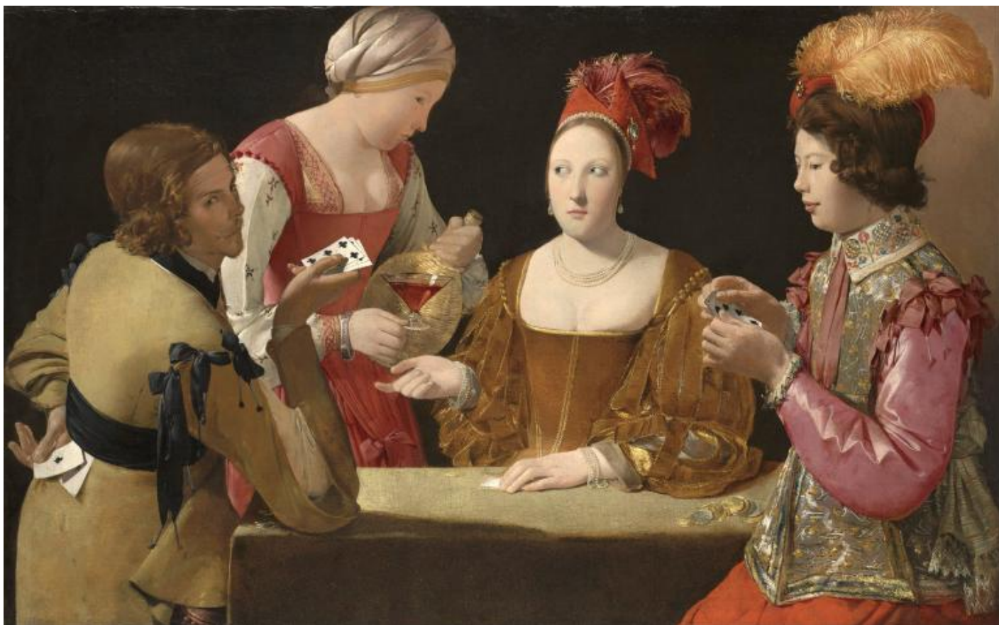
Georges De La Tour, The cheat with the ace of clubs, Google art project.