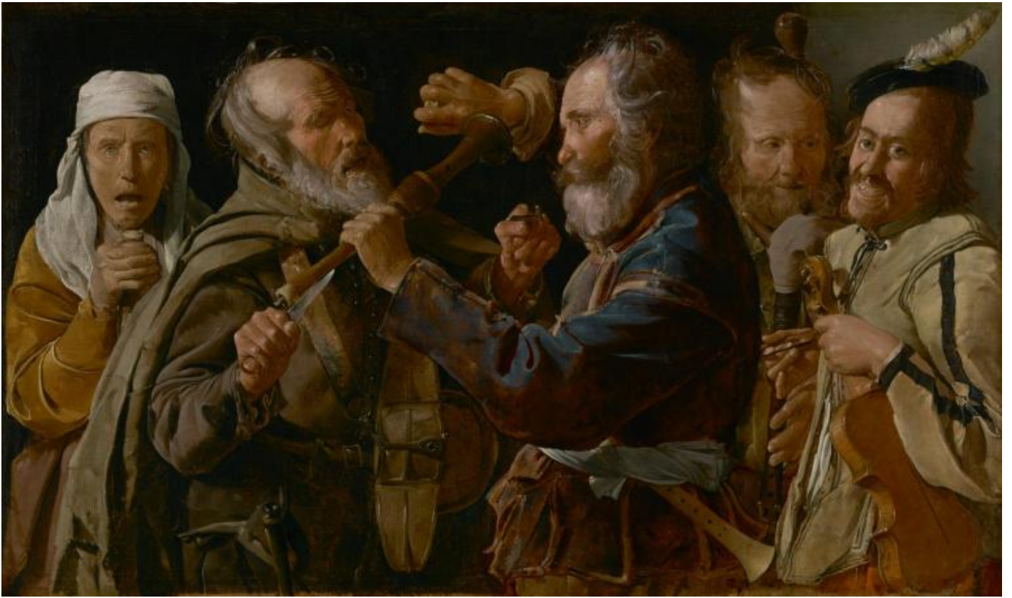
Georges De La Tour, La rissa tra musici mendicanti, 1625-1630, 857x141, Paul Getty museum, LA.