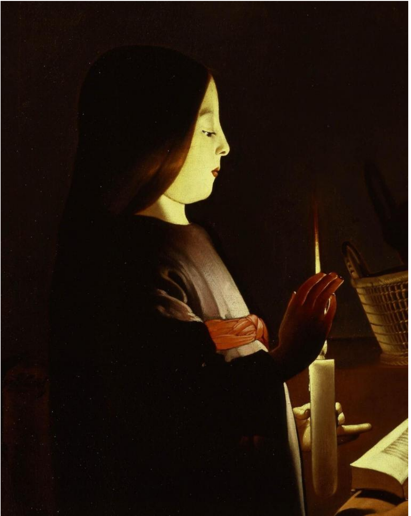
Georges De La Tour, L'education de la vierge, The Frick collection, dettaglio.