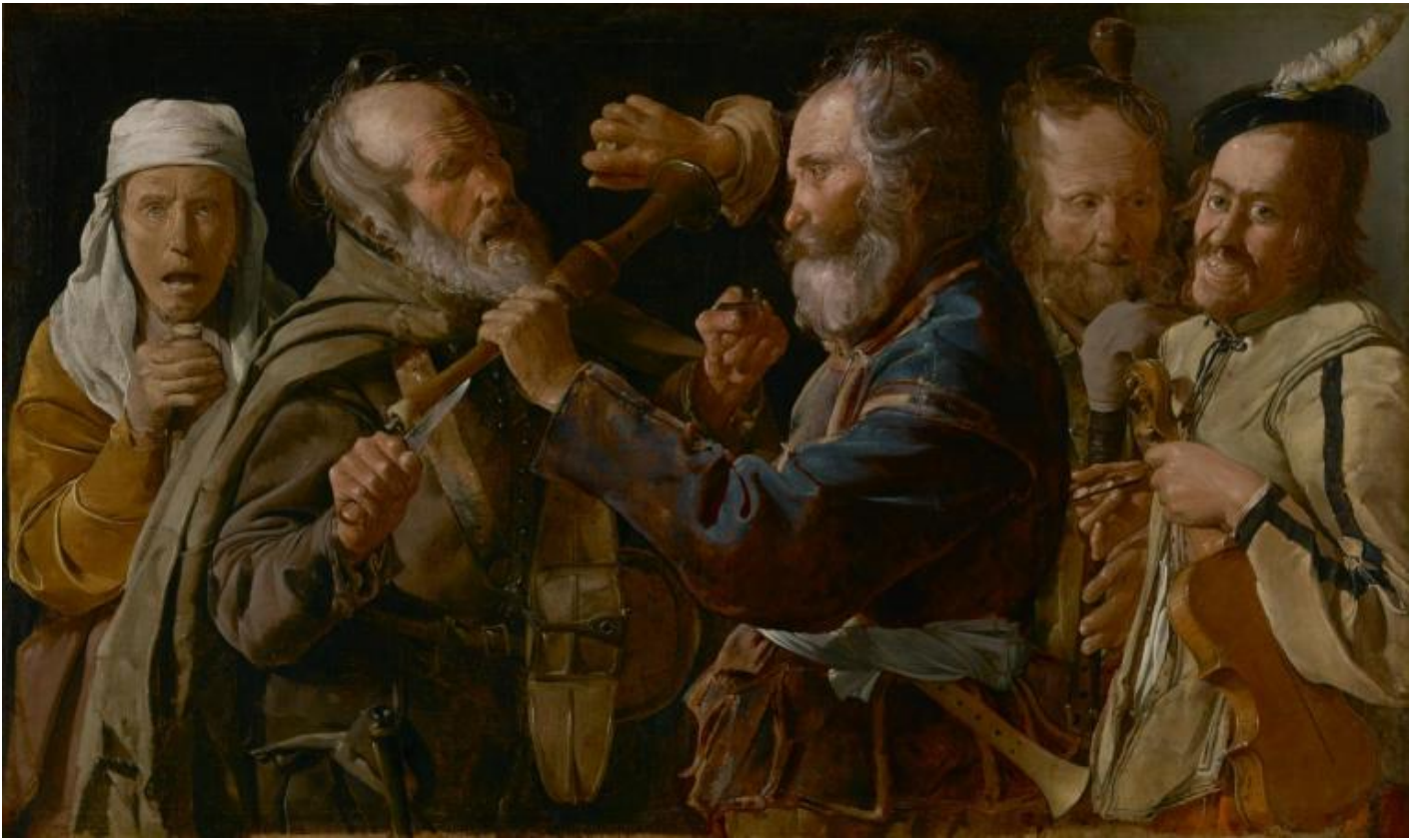
Georges De La Tour, La rissa tra musici mendicanti, 1625-1630, 857x141, Paul Getty museum, LA.