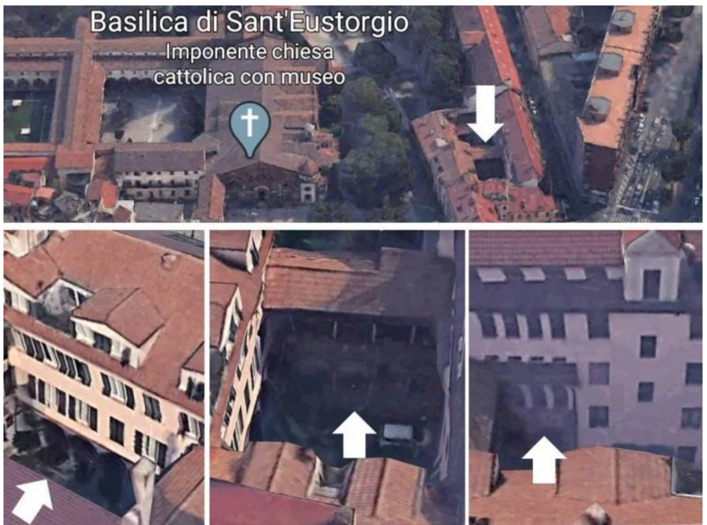
Milano, Piazza sant'Eustorgio, foto aeree (da Google Earth) in sequenza di avvicinamento all'edificio che ospita i due portici quattrocenteschi, unici lati superstiti del chiostro del monastero annesso

Come urbanista e socia dell'Istituto Nazionale di Urbanistica (INU), ha anche contribuito all'estensione del Piano Regolatore della sua città e a quella di diversi piani urbanistici in Italia e all'estero. Nel 1945 è stata tra i fondatori del Movimento di Studi per l'Architettura (MSA), nato nel capoluogo lombardo, con il proposito, tra gli altri, di praticare e diffondere le idee del Razionalismo.