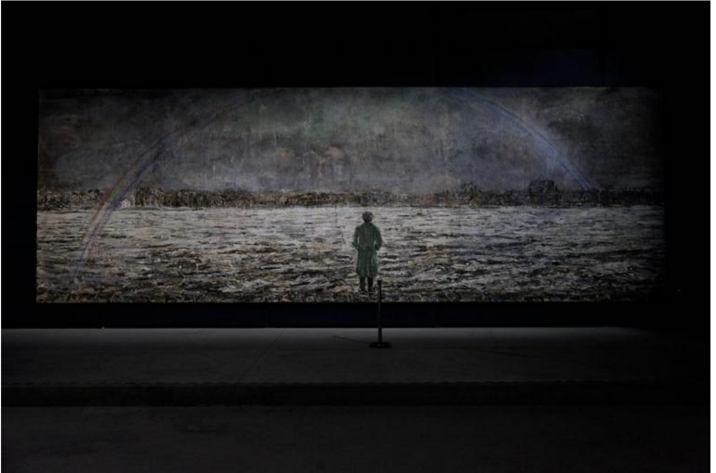
Die deutsche heilslinie, Anselm Kiefer, Hangar Bicocca.

alla luce: e non a caso nella religione ebraico-cristiana il portatore e signore del buio Ã lâangelo pi luminoso caduto, Lucifero. Colui che porta la luce; ma non la Ã. Che voleva esserla e ne Ã stato escluso. Altrimenti dovremmo ammettere (ipostatizzare) un male che ha potuto essere prima del bene, o accanto, assieme, come diceva il profeta Mani la cui immensa opera non a caso Ã stata del tutto cancellata (ricacciata nel buio), e pertanto ad esso almeno pari, se non superiore. Ci che Ã evidentemente impossibile. Lo vedono tutti. Provare a pensare il buio da solo Ã uno sforzo immane quanto vano. Sarebbe pensare lâimpensabile, dicevo. Alcuni ritengono che per questo Ã uno sforzo da rigettare, dannoso pi ancora che inutile; per altri invece lâunico pensare che valga davvero la pena Ã proprio quello che con lâimpensabile si misura. Che si immerge nel buio e vi resta senza rifuggirlo. Anche se questo corrisponde, in pi di un senso, al morire. (Pensare sarebbe dunque stare nella morte senza essere (ancora) morti?)