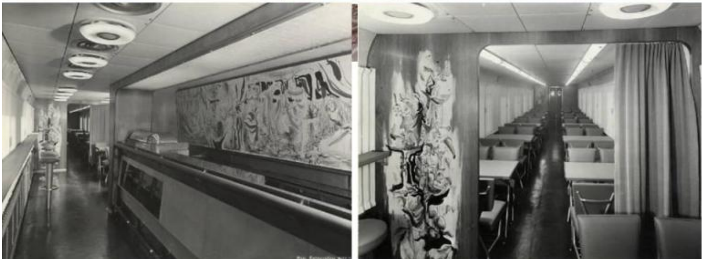
In alto: copertina del libro di Giulio Verne, Dalla Terra alla Luna, Edito da Sonzogno; pubblicità francese dell'ETR 330, detto Settebello; veduta del treno al suo ingresso alla Stazione Centrale di Milano. Sotto: il bar e la sala ristorante (Archivio Storico Breda).

Nel Settebello il tradizionale marrone che aveva caratterizzato le livree dei treni FS nei decenni precedenti venne sostituito da due colori raffinati e innovativi, un grigio nebbia di fondo con due fasce verde magnolia sulle fiancate, una all'altezza dei finestrini e l'altra sull'estremità inferiore. Ma quel treno si distingueva soprattutto per il frontale bombato, simile a quello dei Jet, specialmente americani, lungo il cui profilo correva un vetro panoramico. Al suo interno era alloggiato un belvedere con un salottino di prima classe dotato di undici posti a sedere a cui i viaggiatori potevano accedere a turno. Sopra di esso, in posizione leggermente arretrata, si trovava la cabina di guida che, sebbene avesse finestrini più piccoli del normale, offriva un'ottima visuale ai macchinisti, proprio grazie alla sua altitudine.