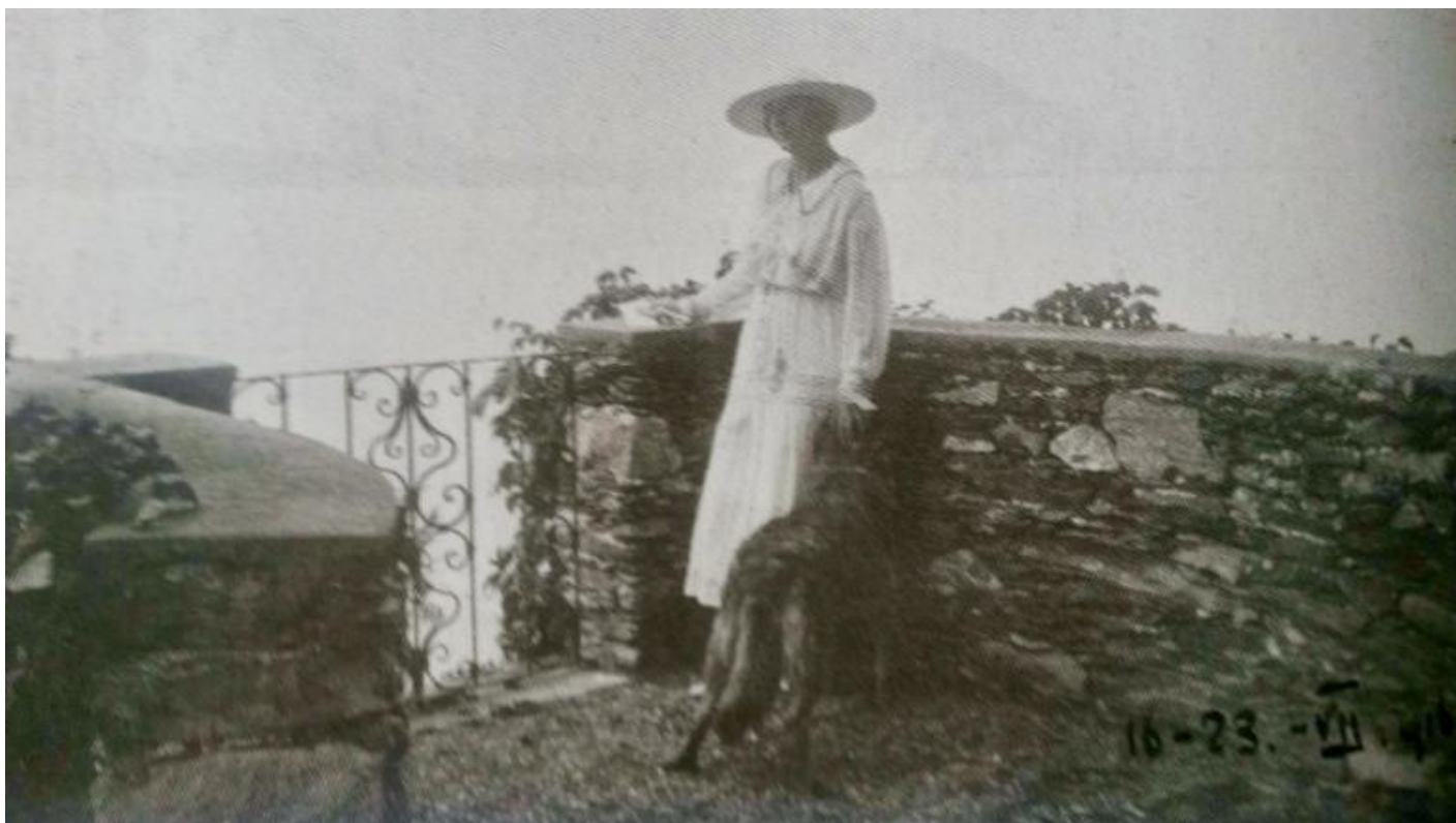
La principessa Vittoria sull'Isolino, in una foto di Boccioni (Fondazione Camillo Caetani).