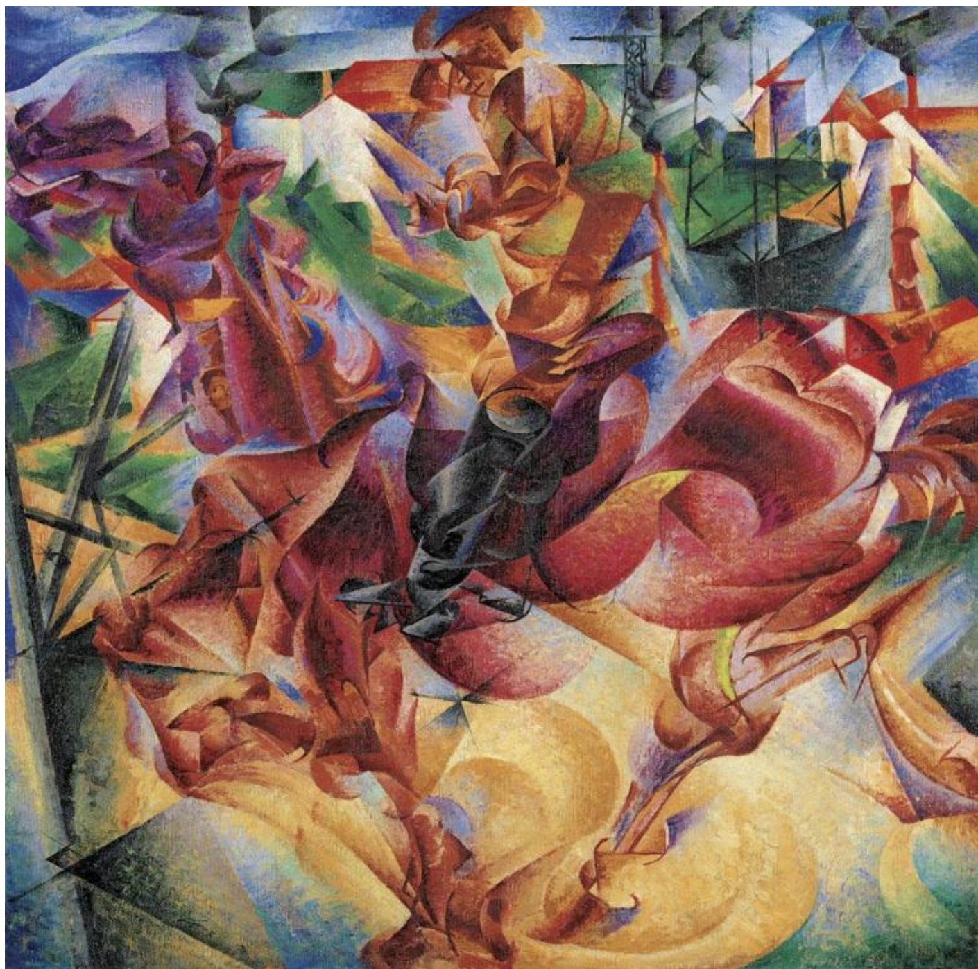
Boccioni, Elasticità (1912).