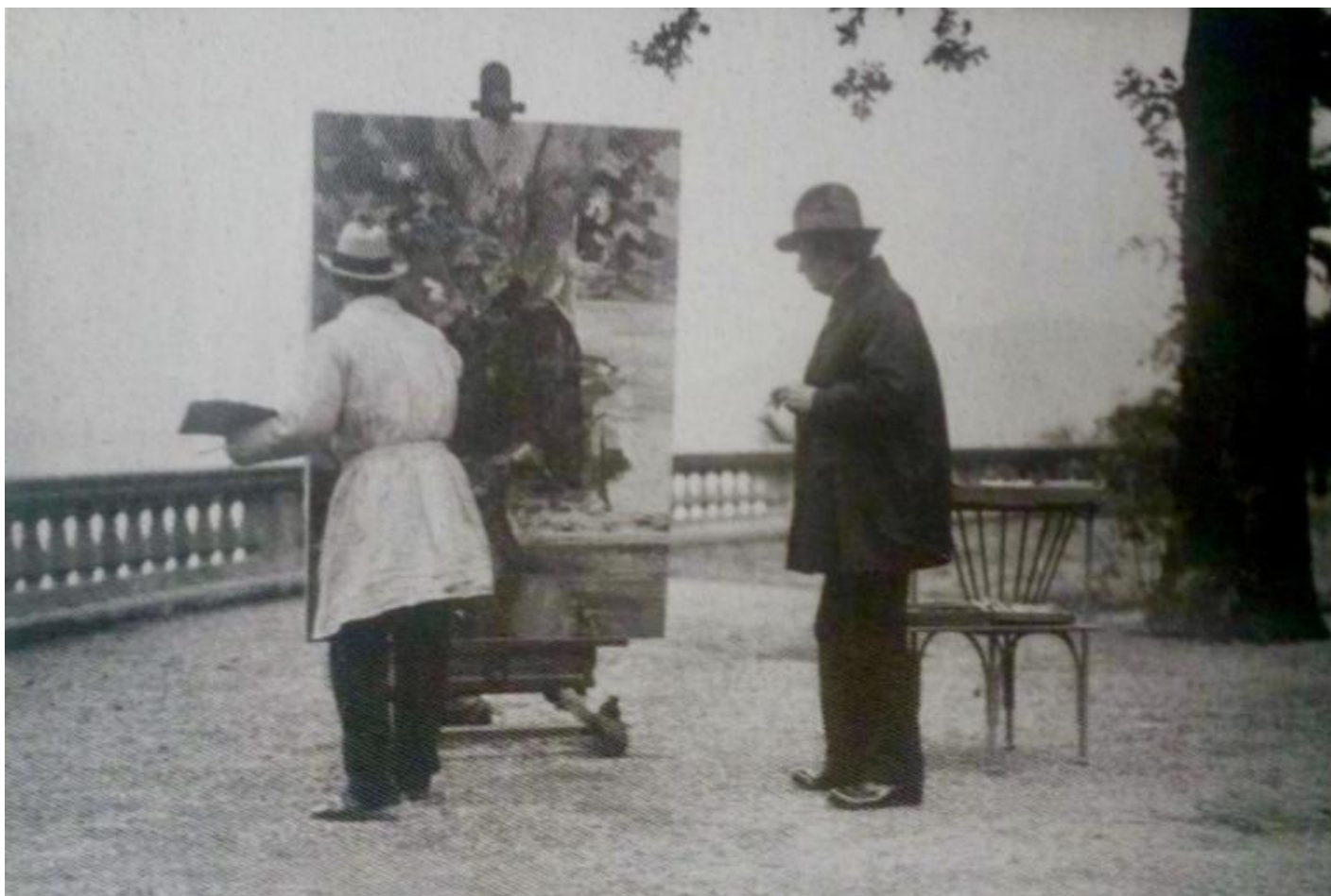
Boccioni mentre dipinge il ritratto di Busoni nel parco di villa Casanova (Museo del paesaggio di Verbania Pallanza).

Boccioni non trova affatto passatista né l'Isolino né la sua principessa, anzi ne rimane subito affascinato, tanto che le visite divengono quasi quotidiane. «Vorrebbe dipingerci e io l'incoraggio, domandandomi cosa diavolo verrà fuori!», scrive Vittoria al marito. Nel suo osservatorio sulle trincee sopra Cortina d'Ampezzo, Leone non deve dare molto peso alla nuova conoscenza della moglie: è abituato ai resoconti puntuali degli incontri con uomini famosi attirati dal fascino della principessa: molti si erano invaghiti di lei, dal re d'Inghilterra, Edoardo VII, all'Aga Khan.