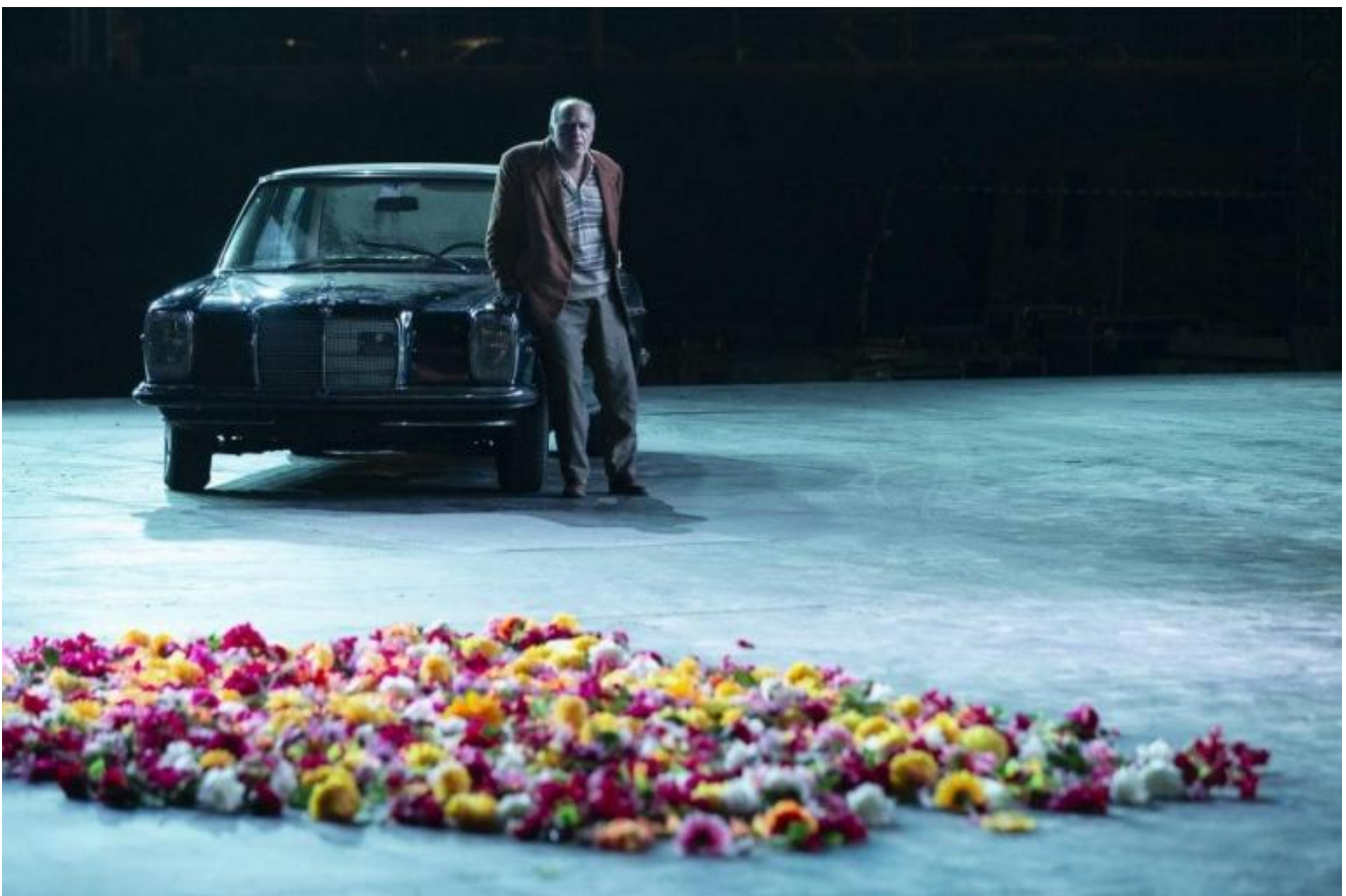
Rigoletto al Circo Massimo

Anche visto in Tv, il trionfo del distanziamento è apparso incontestabile. Non in platea, dove anzi qualche assembramento (senza mascherina) si è notato, ma proprio per la lettura del regista, Damiano Michieletto. Il quale non ha smentito la sua linea interpretativa generale (non risulta che abbia mai ambientato un'opera nell'epoca indicata dal libretto) e ha collocato la crudele storia di Victor Hugo, musicata da Verdi su libretto di Francesco Maria Piave, non nella Mantova rinascimentale ma in qualche campo nomadi del Nordest, verso gli anni '80 del secolo scorso. Niente di così dissacrante e neppure originale (proprio una quarantina di anni fa Jonathan Miller aveva realizzato un allestimento del capolavoro verdiano nel mondo della mala italo-americana): Rigoletto è un capolavoro di concentrazione drammaturgico-musicale che funziona sempre, anche dentro e fuori da qualche vecchia automobile e sotto i seggiolini di un "calcinculo", come si chiama in dialetto veneto la giostra che campeggiava sulla sterminata scena al Circo Massimo.