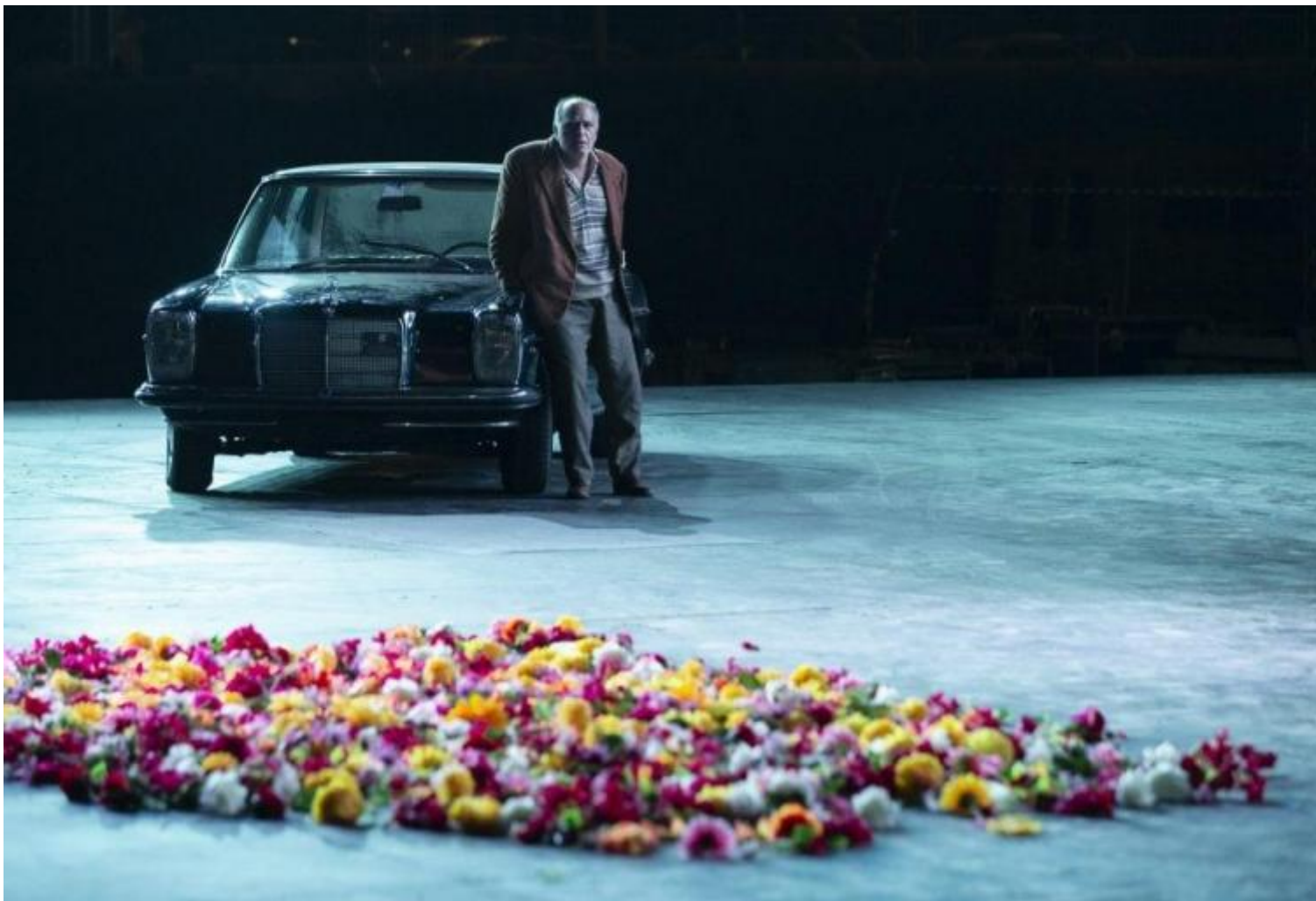
Rigoletto al Circo Massimo

Anche visto in Tv, il trionfo del distanziamento è apparso incontestabile. Non in platea, dove anzi qualche assembramento (senza mascherina) si è notato, ma proprio per la lettura del regista, Damiano Michieletto. Il quale non ha smentito la sua linea interpretativa generale (non risulta che abbia mai ambientato un'opera nell'epoca indicata dal libretto) e ha collocato la crudele storia di Victor Hugo, musicata da Verdi su libretto di Francesco Maria Piave, non nella Mantova rinascimentale ma in qualche campo nomadi del Nordest, verso gli anni '80 del secolo scorso. Niente di dissacrante e neppure originale (proprio una quarantina di anni fa Jonathan Miller aveva realizzato un allestimento del capolavoro verdiano nel mondo della mala italo-americana): Rigoletto è un capolavoro di concentrazione drammaturgico-musicale che funziona sempre, anche dentro e fuori da qualche vecchia automobile e sotto i seggiolini di un calcincolo, come si chiama in dialetto veneto la giostra che campeggiava sulla sterminata scena al Circo Massimo.