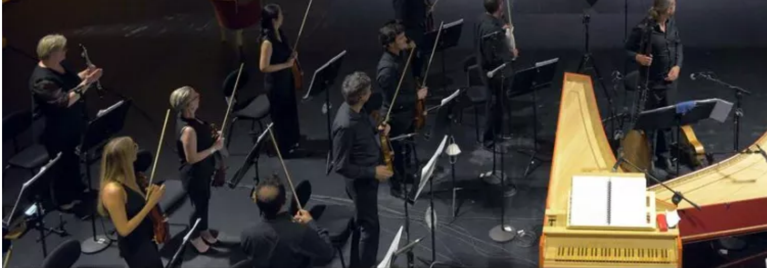
Fondazione Teatro La Fenice Ottone in villa Orchestra del Teatro La Fenice Direttore Diego Fasolis Regia Giovanni Di Cicco Scene Massimo Checchetto Costumi Carlos Tieppo Luci Fabio Baretin